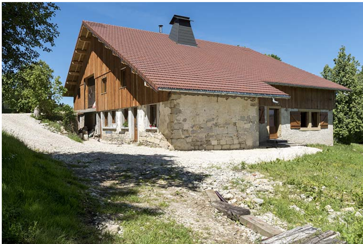
Façades antérieure et latérale droite.