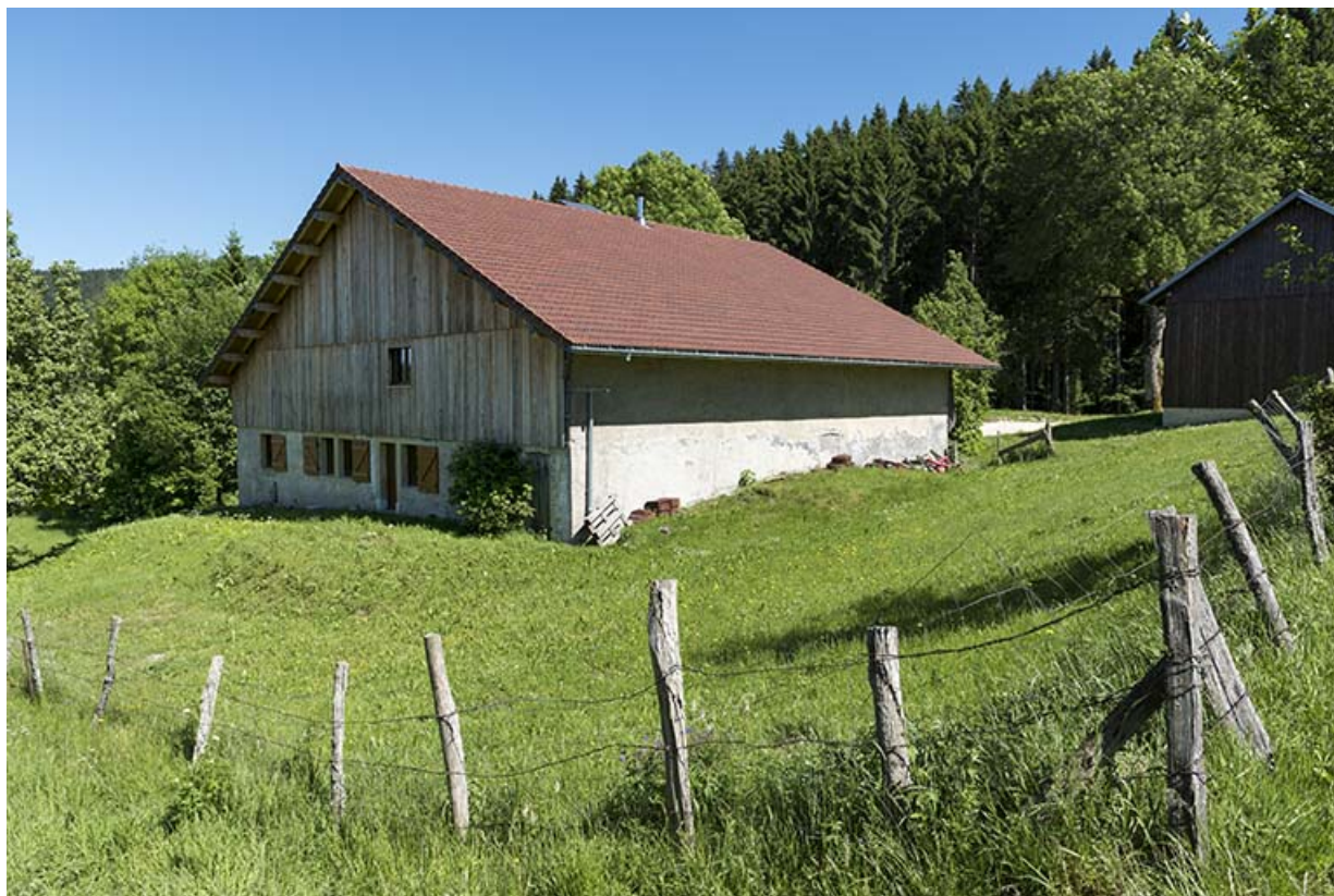
Façades postérieure et latérale gauche.