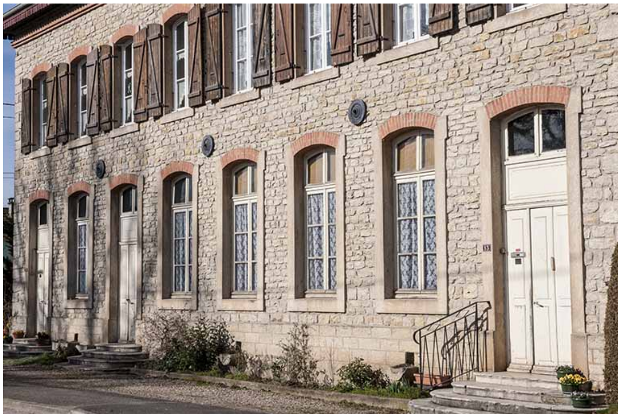
Bâtiment de l'école et du magasin coopératif. Détail de la façade.

25, Geneuille, 13, 15 route des Papetiers