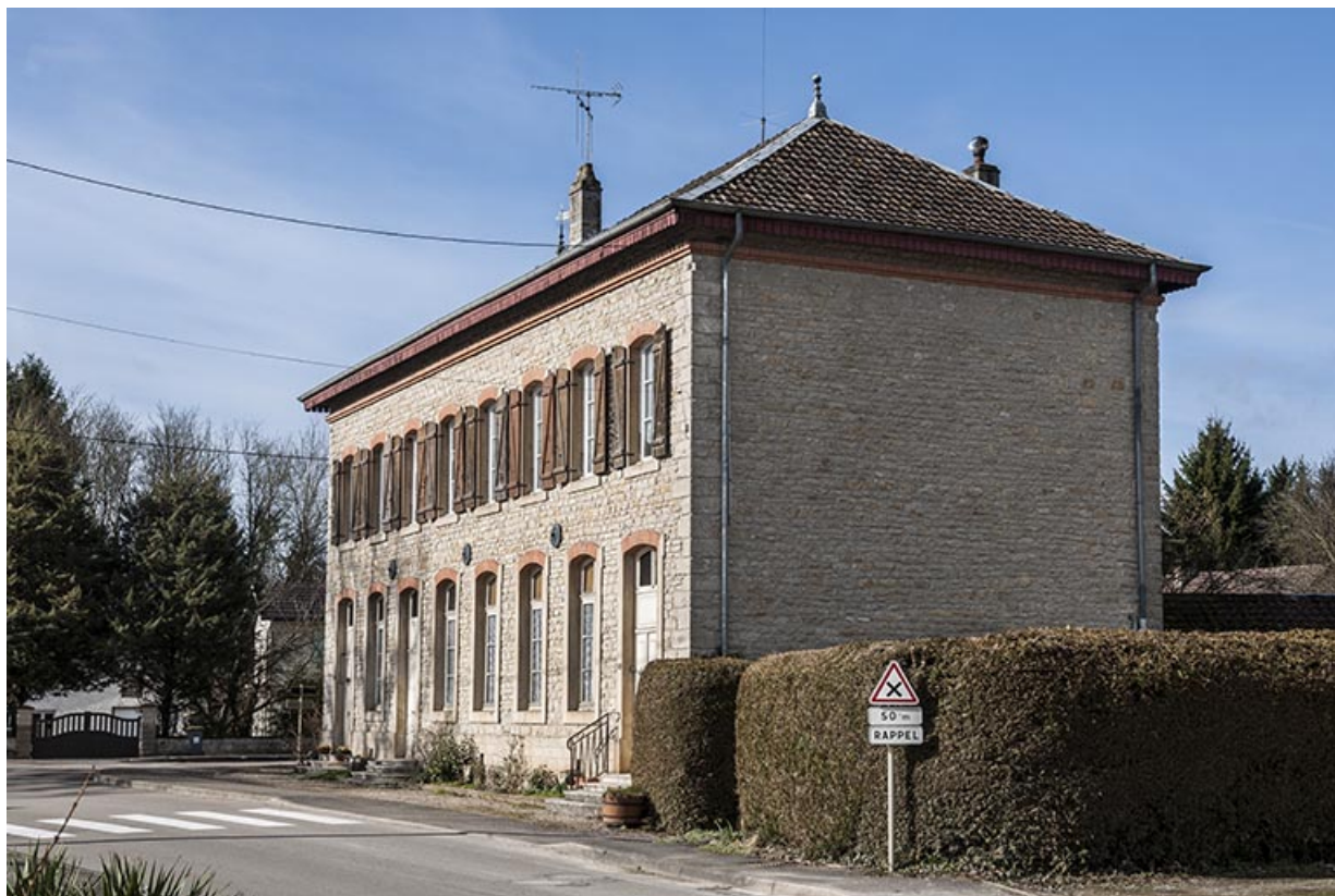
Bâtiment de l'école et du magasin coopératif vu de trois quarts droite. 25, Geneuille, 13, 15 route des Papetiers