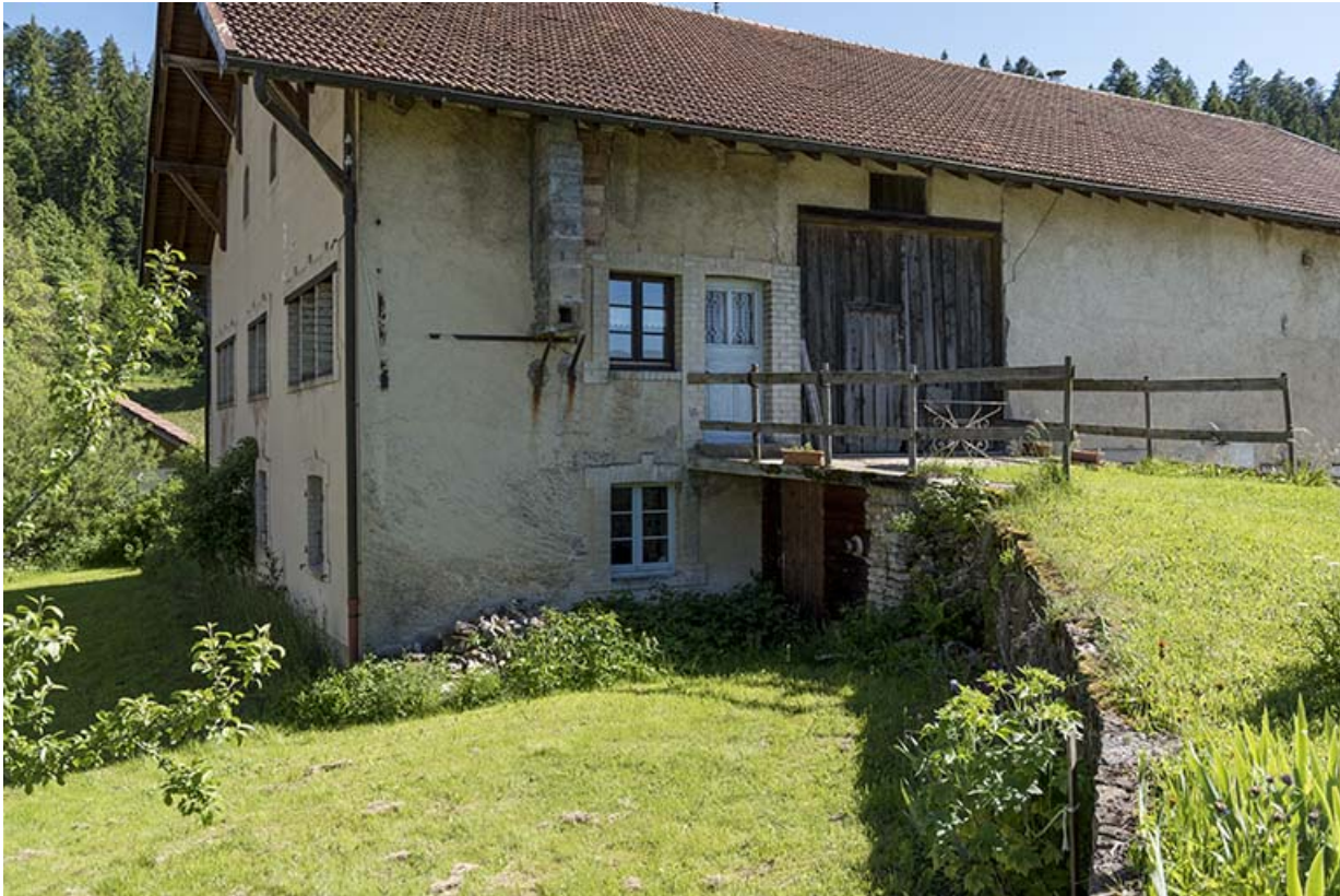
Façade postérieure, de trois quarts gauche, avec le pont de grange.

25, Les Gras, 62 rue les Seignes, lieudit : les Seignes