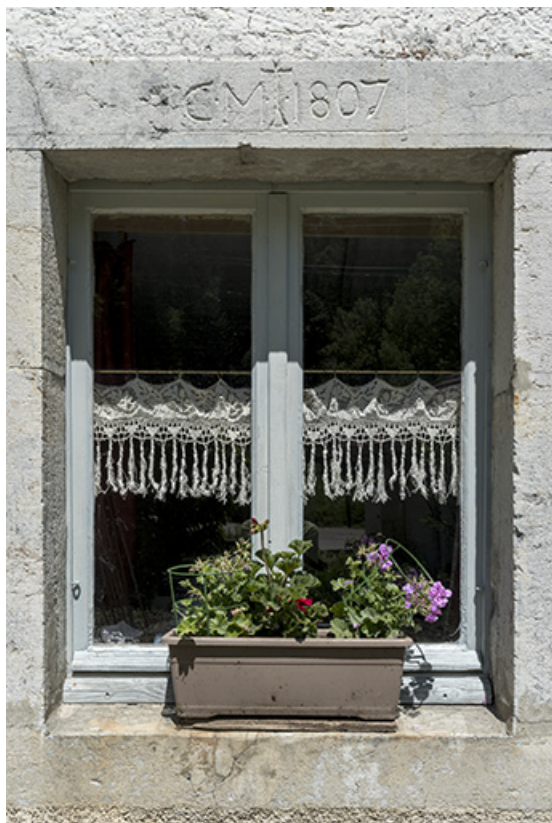
Façade antérieure : fenêtre avec linteau daté 1807. 25, Les Gras, 62 rue les Seignes, lieudit : les Seignes