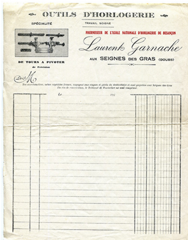
Papier à en-tête de Laurent Garnache-Barthod, années 1930. 25, Les Gras, 62 rue les Seignes, lieudit : les Seignes