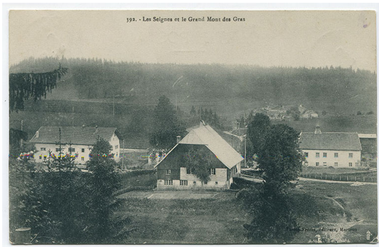
392. - Les Seignes et le Grand Mont des Gras, 1er quart 20e siècle [avant 1913]. 25, Les Gras, 61 rue les Seignes, lieudit : les Seignes

392. - Les Seignes et le Grand Mont des Gras, carte postale, s.n., [1er quart 20e siècle, avant 1913], Farine Frères éd. à Morteau. Porte la date 7 septembre 1913 (tampon) au verso.