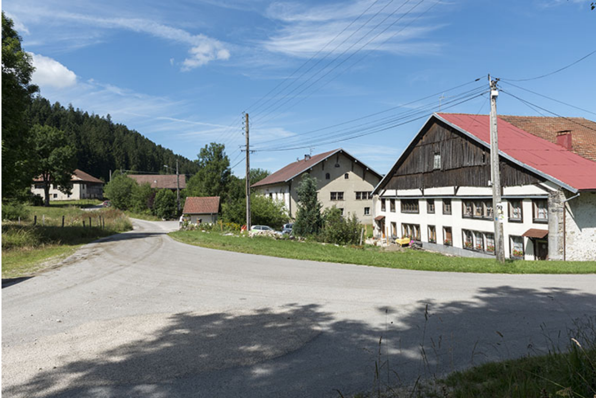
Vue d'ensemble des Seignes, depuis l'est.

25, Les Gras, 60 rue les Seignes, lieudit : les Seignes