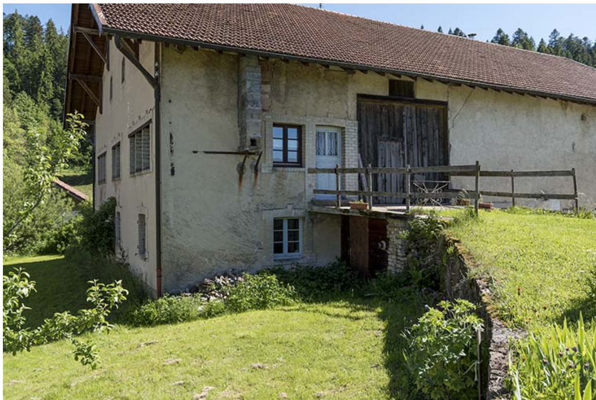
Façade postérieure, de trois quarts gauche, avec le pont de grange.

25, Les Gras, 62 rue les Seignes, lieudit : les Seignes