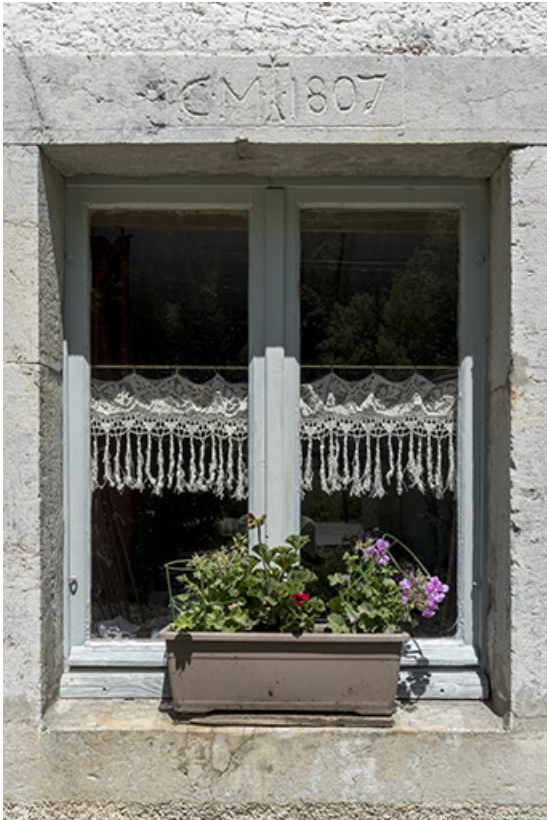
Façade antérieure : fenêtre avec linteau daté 1807. 25, Les Gras, 62 rue les Seignes, lieudit : les Seignes