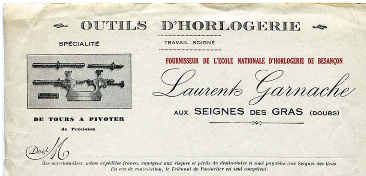
Papier à en-tête de Laurent Garnache-Barthod [détail de l'en-tête], années 1930.

25, Les Gras, 62 rue les Seignes, lieudit : les Seignes