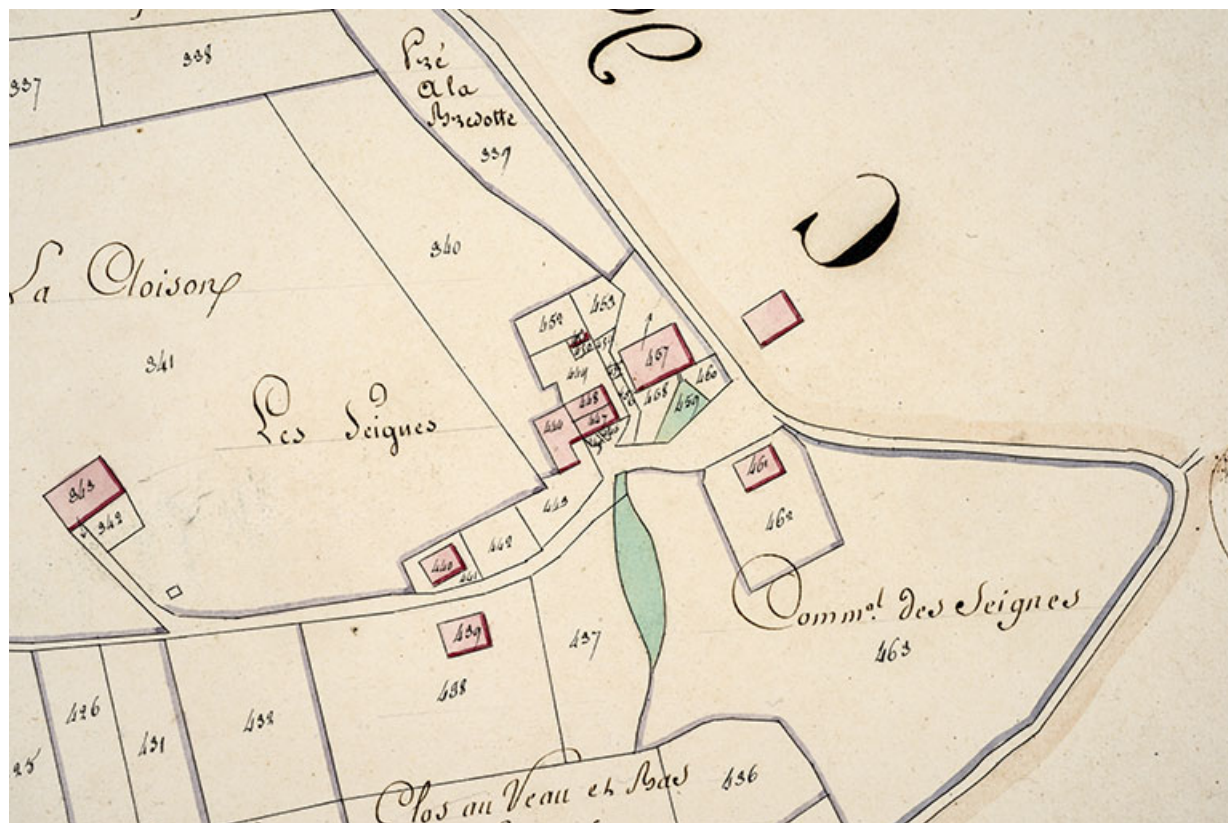
Cadastre de la commune des Gras. Atlas parcellaire, 1816, section D 2e feuille [détail : les Seignes], 1/2 500. 25, Les Gras, 60 rue les Seignes, lieudit : les Seignes