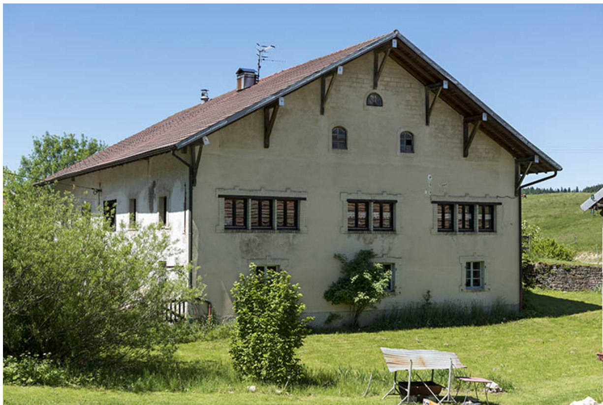
Façade latérale droite, de trois quarts gauche.

25, Les Gras, 62 rue les Seignes, lieudit : les Seignes