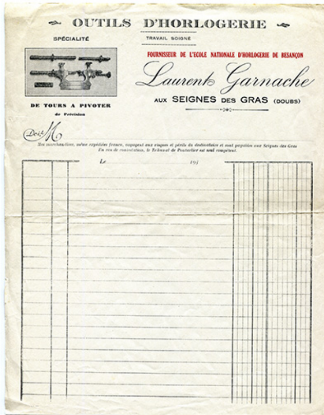
Papier à en-tête de Laurent Garnache-Barthod, années 1930. 25, Les Gras, 62 rue les Seignes, lieudit : les Seignes