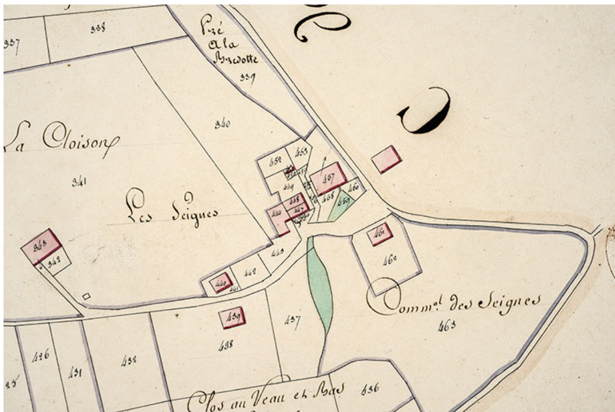
Cadastre de la commune des Gras. Atlas parcellaire, 1816, section D 2e feuille [détail : les Seignes], 1/2 500. 25, Les Gras