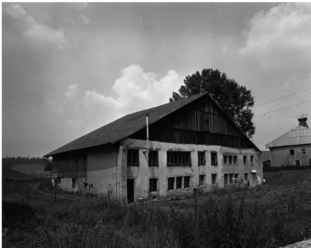
Ferme située au lieu-dit Les Seignes, cadastrée ZI 23 : façades antérieure et latérale gauche. 25, Les Gras, 60 rue les Seignes, lieudit : les Seignes