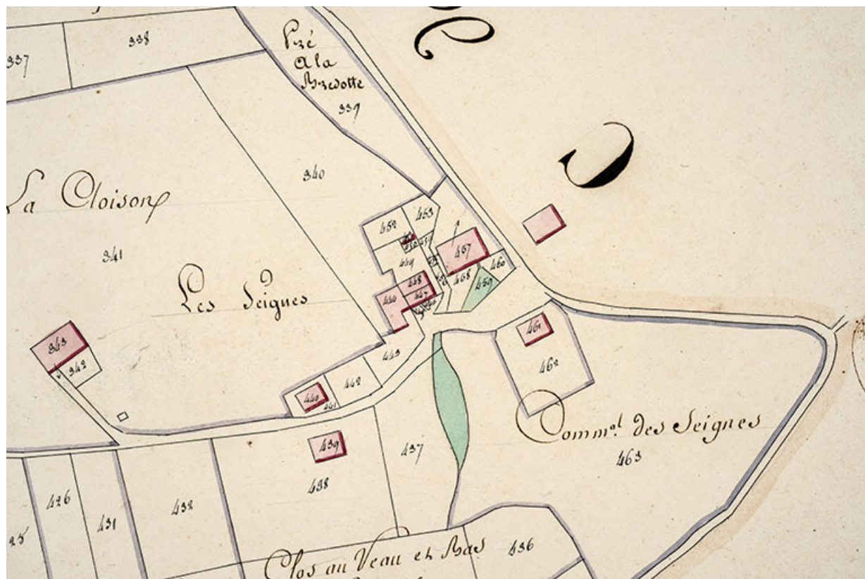
Cadastre de la commune des Gras. Atlas parcellaire, 1816, section D 2e feuille [détail : les Seignes], 1/2 500. 25, Les Gras