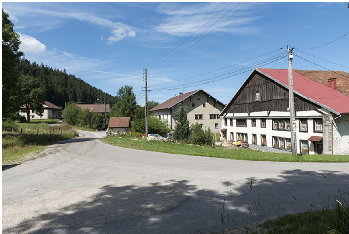
Vue d'ensemble des Seignes, depuis l'est. 25, Les Gras