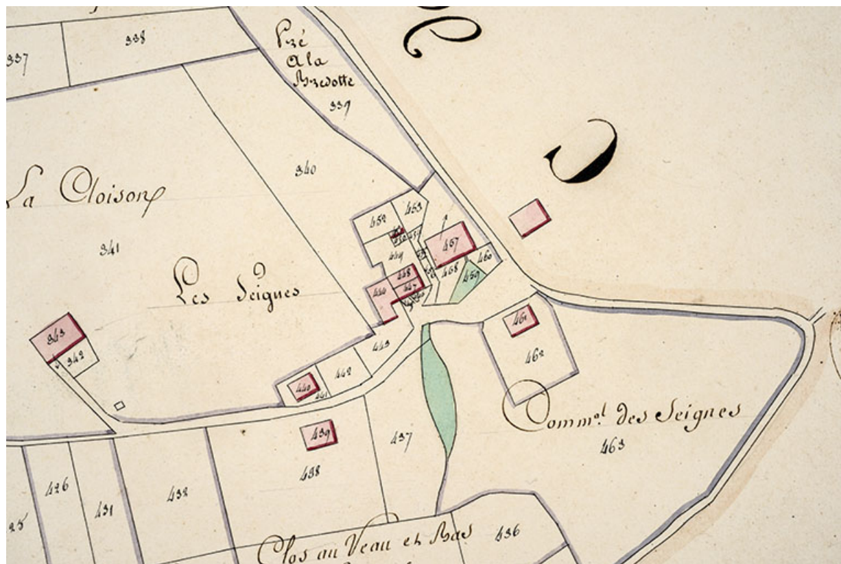
Cadastre de la commune des Gras. Atlas parcellaire, 1816, section D 2e feuille [détail : les Seignes], 1/2 500. 25, Les Gras