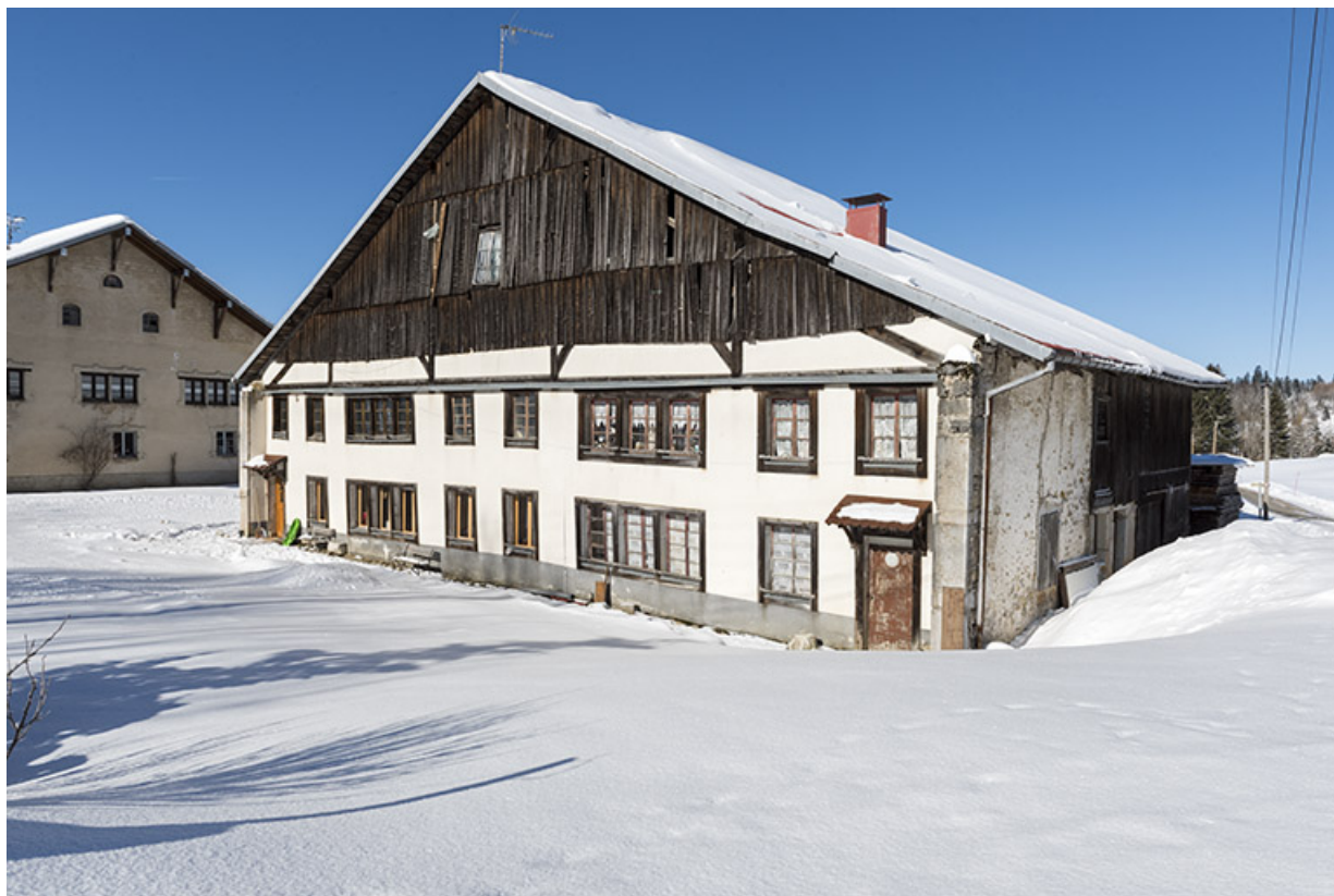
Ferme et atelier d'outillage de Claude François Garnache-Barthod dit le Sergent, aux Seignes, Les Gras. 25, Les Gras, 60 rue les Seignes, lieudit : les Seignes