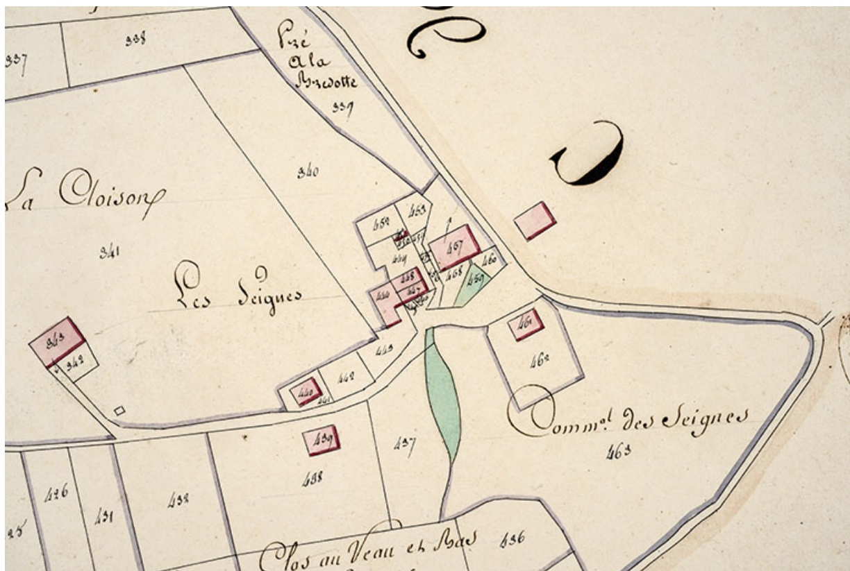
Cadastre de la commune des Gras. Atlas parcellaire, 1816, section D 2e feuille [détail : les Seignes], 1/2 500. 25, Les Gras, 60 rue les Seignes, lieudit : les Seignes