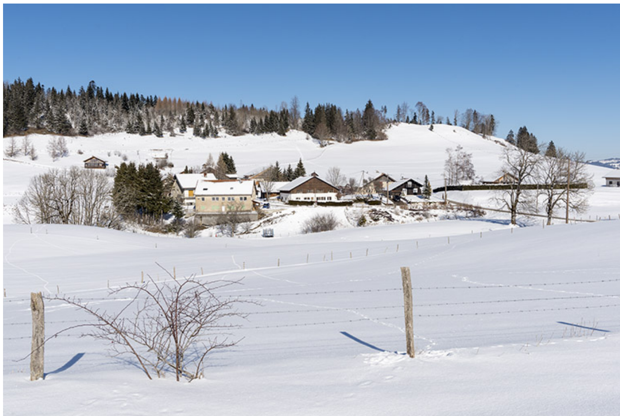
Le Grand Mont, depuis le sud, en hiver. 25, Les Gras