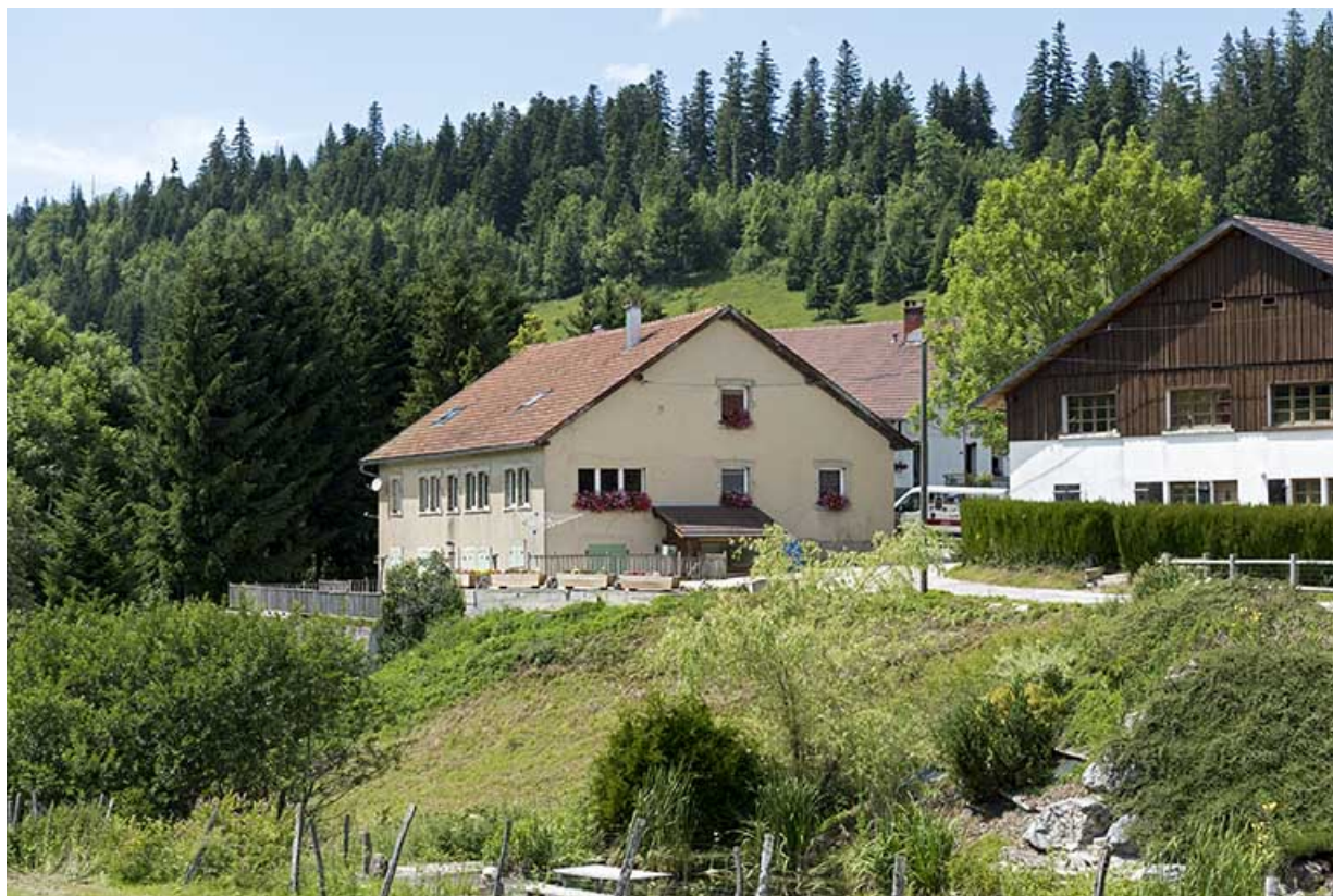
Le Grand Mont : ferme (vers 1910) et atelier de tournerie Voynnet puis d'outillage Garnache-Barthod, Moysse et Vernier, 28 le Grand Mont.