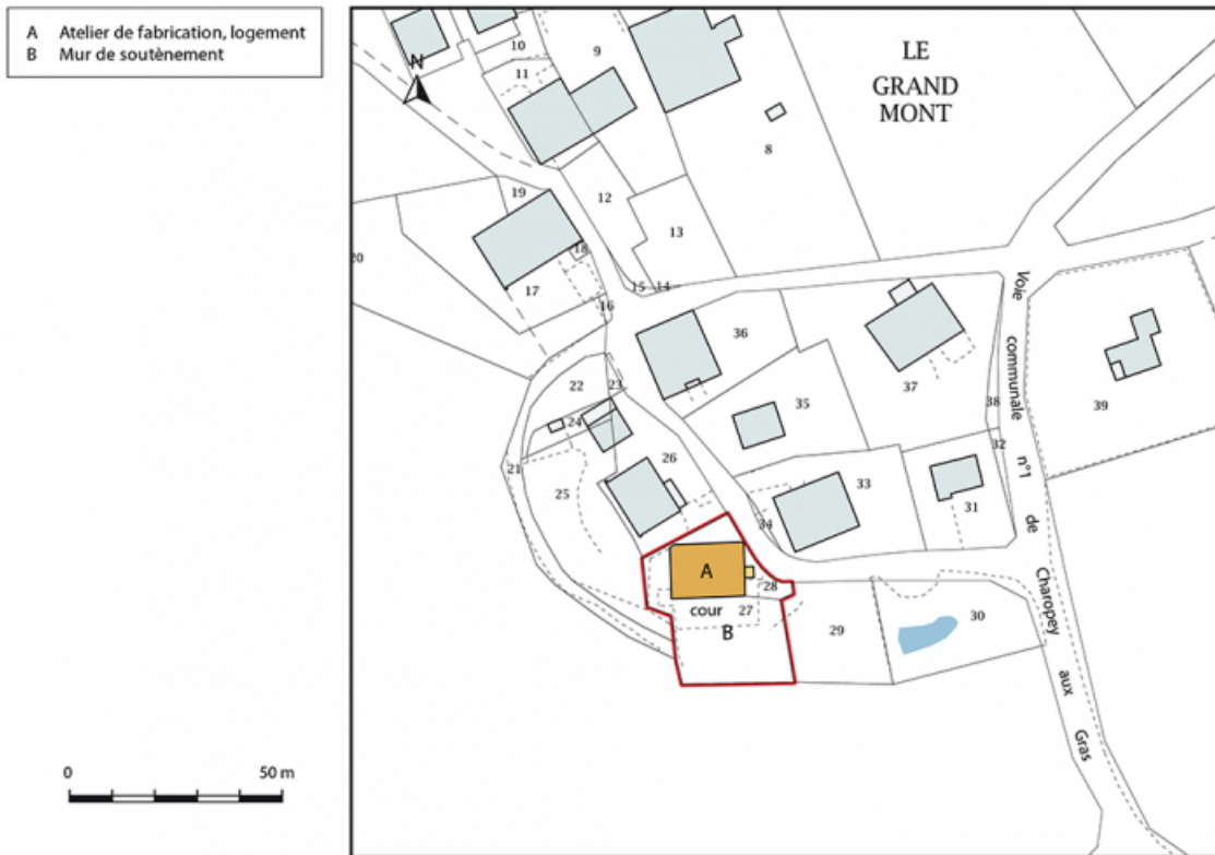
Plan-masse et de situation. Extrait du plan cadastral, 2017, section AD, 1/1 000. 25, Les Gras, 28 rue le Grand Mont, lieudit : le Grand Mont