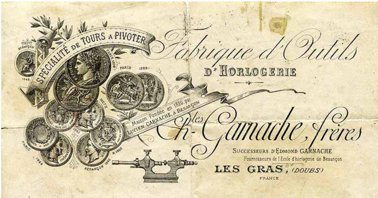
Prix courant de la société Charles Garnache Frères [détail de l'en-tête], s.d. [limite 19e siècle 20e siècle]. 25, Besançon