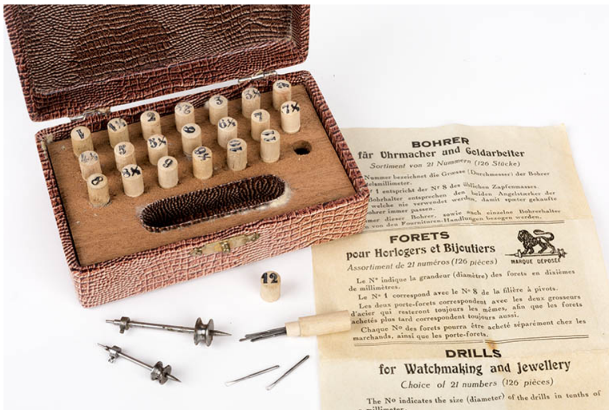
Outils produits dans la commune (collection René Laithier, mairie des Gras) : forets pour horlogers et bijoutiers réalisés par Narcisse Moysse.