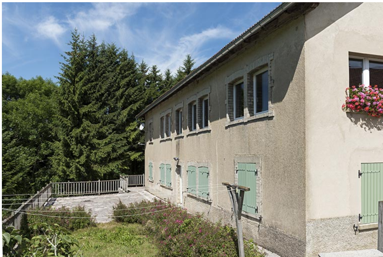
Façade sud, vue en enfilade.

25, Les Gras, 28 rue le Grand Mont, lieudit : le Grand Mont