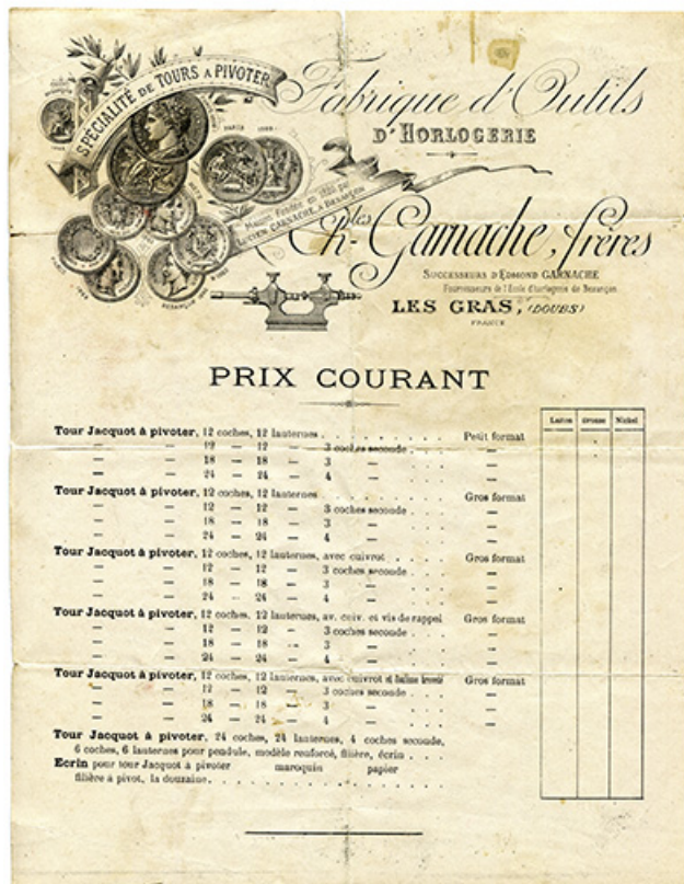
Prix courant de la société Charles Garnache Frères, s.d. [limite 19e siècle 20e siècle]. 25, Besançon