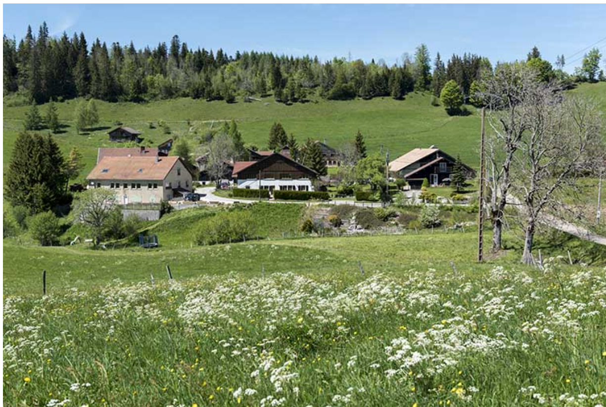
Vue d'ensemble du Grand Mont, depuis le sud. 25, Les Gras