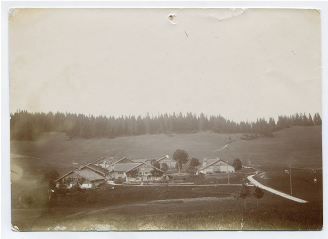
[Vue d'ensemble du Grand Mont, depuis le sud], limite 19e siècle 20e siècle. La ferme est visible au centre. 25, Les Gras, 28 rue le Grand Mont, lieudit : le Grand Mont