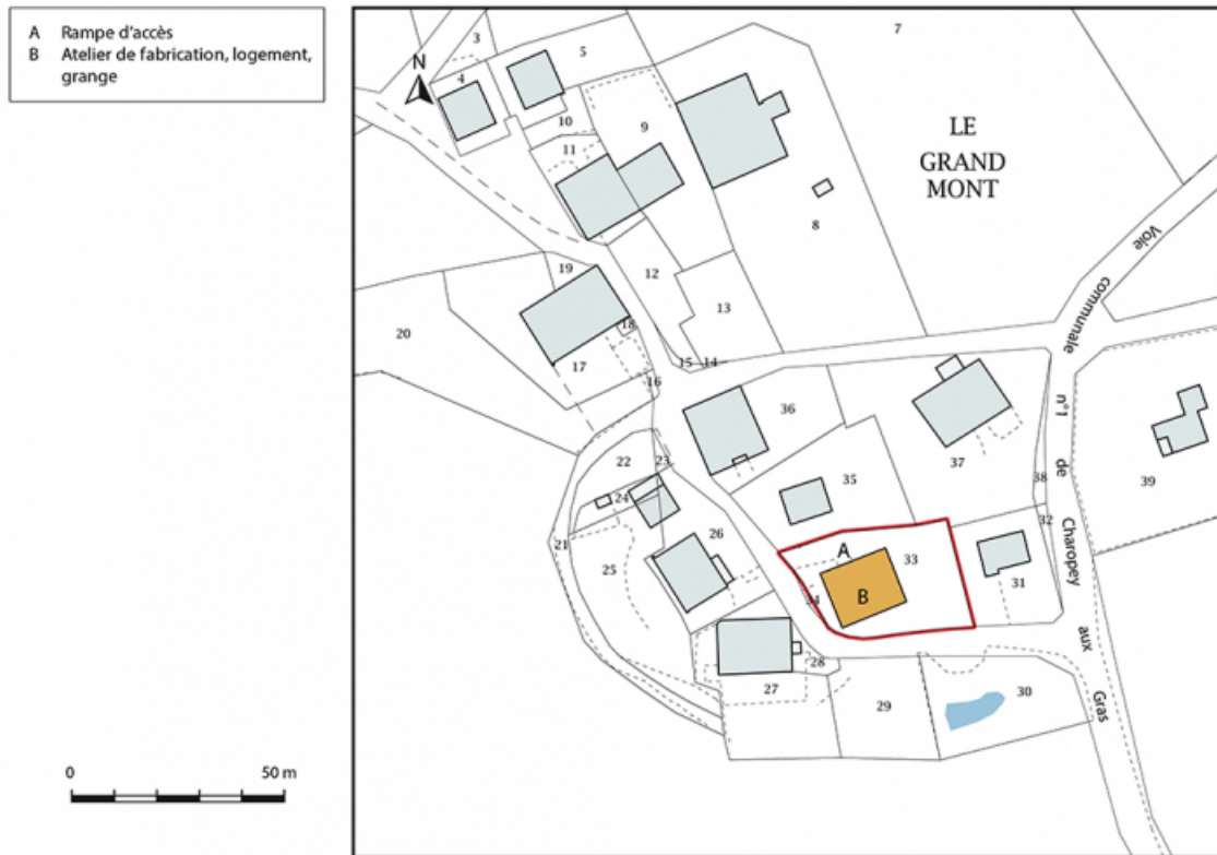
Plan-masse et de situation. Extrait du plan cadastral, 2017, section AD, 1/1 000. 25, Les Gras, 19 rue le Grand Mont, lieudit : le Grand Mont