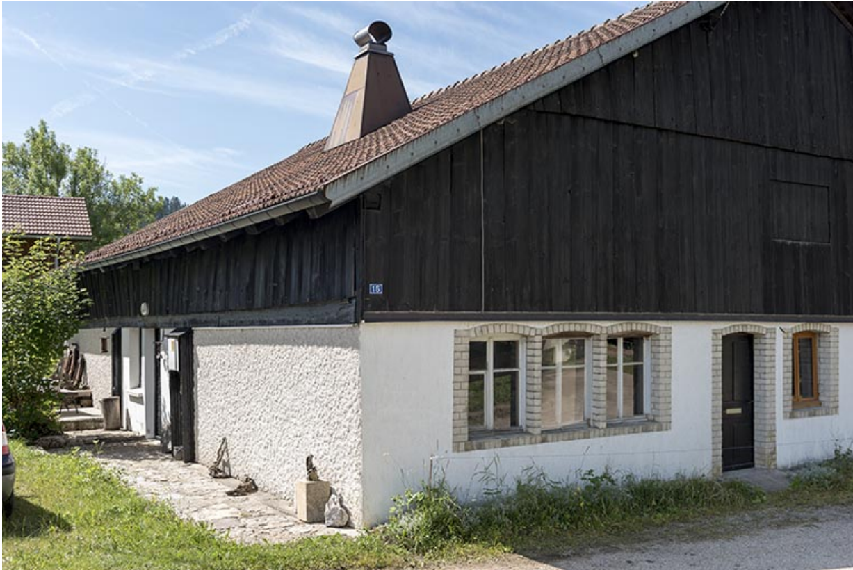
Façades antérieure (à fenêtres multiples) et latérale gauche.

25, Les Gras, 15 rue le Grand Mont, lieudit : le Grand Mont