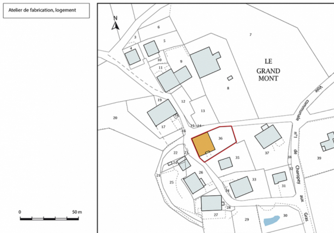
Plan-masse et de situation. Extrait du plan cadastral, 2017, section AD, 1/1 000.

25, Les Gras, 15 rue le Grand Mont, lieudit : le Grand Mont