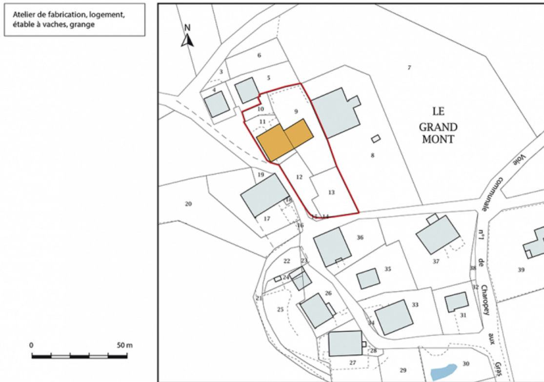
Plan-masse et de situation. Extrait du plan cadastral, 2017, section AD, 1/1 000. 25, Les Gras, 12-14 rue le Grand Mont, lieudit : le Grand Mont