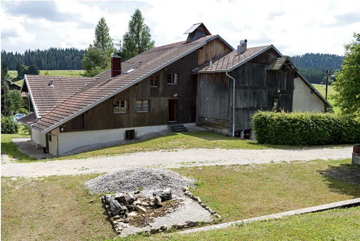
Façade postérieure, de trois quarts gauche.

25, Les Gras, 12-14 rue le Grand Mont, lieudit : le Grand Mont