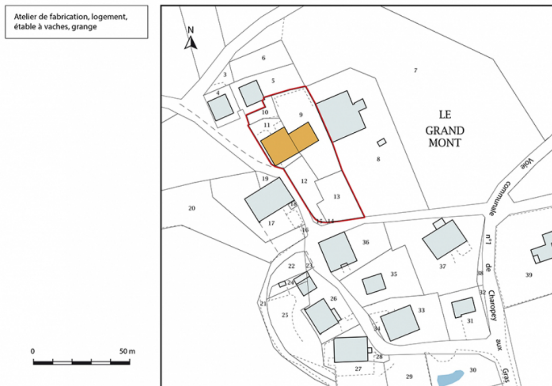
Plan-masse et de situation. Extrait du plan cadastral, 2017, section AD, 1/1 000.

25, Les Gras, 12-14 rue le Grand Mont, lieudit : le Grand Mont