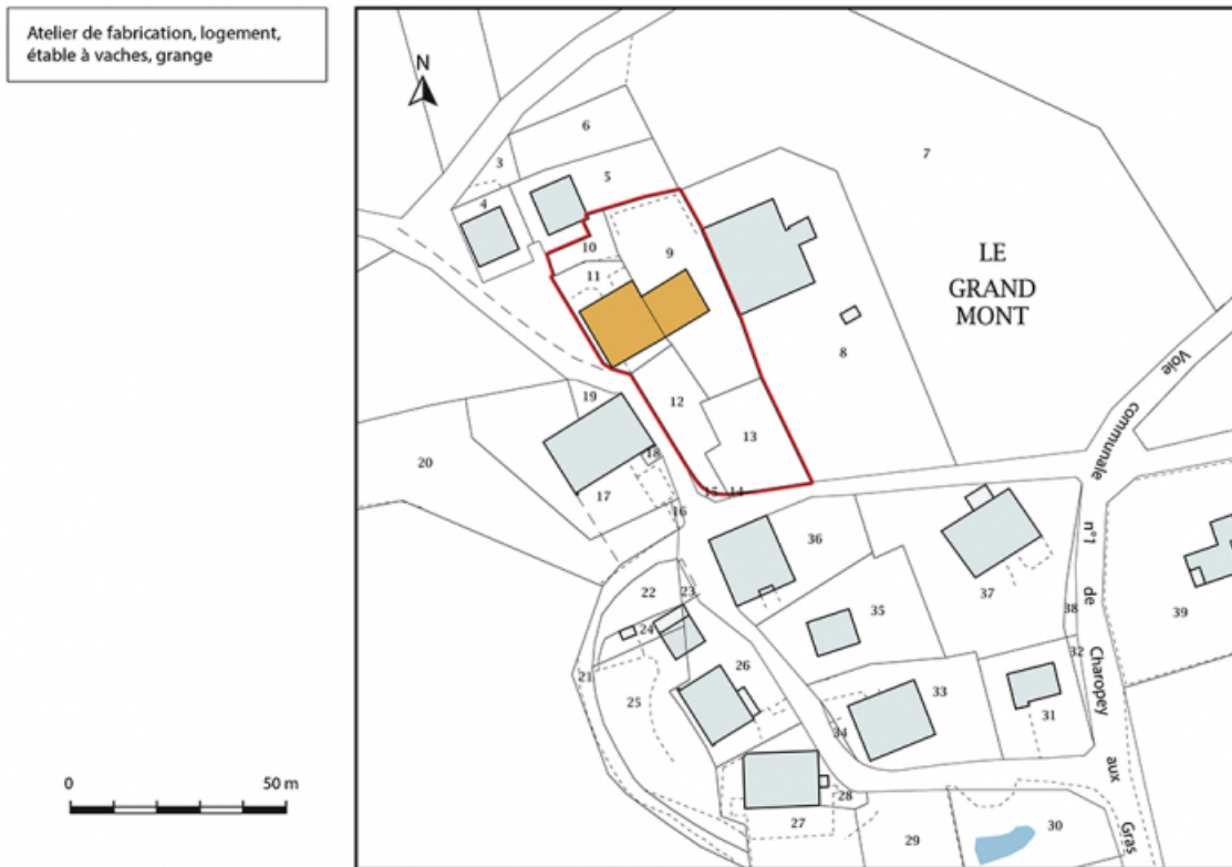
Plan-masse et de situation. Extrait du plan cadastral, 2017, section AD, 1/1 000. 25, Les Gras, 12-14 rue le Grand Mont, lieudit : le Grand Mont