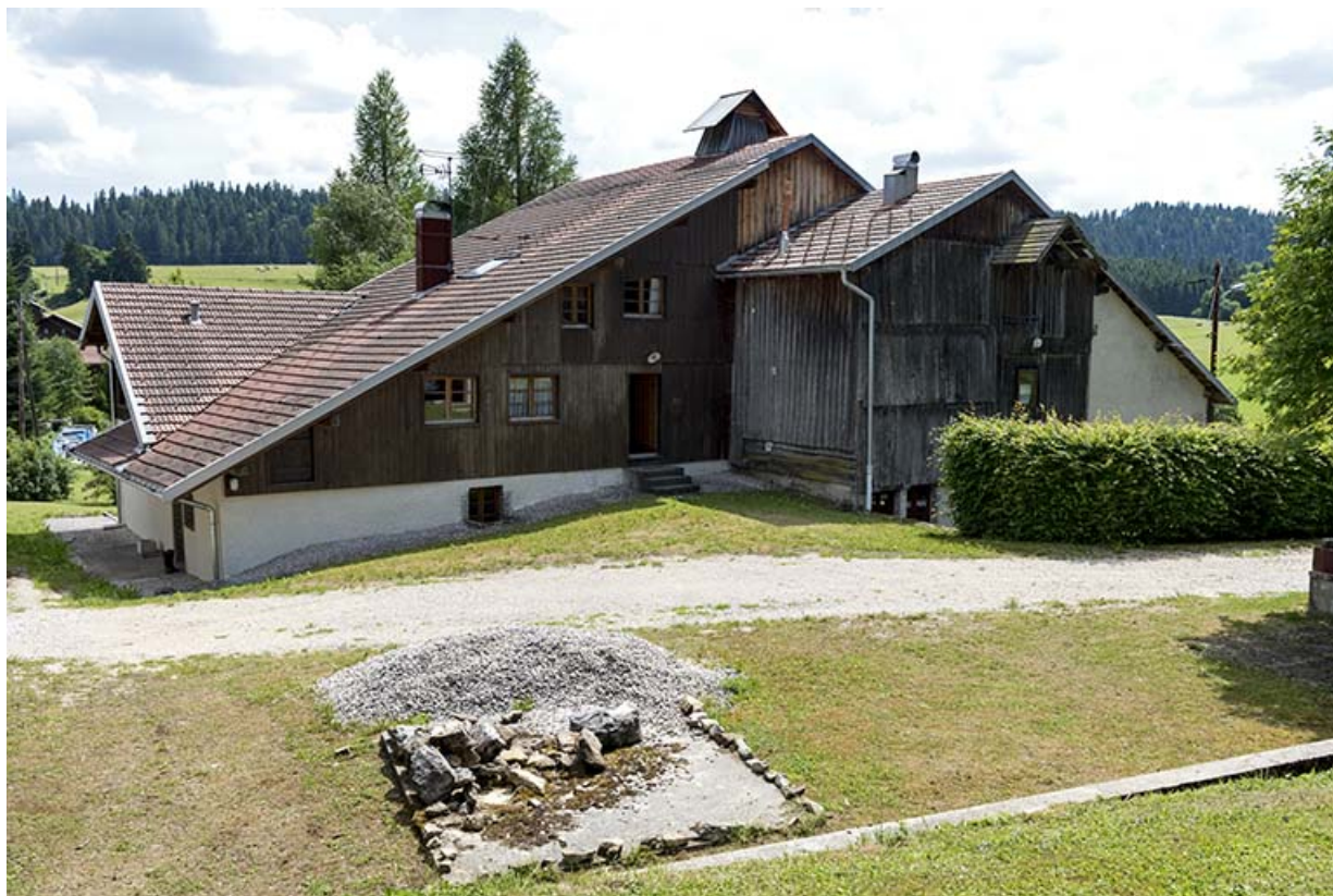
Façade postérieure, de trois quarts gauche.

25, Les Gras, 12-14 rue le Grand Mont, lieudit : le Grand Mont