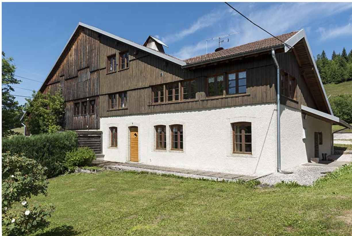
Façade antérieure, de trois quarts droite. 25, Les Gras