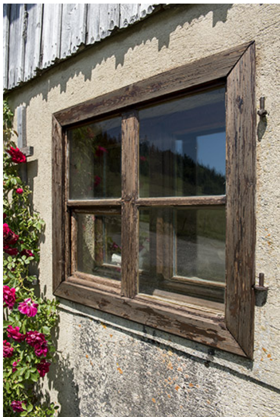
Façade latérale gauche : une fenêtre.

25, Les Gras, 12-14 rue le Grand Mont, lieudit : le Grand Mont