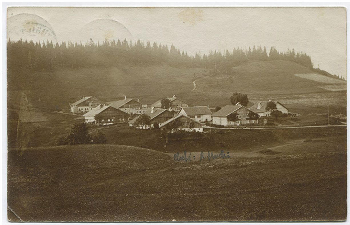
[Vue d'ensemble du Grand Mont, depuis le sud], 1907. La ferme est visible au centre. 25, Les Gras