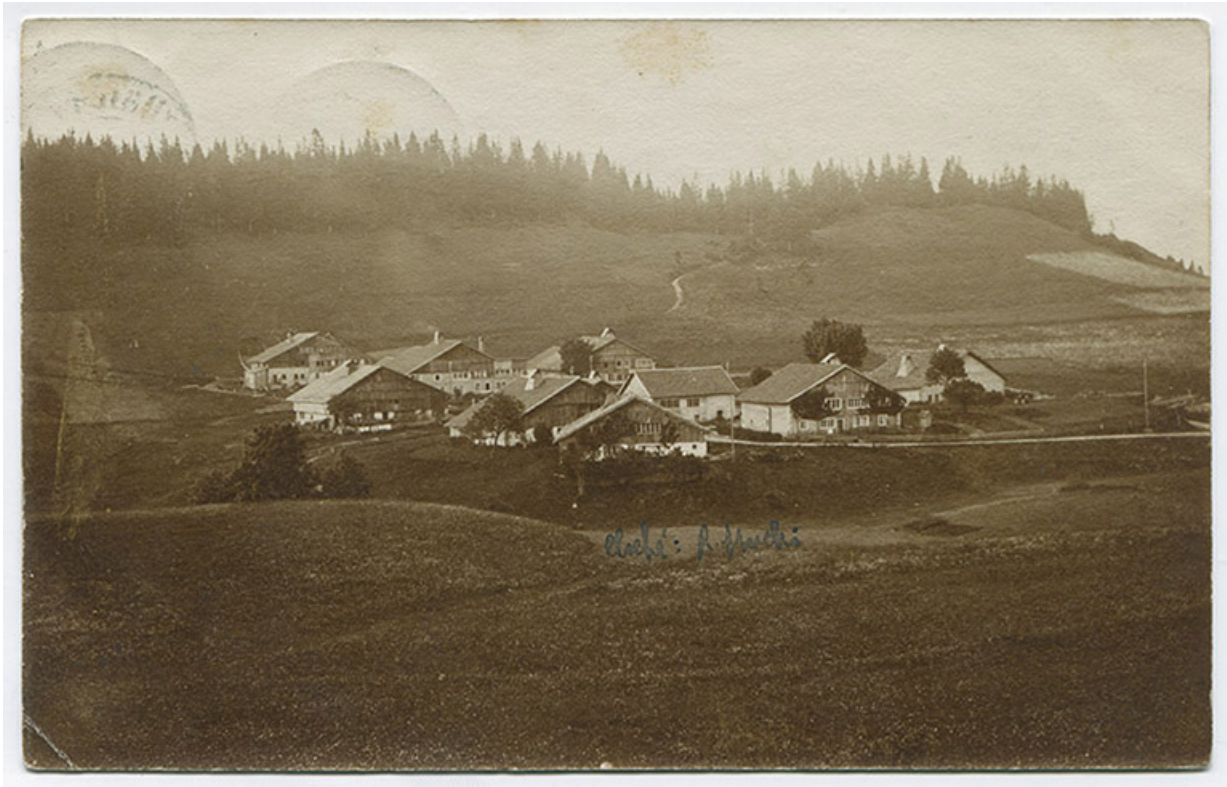
[Vue d'ensemble du Grand Mont, depuis le sud], 1907. La ferme est visible au centre.

25, Les Gras, 10 rue le Grand Mont, lieudit : le Grand Mont