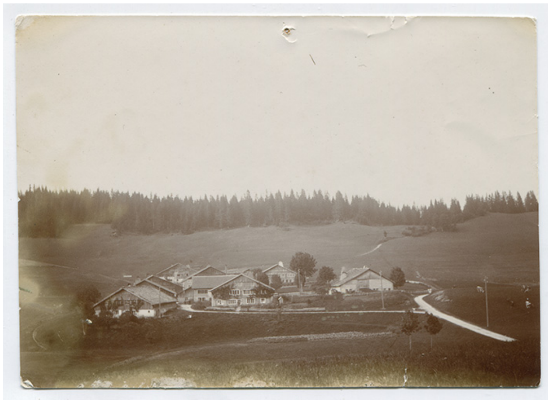
[Vue d'ensemble du Grand Mont, depuis le sud], limite 19e siècle 20e siècle. La ferme est visible au centre. 25, Les Gras, 28 rue le Grand Mont, lieudit : le Grand Mont