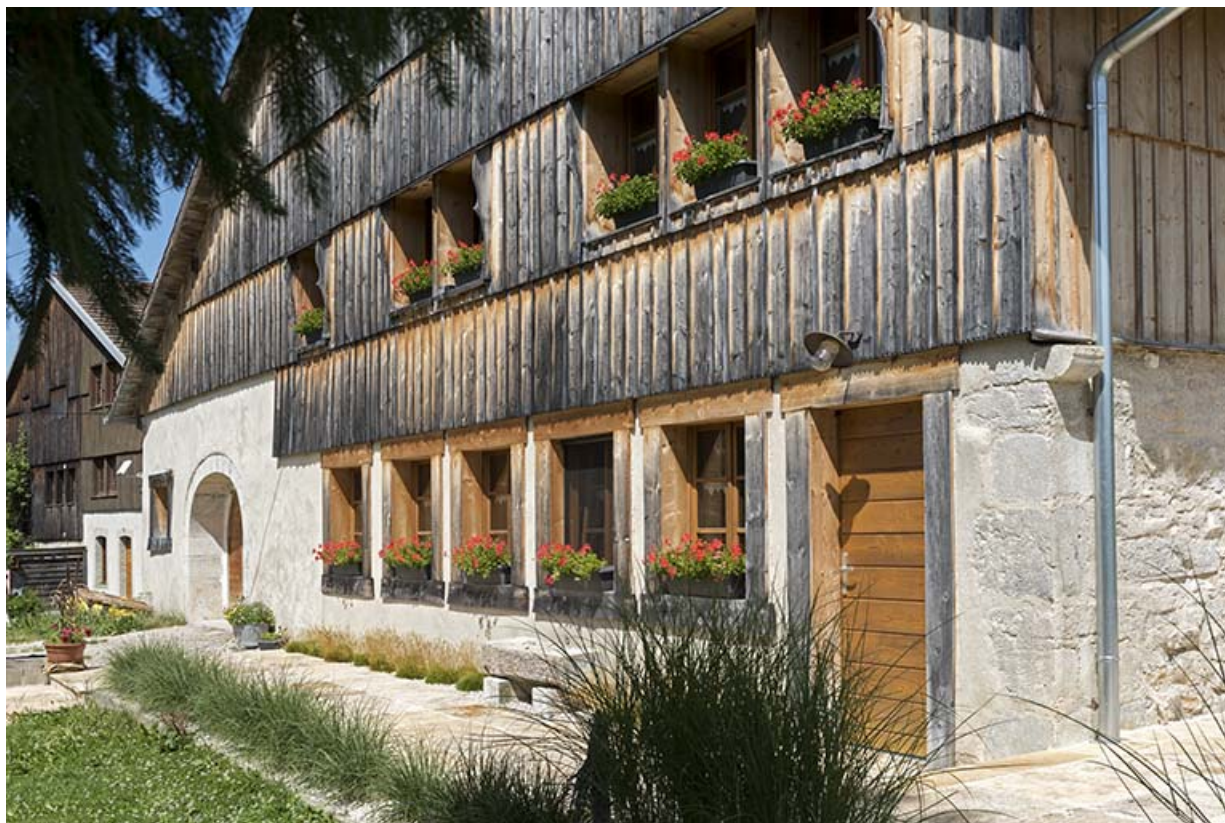
Façade antérieure, vue en enfilade.

25, Les Gras, 10 rue le Grand Mont, lieudit : le Grand Mont