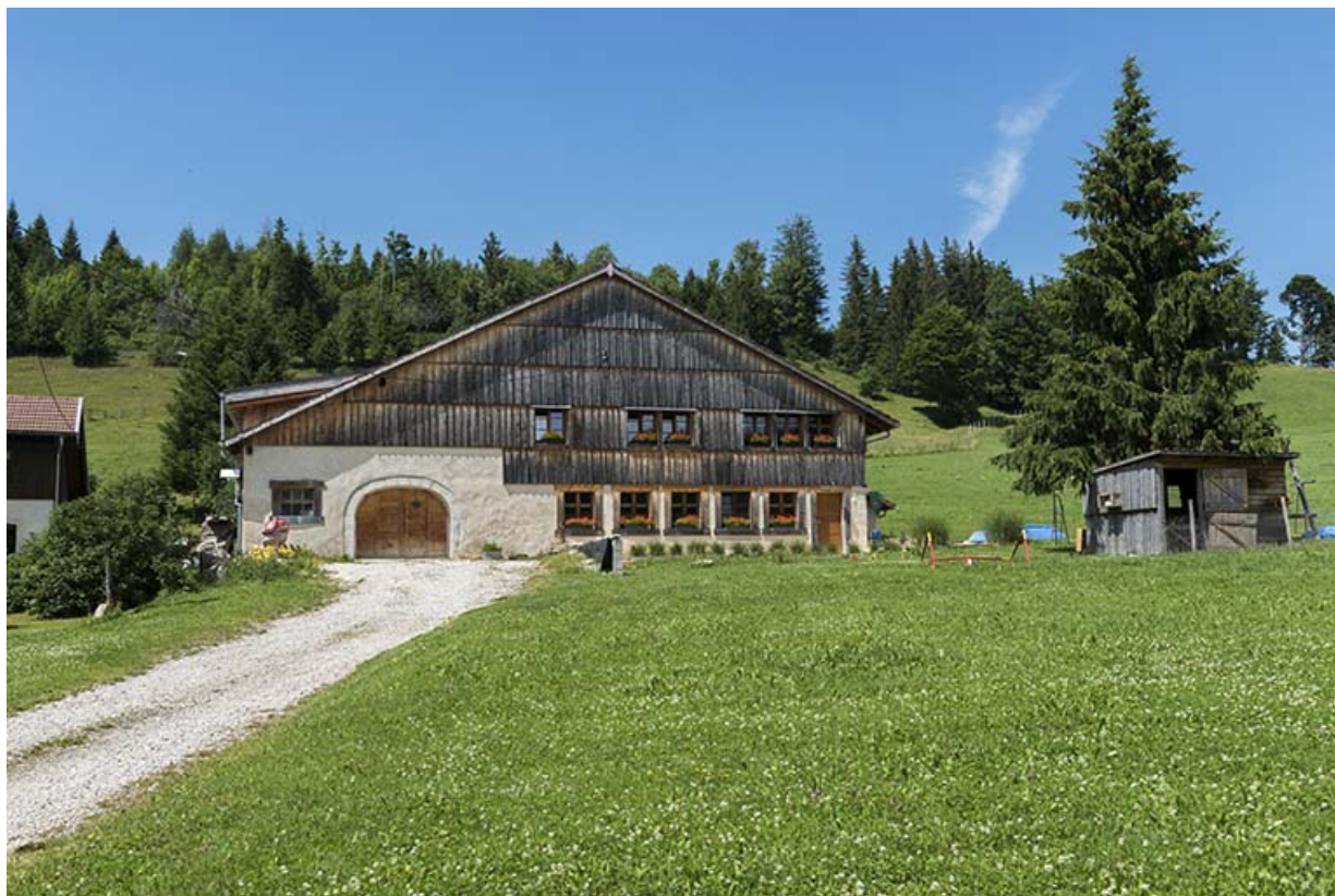
Le Grand Mont : ferme (18e siècle ou début 19e siècle) et atelier d'outillage de Philimin puis d'Ernest Dornier, 10 le Grand Mont. 25, Les Gras, 10 rue le Grand Mont, lieudit : le Grand Mont