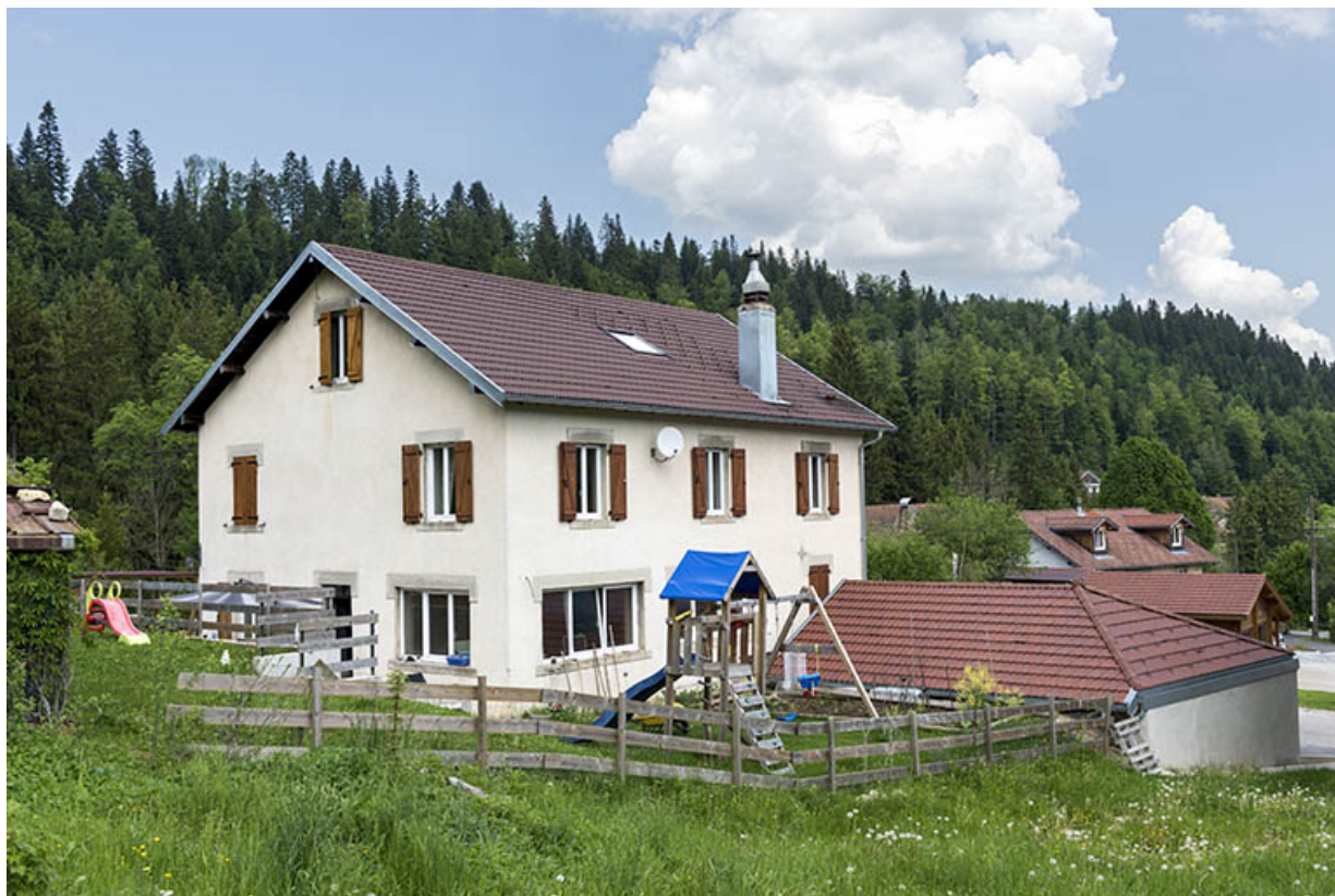
Façades postérieure et latérale gauche.

25, Les Gras, 11 rue les Epaisses, lieudit : les Epaisses