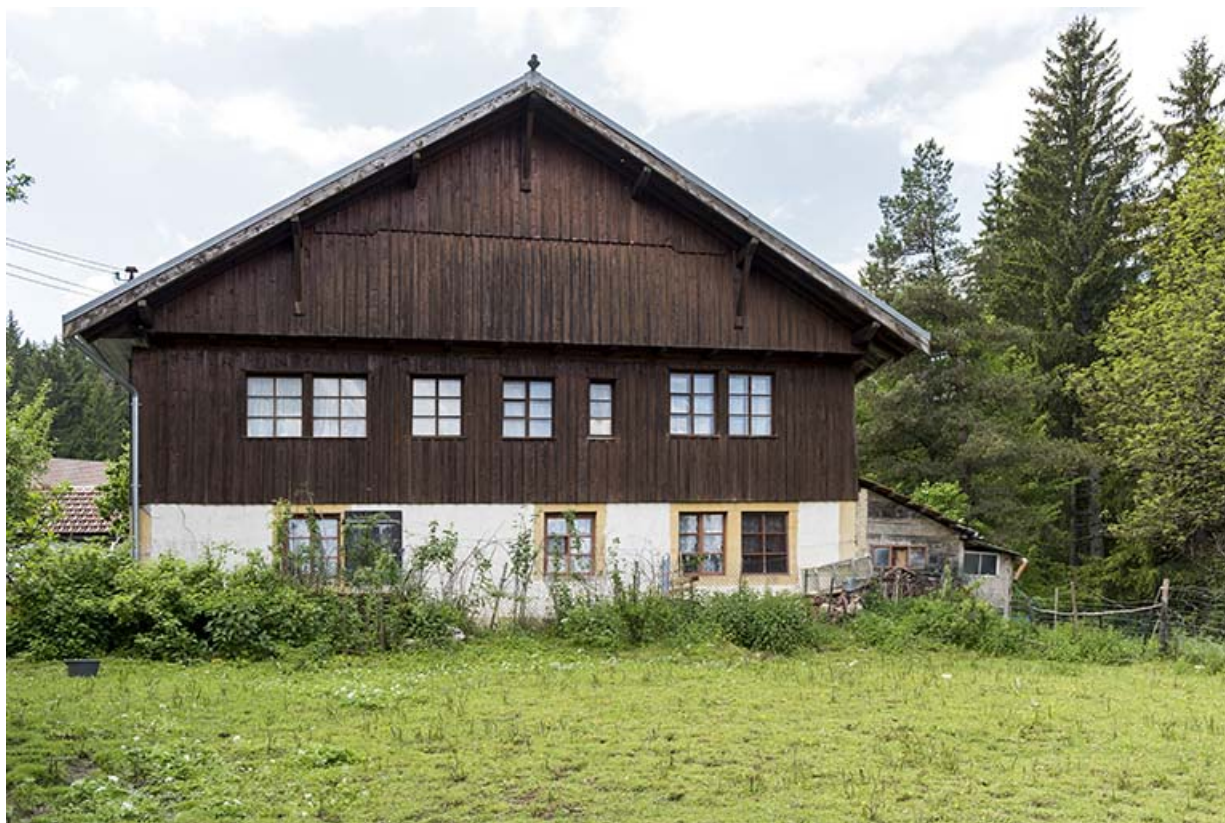
Les Epaises : la ferme (fin 18e siècle-début 19e siècle) du tourneur sur métaux Alcide Py puis de la famille de tourneurs sur bois Comte, au 16 les Epaises.