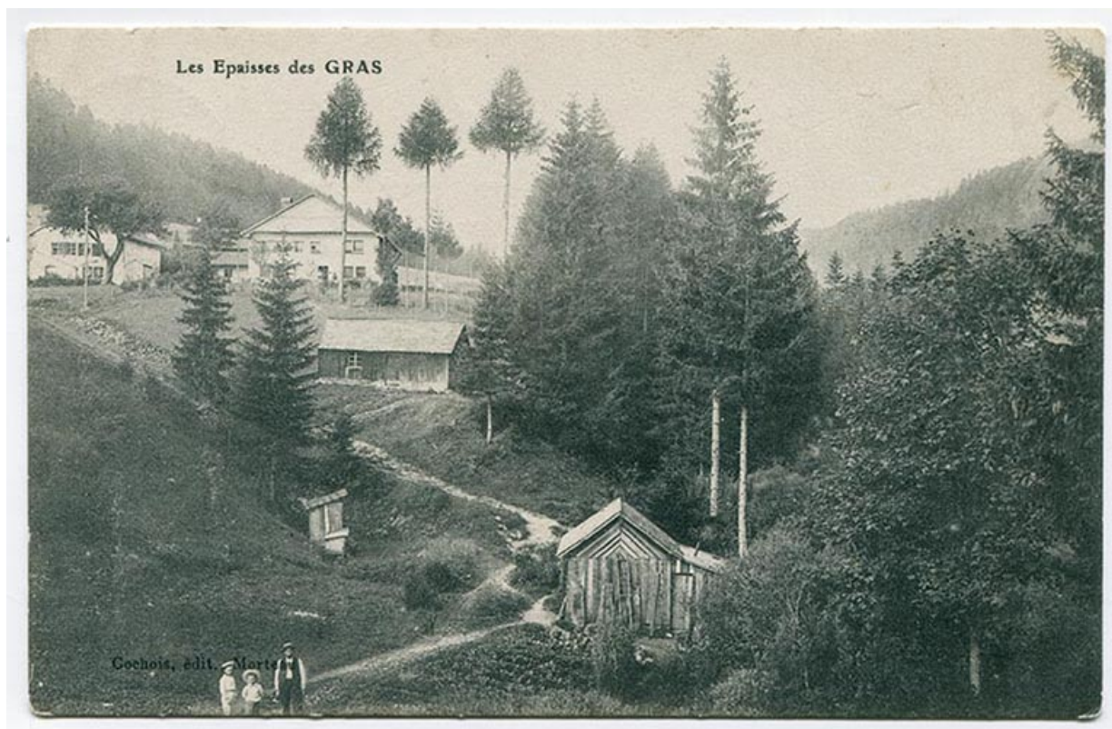
Les Epais des Gras [vus depuis l'ancien chemin du village, au nord-est], [avant 1909]. Le mur pignon de la maison est visible à gauche.

25, Les Gras, 6 rue les Epais, lieudit : les Epais