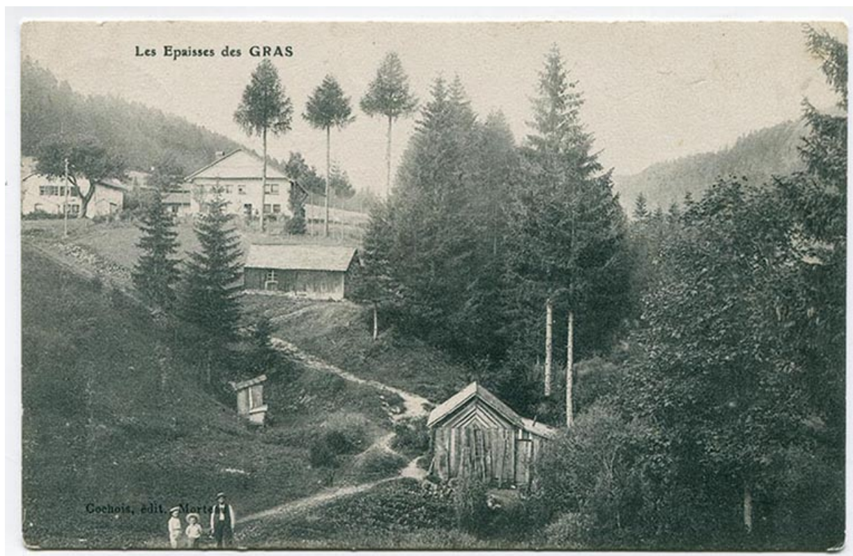
Les Epaisses des Gras [vus depuis l'ancien chemin du village, au nord-est], [avant 1909]. Le mur pignon de la maison est visible à gauche.

25, Les Gras, 16 rue les Epaisses, lieudit : les Epaisses