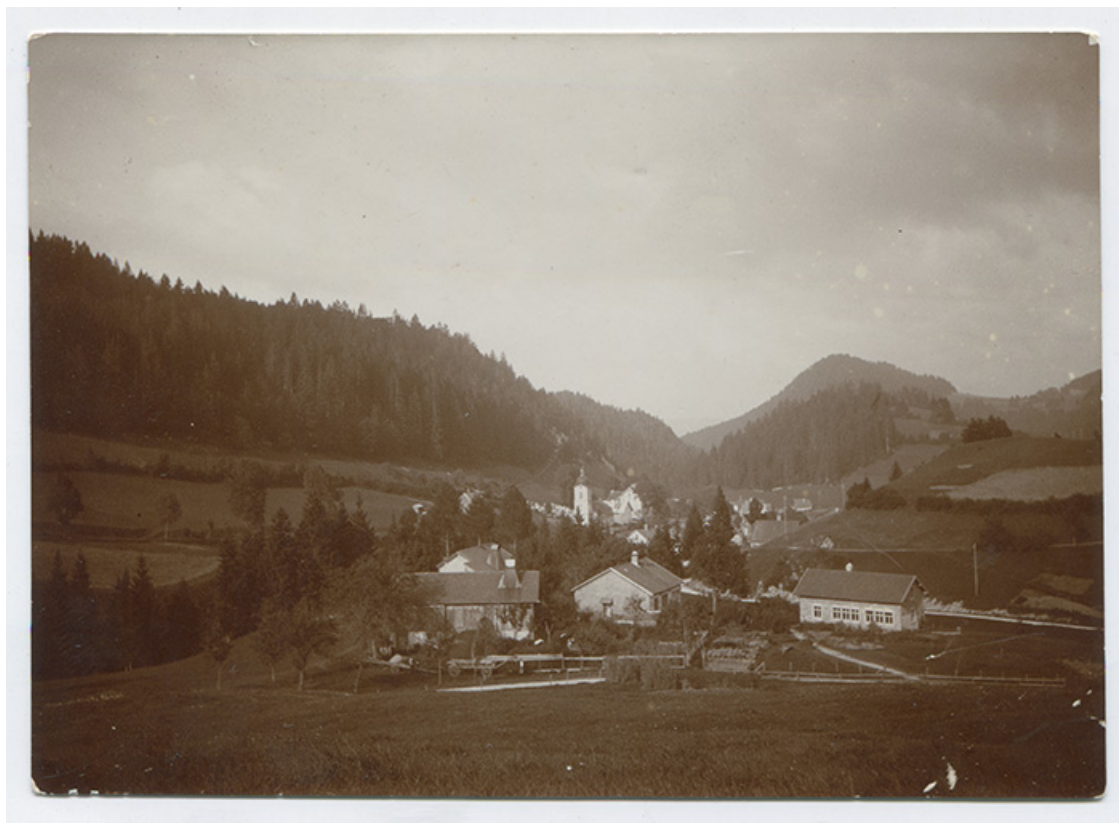
[Vue d'ensemble du hameau des Epaises, depuis le sud-ouest], 1ère moitié 20e siècle. 25, Les Gras, 14 rue les Epaises, lieudit : les Epaises