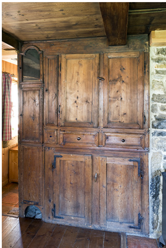
Intérieur : boiserie intégrant une caisse d'horloge comtoise.

25, Les Gras, 14 rue les Epaissses, lieudit : les Epaissses