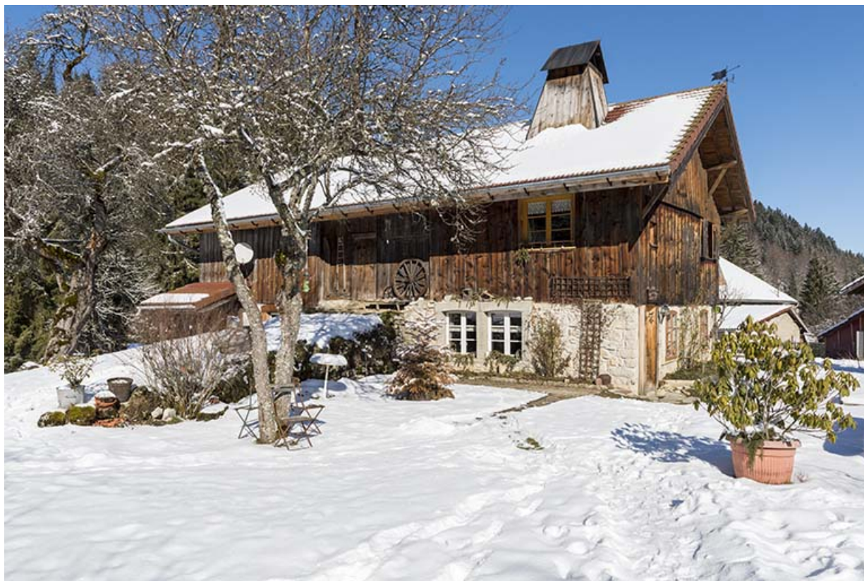
Façade latérale gauche, de trois quarts droite, en hiver.

25, Les Gras, 14 rue les Epaises, lieudit : les Epaises