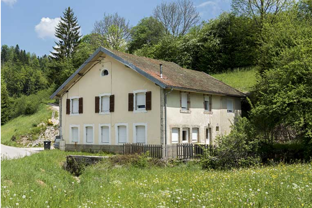
Les Epaisses : l'atelier d'Emile Ernest Voynnet (vers 1894), puis d'Henri et de René Laithier, au 1 les Epaisses. 25, Les Gras, 1 rue les Epaisses, lieudit : les Epaisses