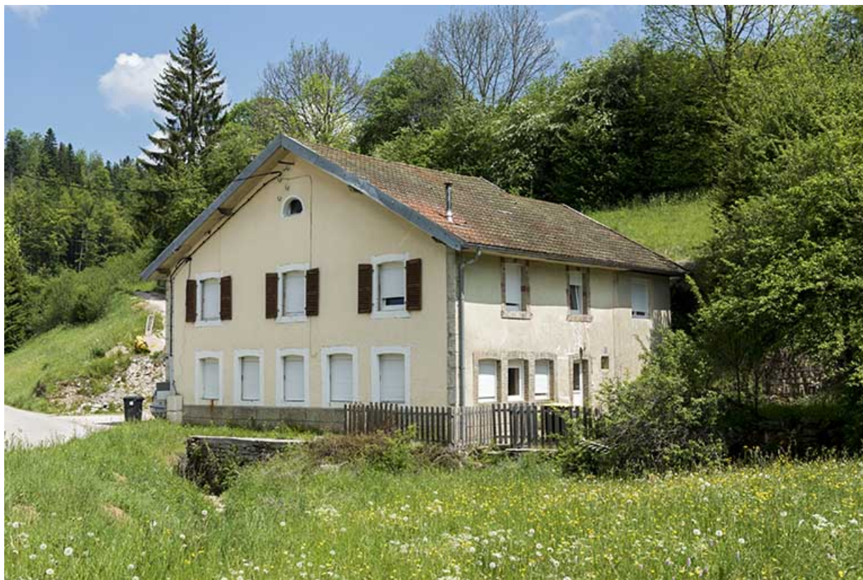
Les Epaises : l'atelier d'Emile Ernest Voynnet (vers 1894), puis d'Henri et de René Laithier, au 1 les Epaises. 25, Les Gras, 1 rue les Epaises, lieudit : les Epaises