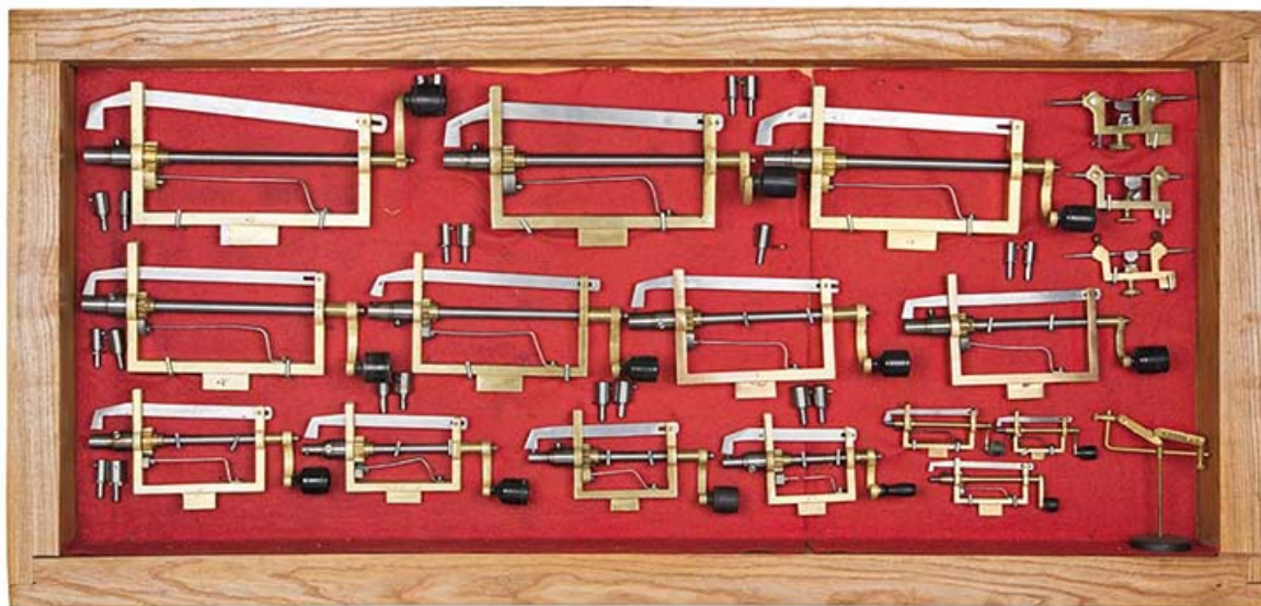
Outils produits dans la commune (collection René Laithier, mairie des Gras) : estrapades, tourets à finir, etc. 25, Les Gras, 1 rue les Epaisses, lieudit : les Epaisses