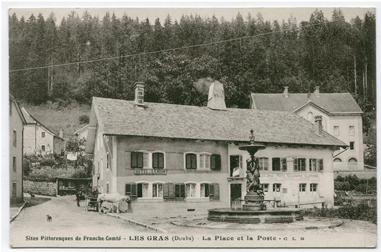
Sites pittoresques de Franche-Comté - Les Gras (Doubs) - La place et la poste, [1er quart 20e siècle].

25, Les Gras, 5-6 place de la Libération et du Souvenir français