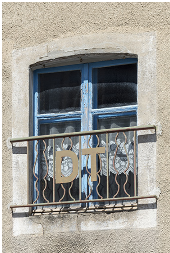
Façade latérale gauche : initiales DT sur un garde-corps. 25, Les Gras, 5-6 place de la Libération et du Souvenir français