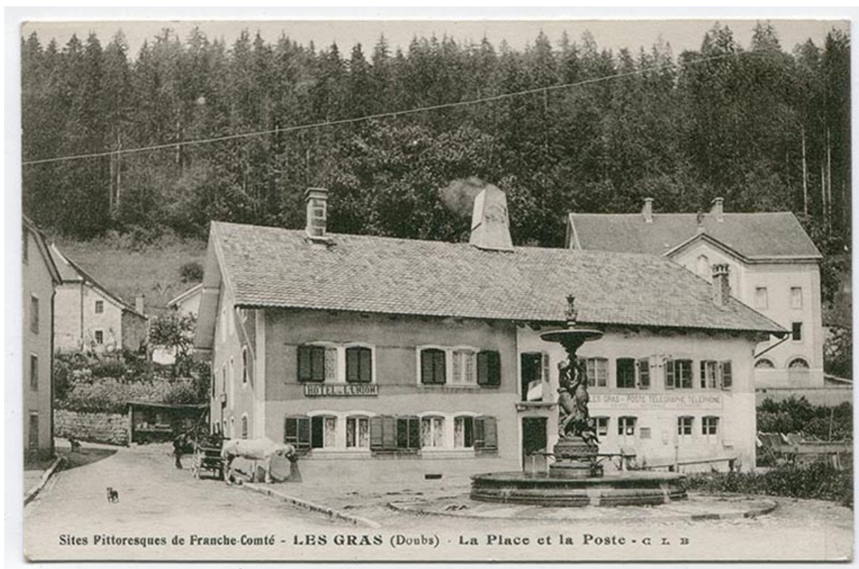
Sites pittoresques de Franche-Comté - Les Gras (Doubs) - La place et la poste, [1er quart 20e siècle].

25, Les Gras, 5-6 place de la Libération et du Souvenir français