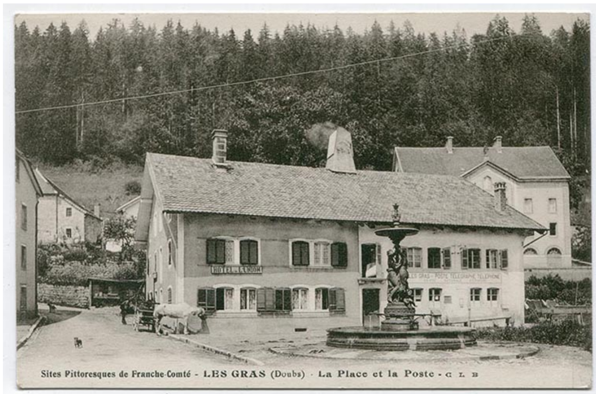
Sites pittoresques de Franche-Comté - Les Gras (Doubs) - La place et la poste, [1er quart 20e siècle].

25, Les Gras, 5-6 place de la Libération et du Souvenir français