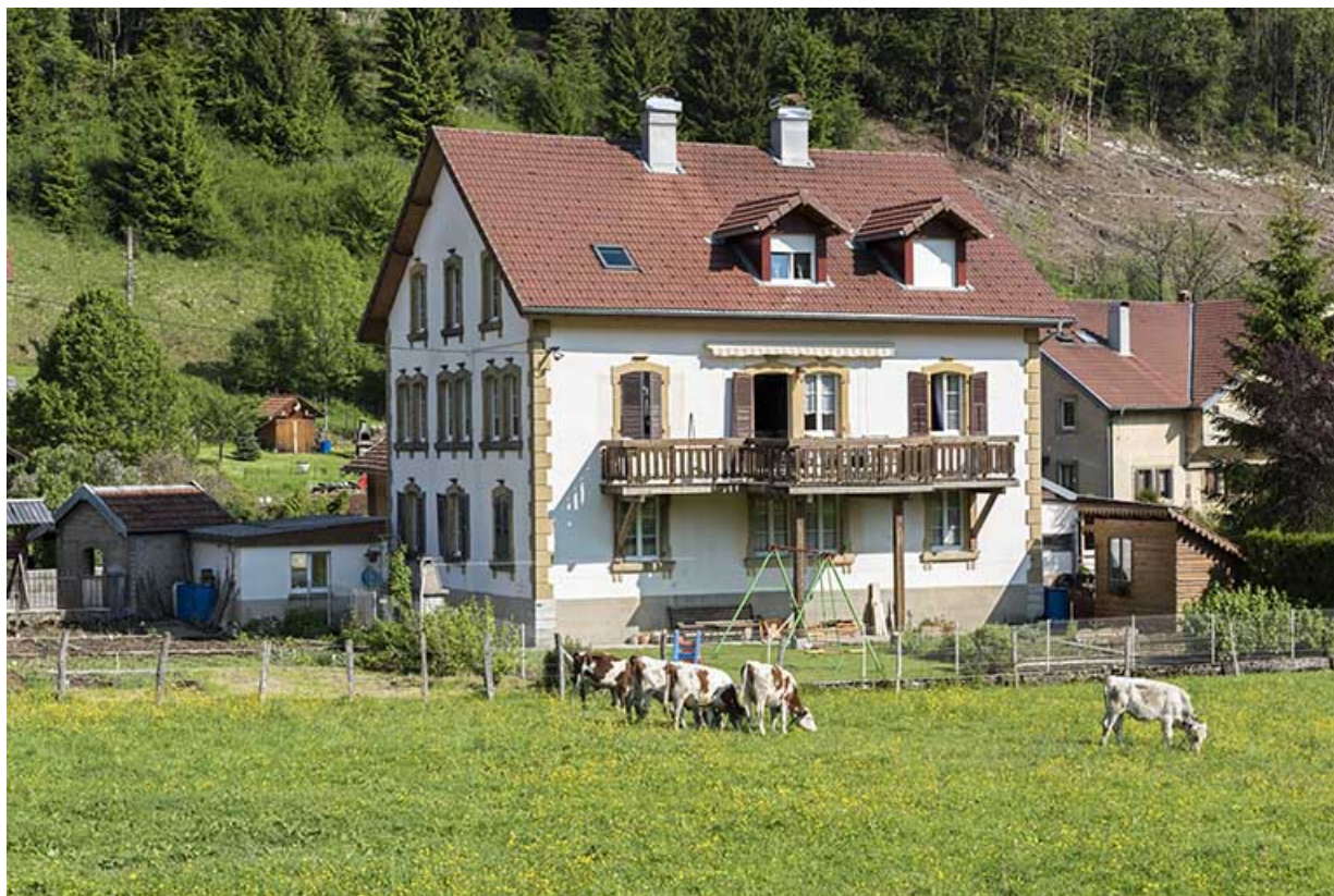
Façade postérieure, de trois quarts gauche. 25, Les Gras, 4 Grande Rue