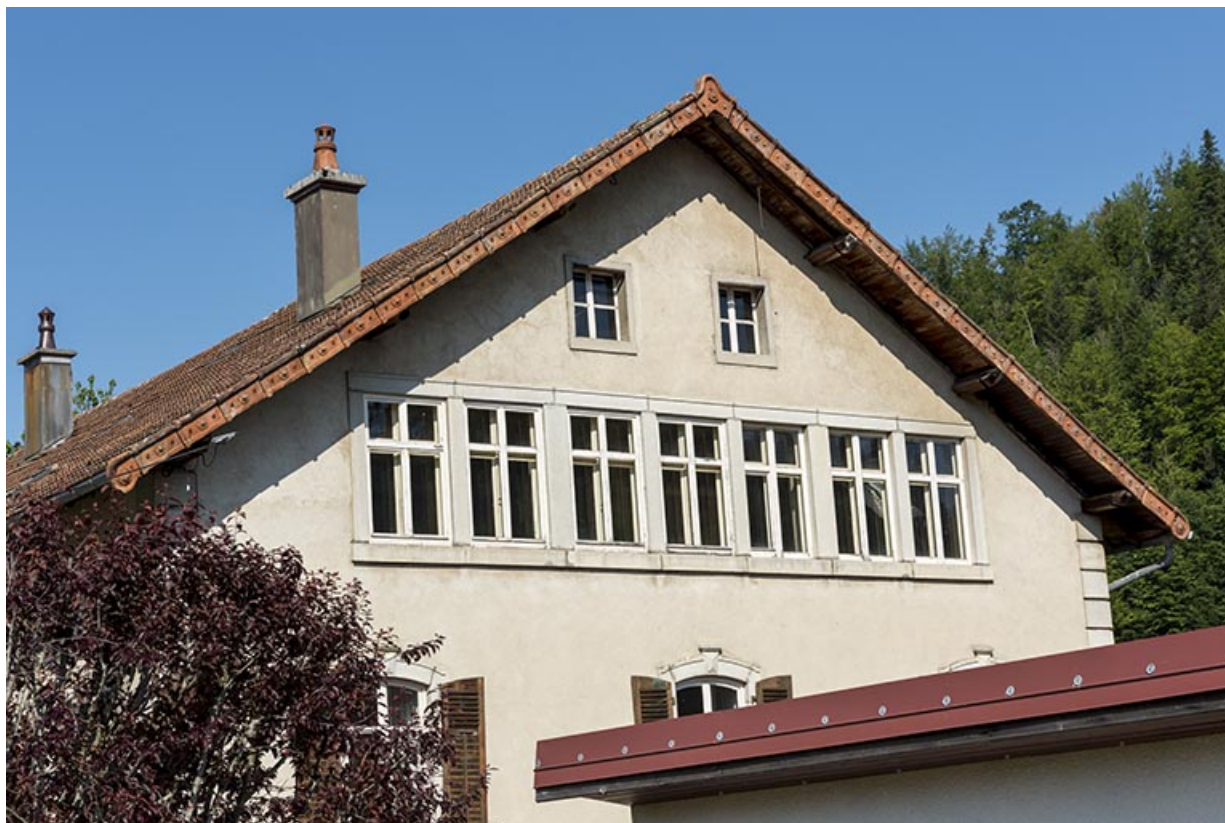
Maison, façade latérale droite : fenêtres multiples de l'atelier Moysse. 25, Les Gras, 1-5 rue des Jardins