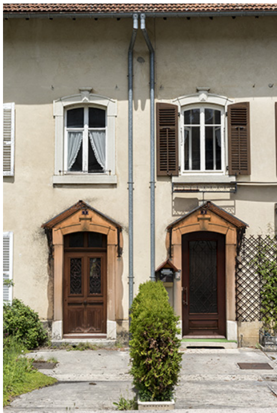
Maison, façade antérieure : travées centrales.