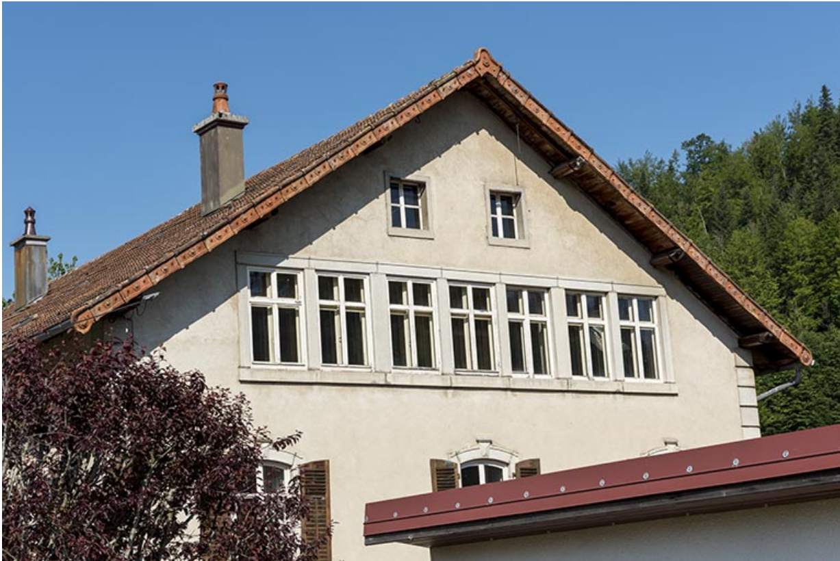
Maison, façade latérale droite : fenêtres multiples de l'atelier Moyse.