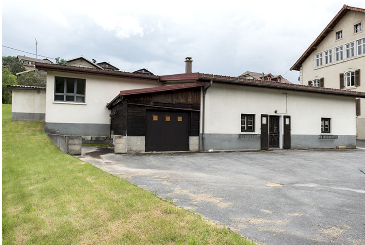
Atelier Moysse Outillage : façade postérieure, de trois quarts gauche. 25, Les Gras, 1-5 rue des Jardins