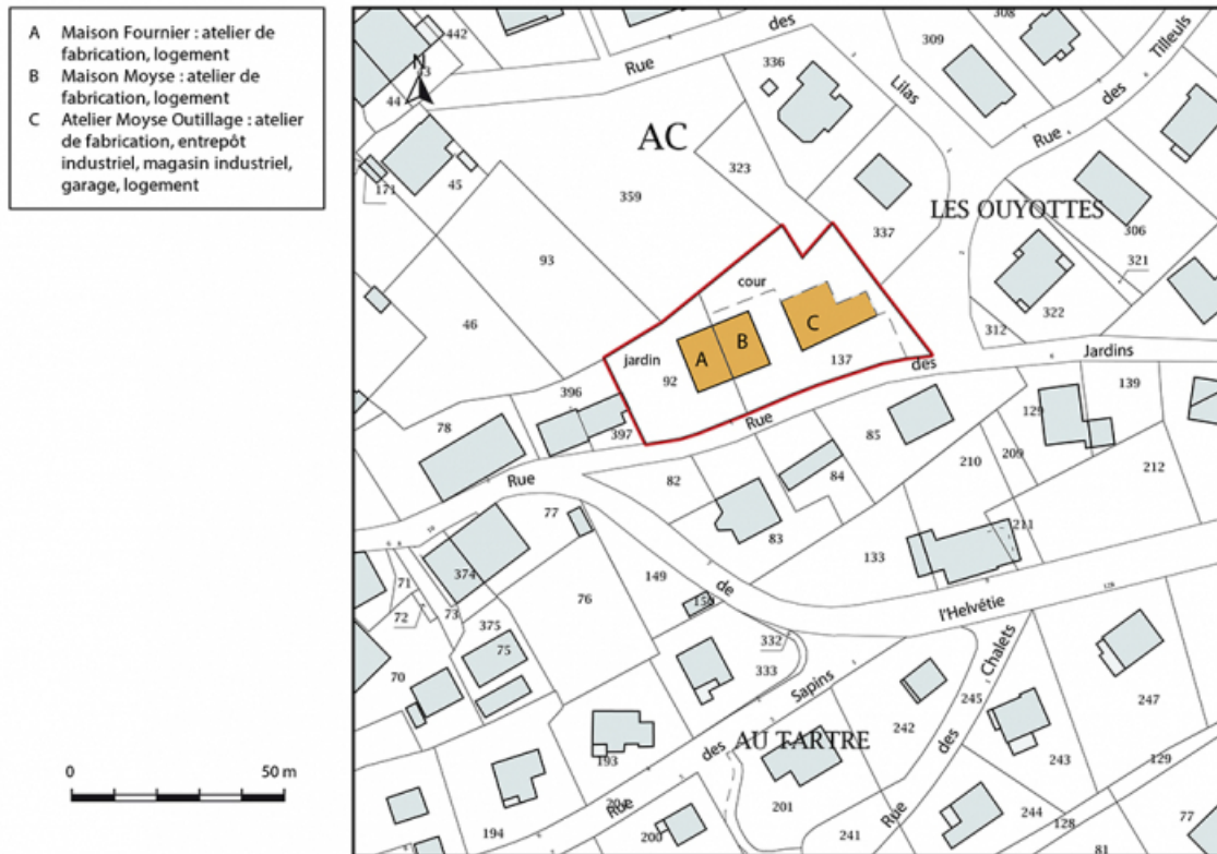
Plan-masse et de situation. Extrait du plan cadastral, 2017, section AC, 1/1 000. 25, Les Gras, 1-5 rue des Jardins