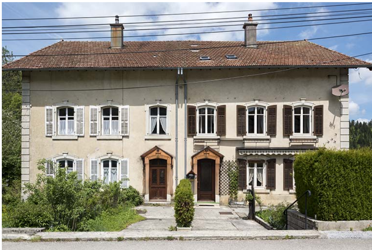
Maison : façade antérieure. Jules Fournier habitait à gauche (au n° 1), Jules Moysse à droite (n° 3). 25, Les Gras, 1-5 rue des Jardins