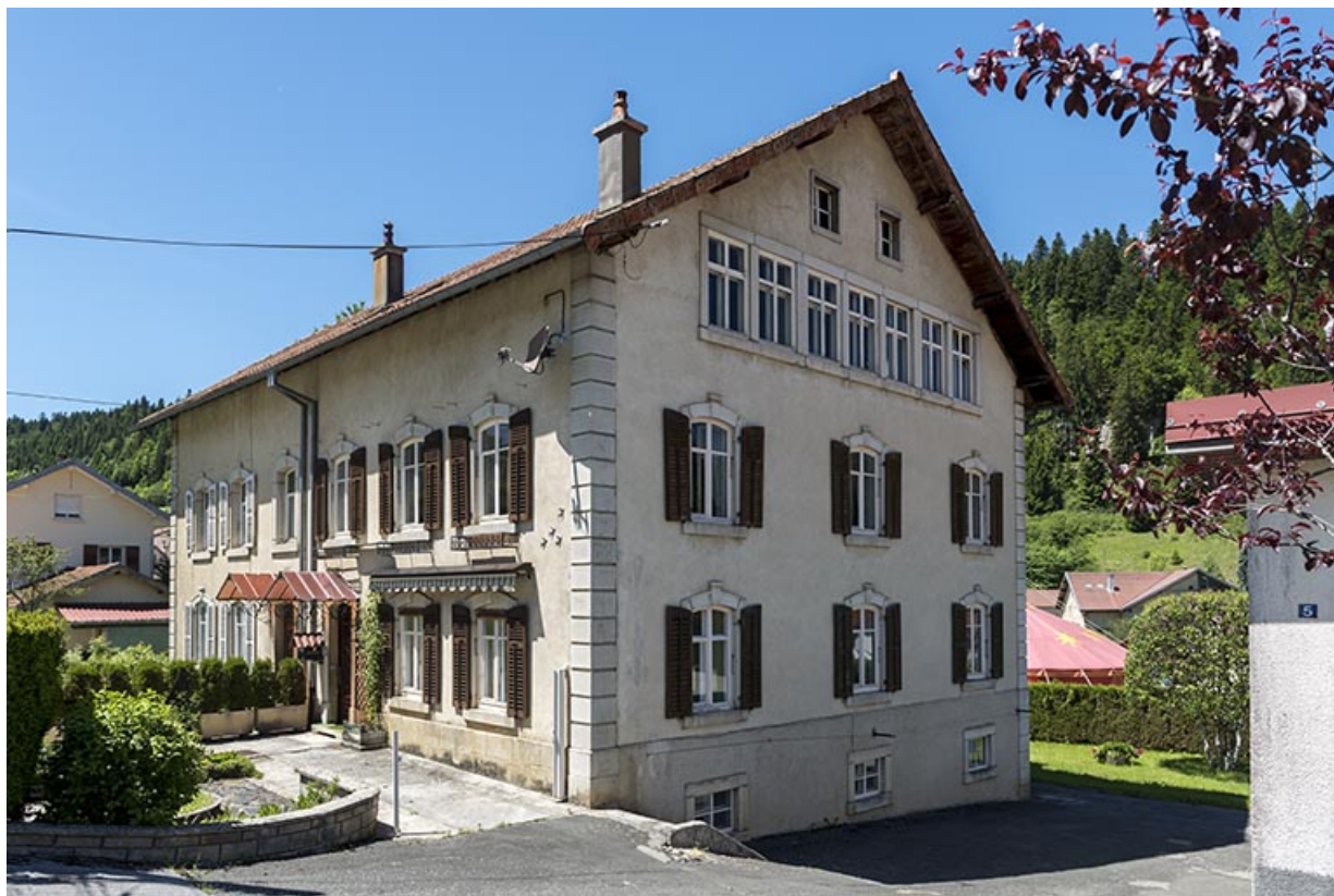
Un exemple unique de maison jumelée avec atelier d'outillage : le bâtiment de Jules Fournier et Jules Moysse (1912) par la suite Moysse Outillage, aux 1-5 rue des Jardins.