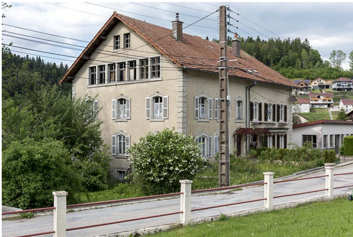
Maison : façades antérieure et latérale gauche.