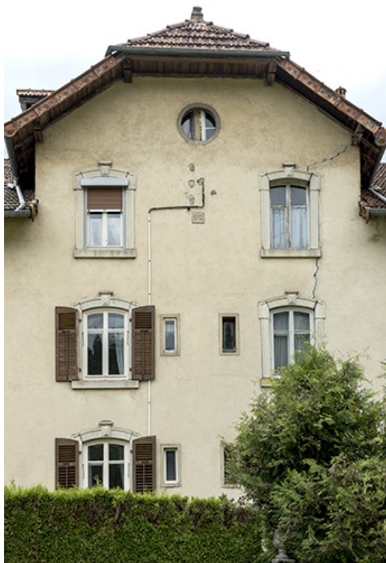
Maison, façade postérieure : travées centrales.