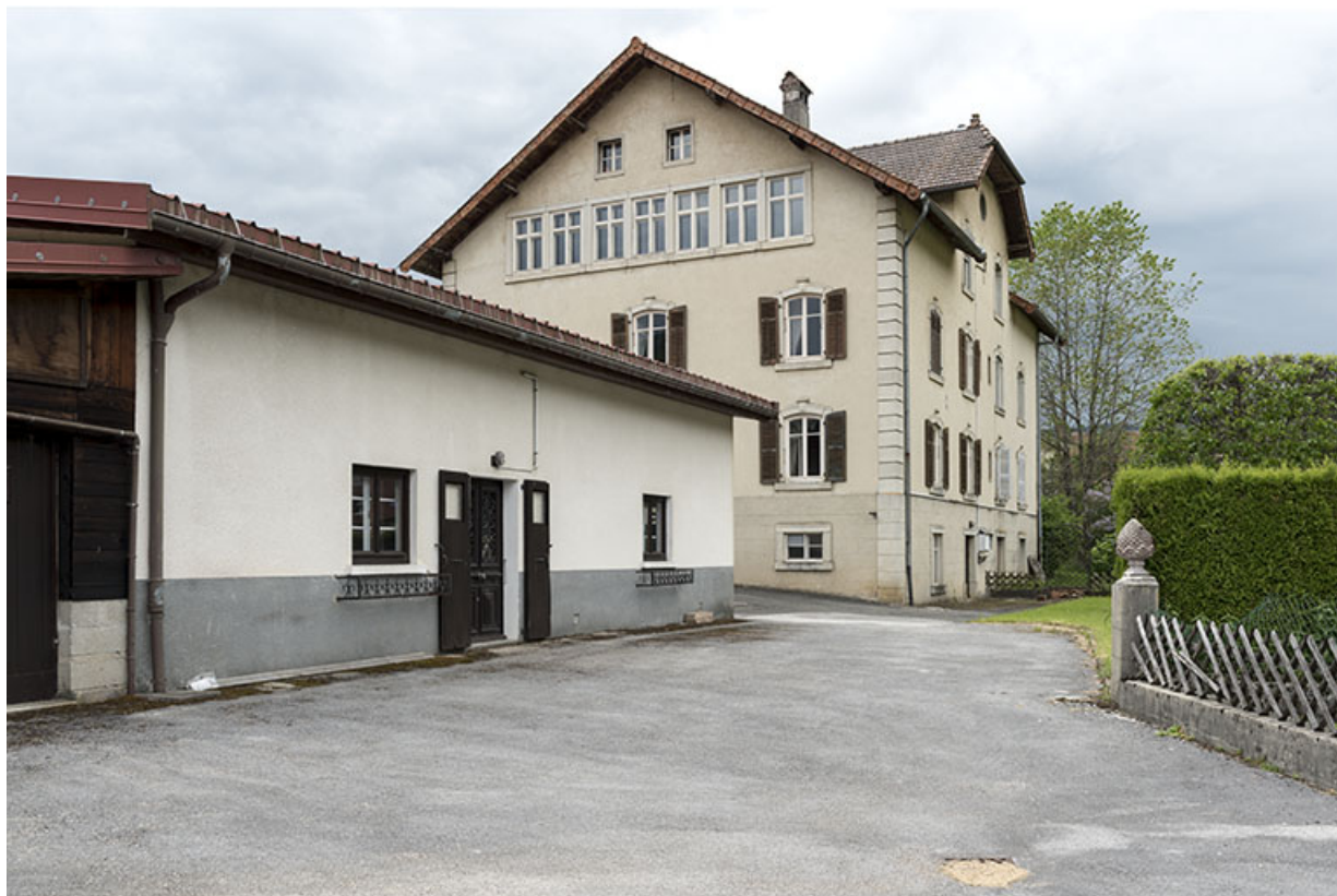
Maison : façades postérieure et latérale gauche. A gauche, la façade postérieure de l'atelier Moysse Outillage. 25, Les Gras, 1-5 rue des Jardins