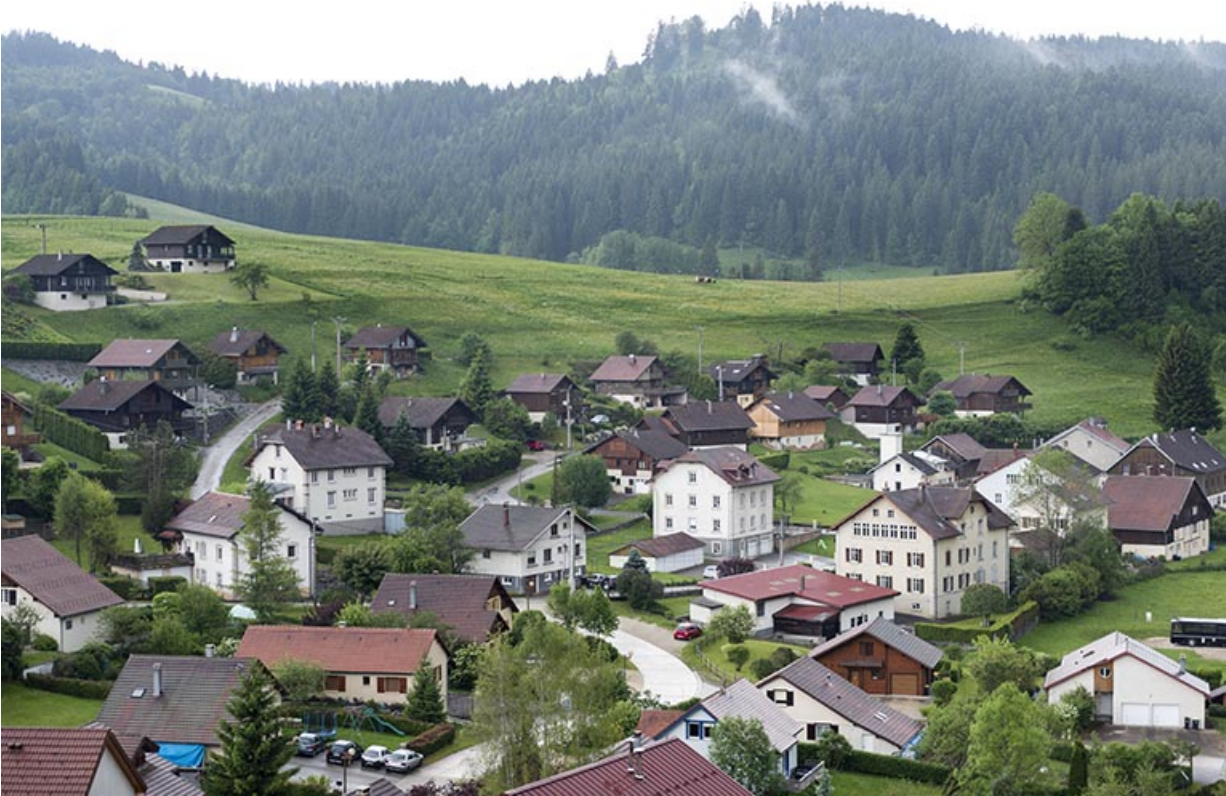
Vue d'ensemble du quartier de la rue des Jardins, depuis le nord-est.