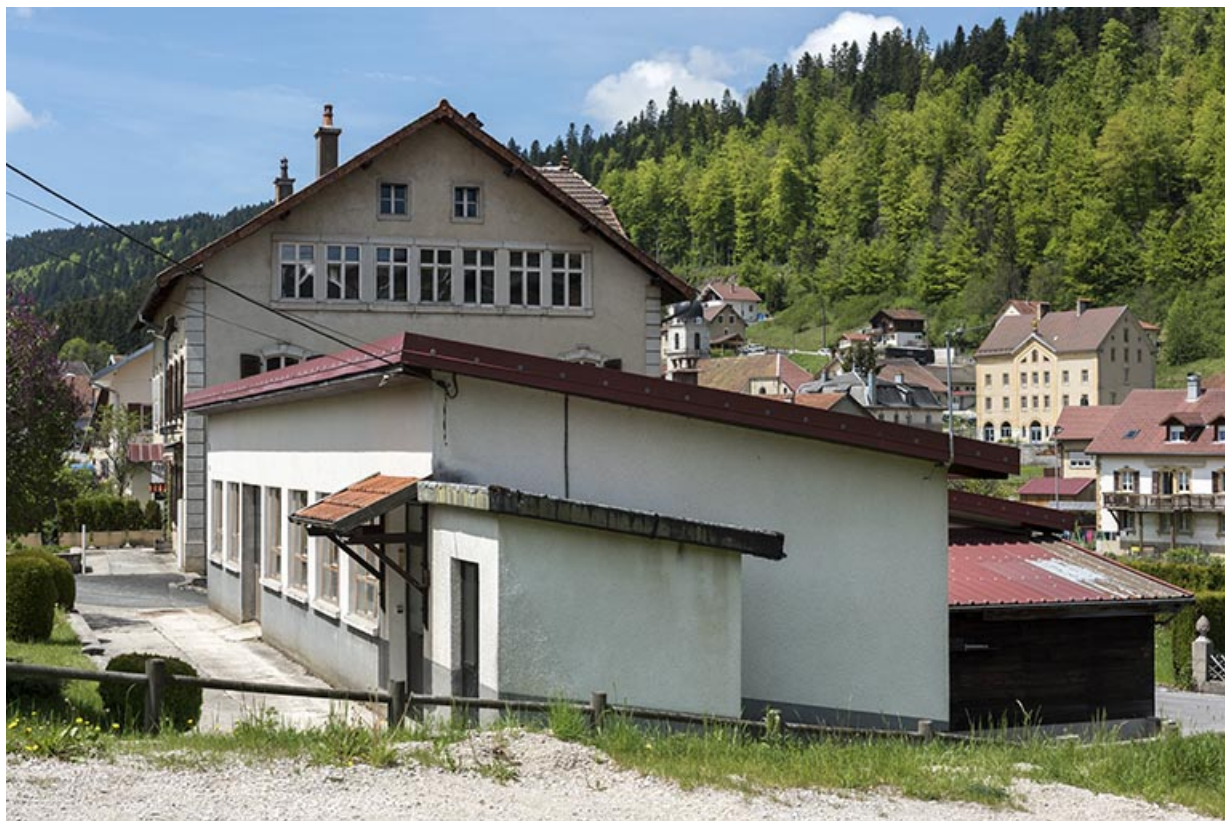
Atelier Moysse Outillage : façades antérieure et latérale droite. 25, Les Gras, 1-5 rue des Jardins