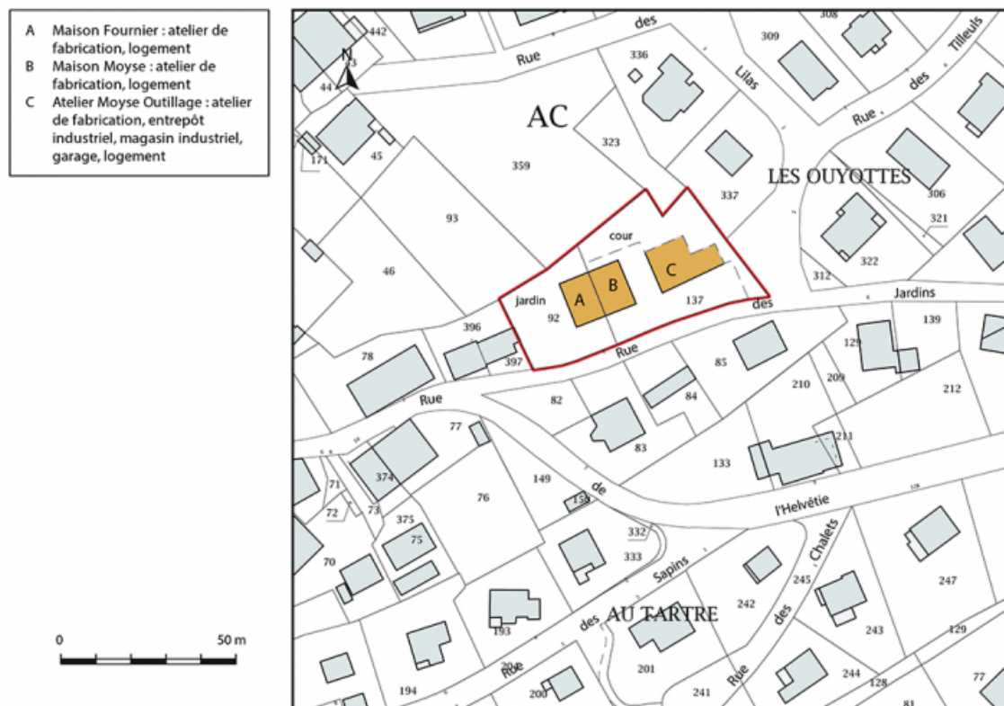
Plan-masse et de situation. Extrait du plan cadastral, 2017, section AC, 1/1 000. 25, Les Gras, 1-5 rue des Jardins