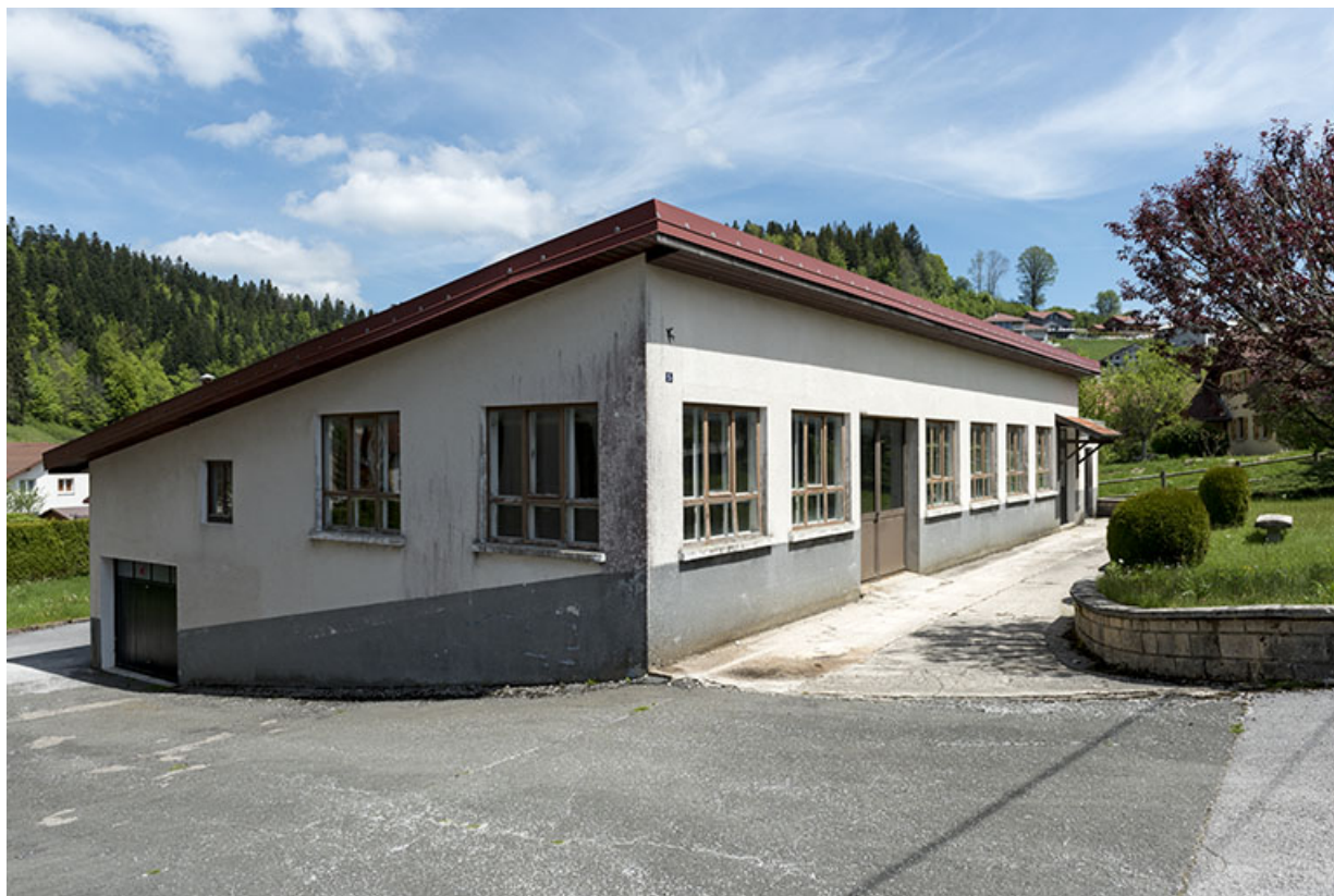
Atelier Moysse Outillage : façades antérieure et latérale gauche.