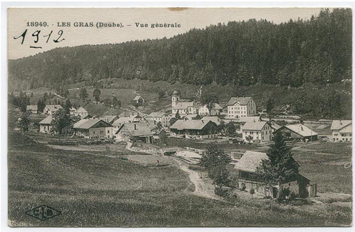
18949. - Les Gras (Doubs). - Vue générale [du village depuis le sud-est], [1911 ou 1912].