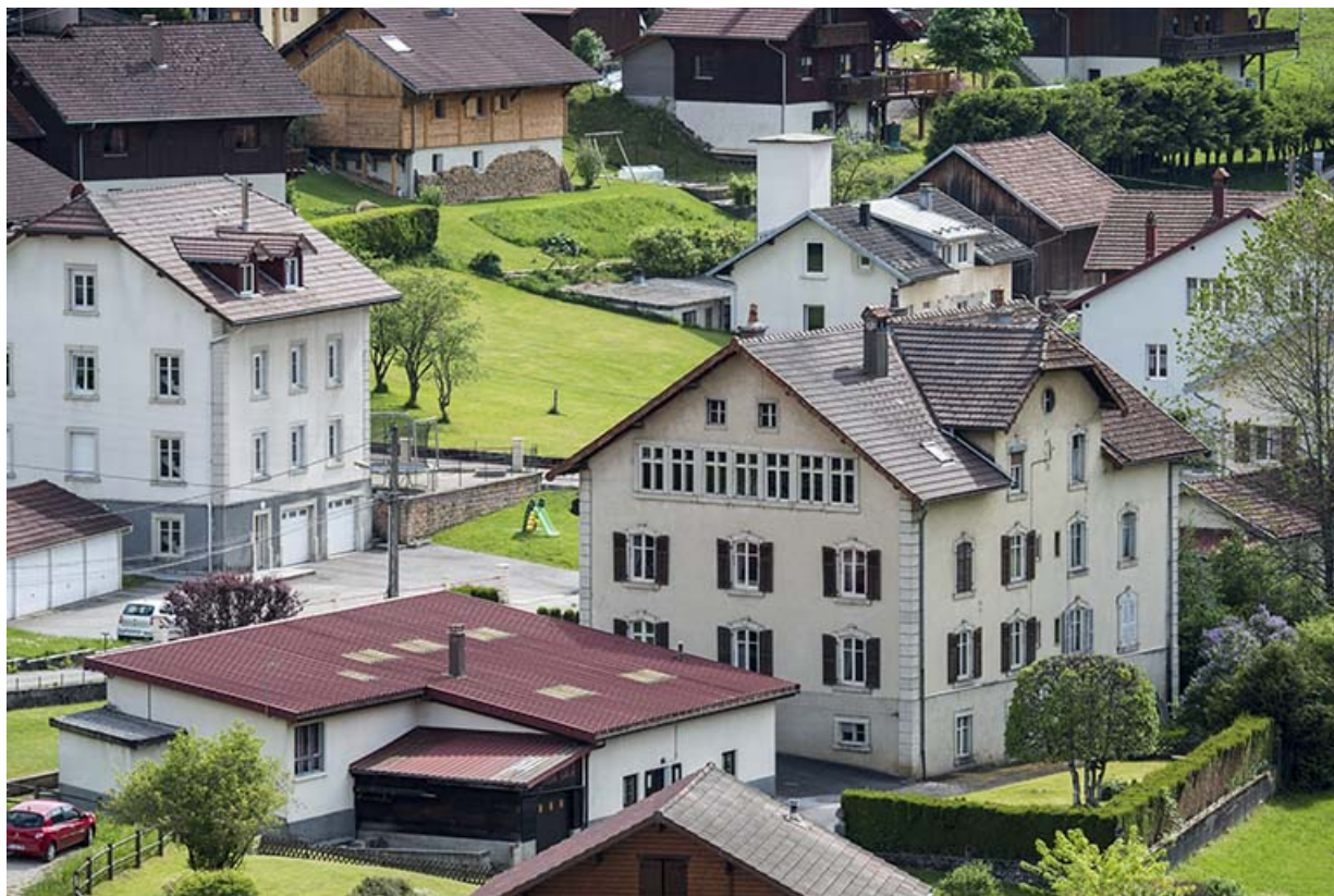
Vue d'ensemble plongeante, depuis le nord-est : atelier à gauche, maison à droite. 25, Les Gras, 1-5 rue des Jardins