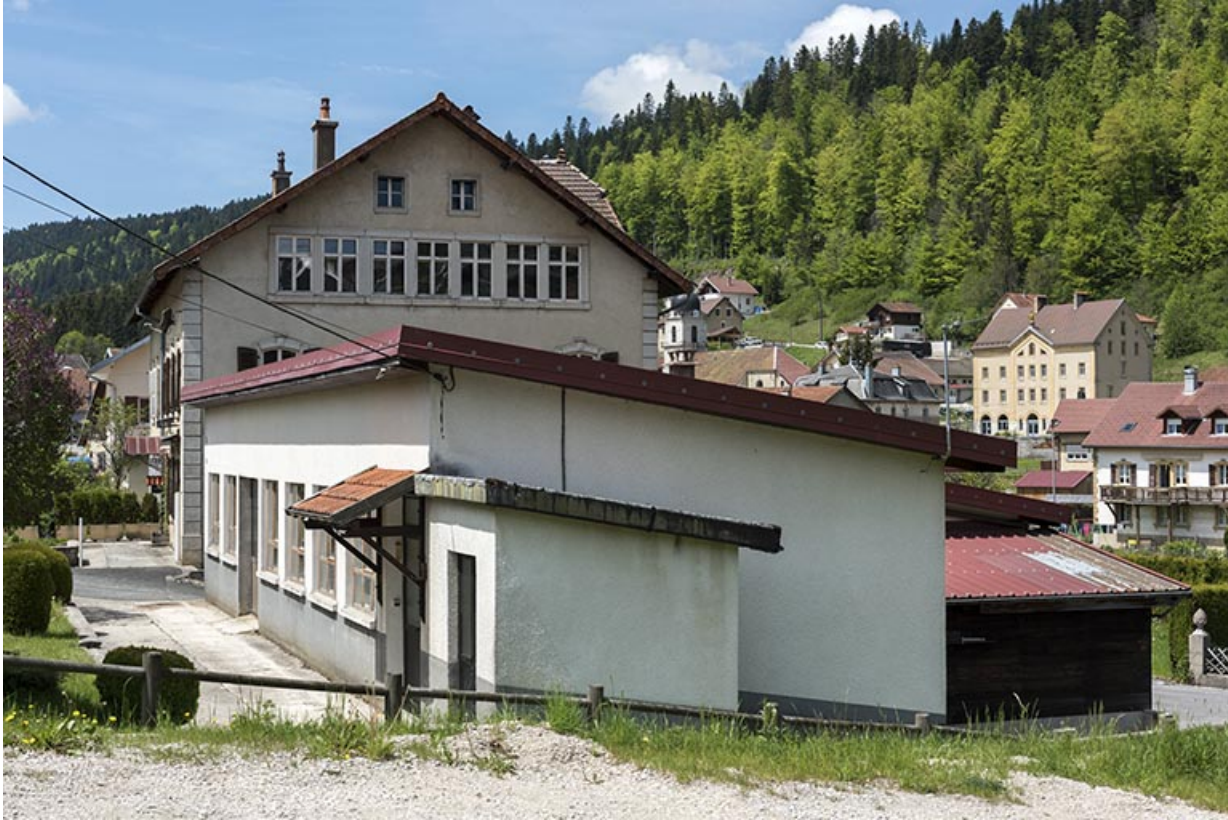
Atelier Moyse Outillage : façades antérieure et latérale droite.