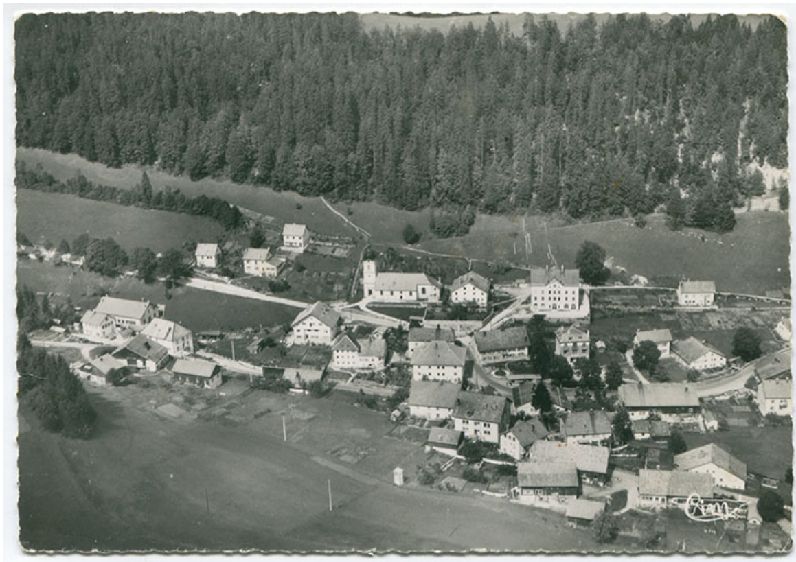
Les Gras (Doubs). 22157 A - Vue aérienne [le village vu du sud], 2e quart 20e siècle [après 1930]. 25, Les Gras, 3 rue de Pontarlier