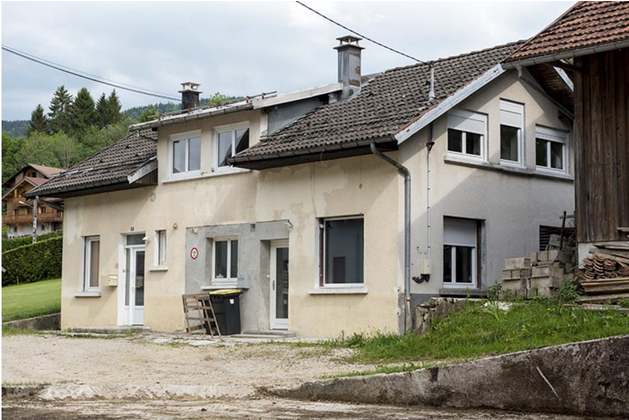
Atelier : façades antérieure et latérale droite.