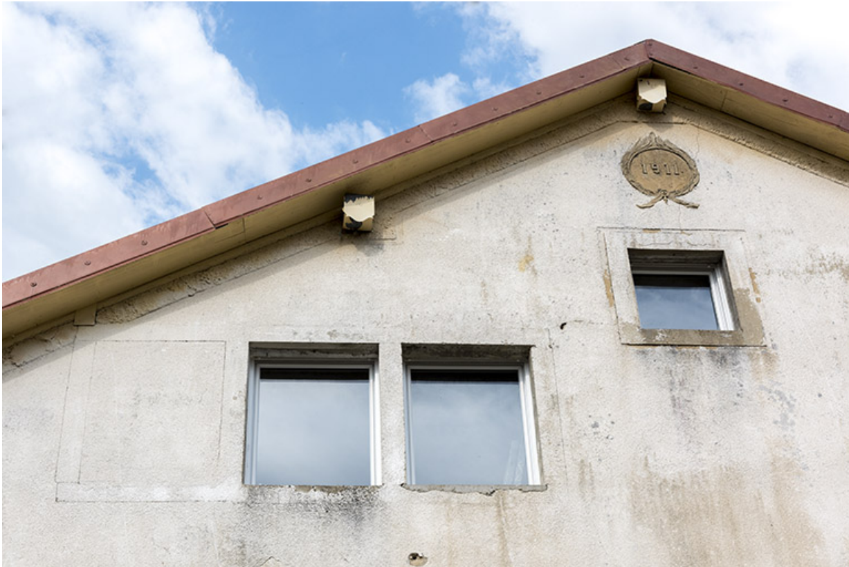
Bâtiment d'origine, façade latérale droite : baie multiple et date.