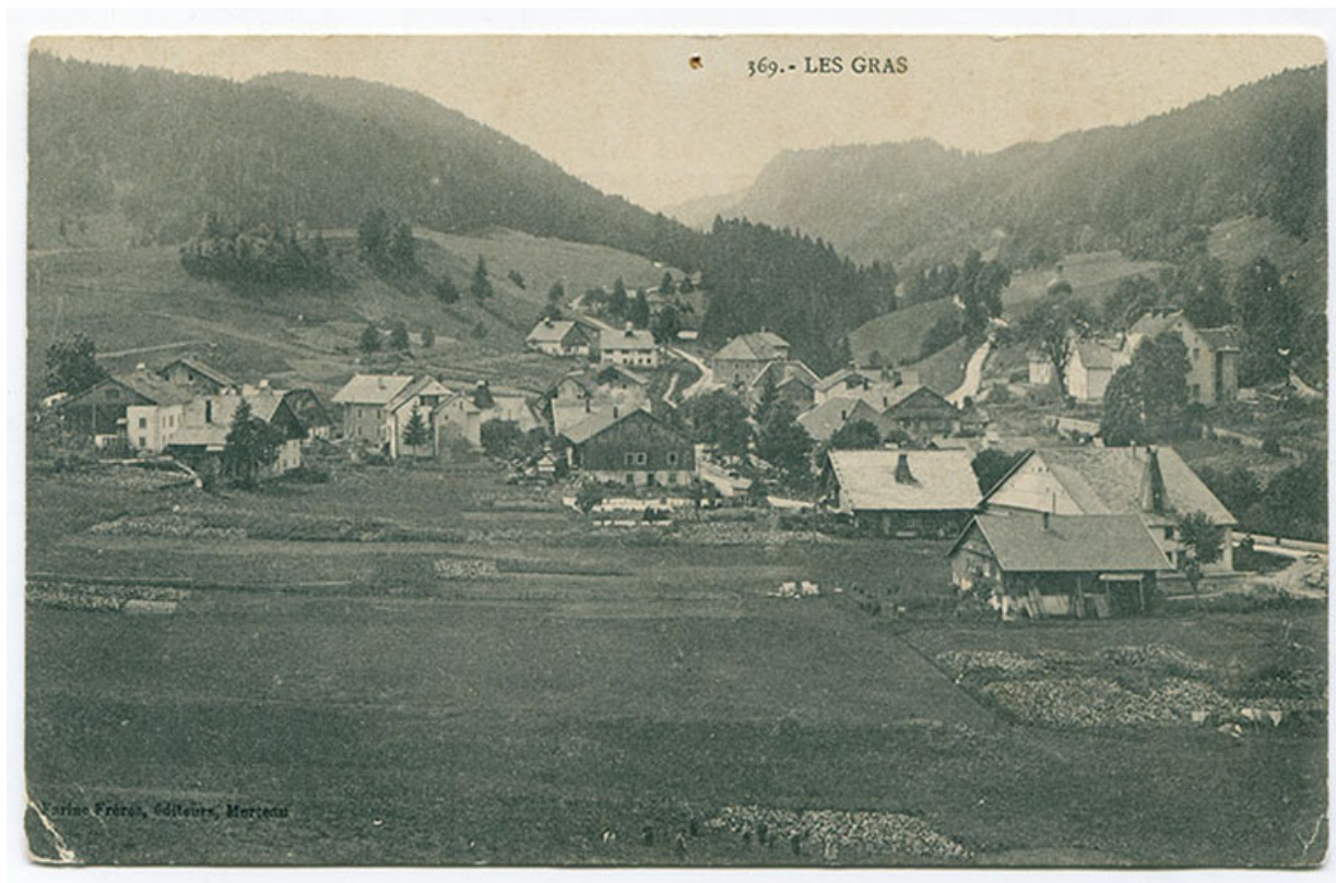
369. - Les Gras [vue d'ensemble du village, depuis le nord-est], 1er quart 20e siècle [entre 1908 et 1917]. 25, Les Gras, 8-10 rue de l' Helvétie

369. - Les Gras [vue d'ensemble du village, depuis le nord-est], carte postale, s.n., [1er quart 20e siècle, entre 1908 et 1917], Farine Frères éd. à Morteau. Porte la date 23 mars 1917 (manuscrite) au verso.