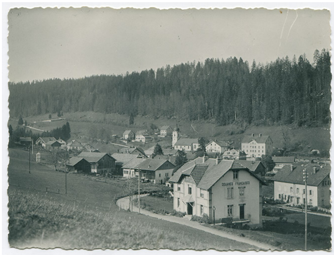
[Vue d'ensemble du village, depuis l'est], 23 octobre 1950. 25, Les Gras