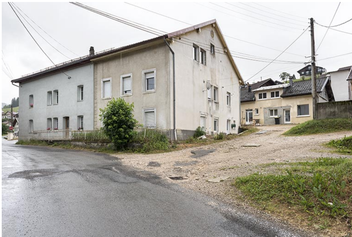
Vue d'ensemble, depuis le nord-ouest. Bâtiment d'origine à gauche (la partie de la famille Baron est en beige) et atelier à l'arrière-plan à droite.