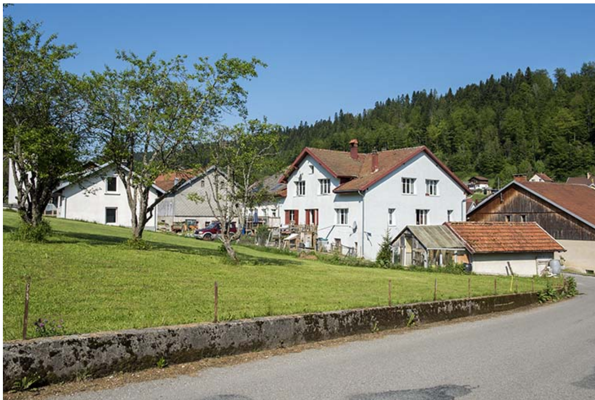
Vue d'ensemble du site, depuis l'est. Pignon de l'atelier à gauche, bâtiment d'origine à droite (la partie acquise par la famille Baron est partiellement masquée par un arbre).