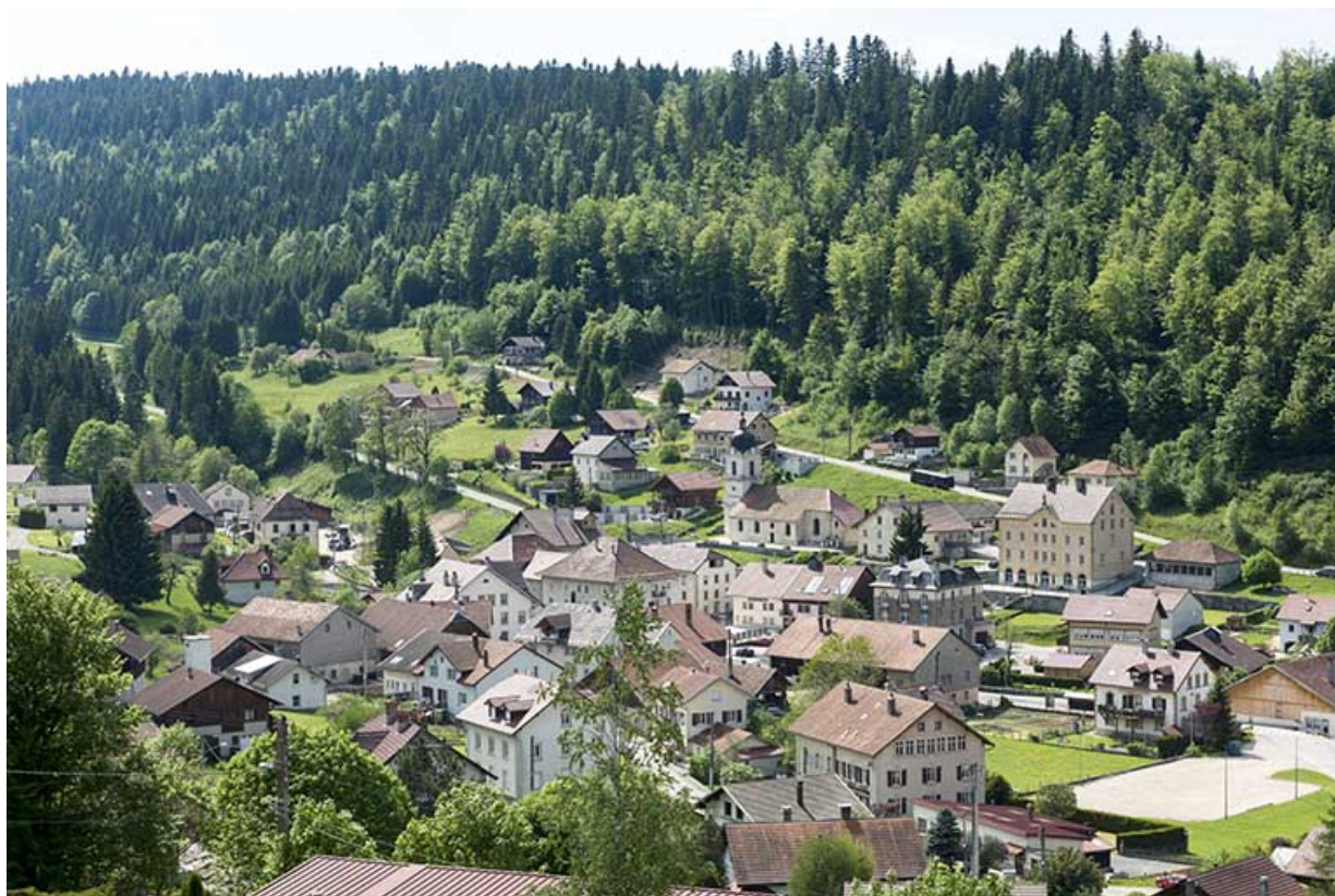
Vue d'ensemble du village, depuis l'est. 25, Les Gras