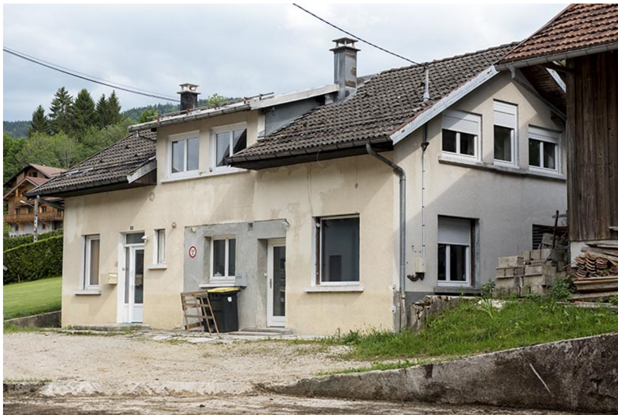
Atelier : façades antérieure et latérale droite. 25, Les Gras, 8-10 rue de l' Helvétie