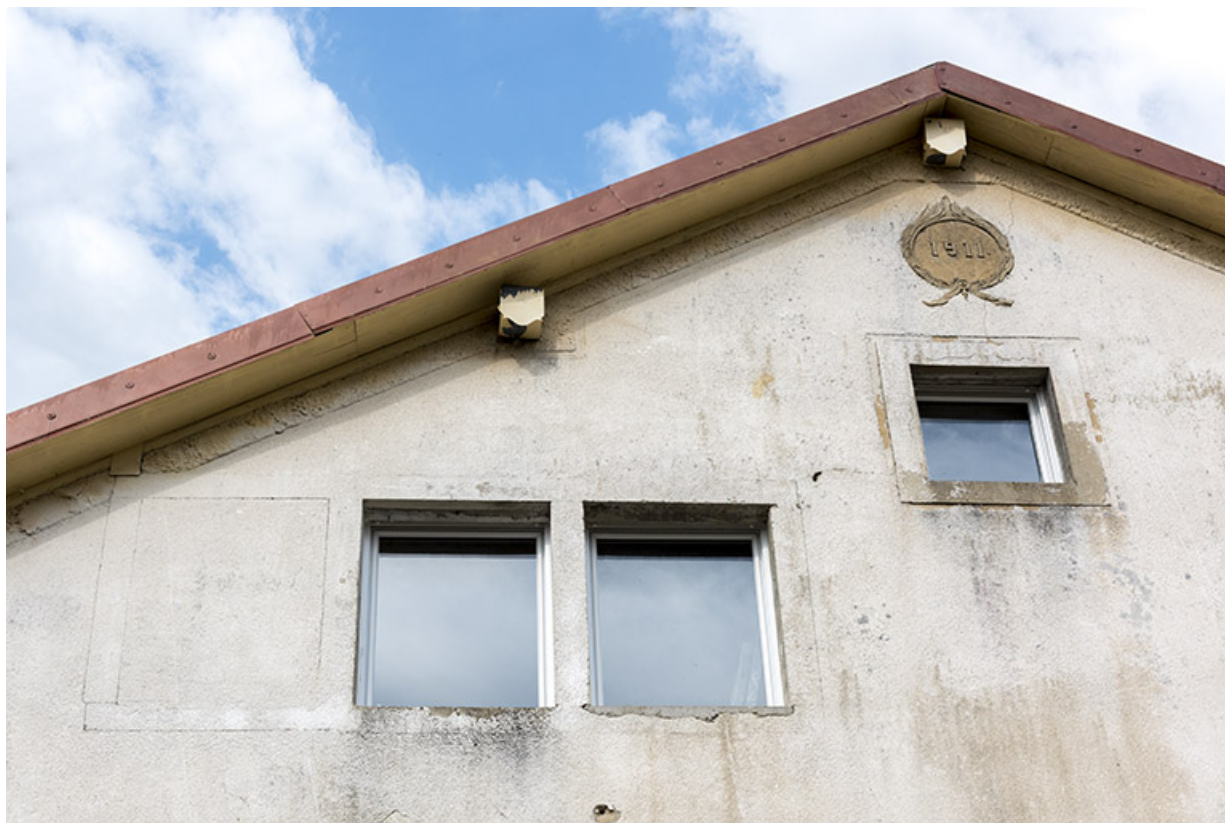
Bâtiment d'origine, façade latérale droite : baie multiple et date. 25, Les Gras, 8-10 rue de l' Helvétie