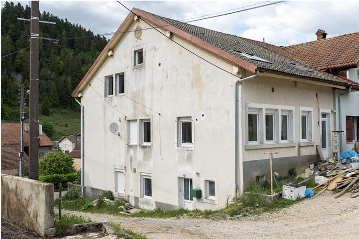
Bâtiment d'origine : façades postérieure et latérale droite.