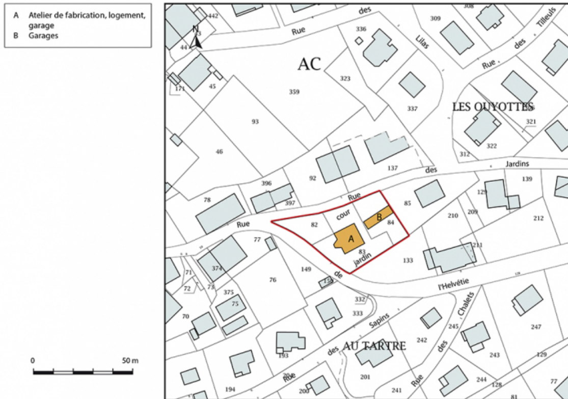
Plan-masse et de situation. Extrait du plan cadastral, 2017, section AC, 1/1 000. 25, Les Gras, 7 rue de l' Helvétie