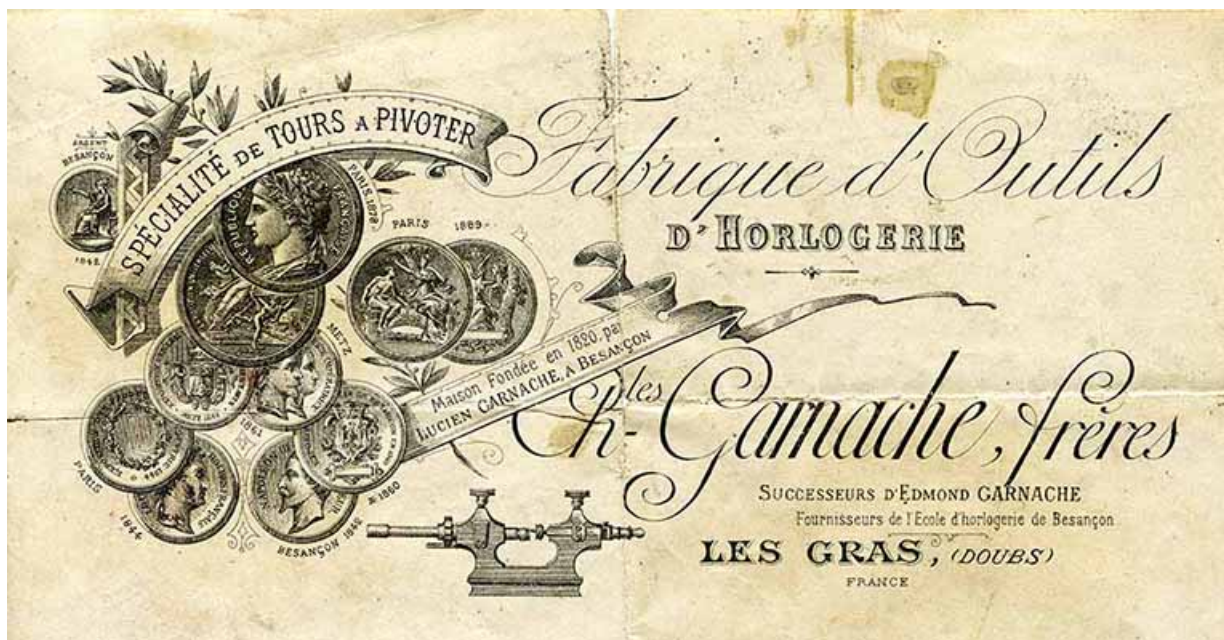
Prix courant de la société Charles Garnache Frères [détail de l'en-tête], s.d. [limite 19e siècle 20e siècle]. 25, Besançon