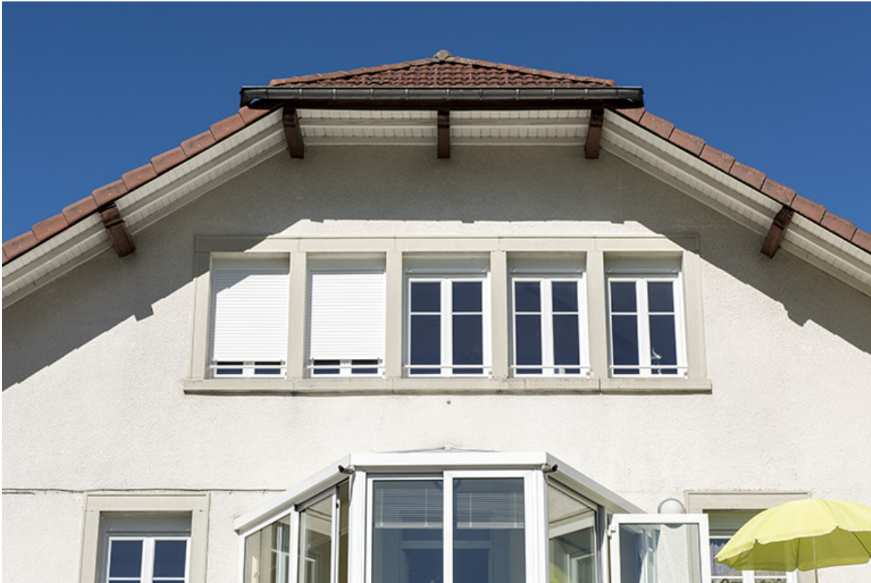
Fenêtres multiples sur la façade antérieure.