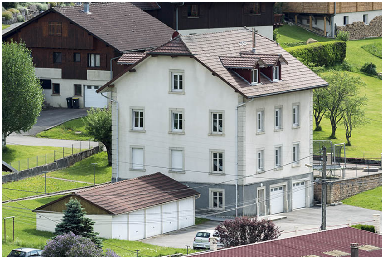
Façades postérieure et latérale gauche. 25, Les Gras, 7 rue de l' Helvétie