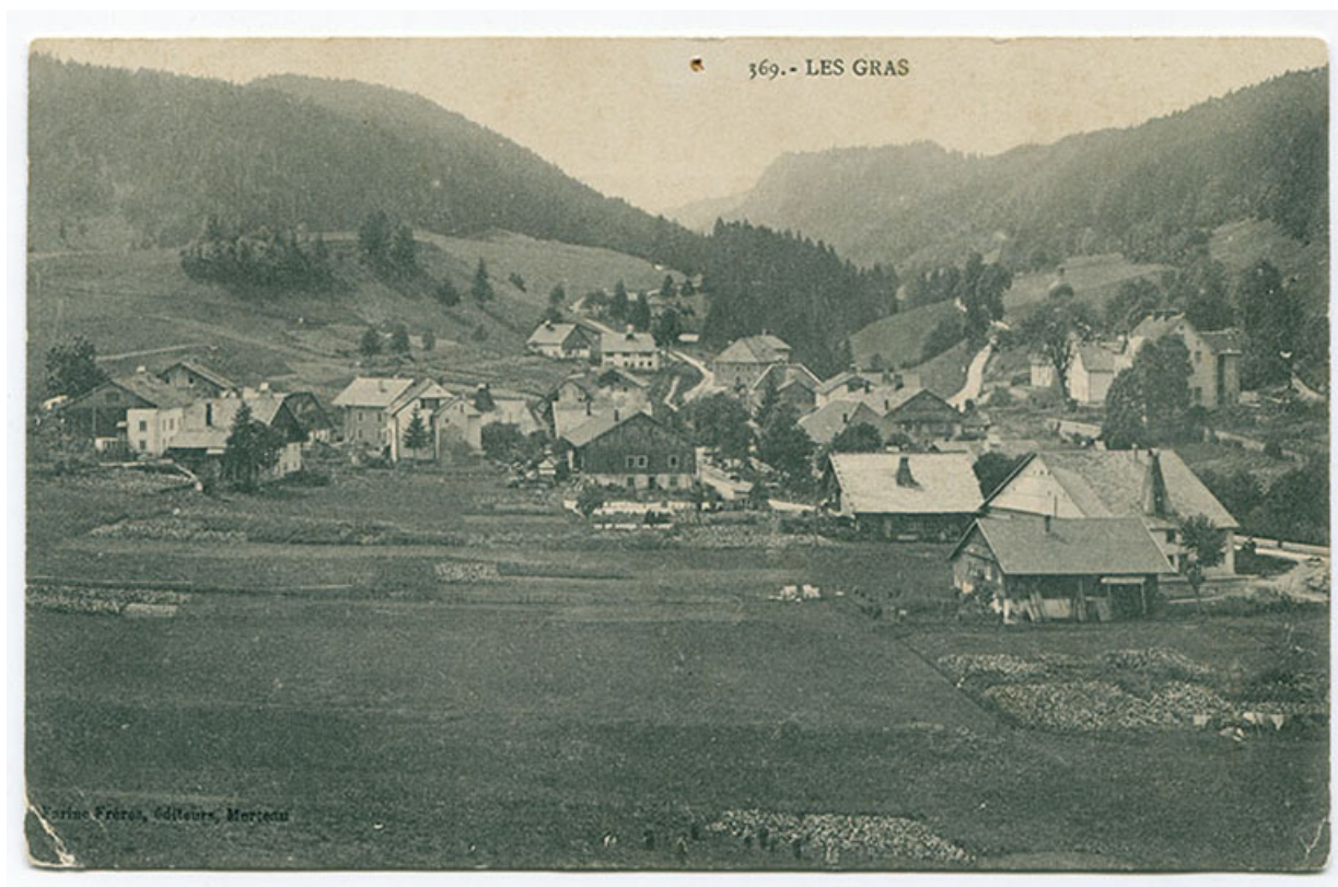
369. - Les Gras [vue d'ensemble du village, depuis le nord-est], 1er quart 20e siècle [entre 1908 et 1917]. 25, Les Gras, 8-10 rue de l' Helvétie