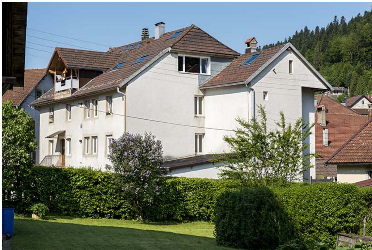
Façades antérieure et latérale droite.