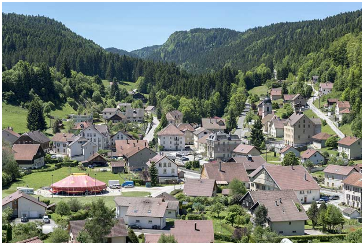
Vue d'ensemble du village, depuis le nord-est. 25, Les Gras