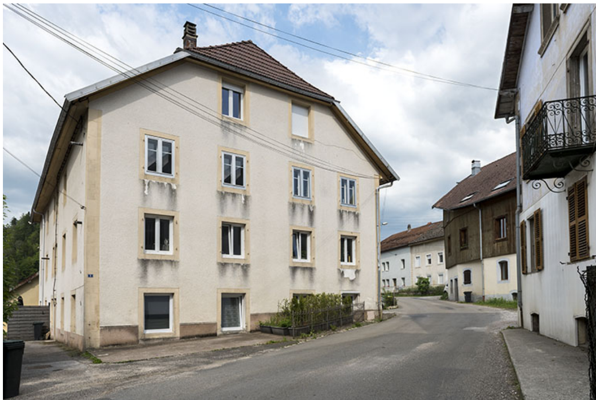
Façade latérale gauche (sud). 25, Les Gras, 1 rue de l' Helvétie