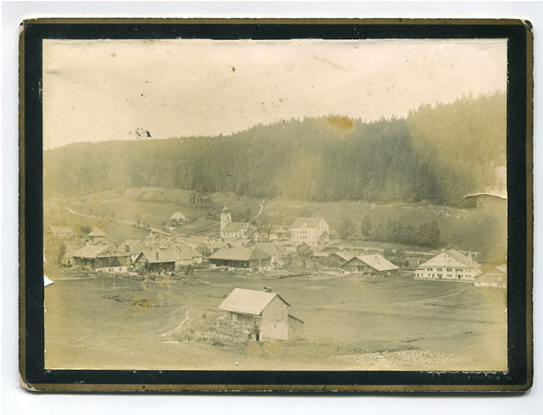
[Vue d'ensemble du village, depuis la route de La Brévine, à l'est], limite 19e siècle 20e siècle [avant 1910]. 25, Les Gras