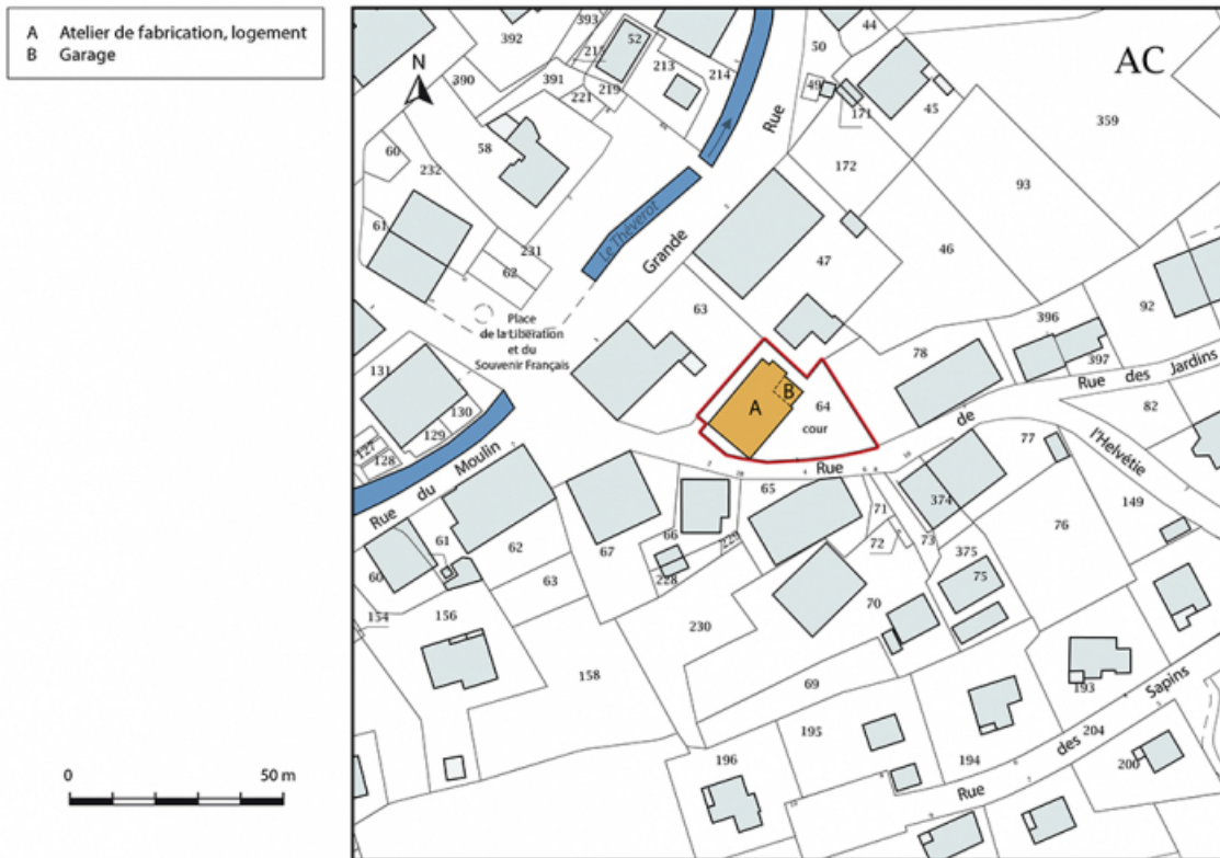
Plan-masse et de situation. Extrait du plan cadastral, 2017, section AC, 1/1 000. 25, Les Gras, 1 rue de l' Helvétie