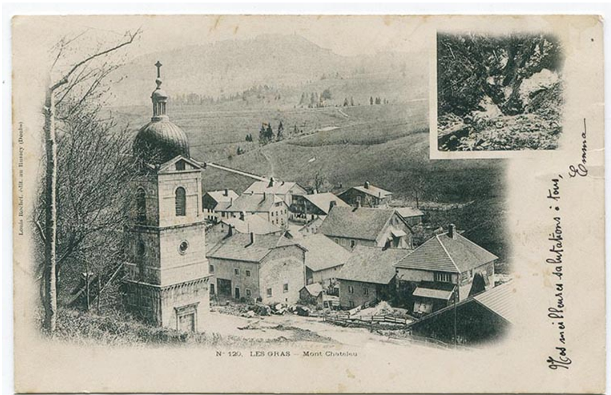
N° 120. Les Gras - Mont Châteleu, 4e quart 19e siècle. 25, Les Gras