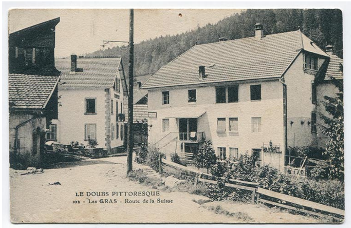
Le Doubs pittoresque. 102 - Les Gras - Route de la Suisse, 1er quart 20e siècle [avant 1916]. 25, Les Gras, 1 rue de l' Helvétie