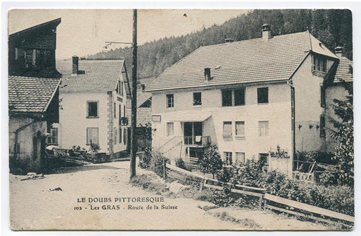
Le Doubs pittoresque. 102 - Les Gras - Route de la Suisse, 1er quart 20e siècle [avant 1916]. 25, Les Gras, 1 rue de l' Helvétie