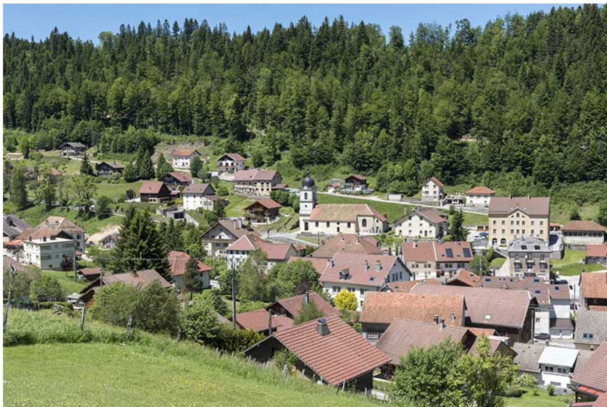
Vue d'ensemble du centre du village, depuis l'est. 25, Les Gras