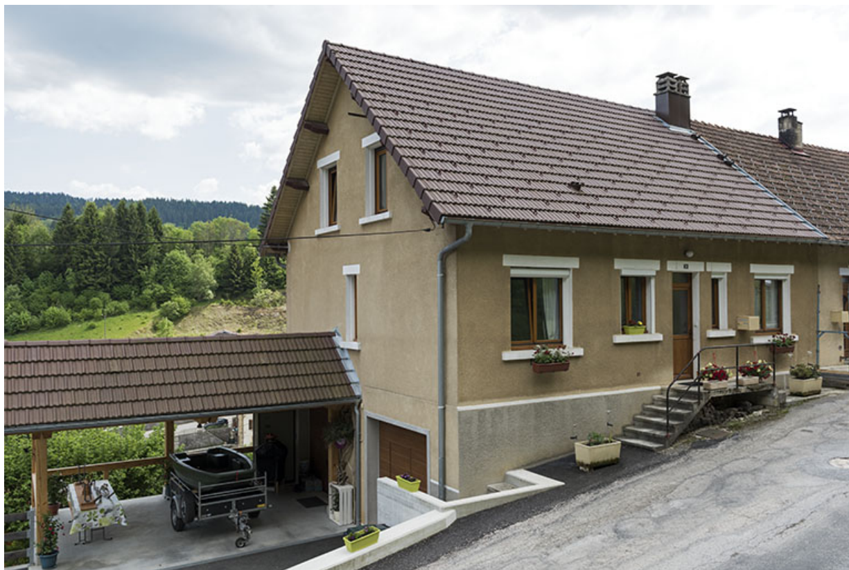
Façade antérieure, de trois quarts gauche.