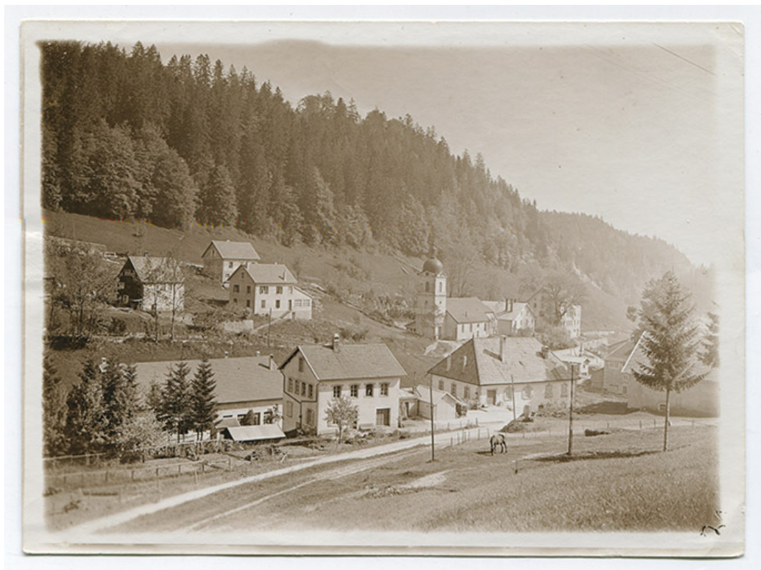
[Vue d'ensemble du centre du village, depuis le sud-ouest], 25 mai 1934. 25, Les Gras