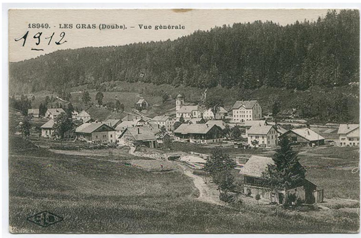
18949. - Les Gras (Doubs). - Vue générale [du village depuis le sud-est], [1911 ou 1912]. 25, Les Gras