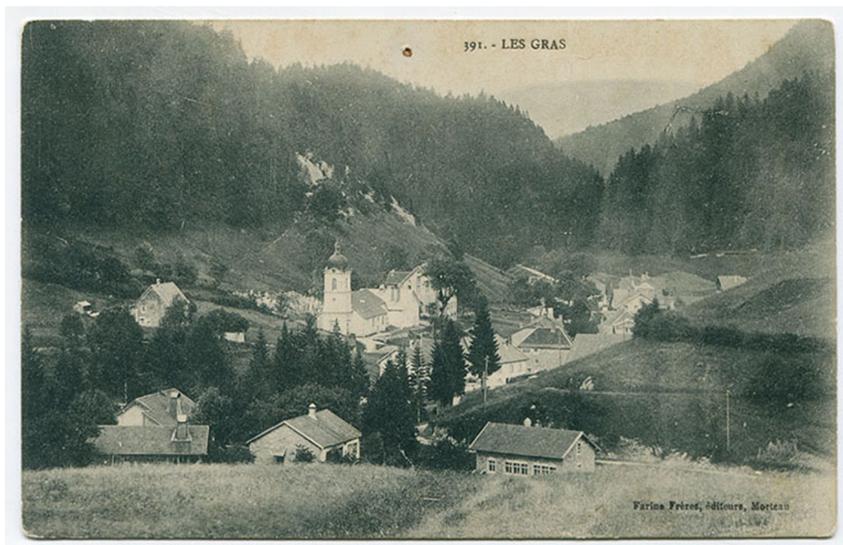
391. - Les Gras [les Epaisses et le quartier de l'église vus du sud], 1er quart 20e siècle [entre 1908 et 1916]. La maison est visible au centre, l'atelier à droite.