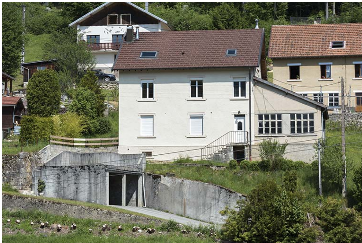
Un exemple de maison avec atelier adjacent : celle de Georges Mathey (vers 1932), au 4 rue de Pontarlier. 25, Les Gras