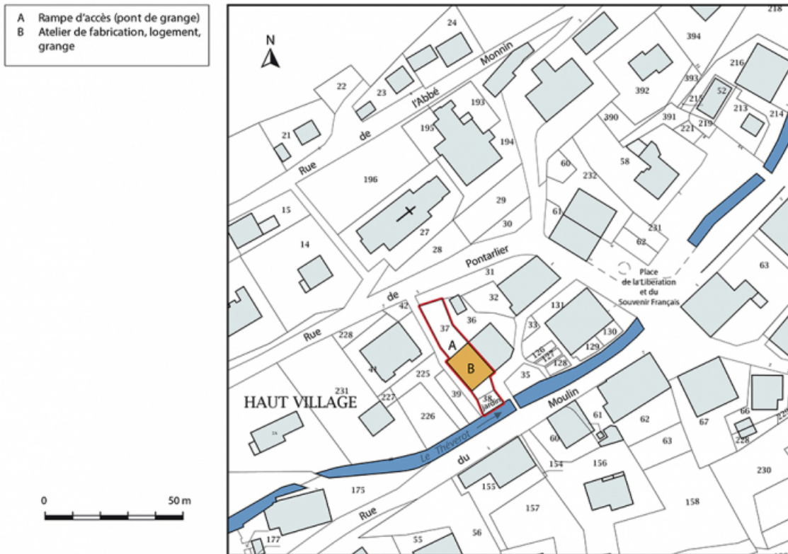
Plan-masse et de situation. Extrait du plan cadastral, 2017, section AB, 1/1 000. 25, Les Gras, 5 rue de Pontarlier