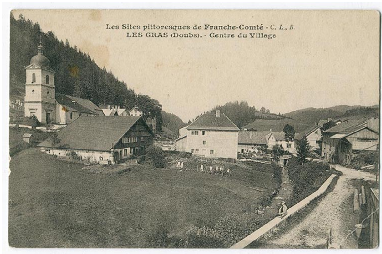
Les sites pittoresques de Franche-Comté. Les Gras (Doubs). - Centre du village, 1er quart 20e siècle. 25, Les Gras, 5 rue de Pontarlier