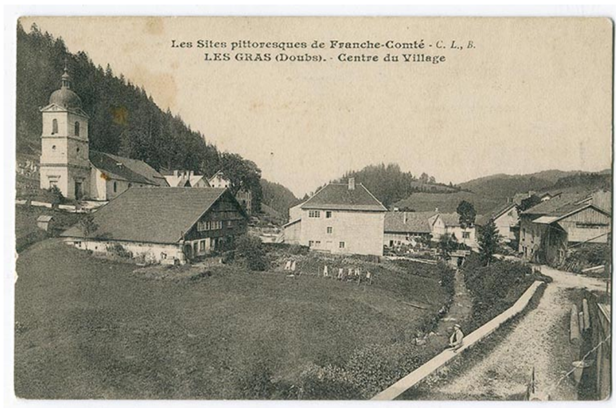
Les sites pittoresques de Franche-Comté. Les Gras (Doubs). - Centre du village, 1er quart 20e siècle. 25, Les Gras, 5 rue de Pontarlier