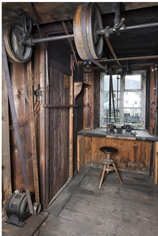
L'atelier : partie gauche, dédiée au polissage. 25, Les Gras, 5 rue de Pontarlier