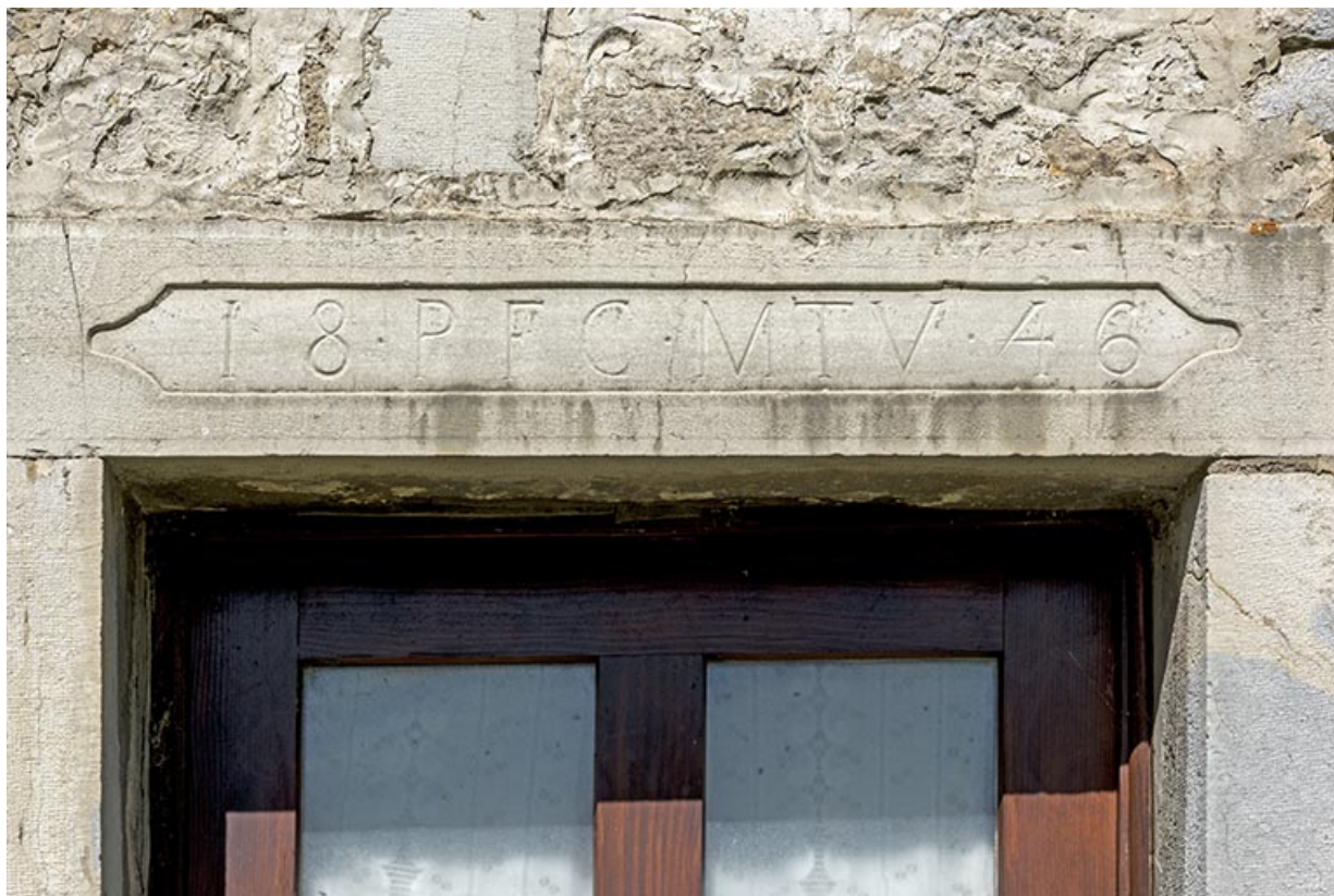
Façade occidentale : linteau daté 1846.