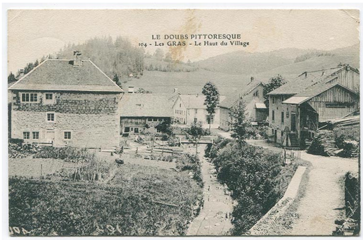
Le Doubs pittoresque. 104 - Les Gras - Le haut du village, 1er quart 20e siècle [avant 1914].