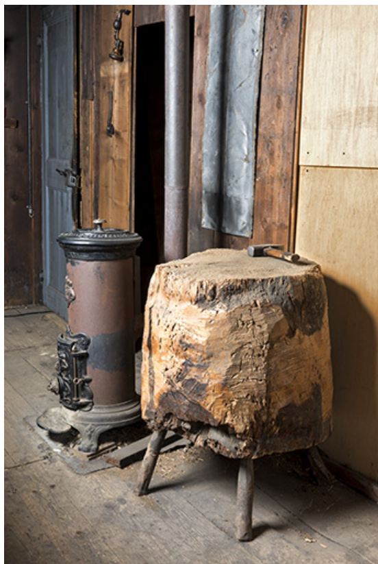
L'atelier : poêle et "tas" en bois pour redresser les calibres. 25, Les Gras, 5 rue de Pontarlier