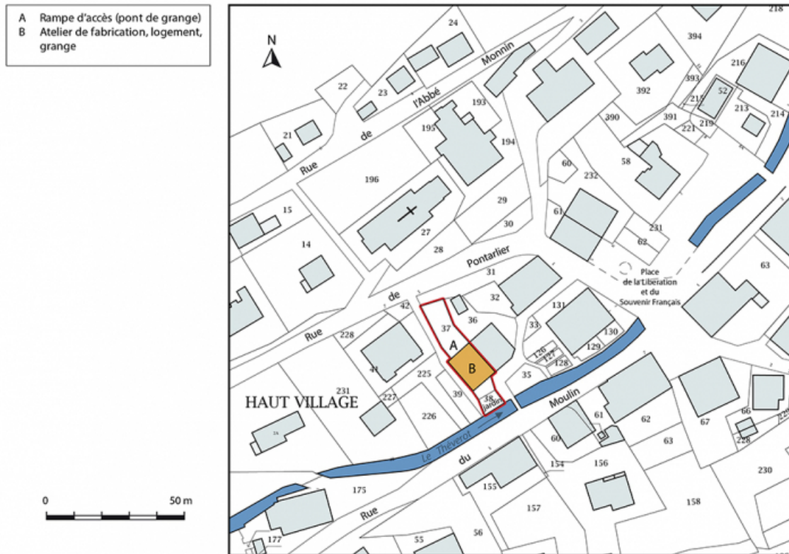
Plan-masse et de situation. Extrait du plan cadastral, 2017, section AB, 1/1 000. 25, Les Gras, 5 rue de Pontarlier