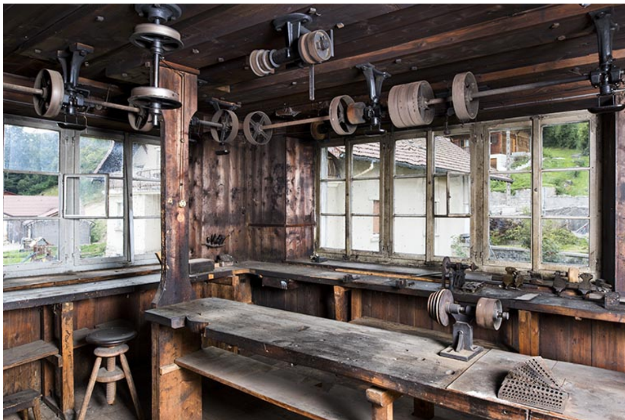
L'atelier, avec ses établis et ses transmissions.