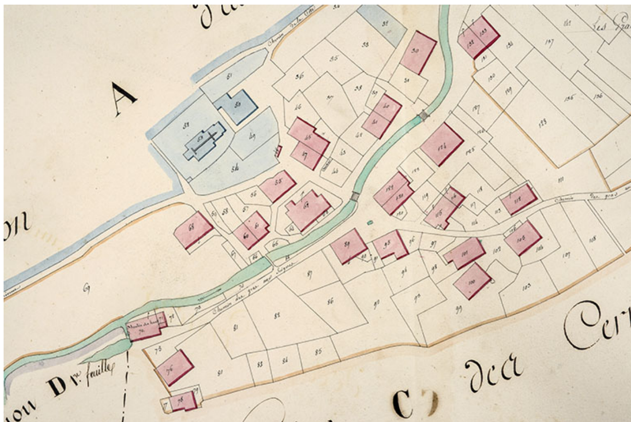
Cadastré de la commune des Gras. Atlas parcellaire, 1816, section E [détail : quartier du moulin du Haut et centre du village], 1/1 250.