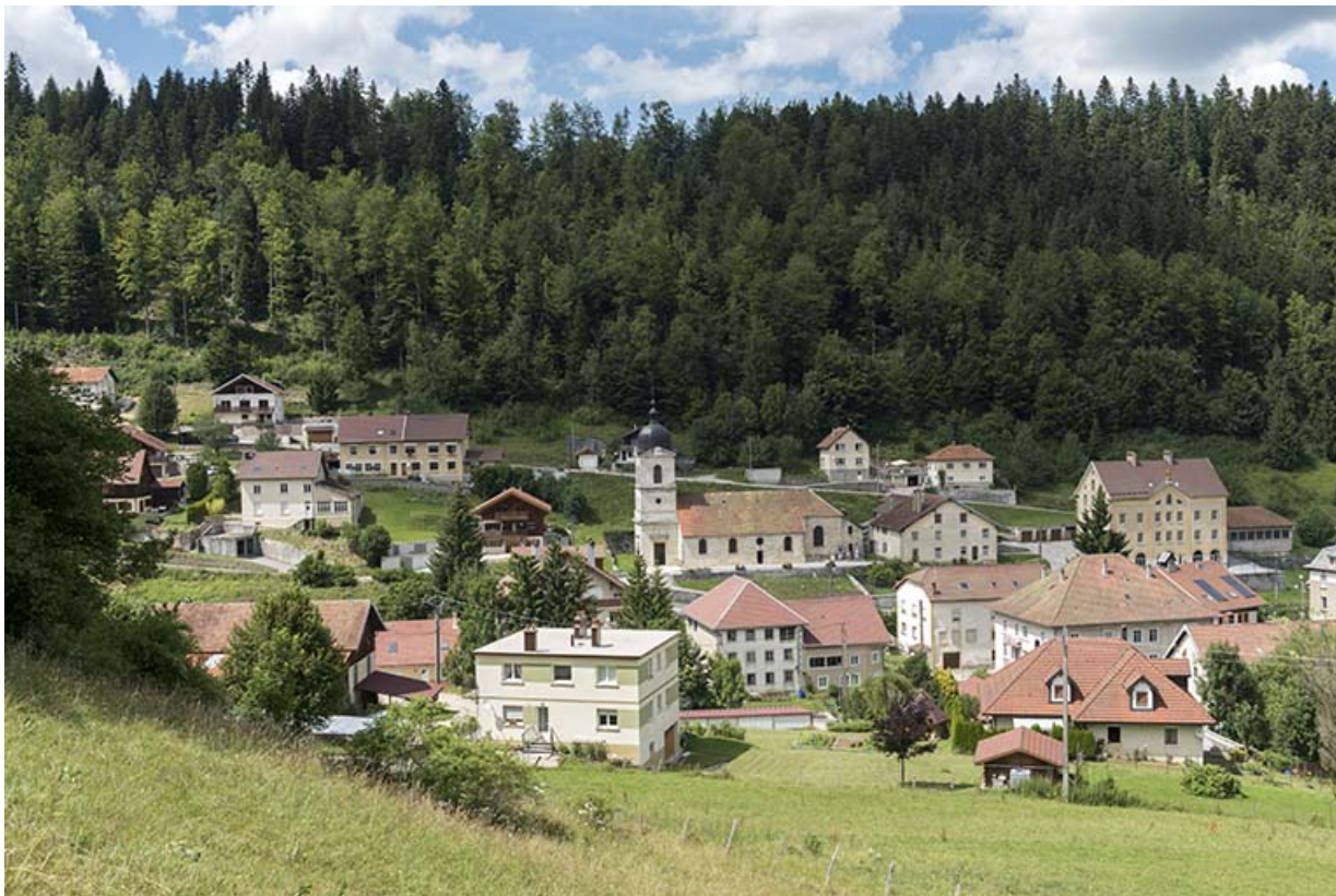
Vue d'ensemble du centre du village, depuis le sud-est. 25, Les Gras