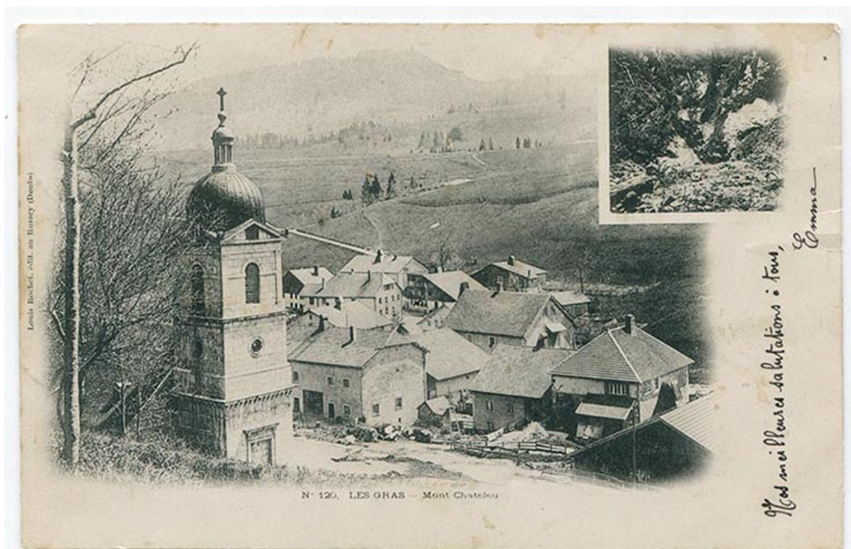
N° 120. Les Gras - Mont Châteleu, 4e quart 19e siècle. 25, Les Gras