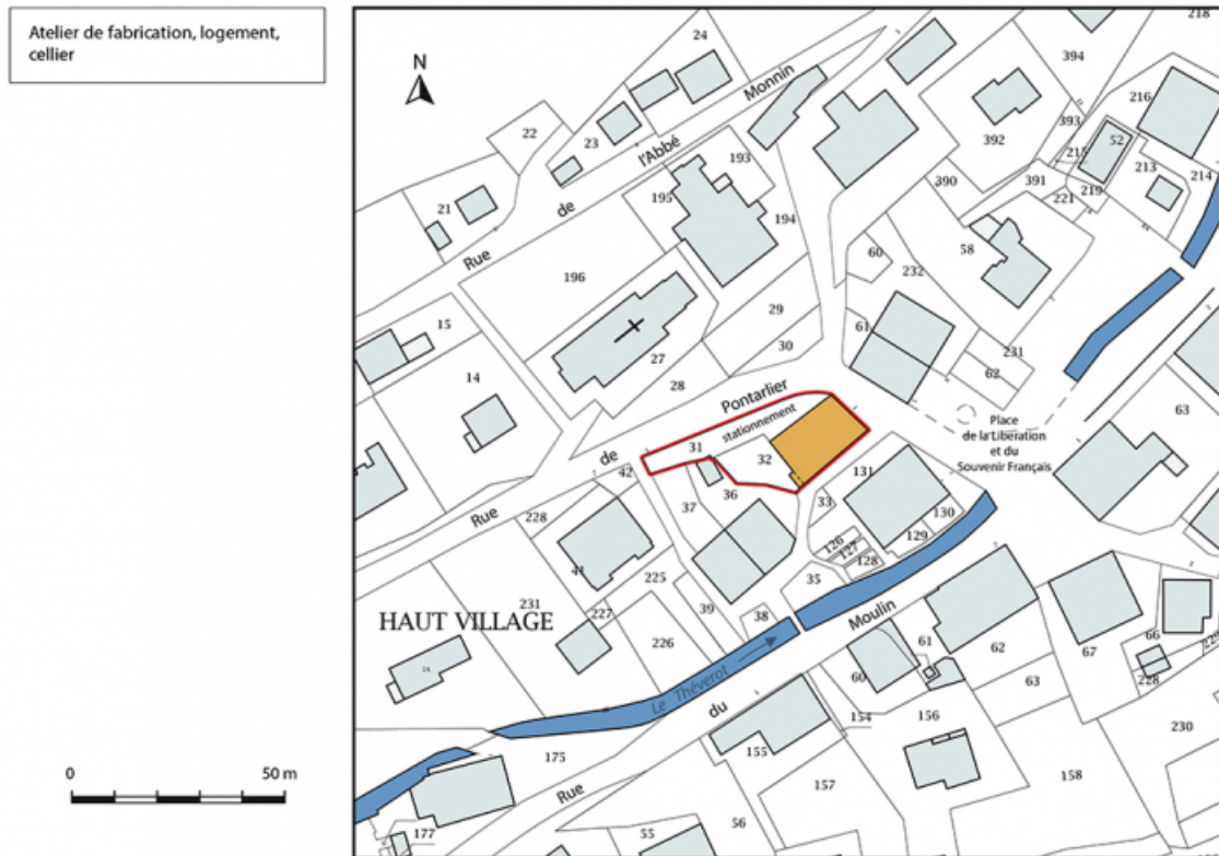
Plan-masse et de situation. Extrait du plan cadastral, 2017, section AB, 1/1 000. 25, Les Gras, 1 rue de Pontarlier