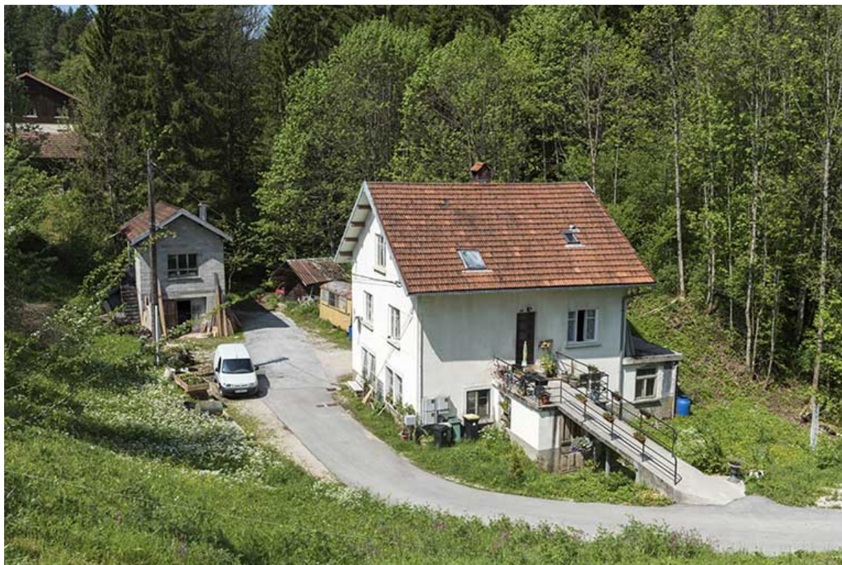
Vue d'ensemble plongeante, depuis le nord-est. 25, Les Gras, 8 rue du Moulin