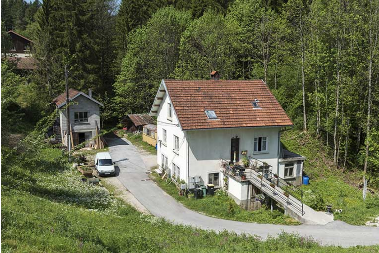
Vue d'ensemble plongeante, depuis le nord-est.