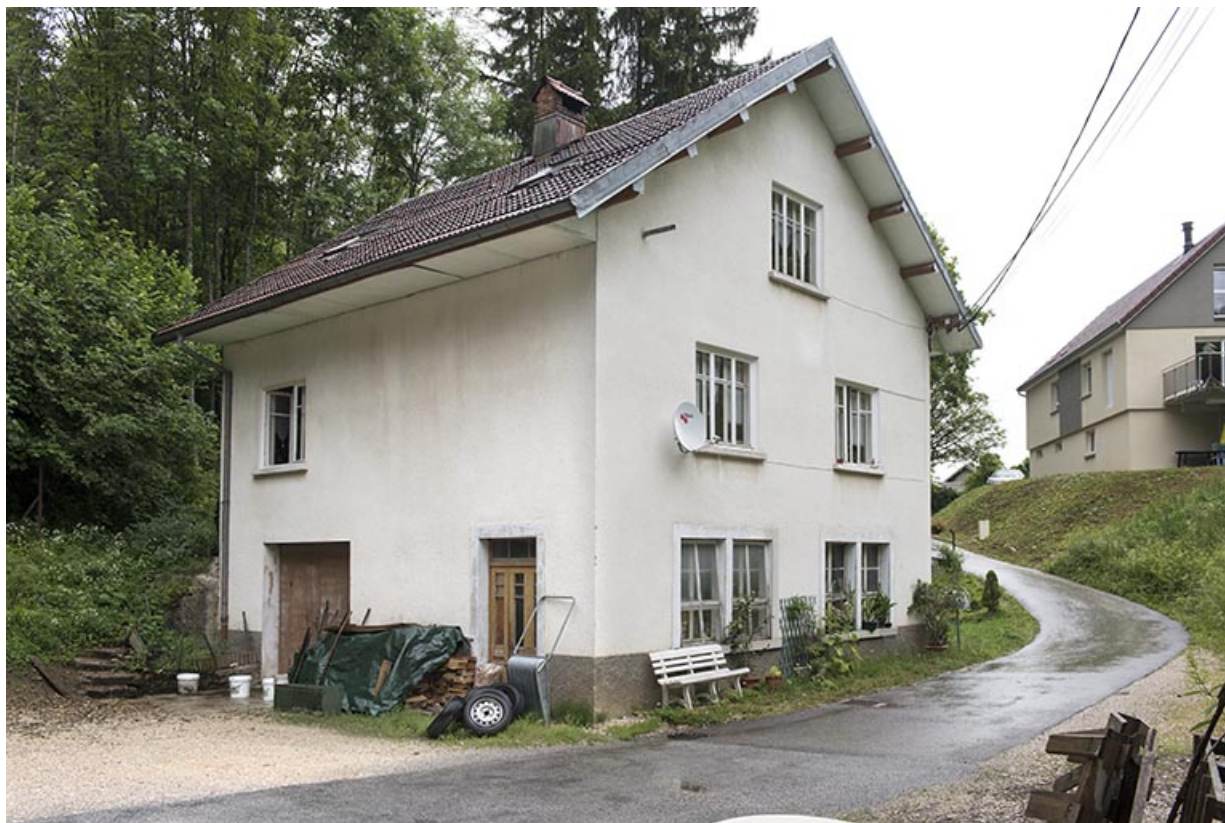
Façades sud est ouest.