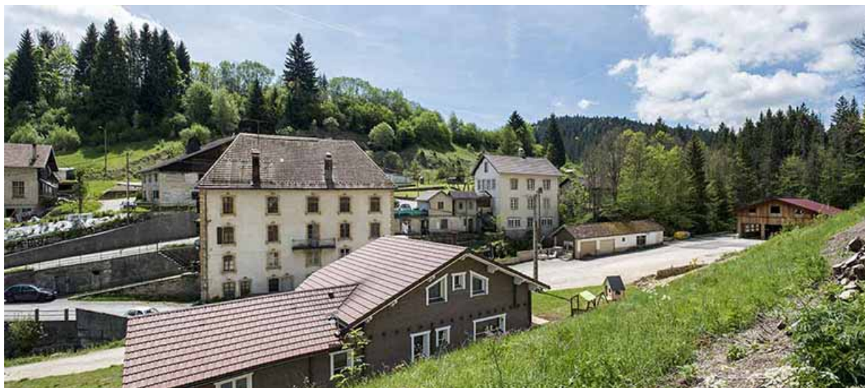
Un site de fonderie et fabrique d'outillage : l'affaire Mesnier (1873 et 1907-1908) puis Dornier et Les Fils de Virgile Amyot, 4-6 rue du Moulin. L'usine LFA se trouvait au premier plan à droite.