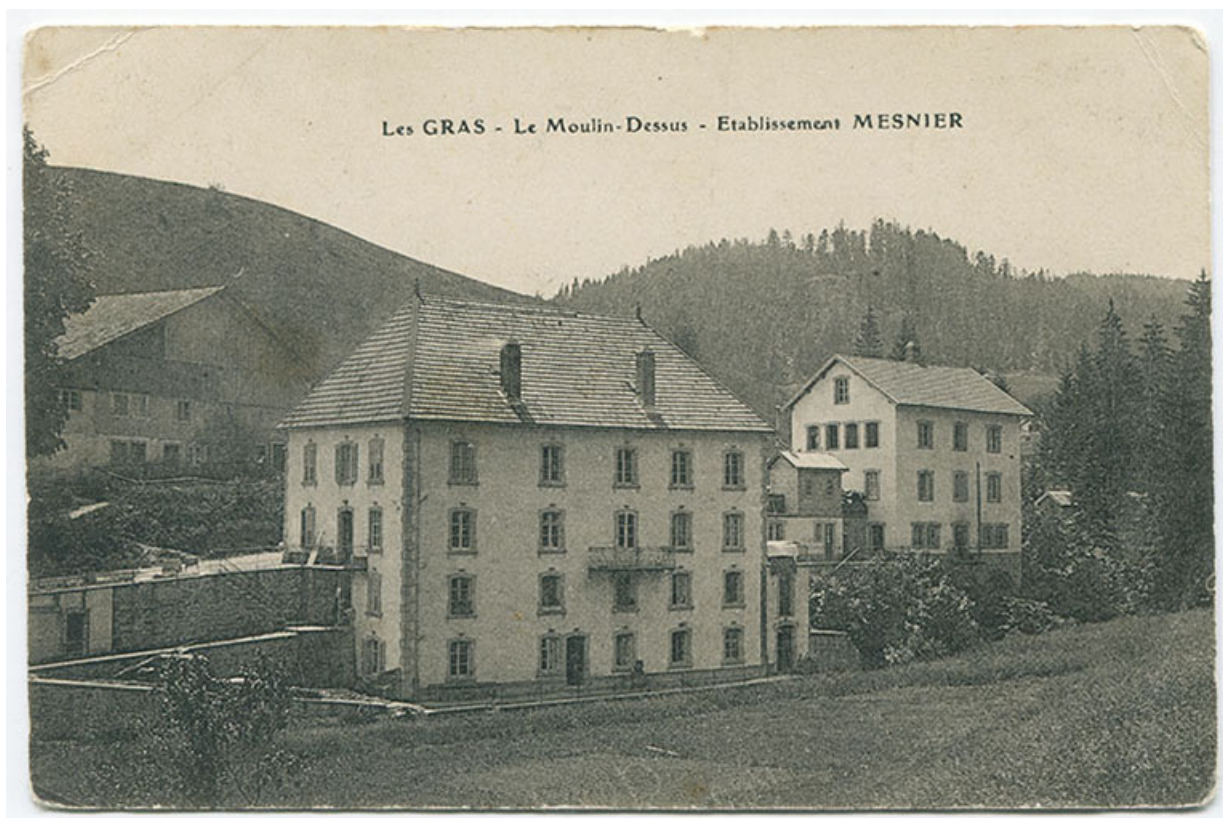
Les Gras - Le Moulin-Dessus - Etablissement Mesnier [vue d'ensemble, depuis le nord], 1er quart 20e siècle [entre 1908 et 1912]. 25, Les Gras, 4-6 rue du Moulin