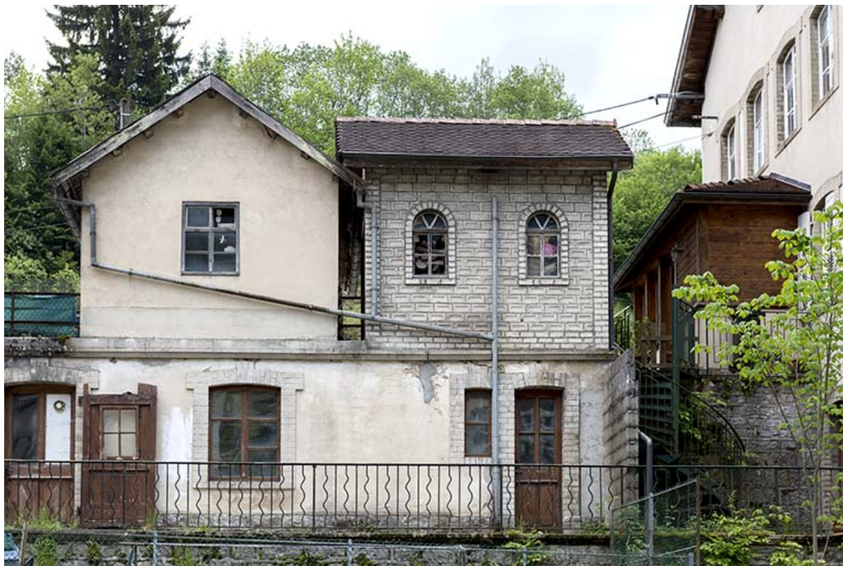
Atelier, garage et dépendance, depuis le nord. 25, Les Gras, 4-6 rue du Moulin