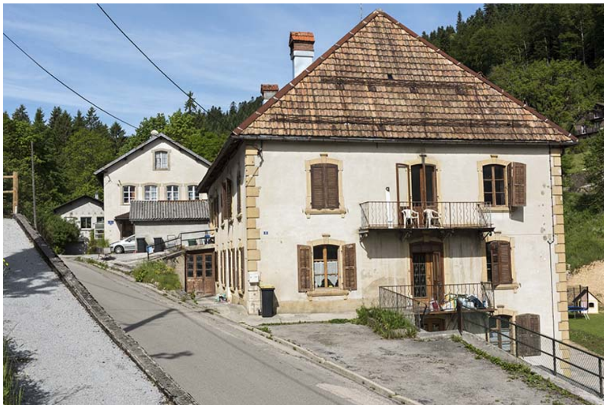
Un site de fonderie et fabrique d'outillage : l'affaire Mesnier (1873 et 1907-1908) puis Dornier et Les Fils de Virgile Amyot, 4-6 rue du Moulin.