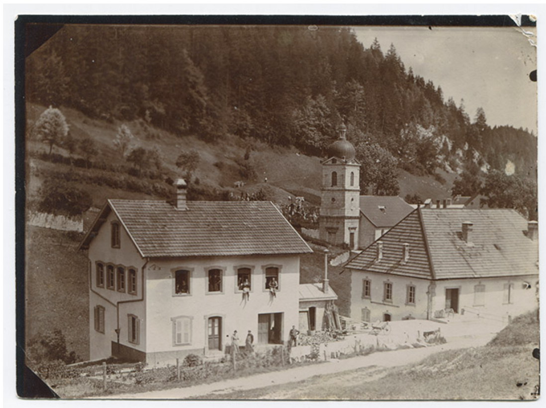
[Vue d'ensemble des deux bâtiments, depuis le sud], 1er quart 20e siècle [après 1908]. 25, Les Gras, 4-6 rue du Moulin