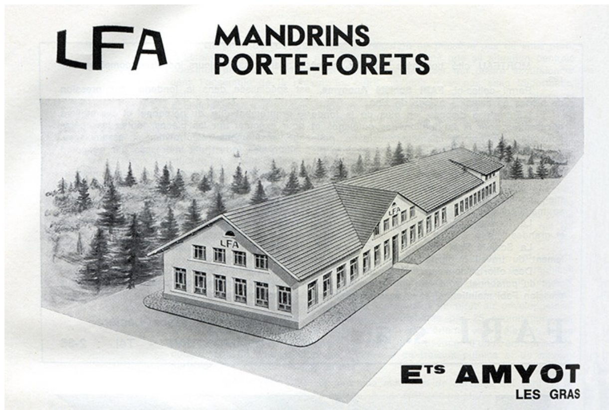
LFA mandrins porte-forets. Ets Amyot, Les Gras [vue cavalière de l'usine], 1971. 25, Les Gras, 4-6 rue du Moulin