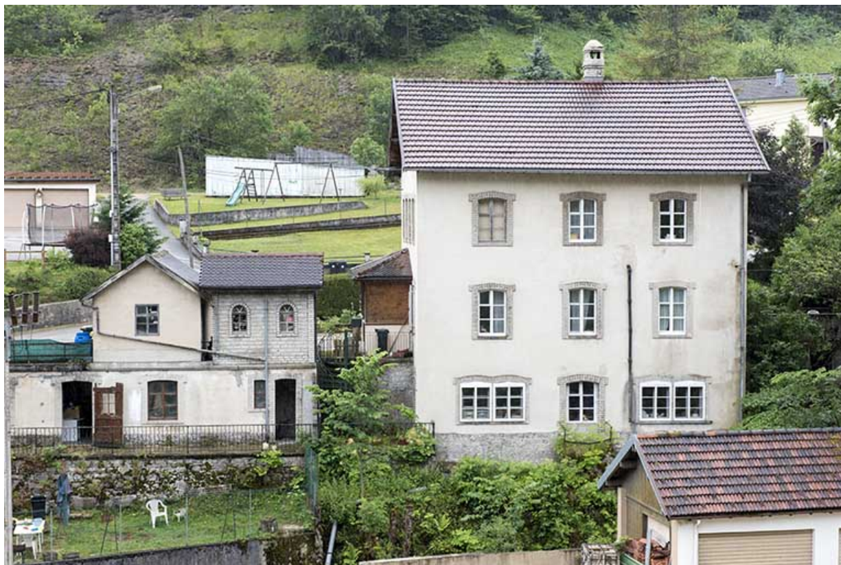
Maison (façade postérieure), atelier, garage et dépendance, depuis le nord. 25, Les Gras, 4-6 rue du Moulin