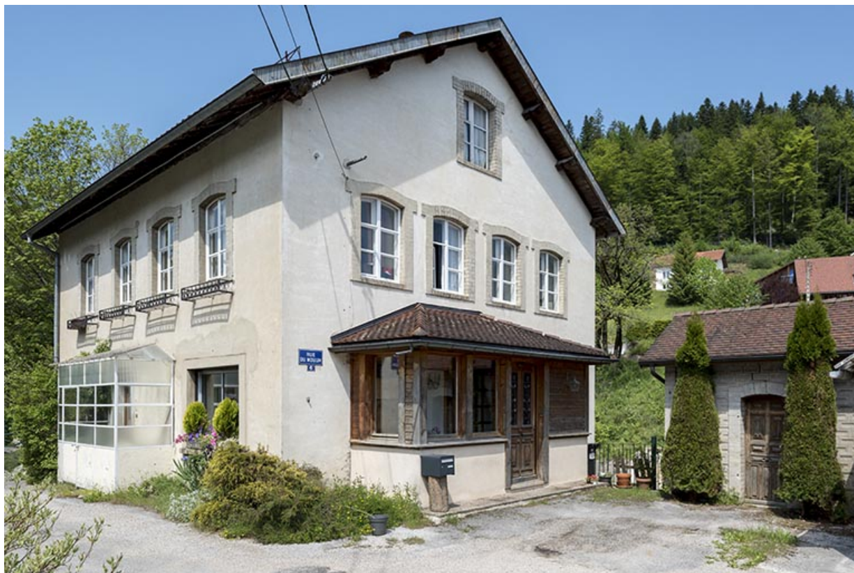
Maison, de trois quarts gauche, et atelier. 25, Les Gras, 4-6 rue du Moulin