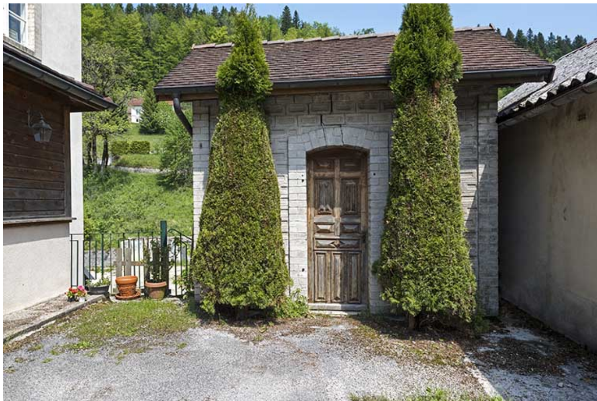
Atelier (petite forge et trempe). 25, Les Gras, 4-6 rue du Moulin