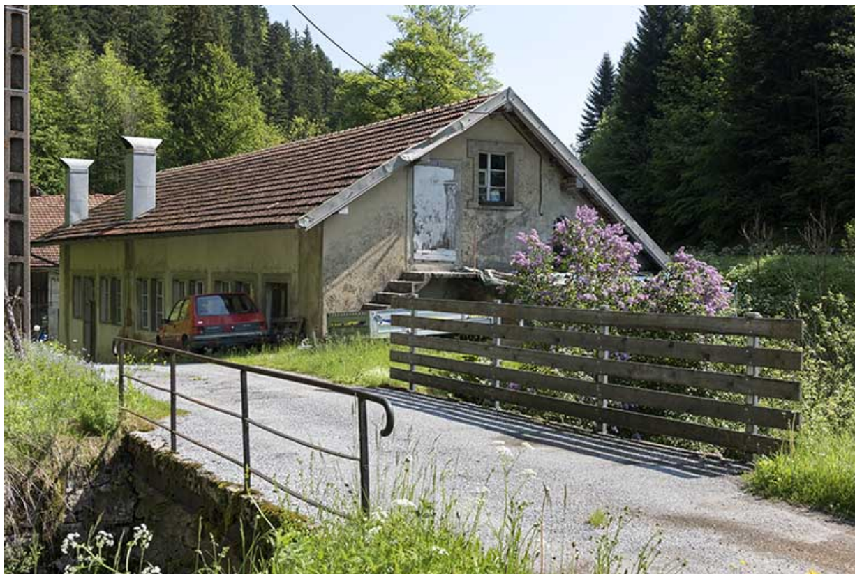
Usine : façades antérieure et latérale droite. 25, Les Gras, 11-15 Grande Rue