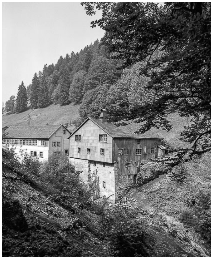
Pignon et façade postérieure. 25, Les Gras, 11-15 Grande Rue