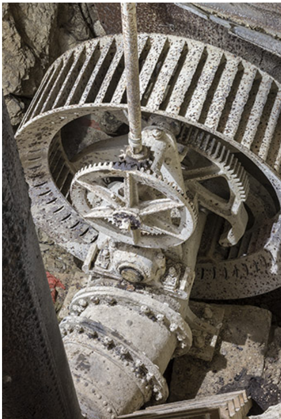
Usine : turbine Laurioz, au 2e étage de soubassement (chambre d'eau). Actionné depuis le rez-de-chaussée, l'arbre vertical commande l'admission d'eau.