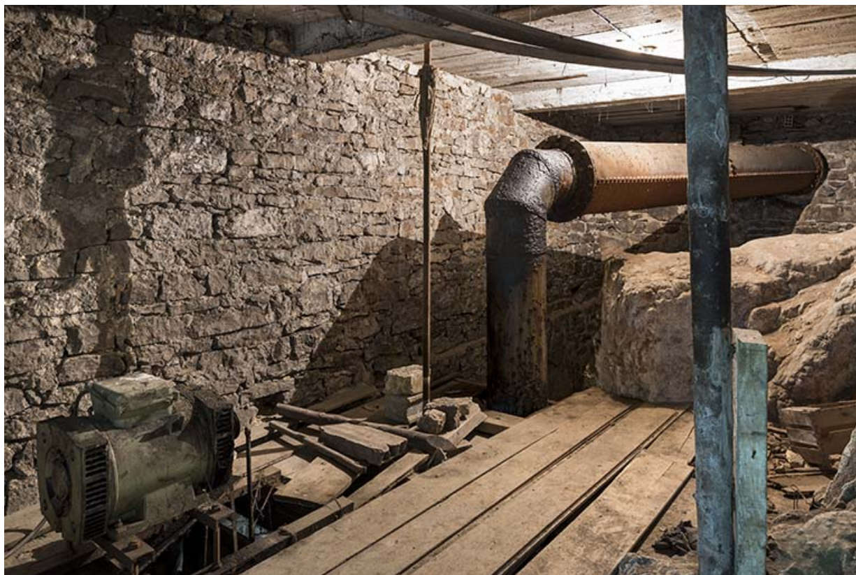
Usine : conduit d'amenée d'eau de la turbine, au 1er étage de soubassement. 25, Les Gras, 11-15 Grande Rue