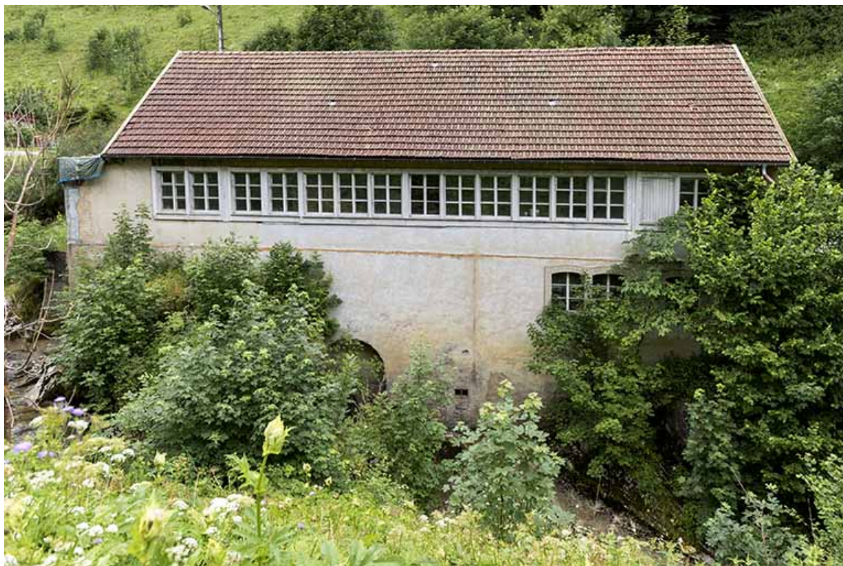
Usine : façade postérieure.