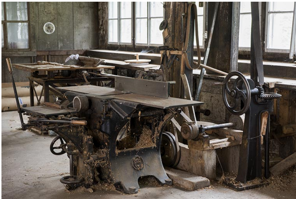
Usine : raboteuse Muller et commande de la turbine Laurioz. 25, Les Gras, 11-15 Grande Rue