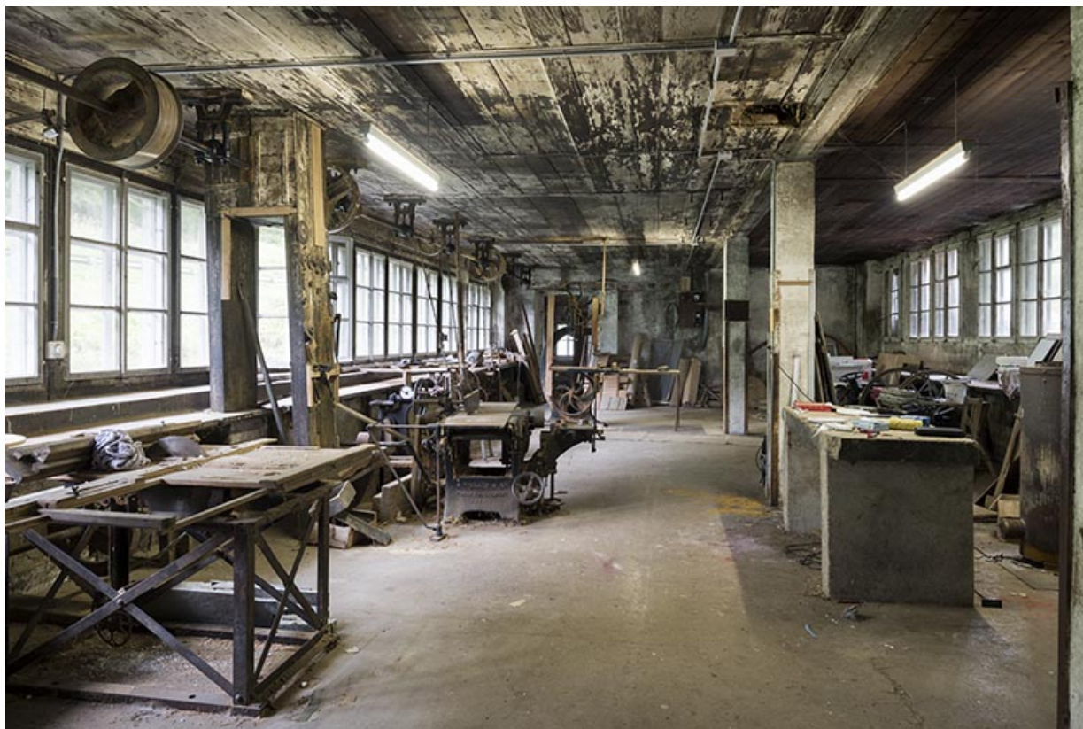
Usine : atelier de menuiserie au rez-de-chaussée. 25, Les Gras, 11-15 Grande Rue