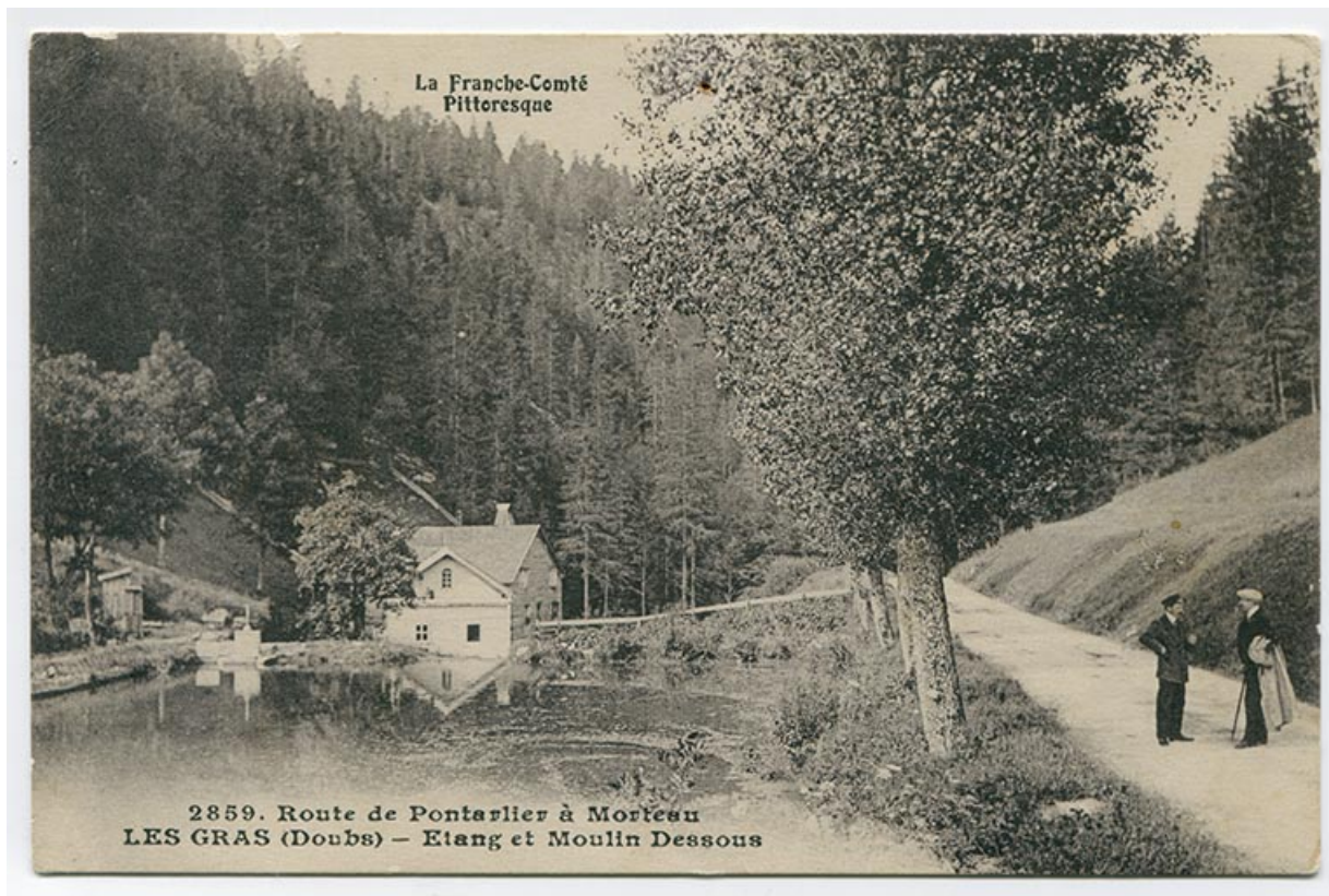
La Franche-Comté pittoresque. 2859. Route de Pontarlier à Morteau. Les Gras (Doubs) - Etang et Moulin Dessous, 1er quart 20e siècle [avant 1916].