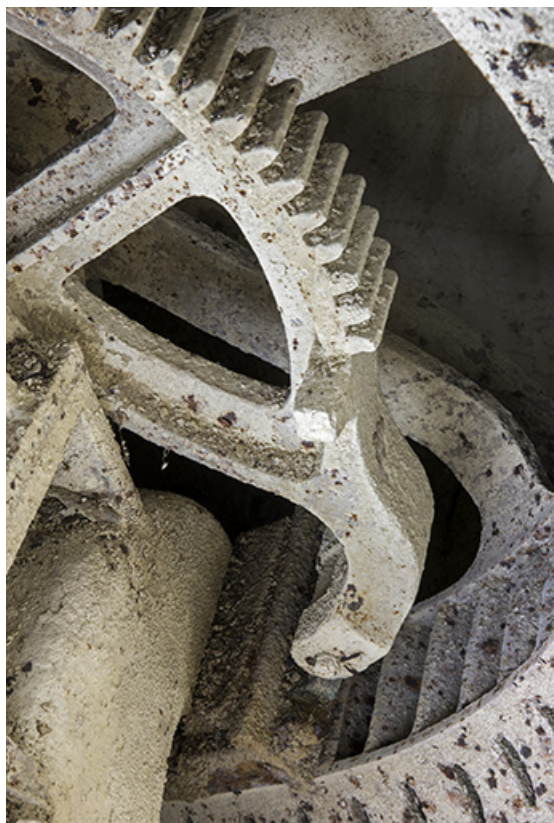
Usine : secteur commandant l'admission d'eau dans la turbine. 25, Les Gras, 11-15 Grande Rue