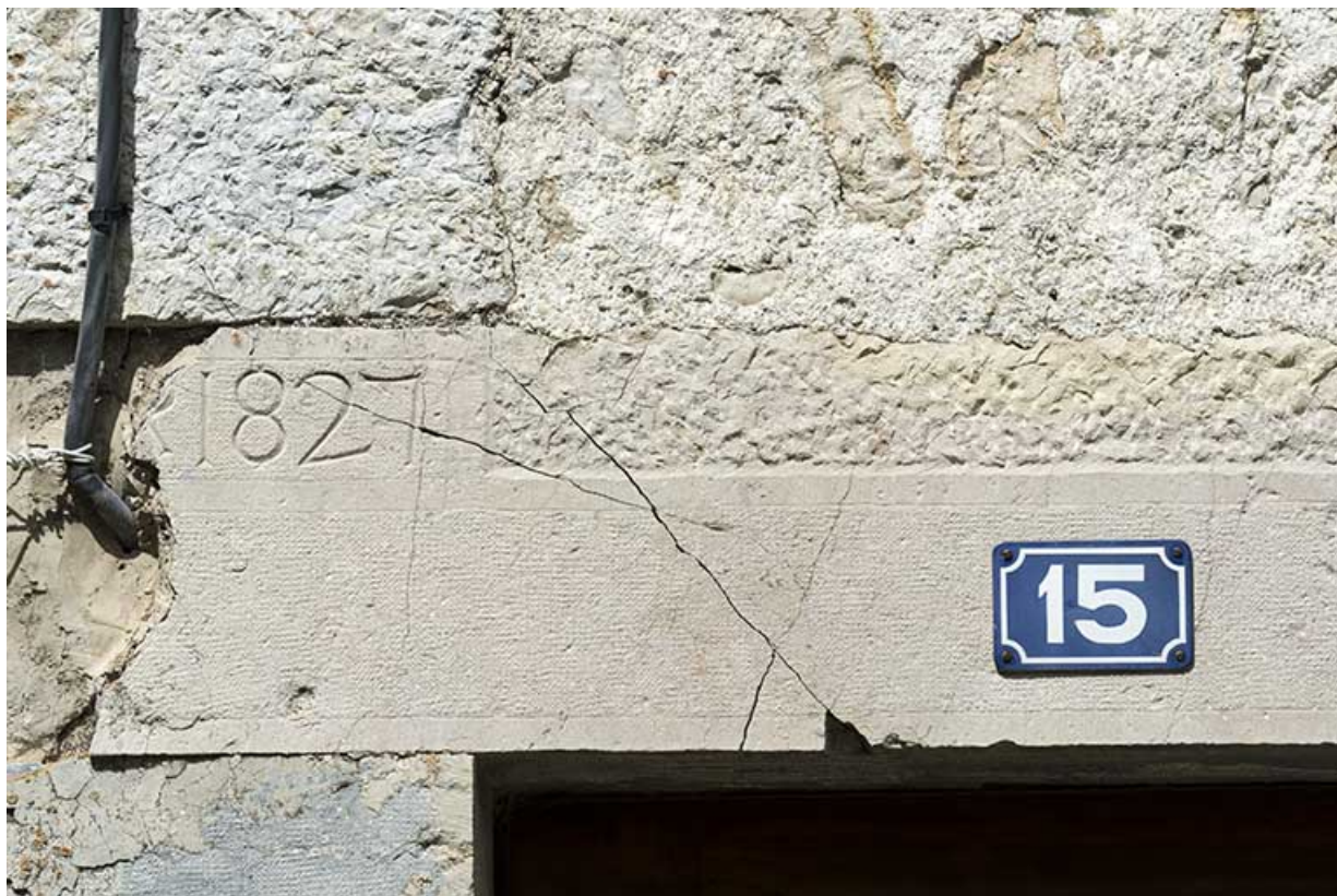
Ancien moulin : date sur la façade antérieure.