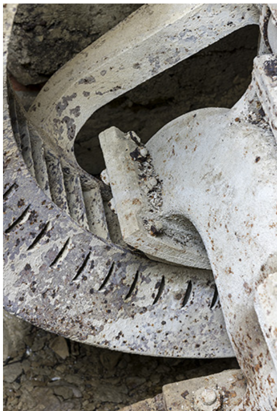
Usine : arrivée d'eau sur les aubes de la turbine. 25, Les Gras, 11-15 Grande Rue