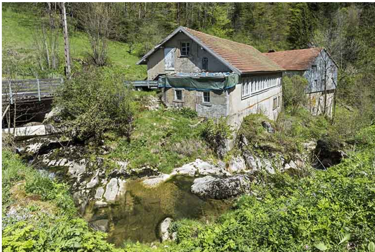
Usine et ancien moulin, depuis le sud.