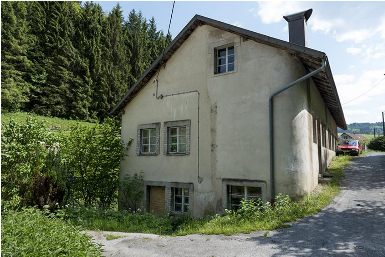
Usine : façade latérale gauche, de trois quarts droite.