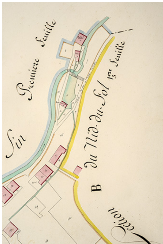
Cadastré de la commune des Gras. Atlas parcellaire, 1816, section E [détail : la Grande Rue et le quartier du moulin du Bas], 1/1 250.