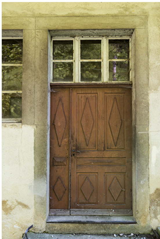
Usine, façade antérieure : porte. 25, Les Gras, 11-15 Grande Rue