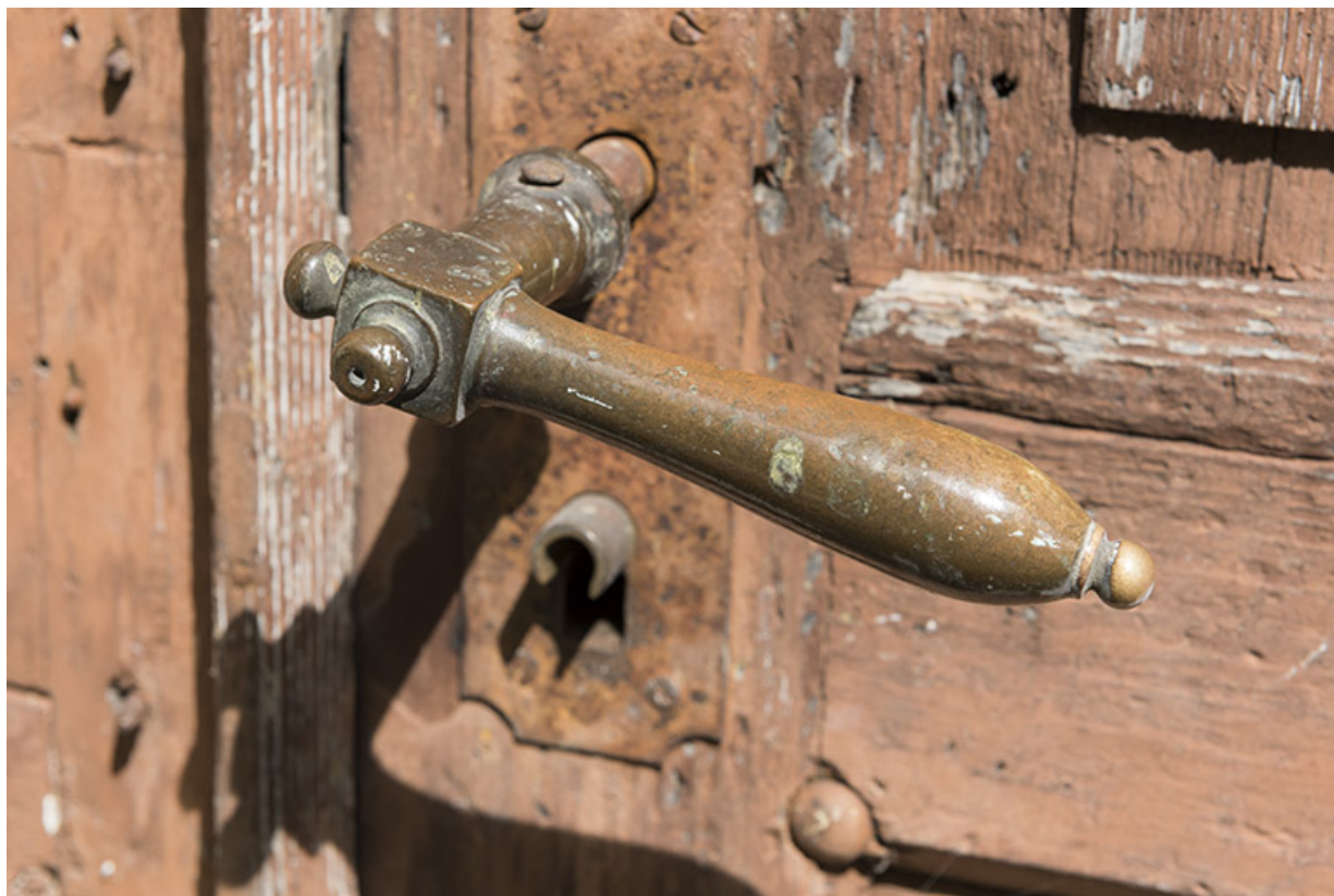
Usine, façade antérieure : poignée de la porte. 25, Les Gras, 11-15 Grande Rue