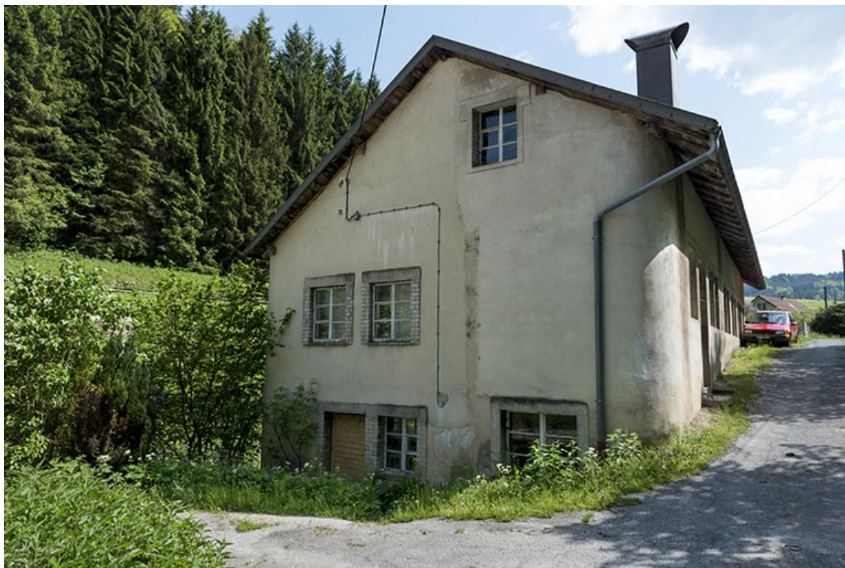
Usine : façade latérale gauche, de trois quarts droite.