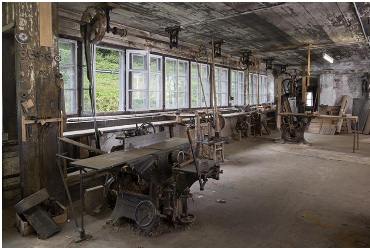
Usine : fenêtres de l'atelier de menuiserie, à l'est. 25, Les Gras, 11-15 Grande Rue