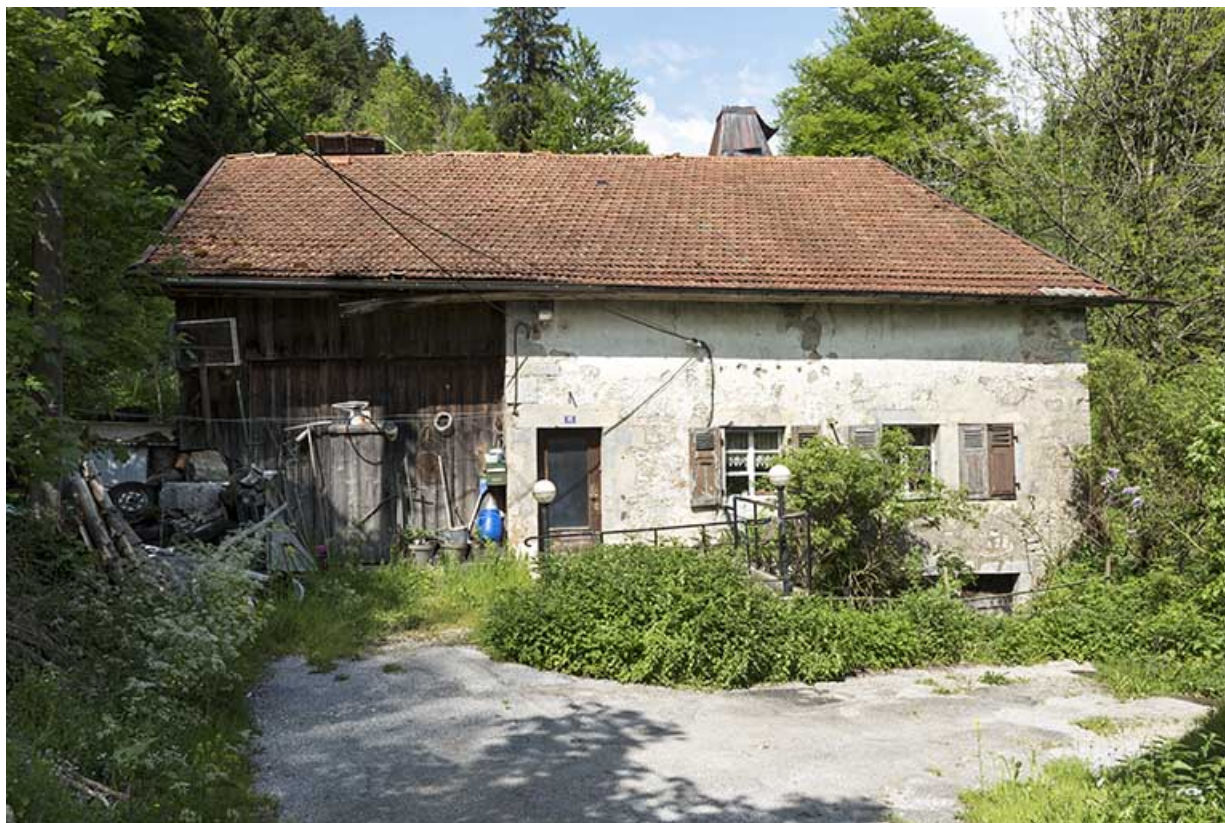
Ancien moulin : façade antérieure.