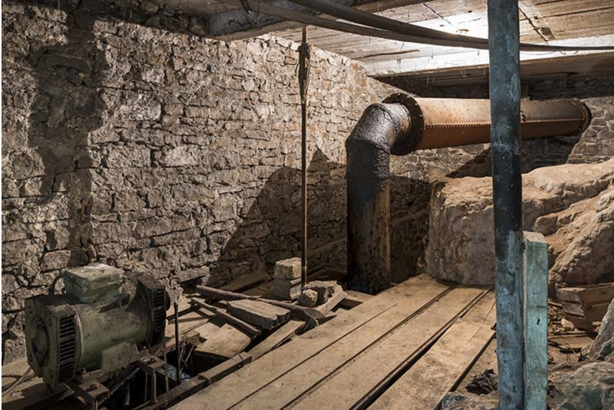
Usine : conduit d'amenée d'eau de la turbine, au 1er étage de soubassement. 25, Les Gras, 11-15 Grande Rue