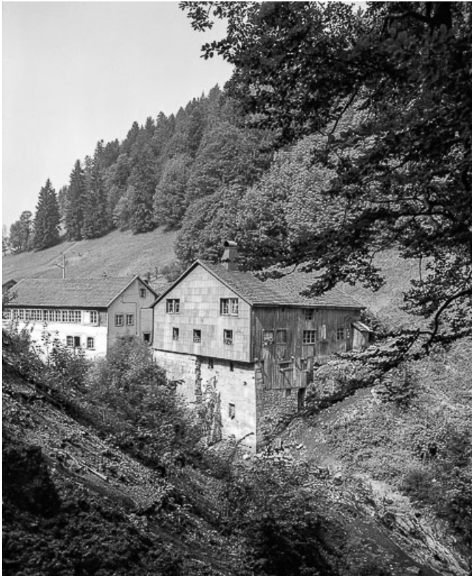
Pignon et façade postérieure.