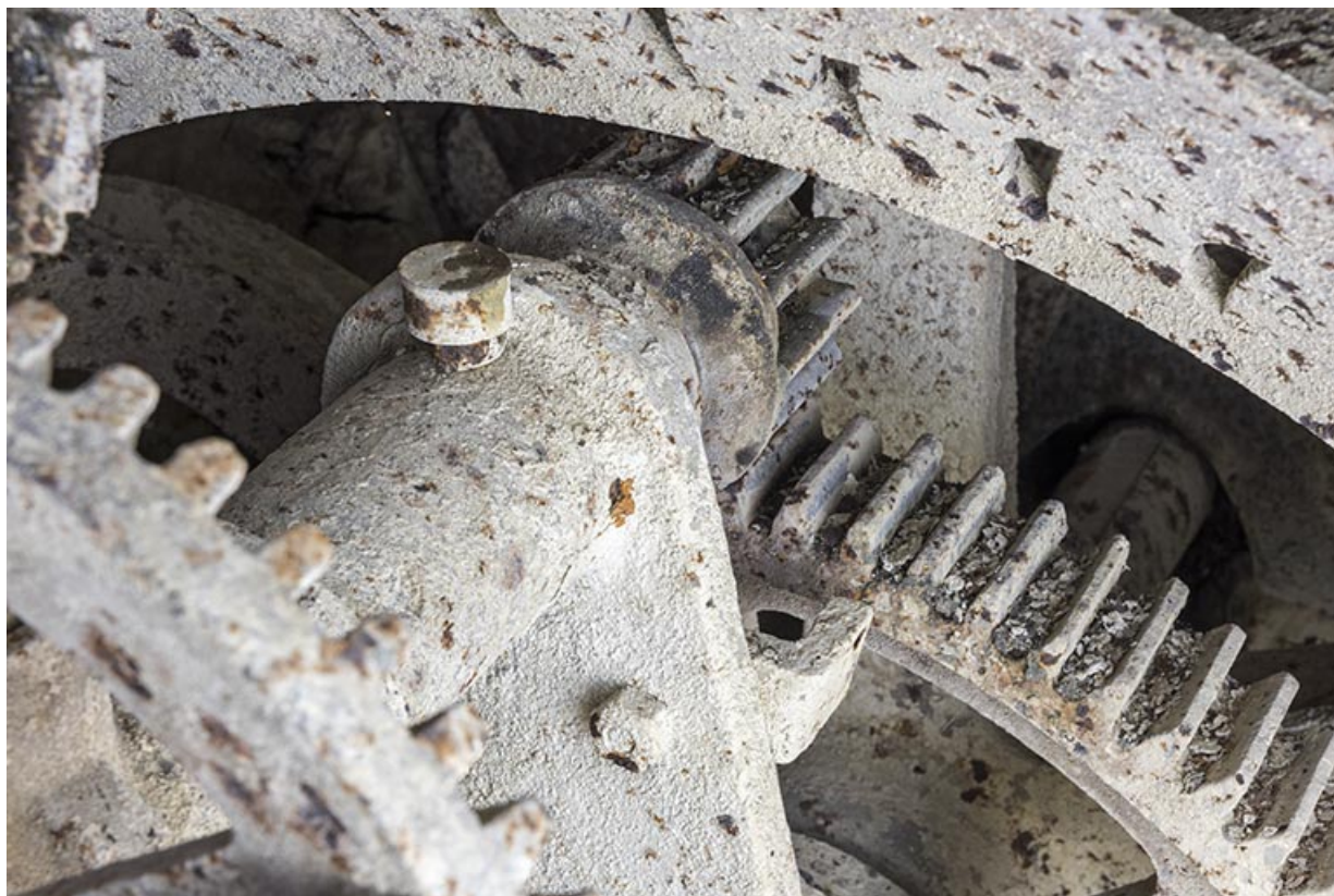
Usine : pignon entraînant le secteur commandant l'admission d'eau dans la turbine. 25, Les Gras, 11-15 Grande Rue