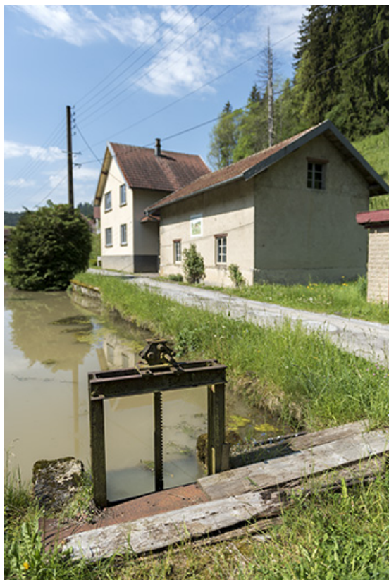
Vanne de prise d'eau, remise et maison.