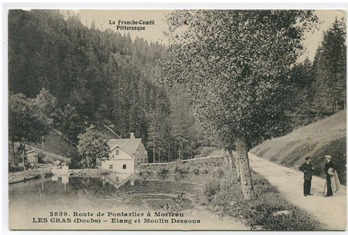
La Franche-Comté pittoresque. 2859. Route de Pontarlier à Morteau. Les Gras (Doubs) - Etang et Moulin Dessous, 1er quart 20e siècle [avant 1916].