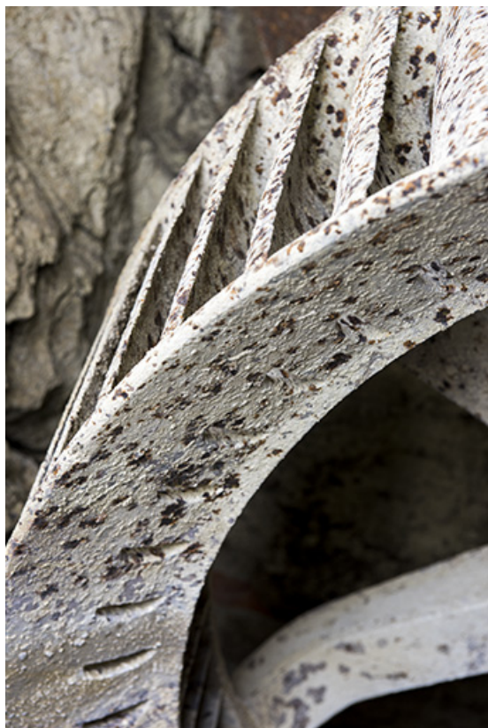
Usine : aubes de la turbine.