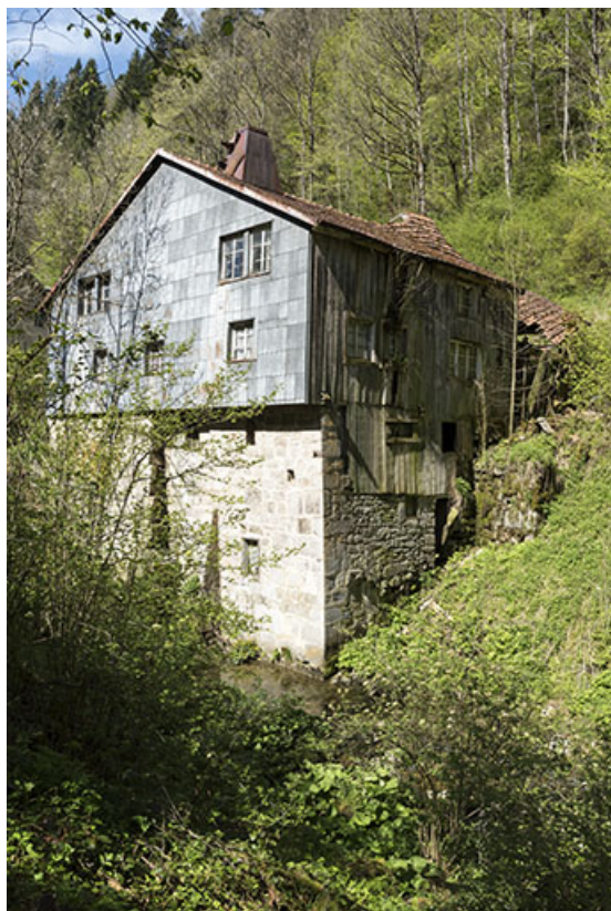
Ancien moulin : façades postérieure et latérale droite. 25, Les Gras, 11-15 Grande Rue