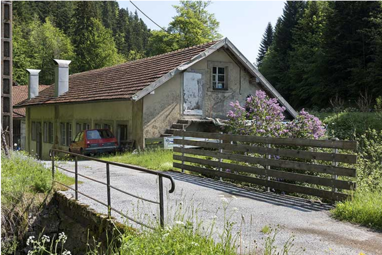
Usine : façades antérieure et latérale droite. 25, Les Gras, 11-15 Grande Rue