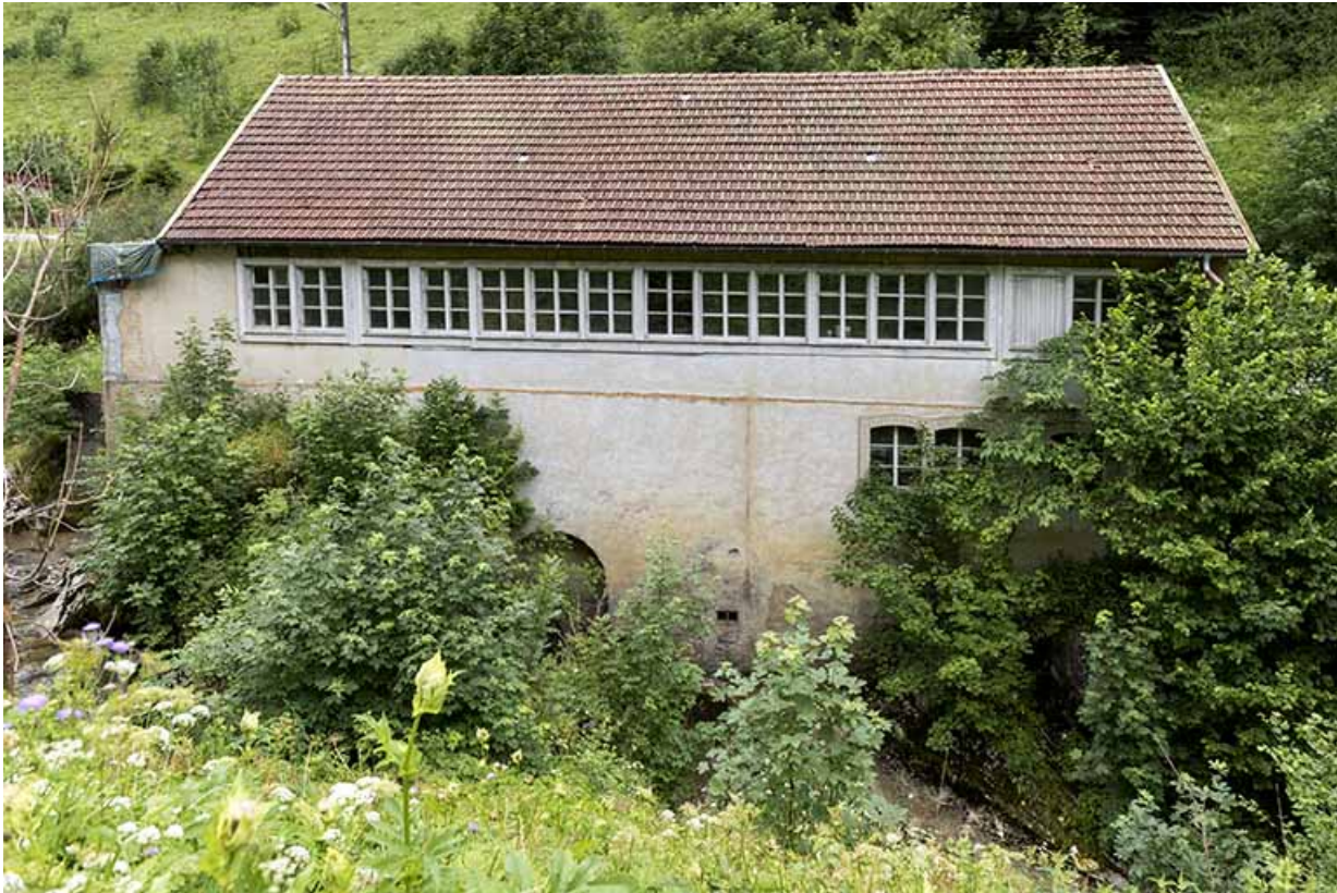
Usine : façade postérieure.