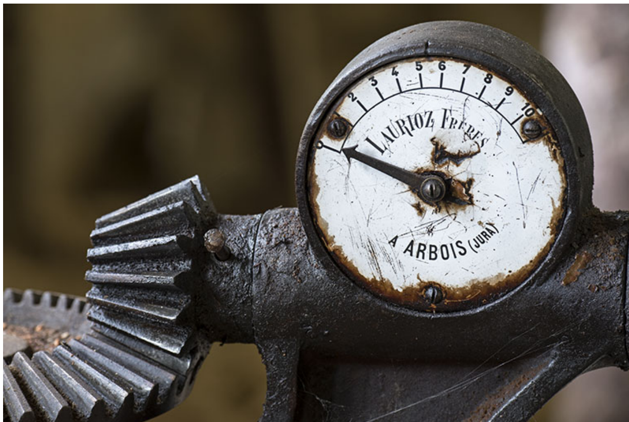
Usine : manomètre de la commande de la turbine Laurioz. 25, Les Gras, 11-15 Grande Rue