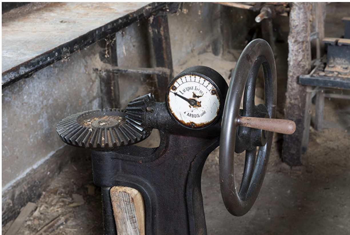
Usine : commande de la turbine Laurioz. 25, Les Gras, 11-15 Grande Rue