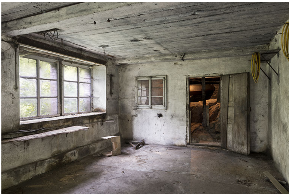
Usine : salle au 1er étage de soubassement, donnant sur la chambre d'eau. 25, Les Gras, 11-15 Grande Rue