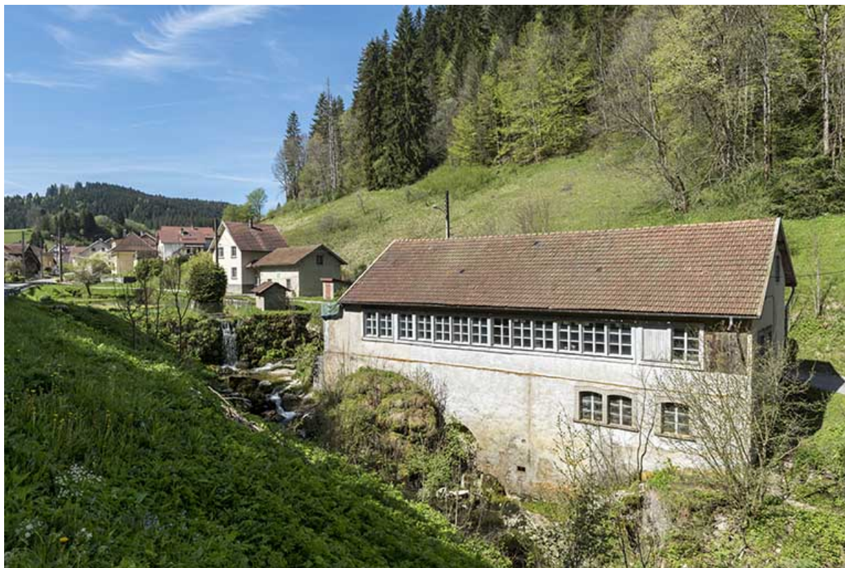
Un exemple de site hydraulique : l'usine d'outillage Louis Garnache-Chiquet et Fils (vers 1898), au moulin du Bas (11-15 Grande Rue).