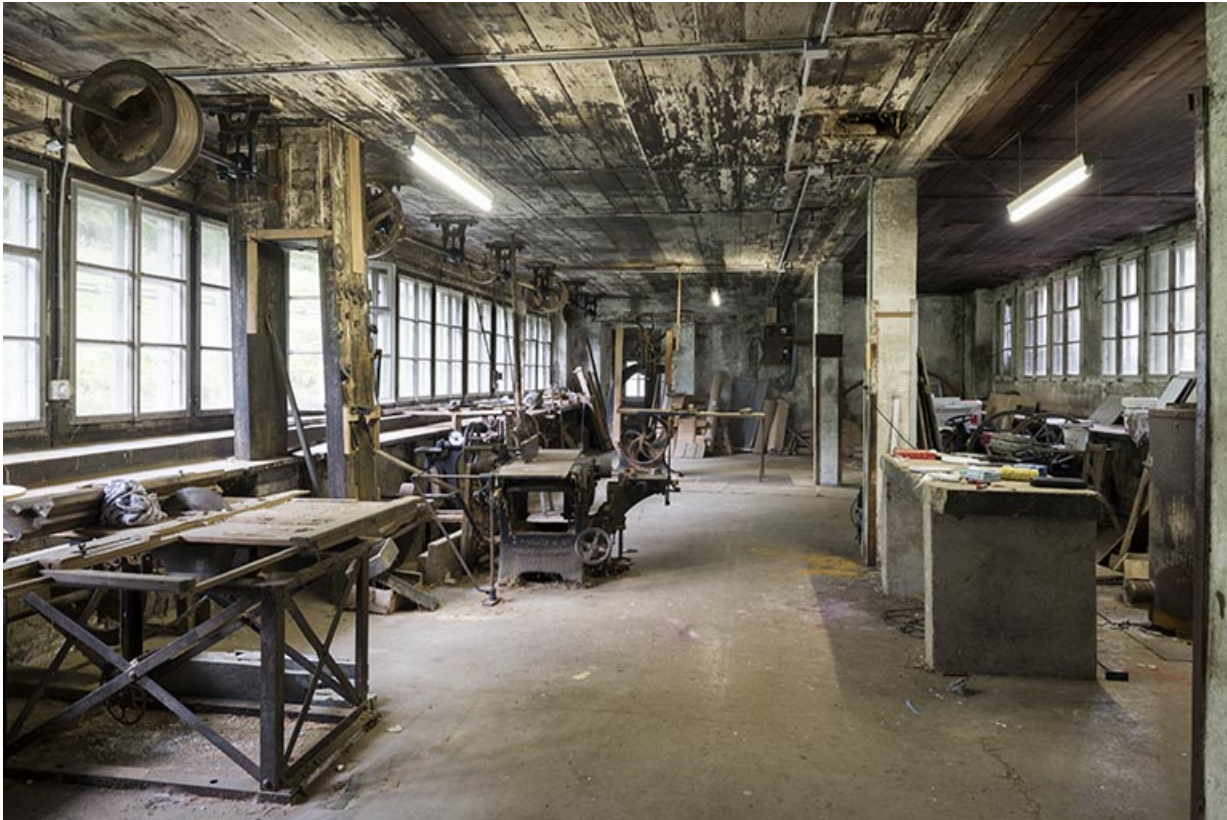
Usine : atelier de menuiserie au rez-de-chaussée. 25, Les Gras, 11-15 Grande Rue