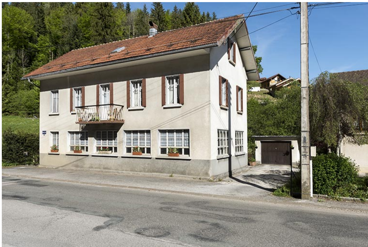
Façade antérieure, de trois quarts droite. 25, Les Gras