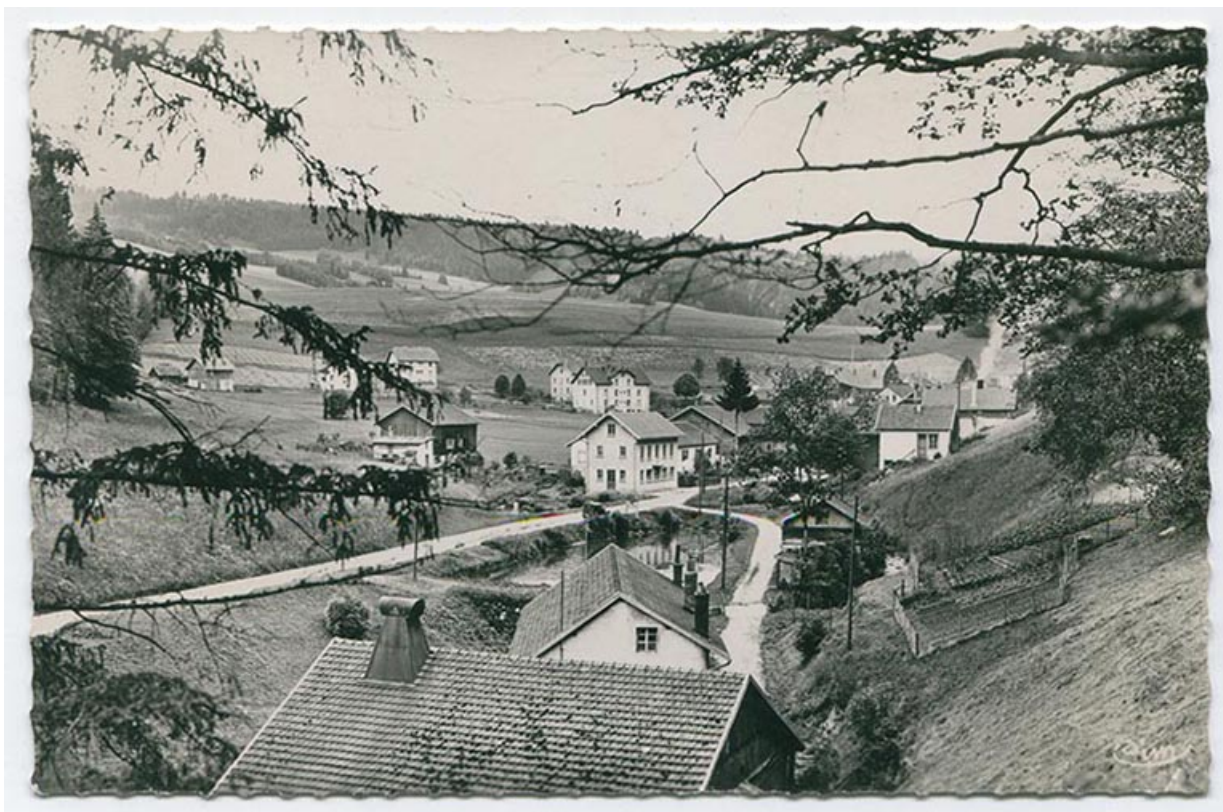
Les Gras (Doubs) - Le bas du village [l'entrée du village au nord-est], 3e quart 20e siècle [avant 1965]. 25, Les Gras