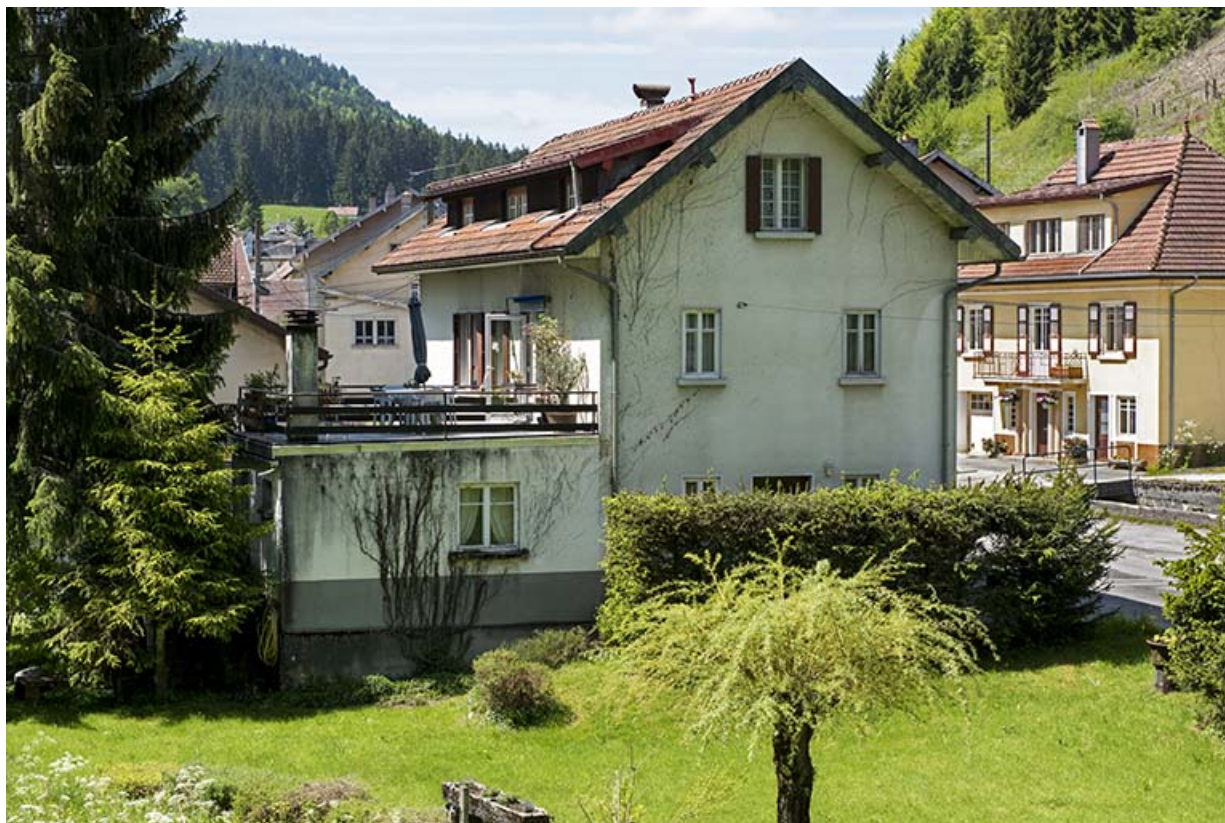
Façade postérieure et latérale gauche.