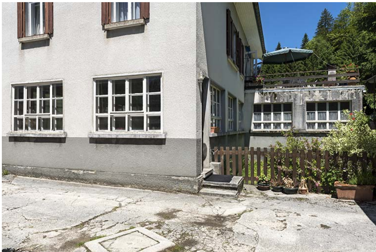
Atelier au rez-de-chaussée et extension du début des années 1960. 25, Les Gras, 34 Grande Rue