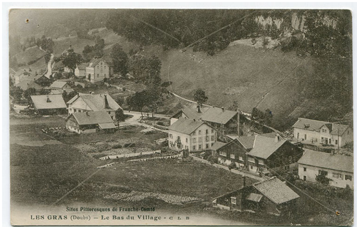
Sites pittoresques de Franche-Comté. Les Gras (Doubs) - Le bas du village, 1er quart 20e siècle [entre 1913 et 1919]. La fonderie est visible au centre, avec l'immeuble à l'arrière-plan.