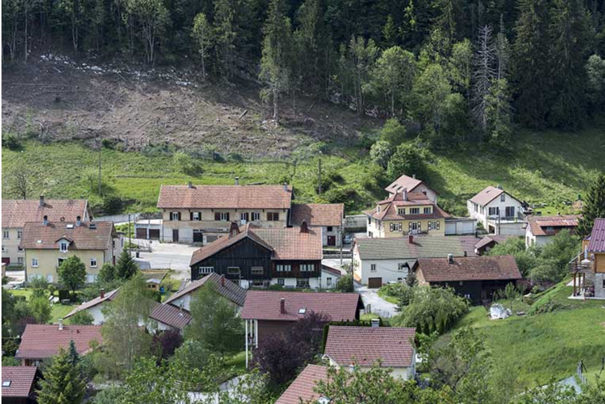
Le bas du village, vu depuis l'est.