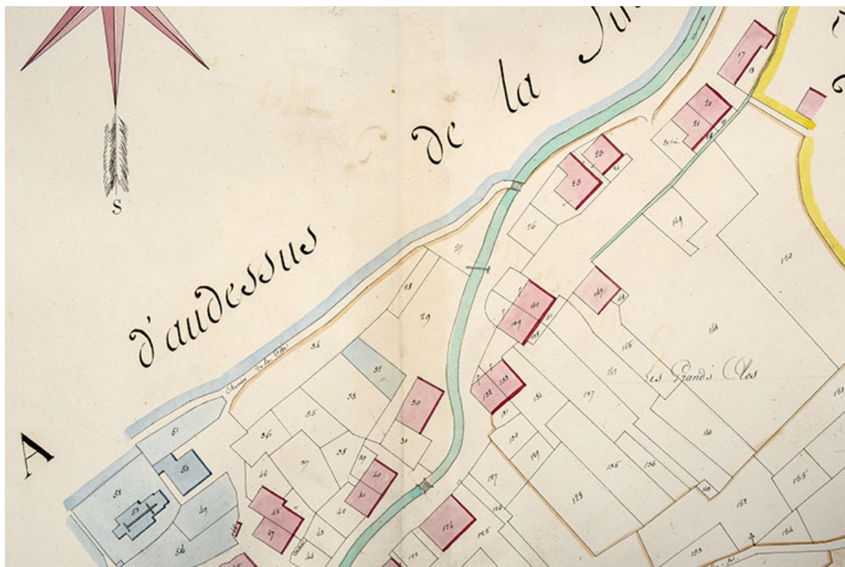
Cadastre de la commune des Gras. Atlas parcellaire, 1816, section E [détail : la Grande Rue], 1/1 250. 25, Les Gras