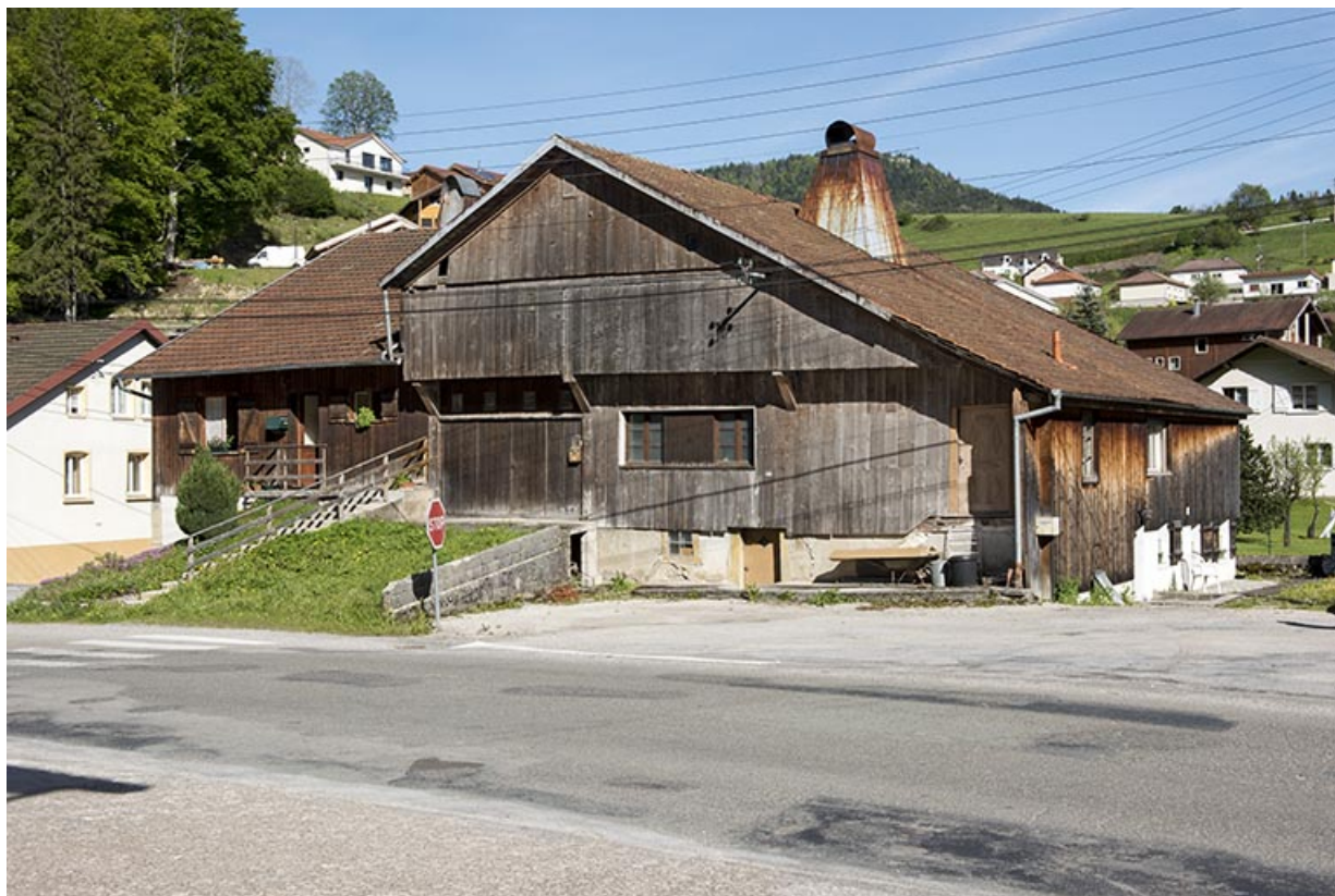
Un exemple de ferme double (1779) avec atelier d'outillage (Alphonse Jacquet vers 1874, etc.) : celle des 24 et 26 Grande Rue, 25, Les Gras