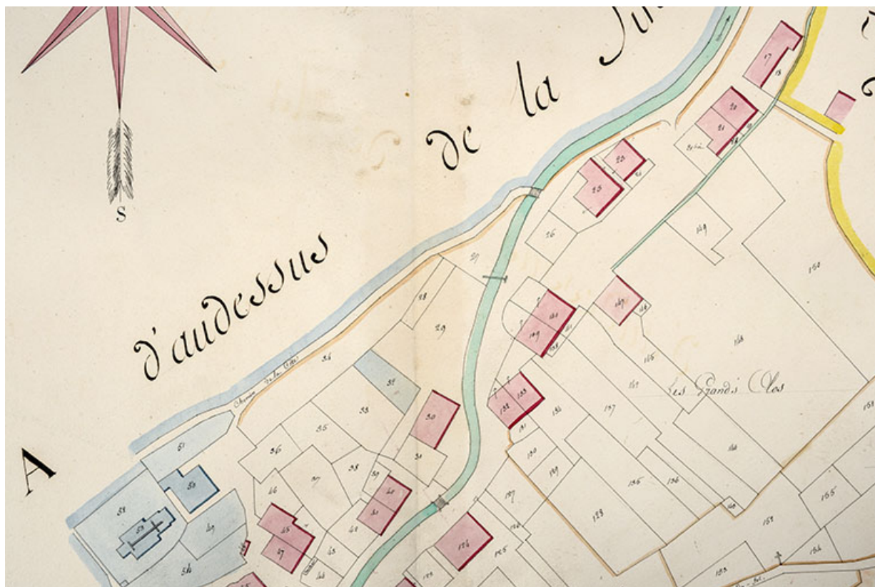
Cadastré de la commune des Gras. Atlas parcellaire, 1816, section E [détail : la Grande Rue], 1/1 250. 25, Les Gras, 24-26 Grande Rue