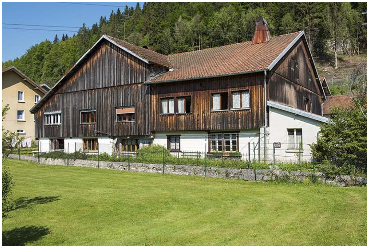
Façade postérieure, de trois quarts droite.