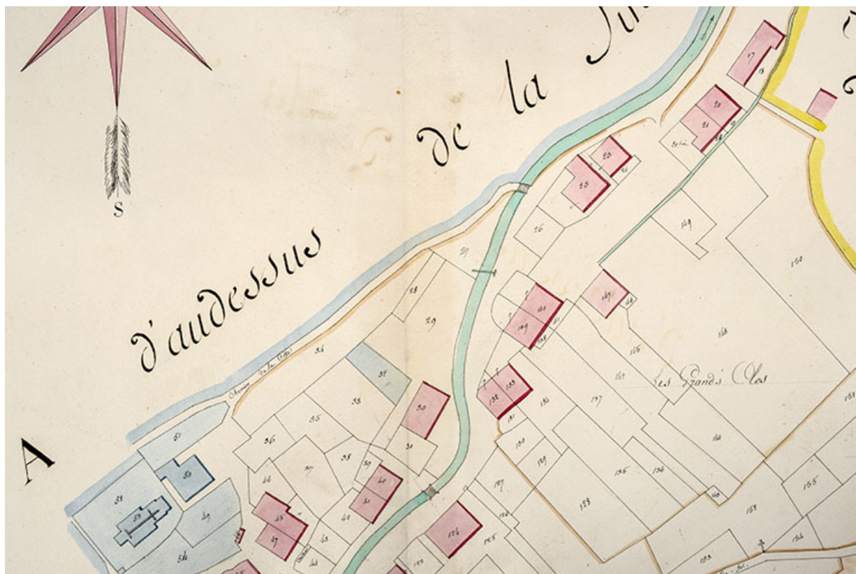
Cadastré de la commune des Gras. Atlas parcellaire, 1816, section E [détail : la Grande Rue], 1/1 250.