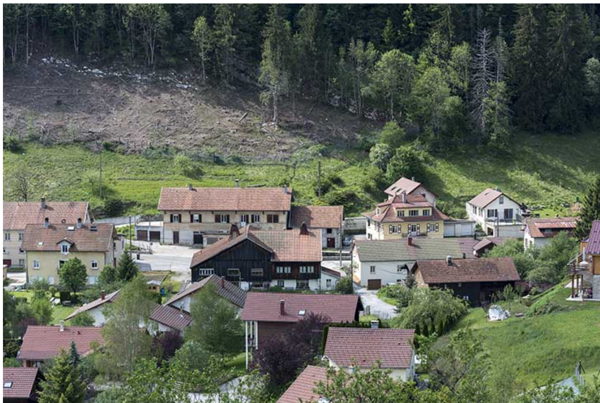
Le bas du village, vu depuis l'est.