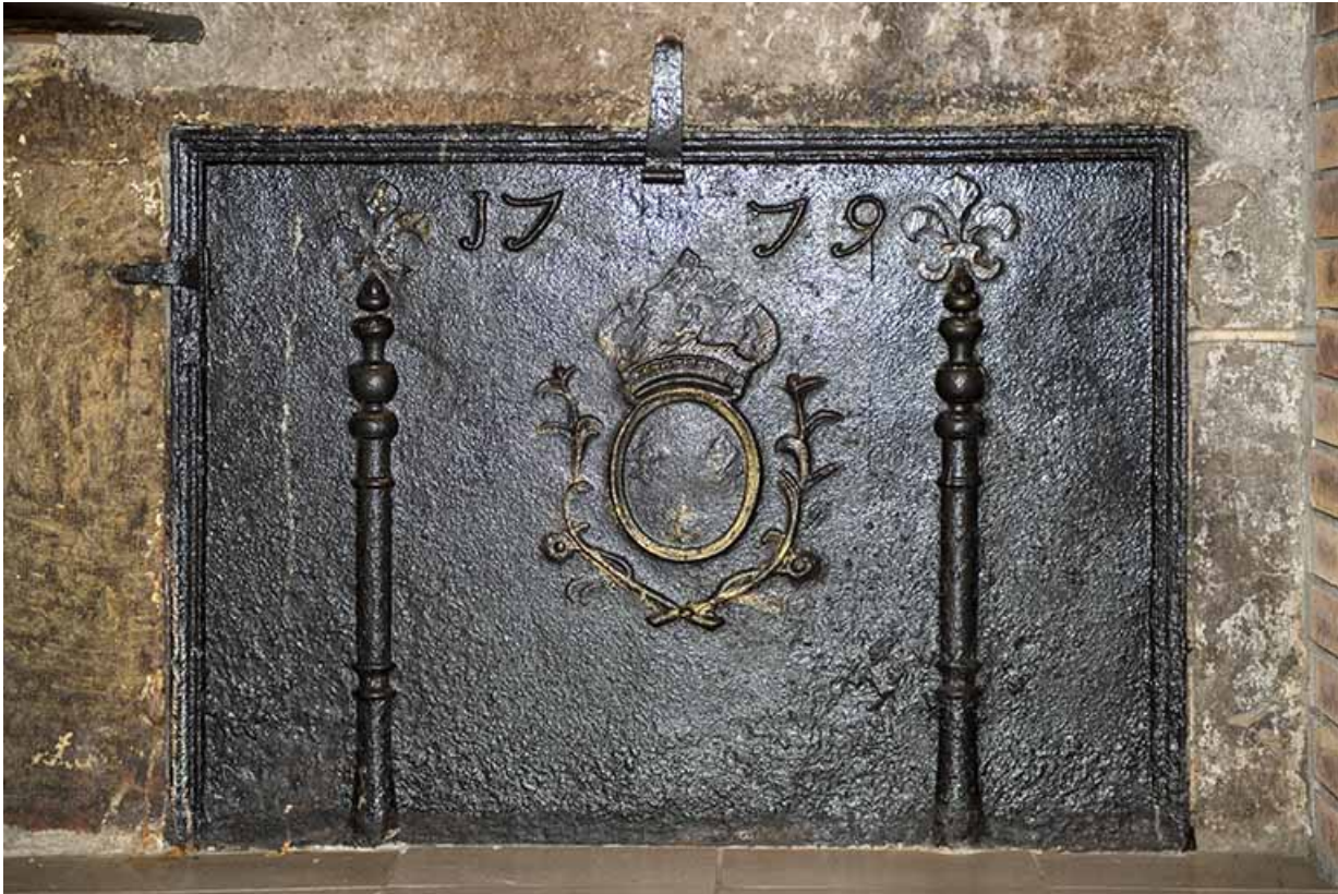
Plaque de cheminée datée de 1779 et aux fleurs de lys effacées.