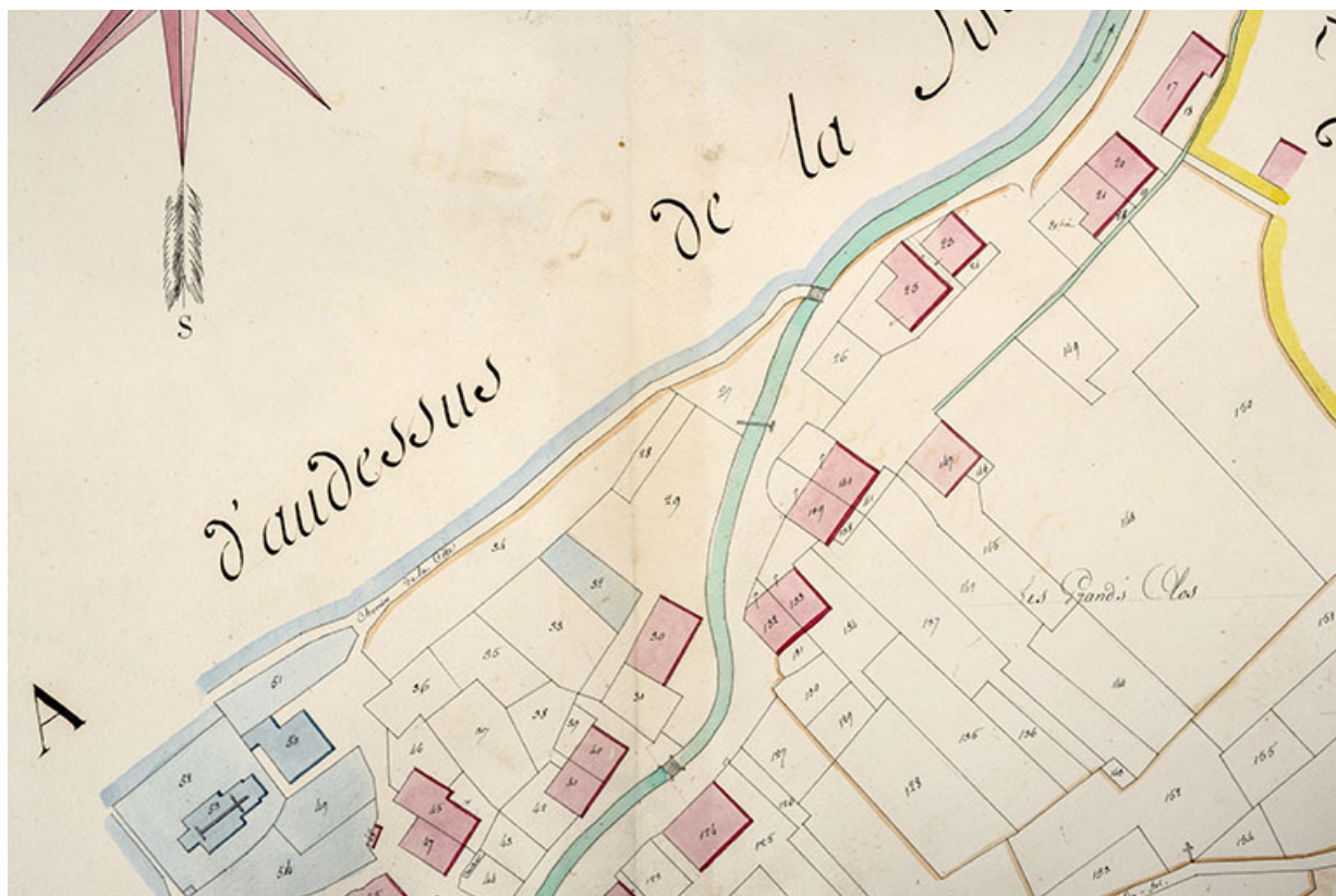
Cadastré de la commune des Gras. Atlas parcellaire, 1816, section E [détail : la Grande Rue], 1/1 250. 25, Les Gras