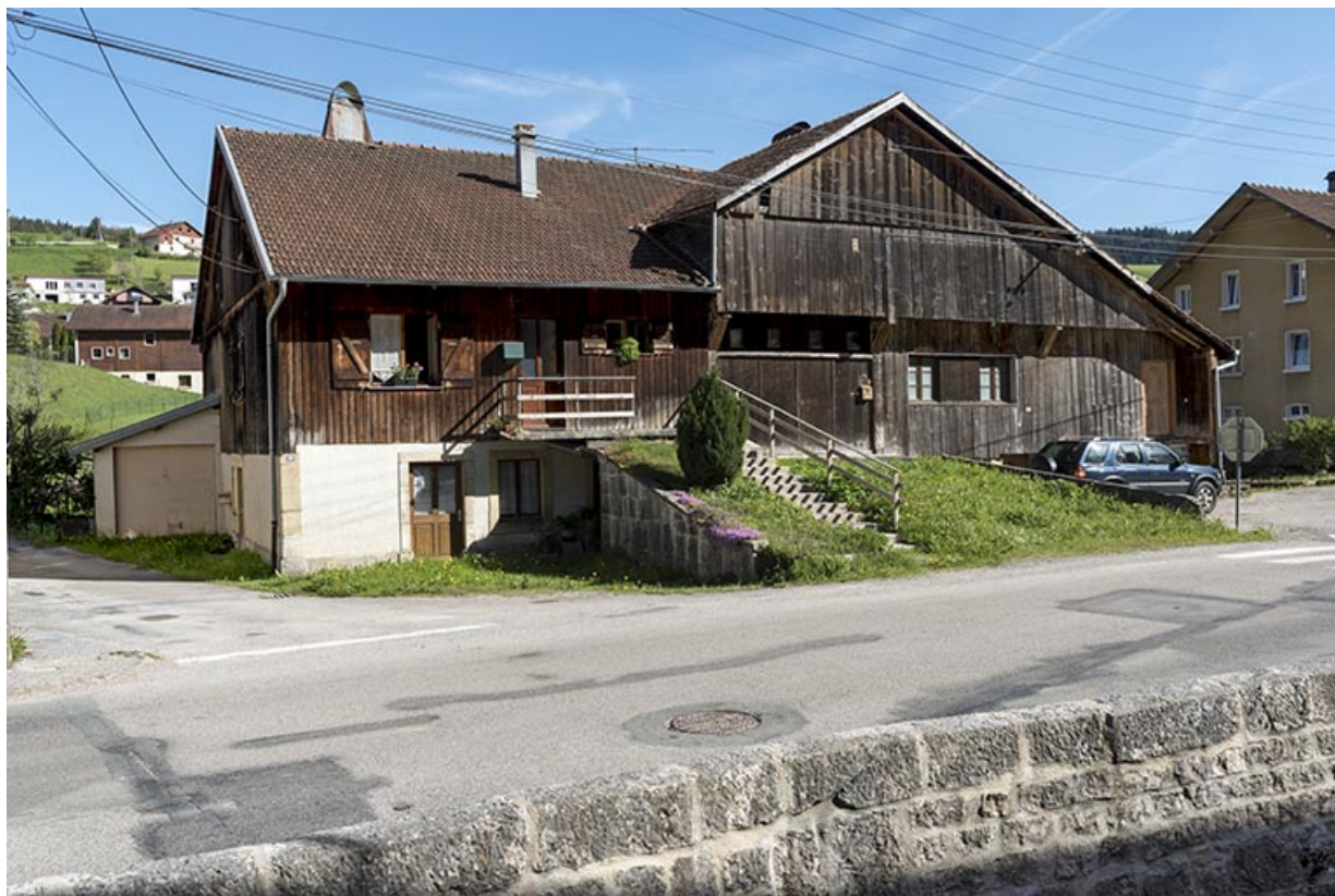
Façade antérieure, de trois quarts gauche. 25, Les Gras, 24-26 Grande Rue