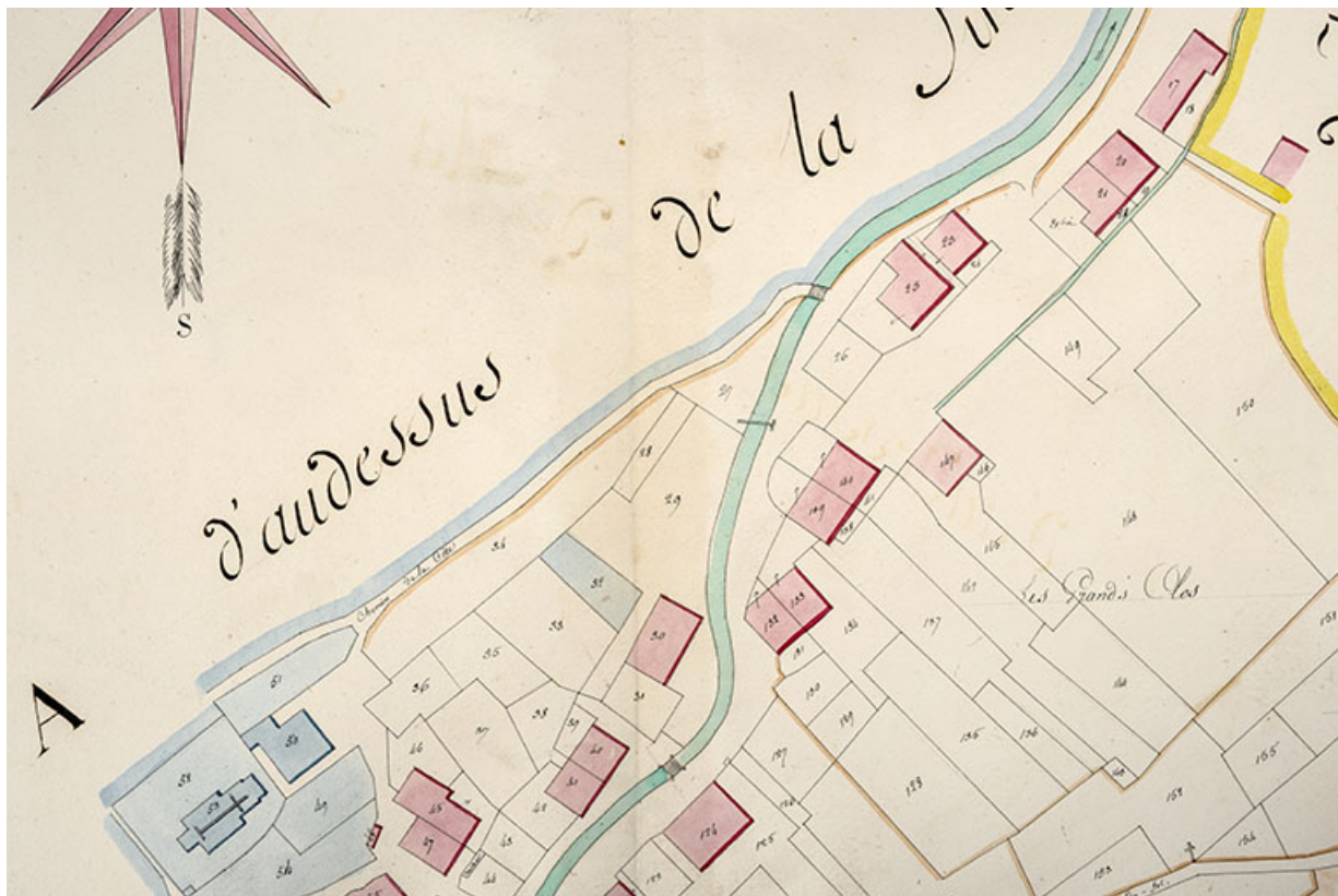
Cadastre de la commune des Gras. Atlas parcellaire, 1816, section E [détail : la Grande Rue], 1/1 250. 25, Les Gras, 24-26 Grande Rue