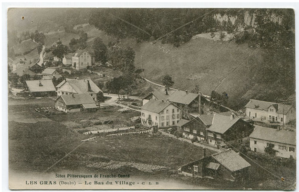
Sites pittoresques de Franche-Comté. Les Gras (Doubs) - Le bas du village, 1er quart 20e siècle [entre 1913 et 1919]. La fonderie est visible au centre, avec l'immeuble à l'arrière-plan.