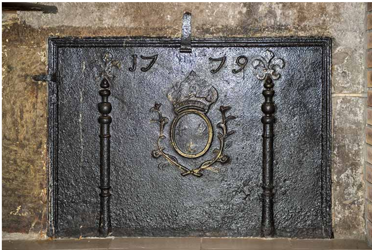
Plaque de cheminée datée de 1779 et aux fleurs de lys effacées.