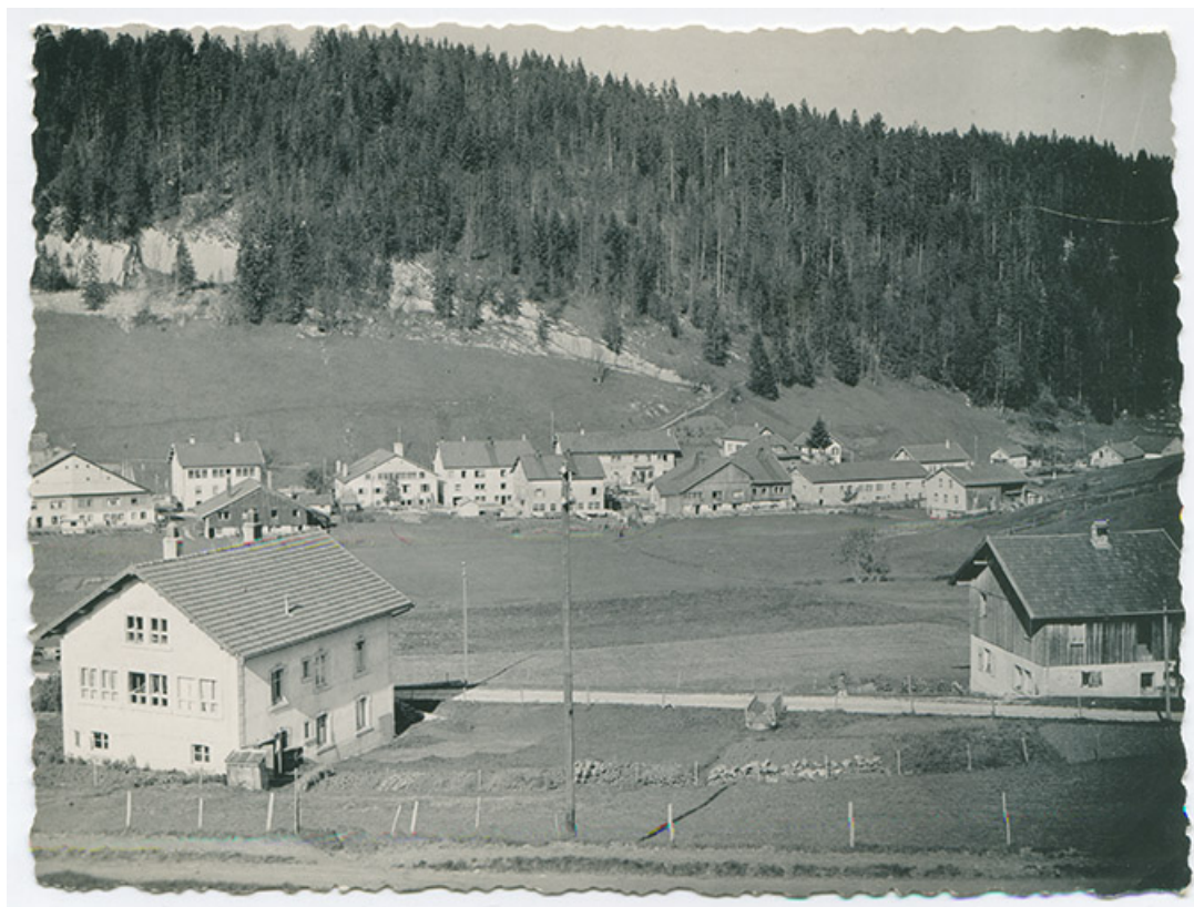
[Le bas du village des Gras, vu depuis l'est], 23 octobre 1950. La maison est au premier plan à gauche. 25, Les Gras