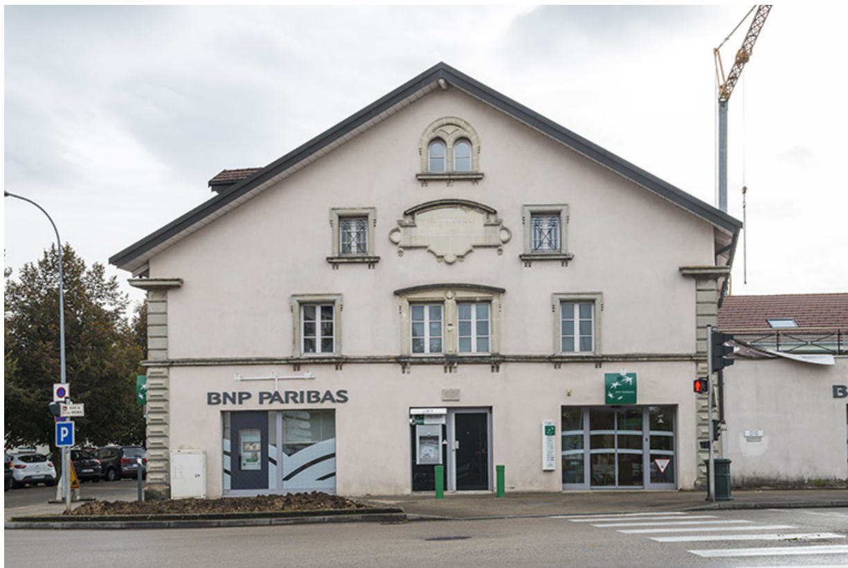
Pignon ouest de la maison Vichet (nord). 25, Pontarlier, 5-9 rue du docteur Grenier