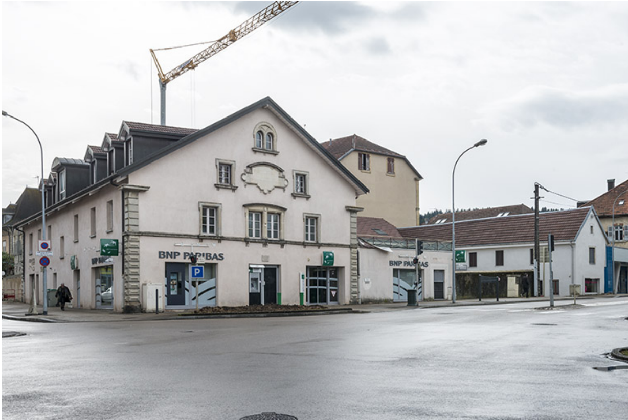
Vue de trois quarts des bâtiments nord. 25, Pontarlier, 5-9 rue du docteur Grenier