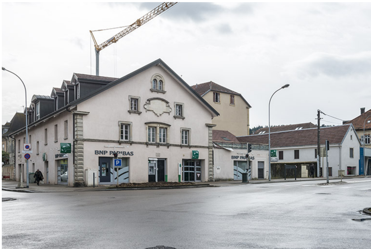
Vue de trois quarts des bâtiments nord. 25, Pontarlier, 5-9 rue du docteur Grenier