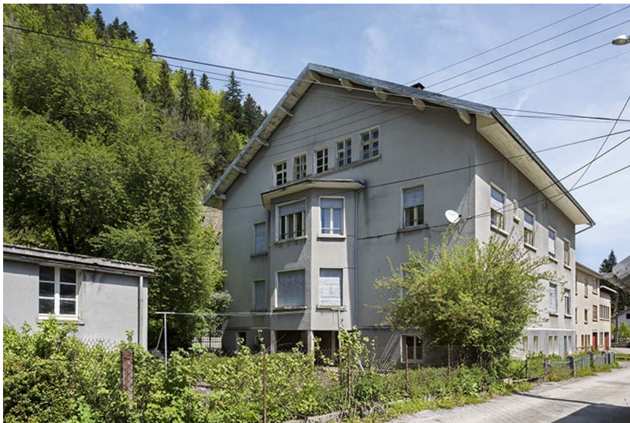
Façade latérale droite, de trois quarts droite. 25, Les Gras, 18 Grande Rue