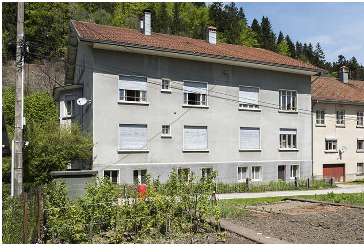
Façade postérieure, de trois quarts gauche. 25, Les Gras, 18 Grande Rue