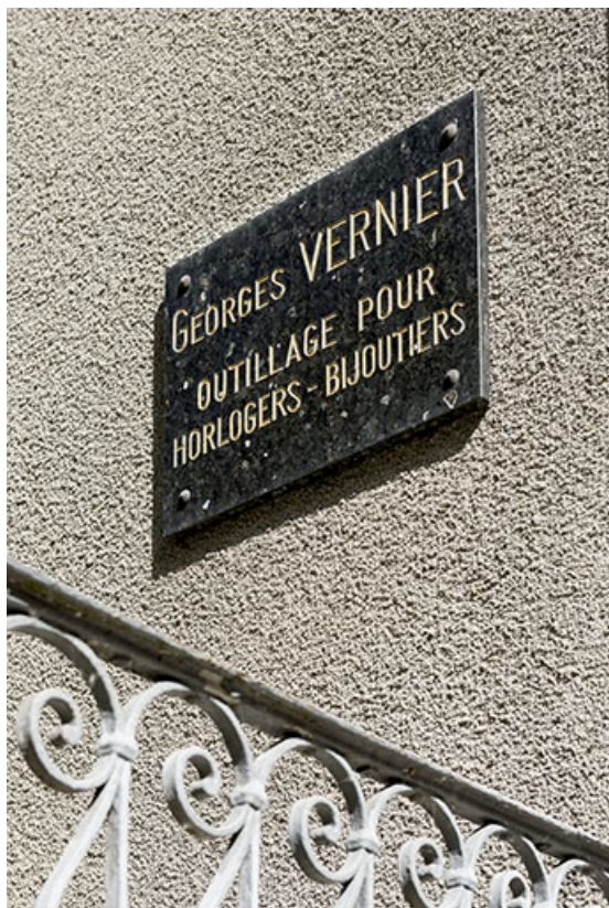
Plaque de la société Georges Vernier.