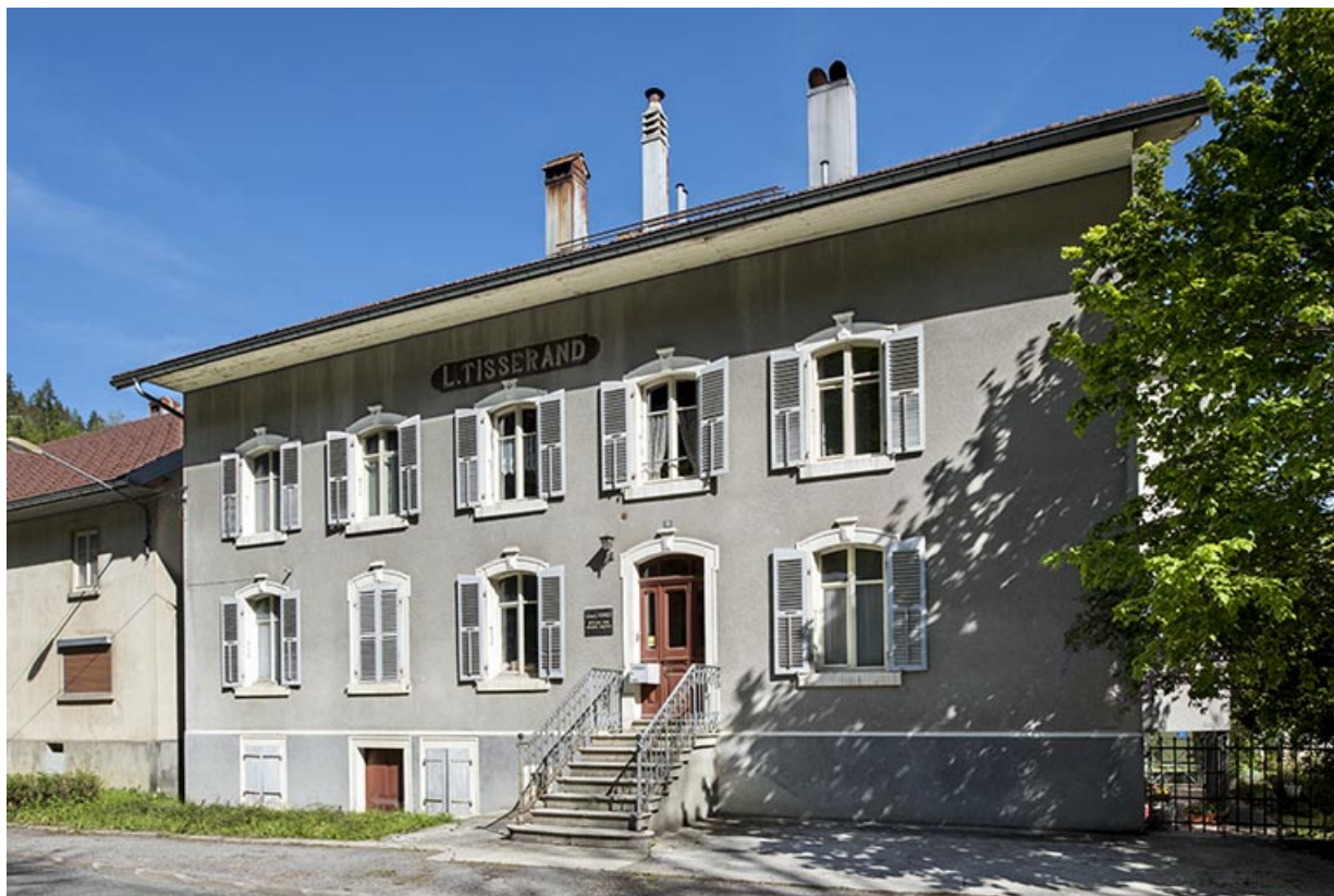
Façade antérieure, de trois quarts droite. 25, Les Gras