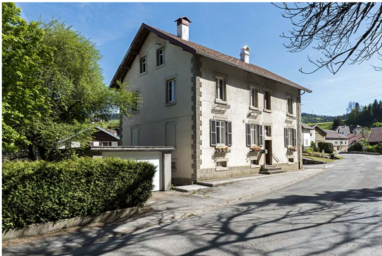
Façade antérieure, de trois quarts gauche. 25, Les Gras, 16 Grande Rue