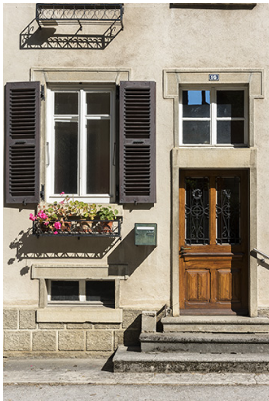
Façade antérieure : entrée et fenêtres.