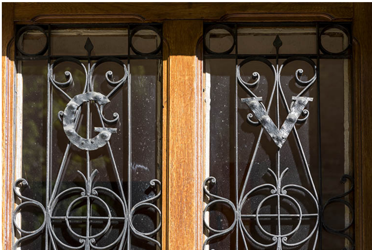
Façade antérieure : initiales G et V (Garnache Virgile) sur la ferronnerie de l'entrée. 25, Les Gras, 16 Grande Rue