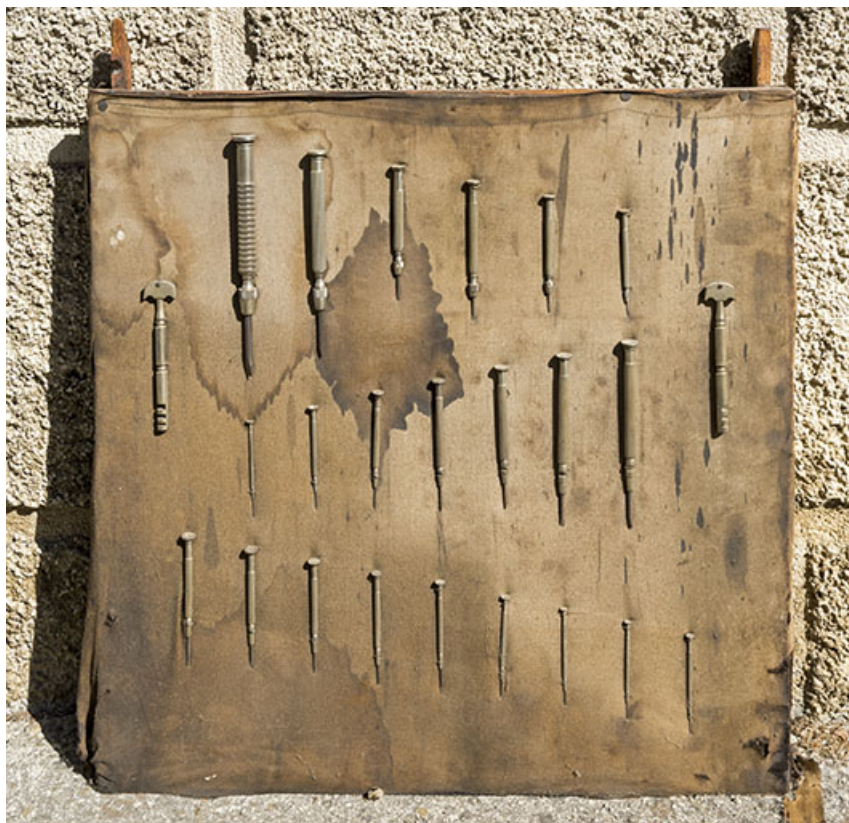
Présentoir de tournevis pour horlogers et coupe-verres.