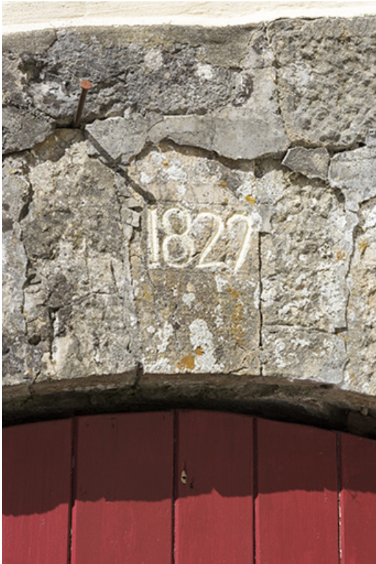
Façade antérieure : date 1829 gravée sur le pont de grange de gauche. 25, Les Gras, 10-12 Grande Rue