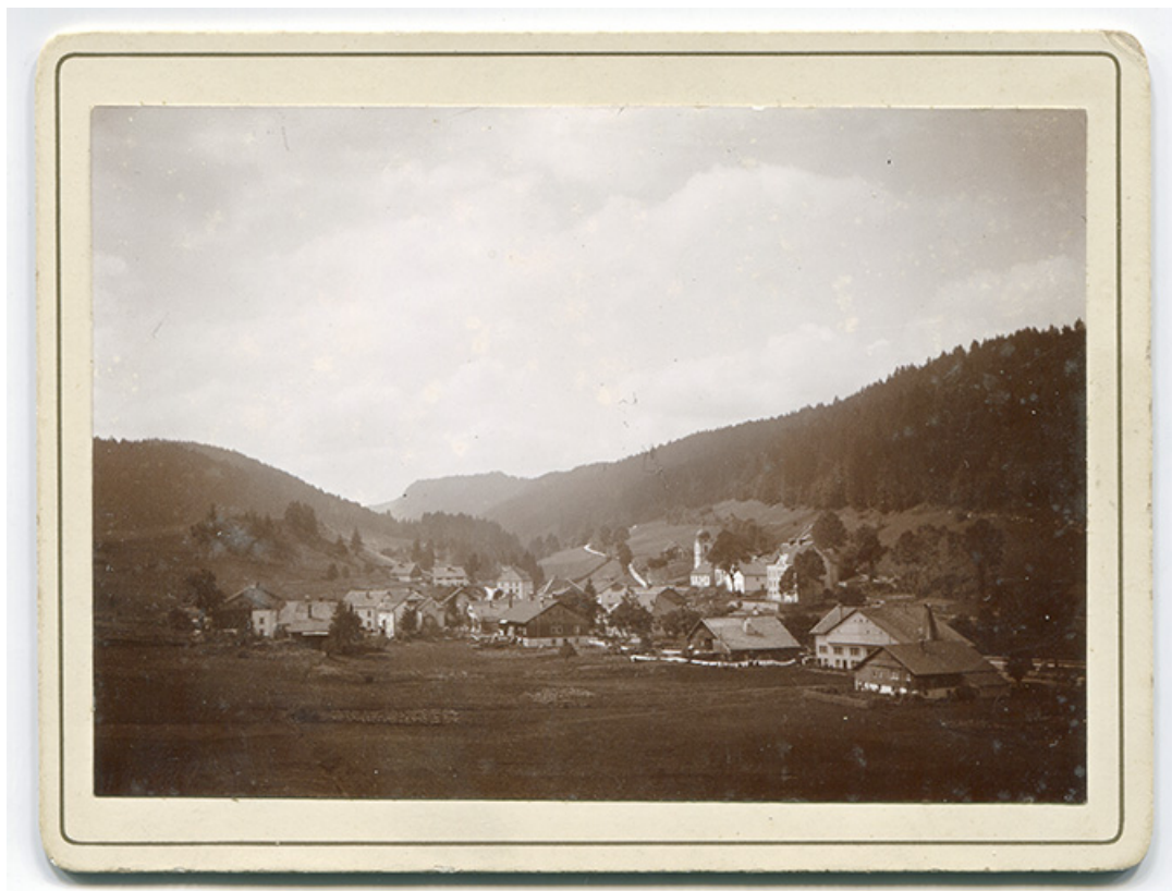
[Vue d'ensemble du village, depuis l'est], 1er quart 20e siècle [après 1910]. Le pignon nord du bâtiment, percé de fenêtres multiples, est visible à gauche.