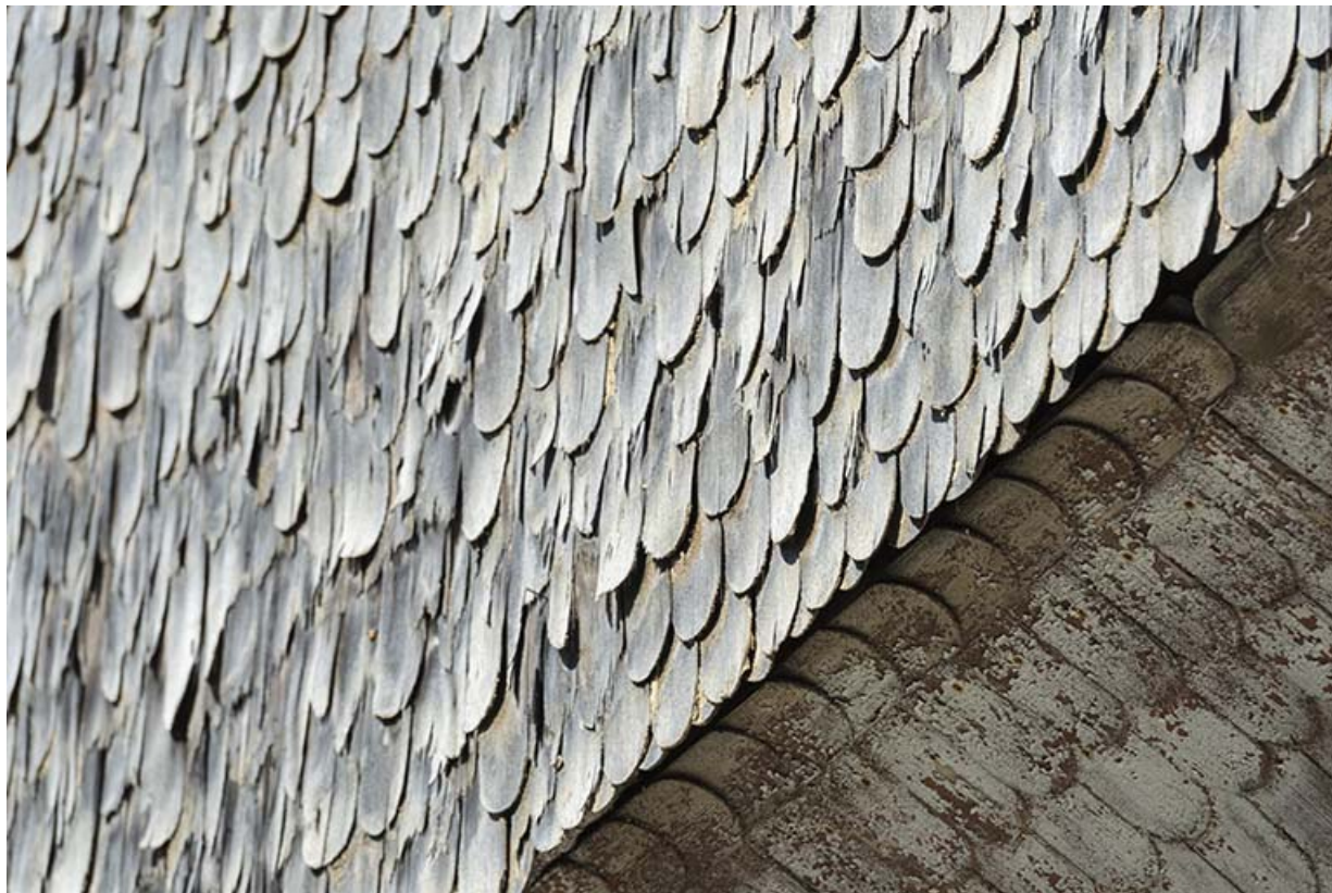
Façade postérieure : essentage de tavaillons. 25, Les Gras, 10-12 Grande Rue