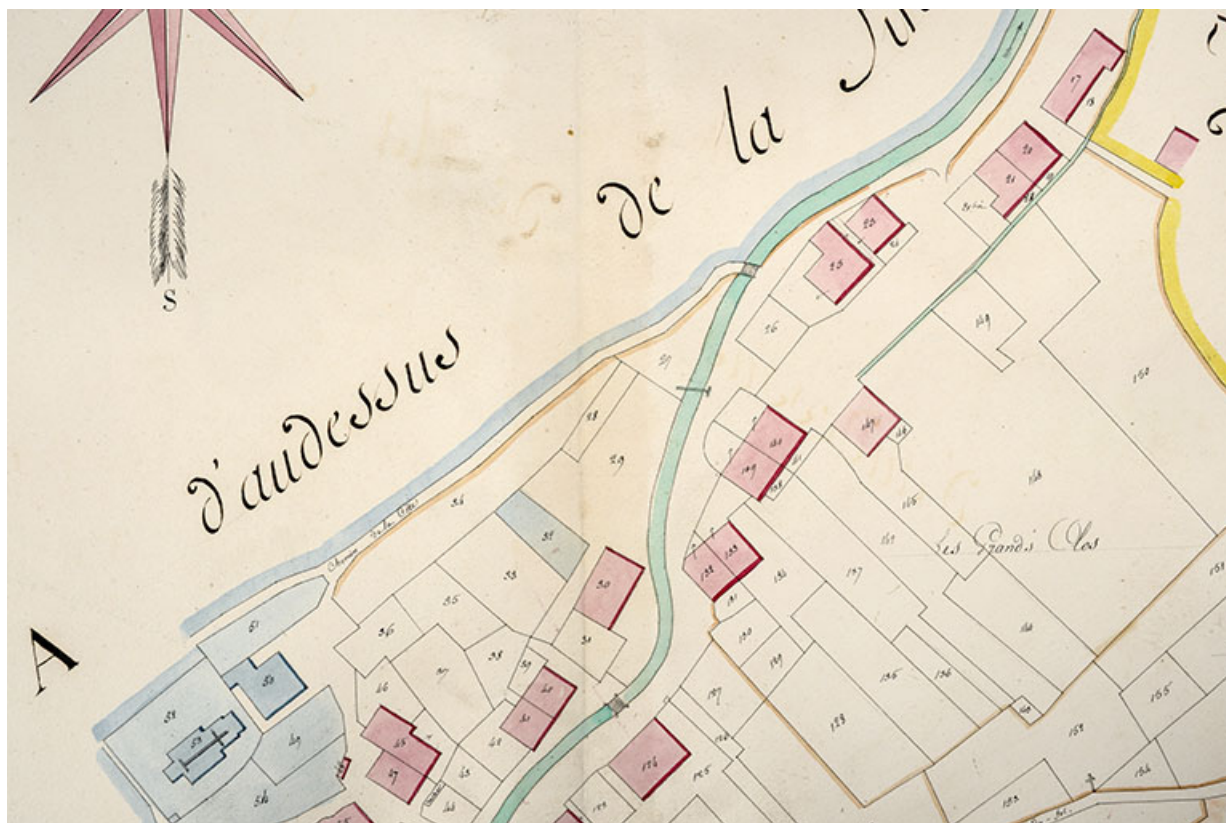
Cadastre de la commune des Gras. Atlas parcellaire, 1816, section E [détail : la Grande Rue], 1/1 250. 25, Les Gras, 24-26 Grande Rue