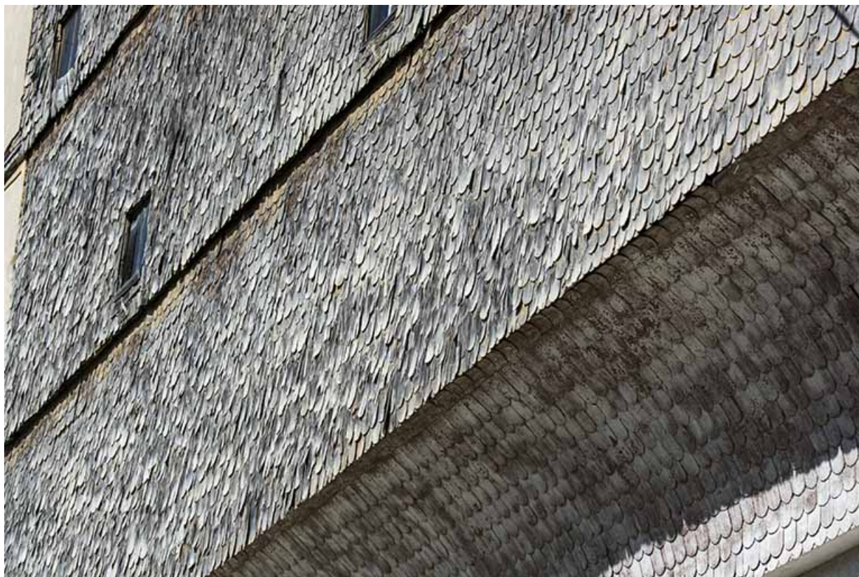
Façade postérieure : rang pendu et essentage de tavaillons.