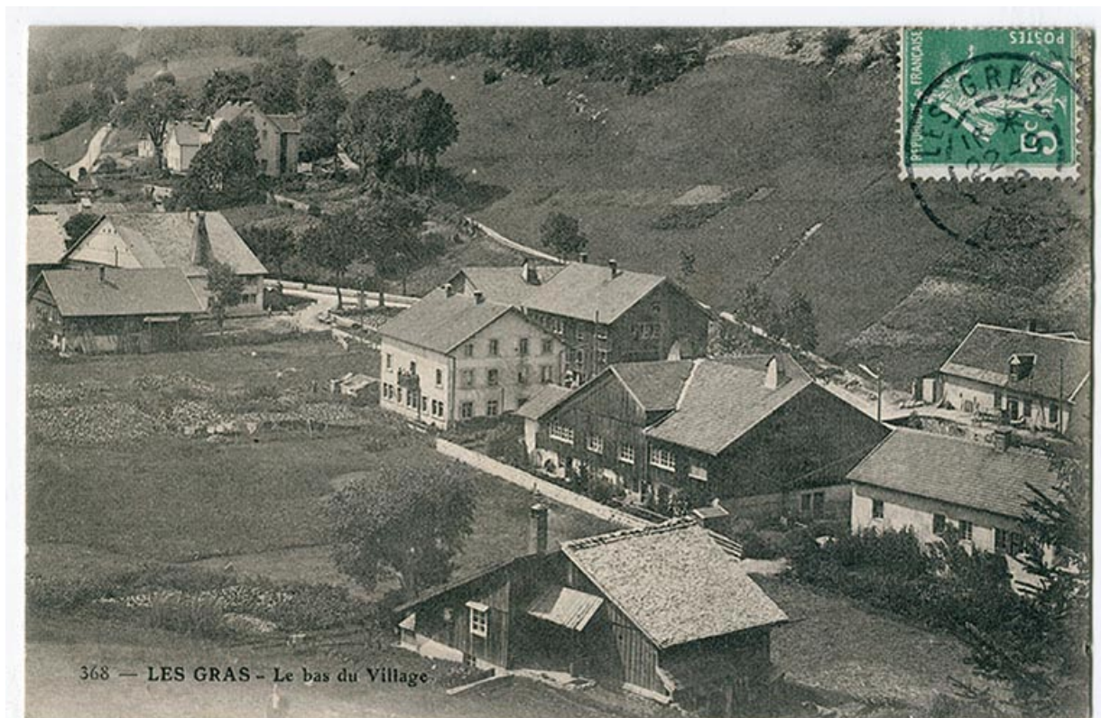
368 - Les Gras - Le bas du village, 1er quart 20e siècle [avant 1909]. La fonderie est visible au centre, avec l'immeuble à l'arrière-plan.