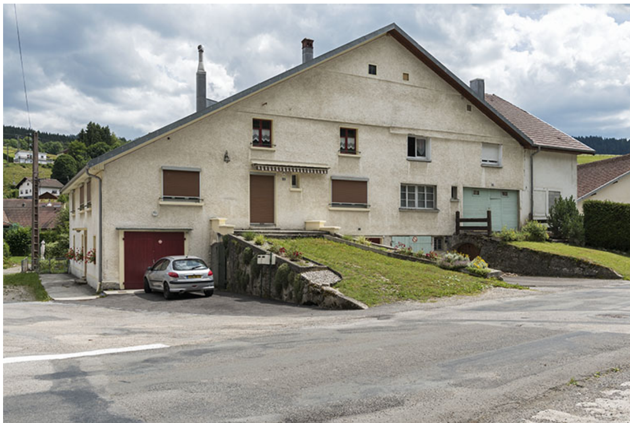
Façade antérieure, de trois quarts gauche. 25, Les Gras, 10-12 Grande Rue