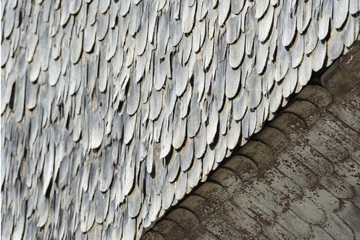
Façade postérieure : essentage de tavillons.