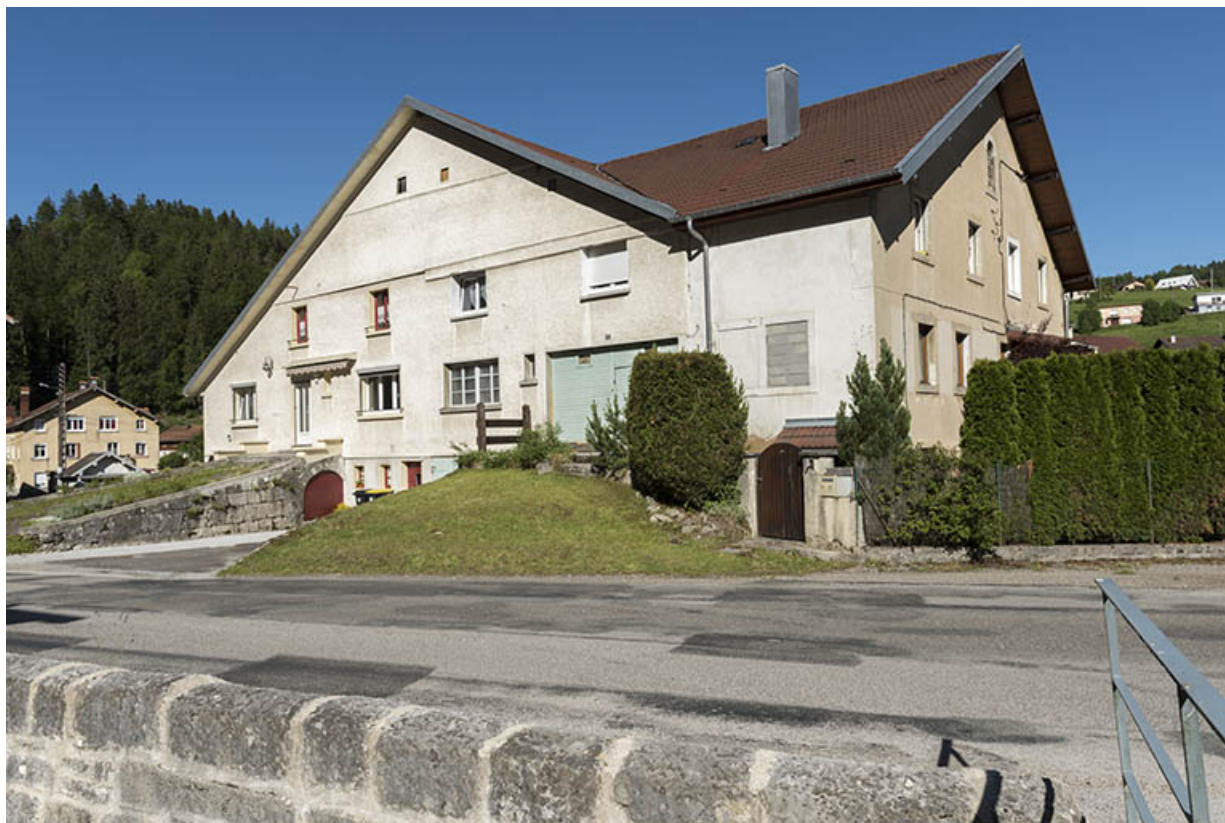
Façade antérieure, de trois quarts droite.