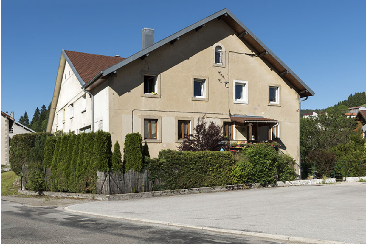
Façade latérale droite. L'emplacement des fenêtres bouchées est visible au 1er étage.