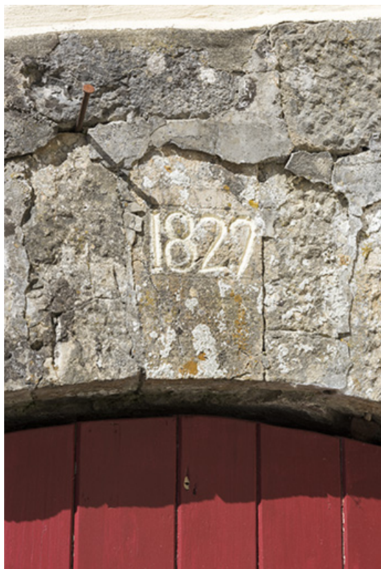
Façade antérieure : date 1829 gravée sur le pont de grange de gauche. 25, Les Gras, 10-12 Grande Rue