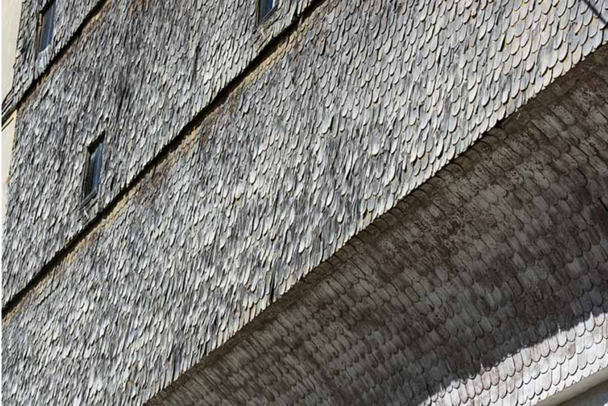
Façade postérieure : rang pendu et essentage de tavaillons.