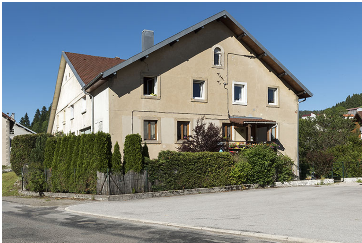
Façade latérale droite. L'emplacement des fenêtres bouchées est visible au 1er étage. 25, Les Gras, 10-12 Grande Rue