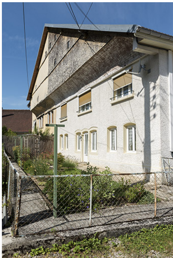
Façade postérieure, vue en enfilade.