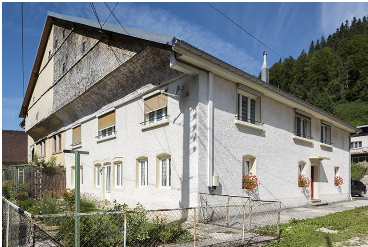
Façades postérieure et latérale gauche.