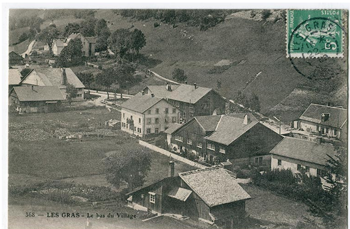
368 - Les Gras - Le bas du village, 1er quart 20e siècle [avant 1909]. La fonderie est visible au centre, avec l'immeuble à l'arrière-plan.