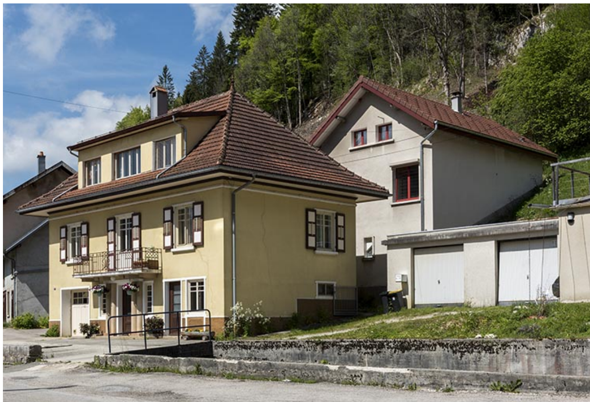
Vue d'ensemble, depuis le nord-est.