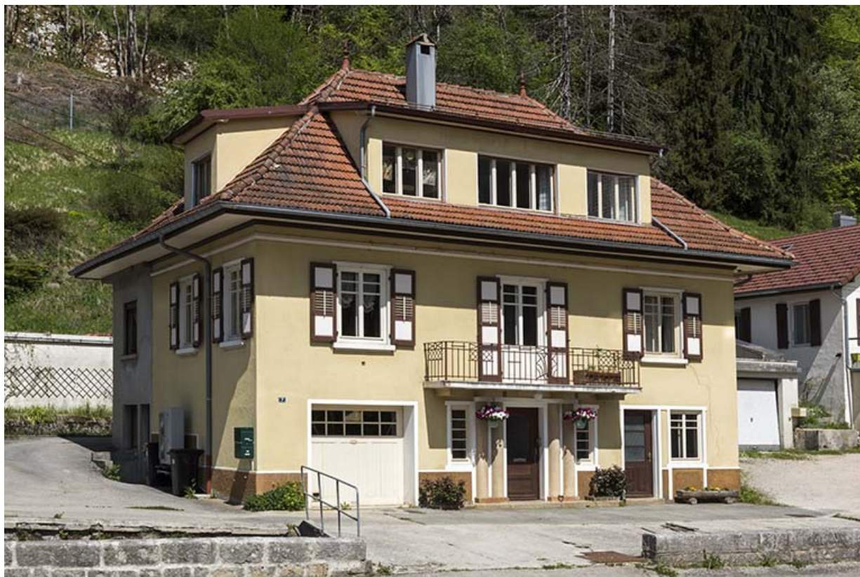
Maison, de trois quarts gauche.