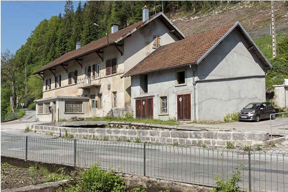
Vue d'ensemble, depuis l'est.