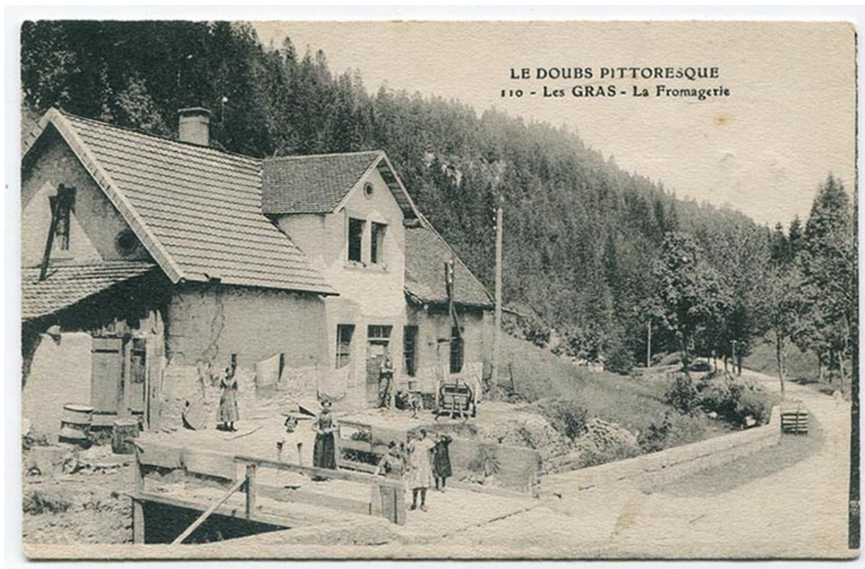
Le Doubs pittoresque. 110 - Les Gras - La fromagerie, limite 19e siècle 20e siècle. 25, Les Gras, 5 Grande Rue

Le Doubs pittoresque. 110 - Les Gras - La fromagerie, carte postale, s.n., s.d. [limite 19e siècle 20e siècle]. Publiée dans : Vuillet, Bernard. Le val de Morteau et les Brenets en 1900. - 1978, p. 272.