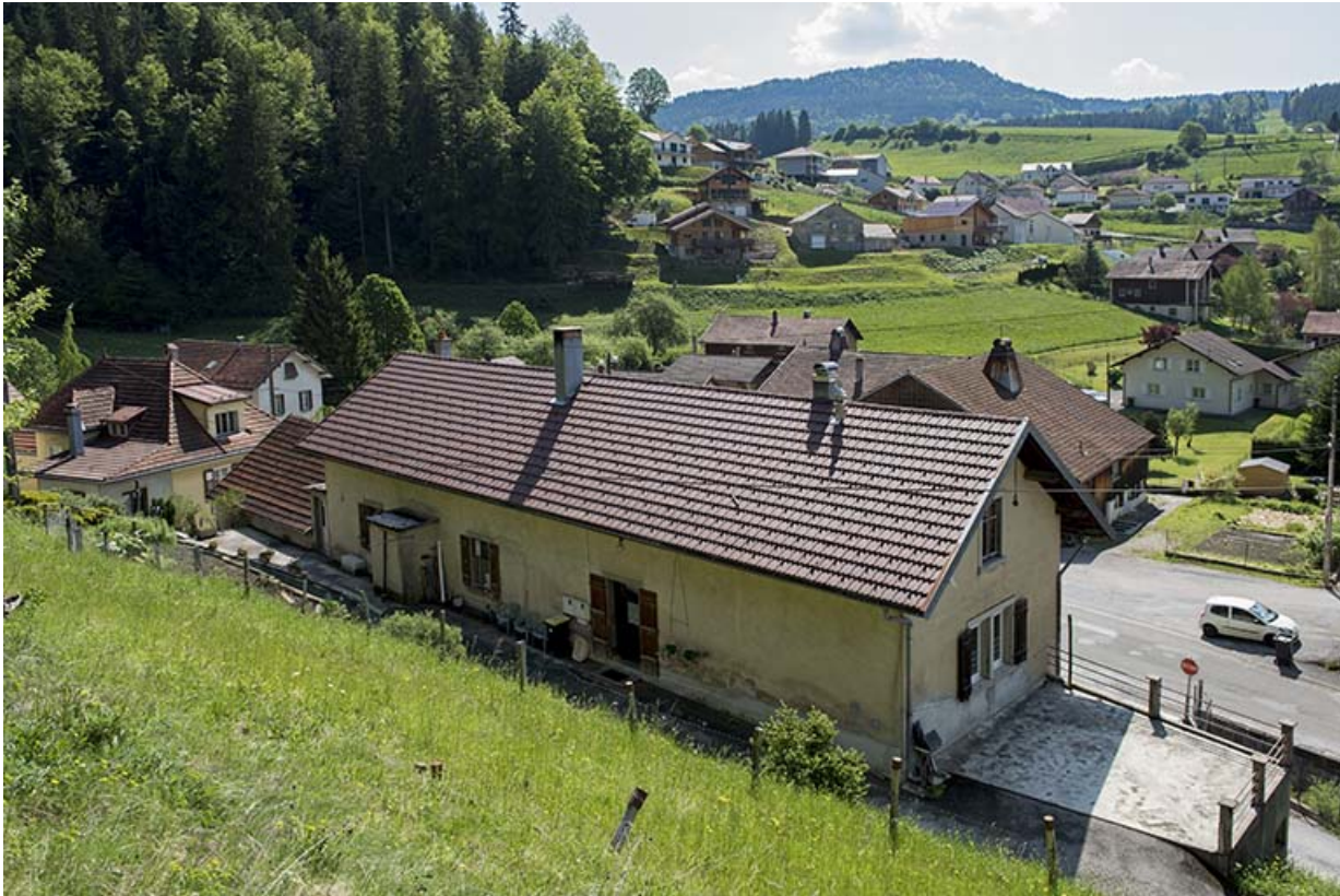
Vue plongeante sur la façade postérieure, de trois quarts droite.