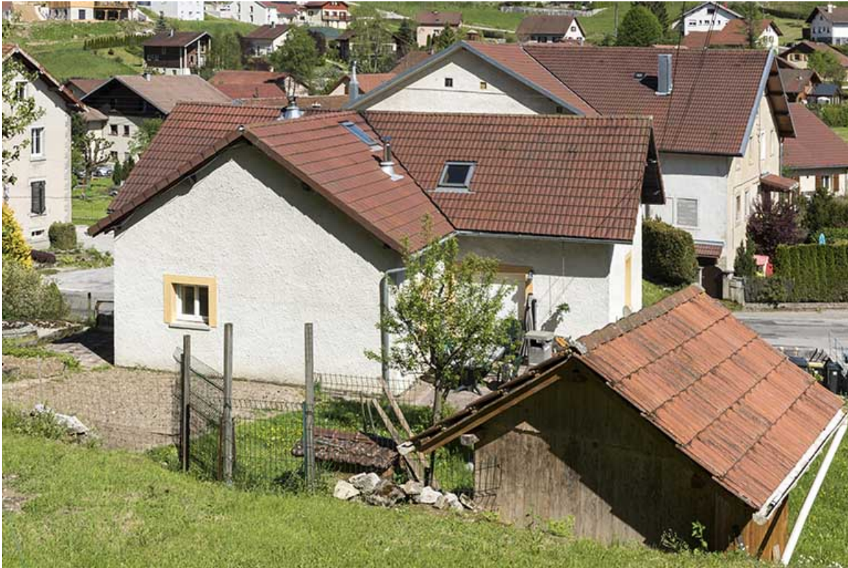
Façade postérieure (vue plongeante).