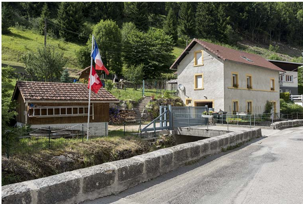
Vue d'ensemble, depuis le sud (façades antérieure et latérale gauche). 25, Les Gras, 3 Grande Rue