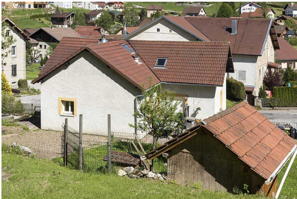
Façade postérieure (vue plongeante). 25, Les Gras, 3 Grande Rue