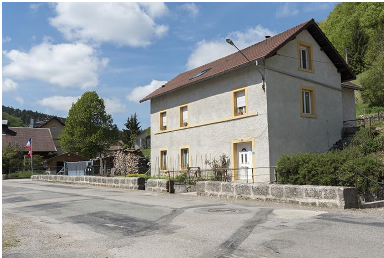
Façades antérieure et latérale droite.