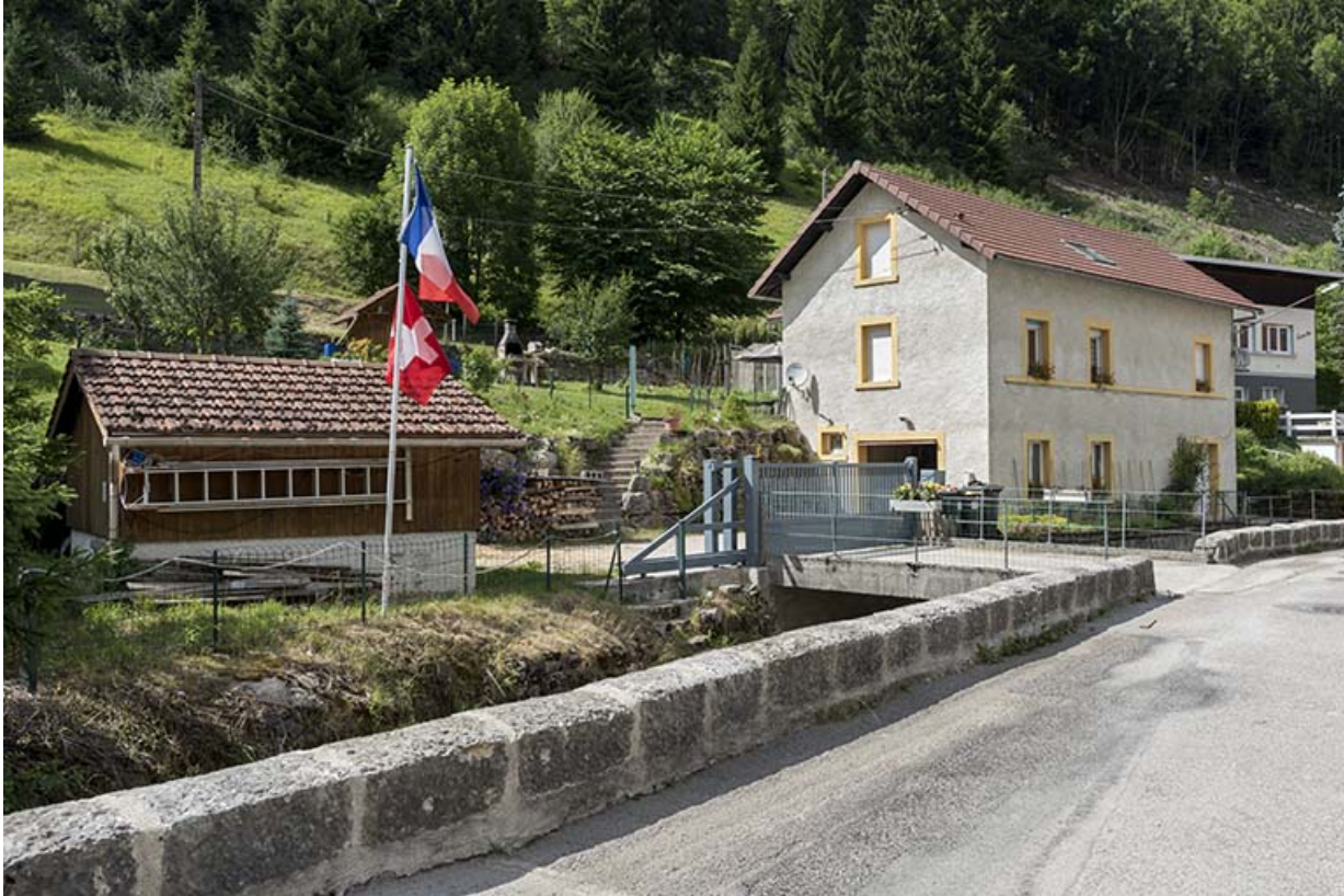
Vue d'ensemble, depuis le sud (façades antérieure et latérale gauche).