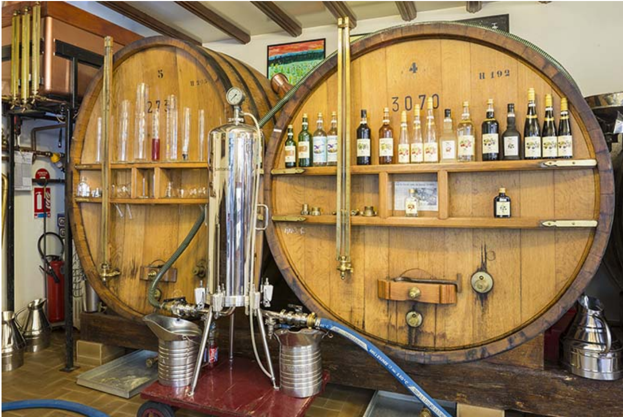
Deux foudres de vieillissement.