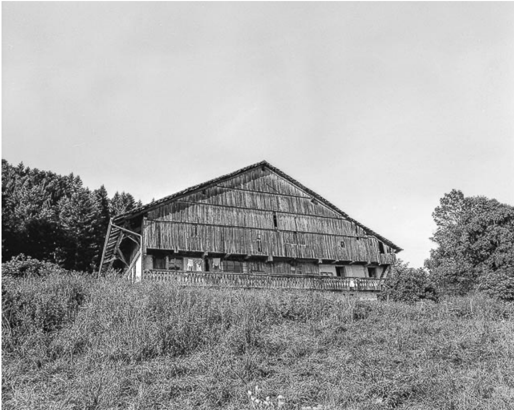
Ferme située au lieu-dit Les Pargots : façade antérieure.

25, Villers-le-Lac, 13 rue des Vieux Pargots, lieudit : les Pargots