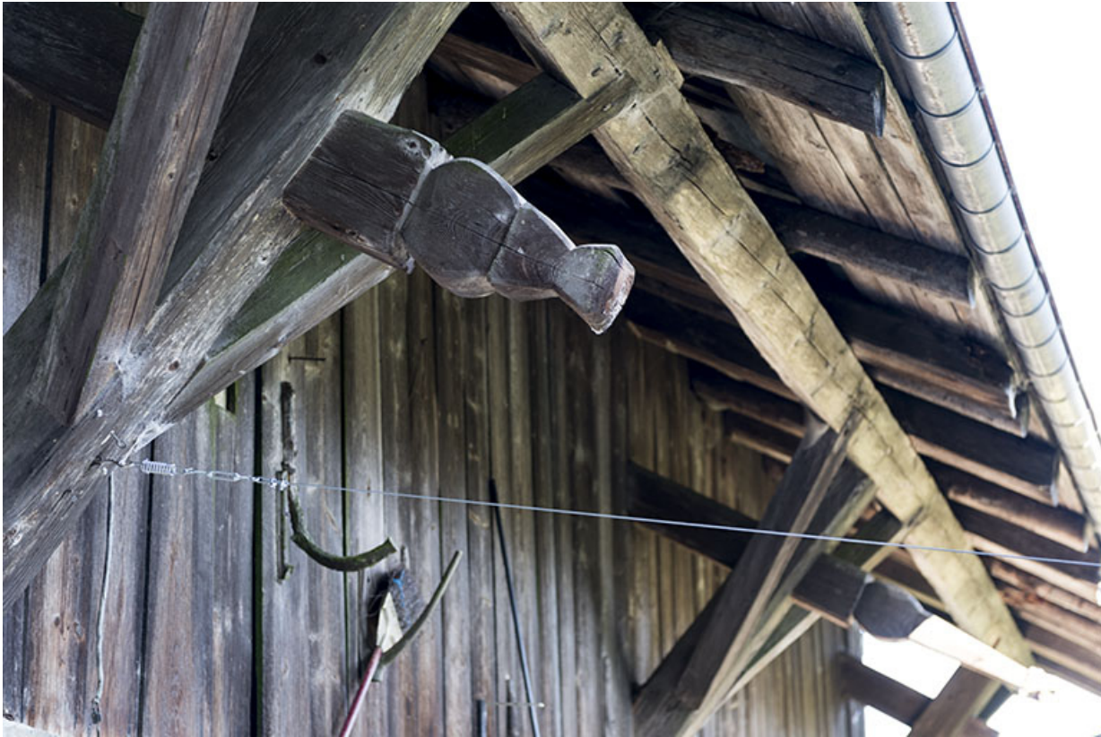
Façade latérale droite : extrémité de pièce de charpente sculptée.

25, Villers-le-Lac, 13 rue des Vieux Pargots, lieudit : les Pargots