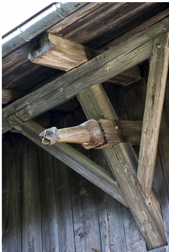
Façade latérale droite : extrémité de pièce de charpente sculptée.

25, Villers-le-Lac, 13 rue des Vieux Pargots, lieudit : les Pargots