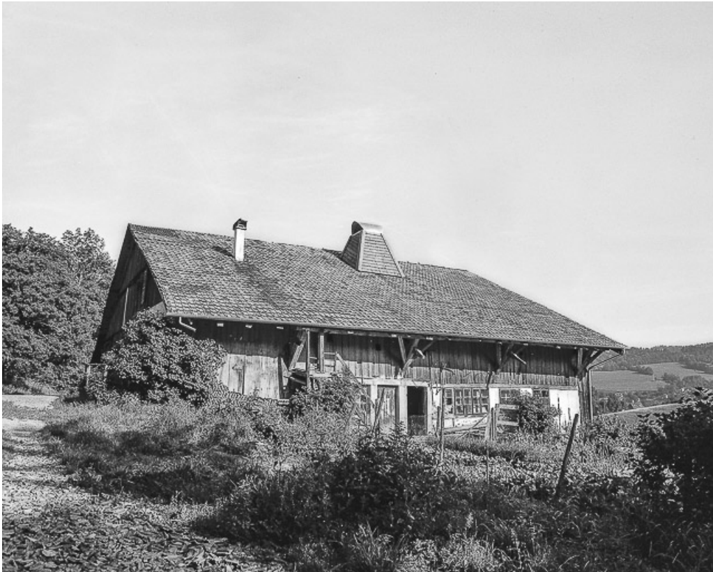
Ferme située au lieu-dit Les Pargots : façade latérale gauche.

25, Villers-le-Lac, 13 rue des Vieux Pargots, lieudit : les Pargots