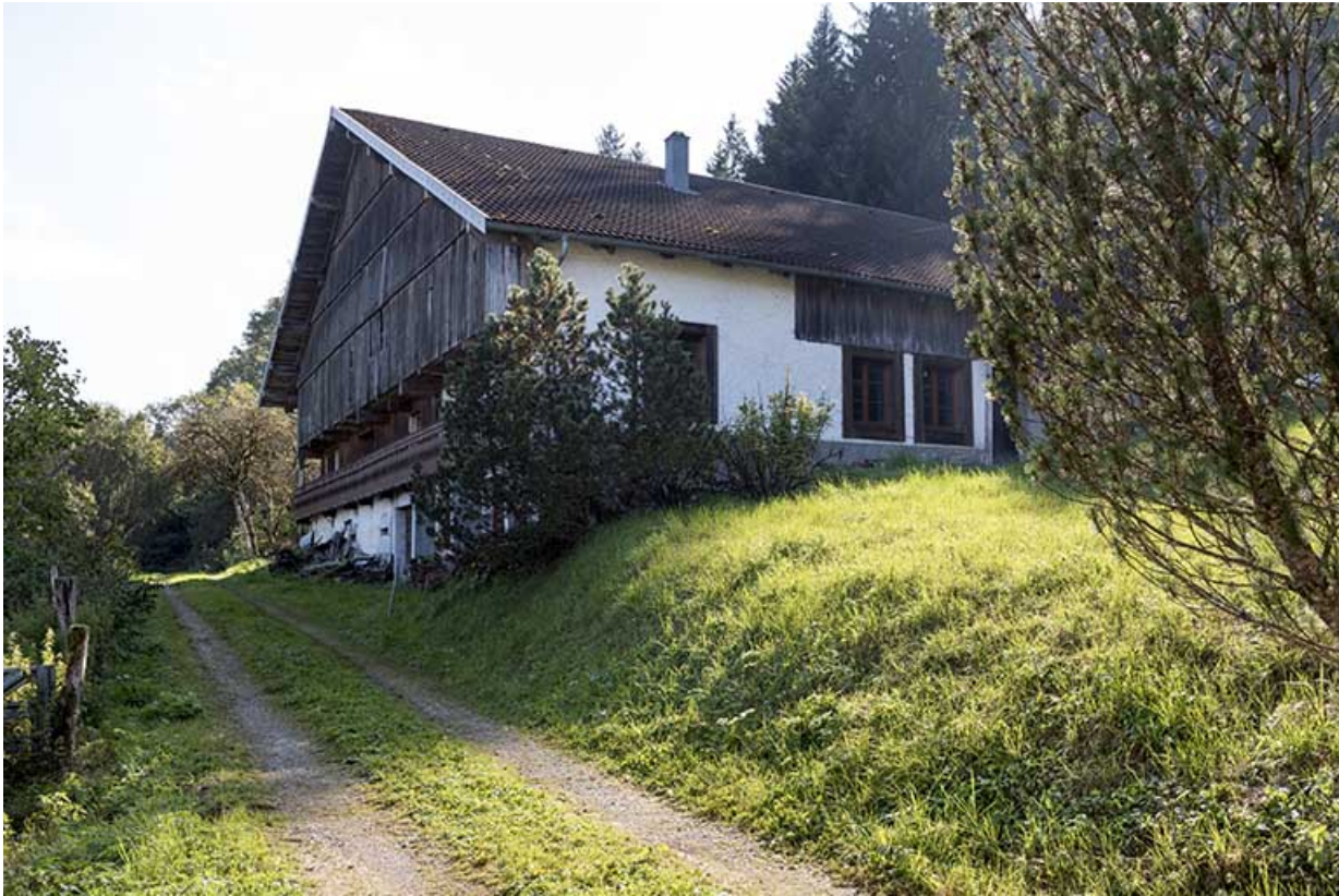
Vue d'ensemble, depuis l'ouest (façades postérieure et latérale gauche).

25, Villers-le-Lac, 13 rue des Vieux Pargots, lieudit : les Pargots