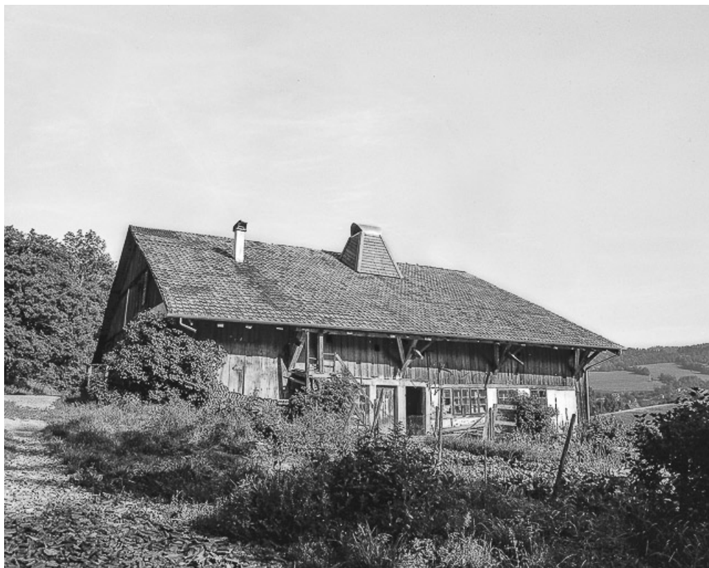
Ferme située au lieu-dit Les Pargots : façade latérale gauche.

25, Villers-le-Lac, 13 rue des Vieux Pargots, lieudit : les Pargots