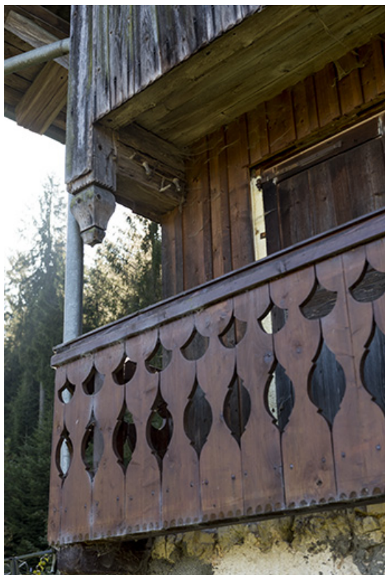
Façade postérieure : détail du garde-corps.

25, Villers-le-Lac, 13 rue des Vieux Pargots, lieudit : les Pargots