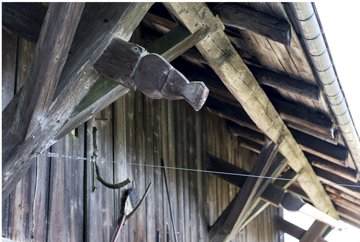
Façade latérale droite : extrémité de pièce de charpente sculptée.

25, Villers-le-Lac, 13 rue des Vieux Pargots, lieudit : les Pargots