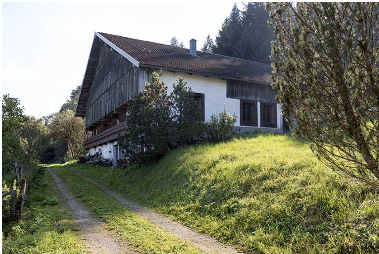
Vue d'ensemble, depuis l'ouest (façades postérieure et latérale gauche).

25, Villers-le-Lac, 13 rue des Vieux Pargots, lieudit : les Pargots