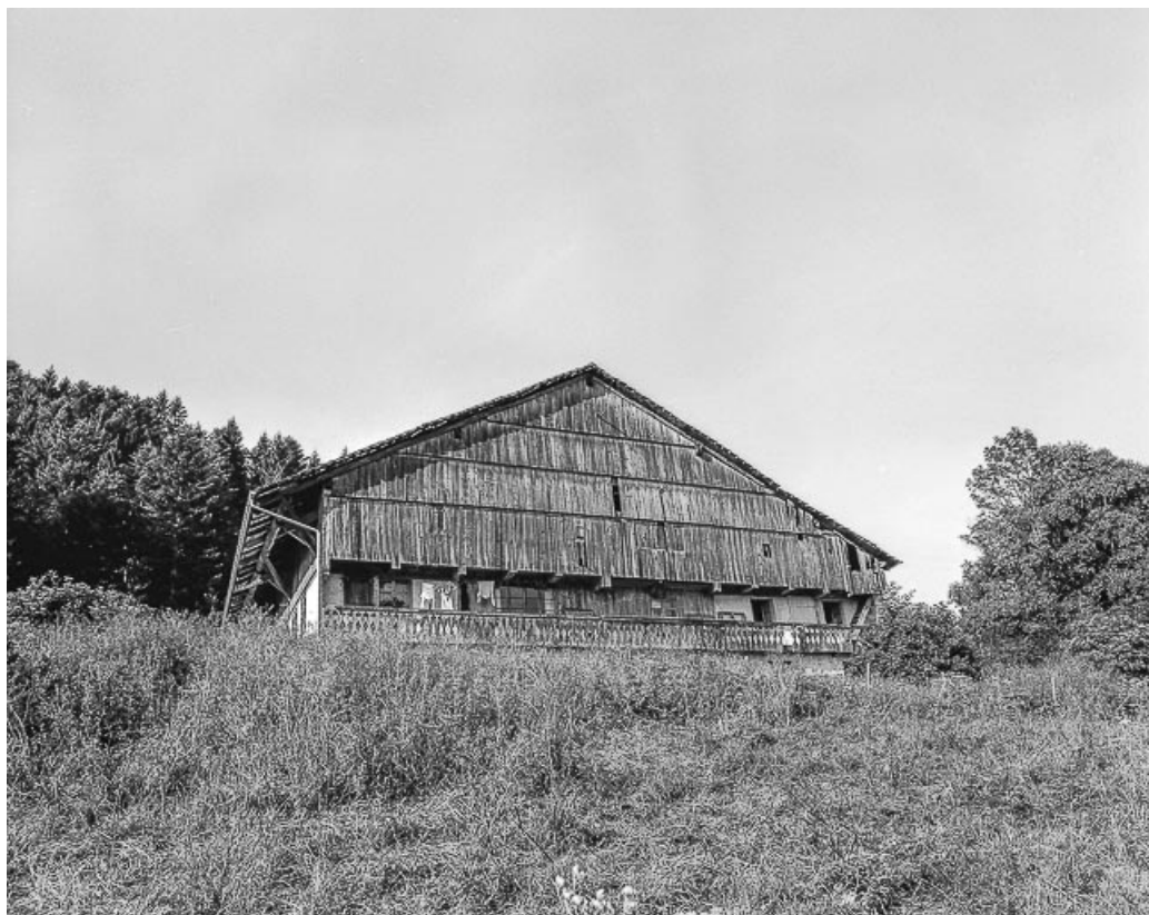
Ferme située au lieu-dit Les Pargots : façade antérieure.

25, Villers-le-Lac, 13 rue des Vieux Pargots, lieudit : les Pargots