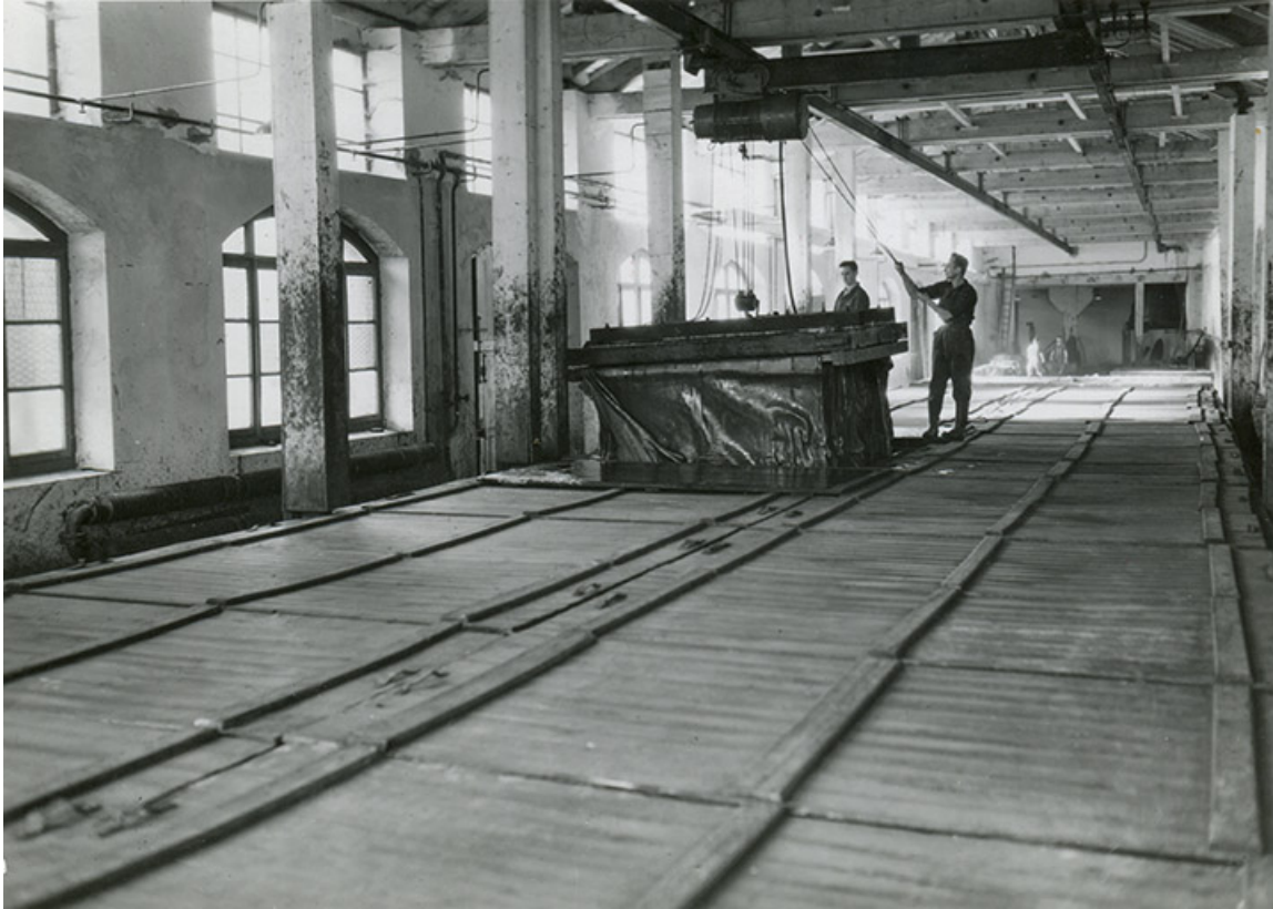
Salle des bains (bac de trempé des peaux), fotogr., s.d. [vers 1950]. 25, Pontarlier rue de la Fontaine