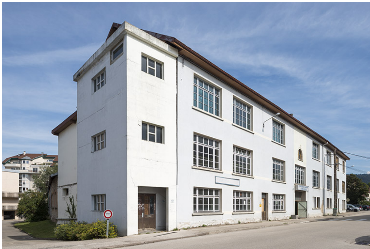
Atelier de fabrication sur rue. Vue d'ensemble depuis le nord.