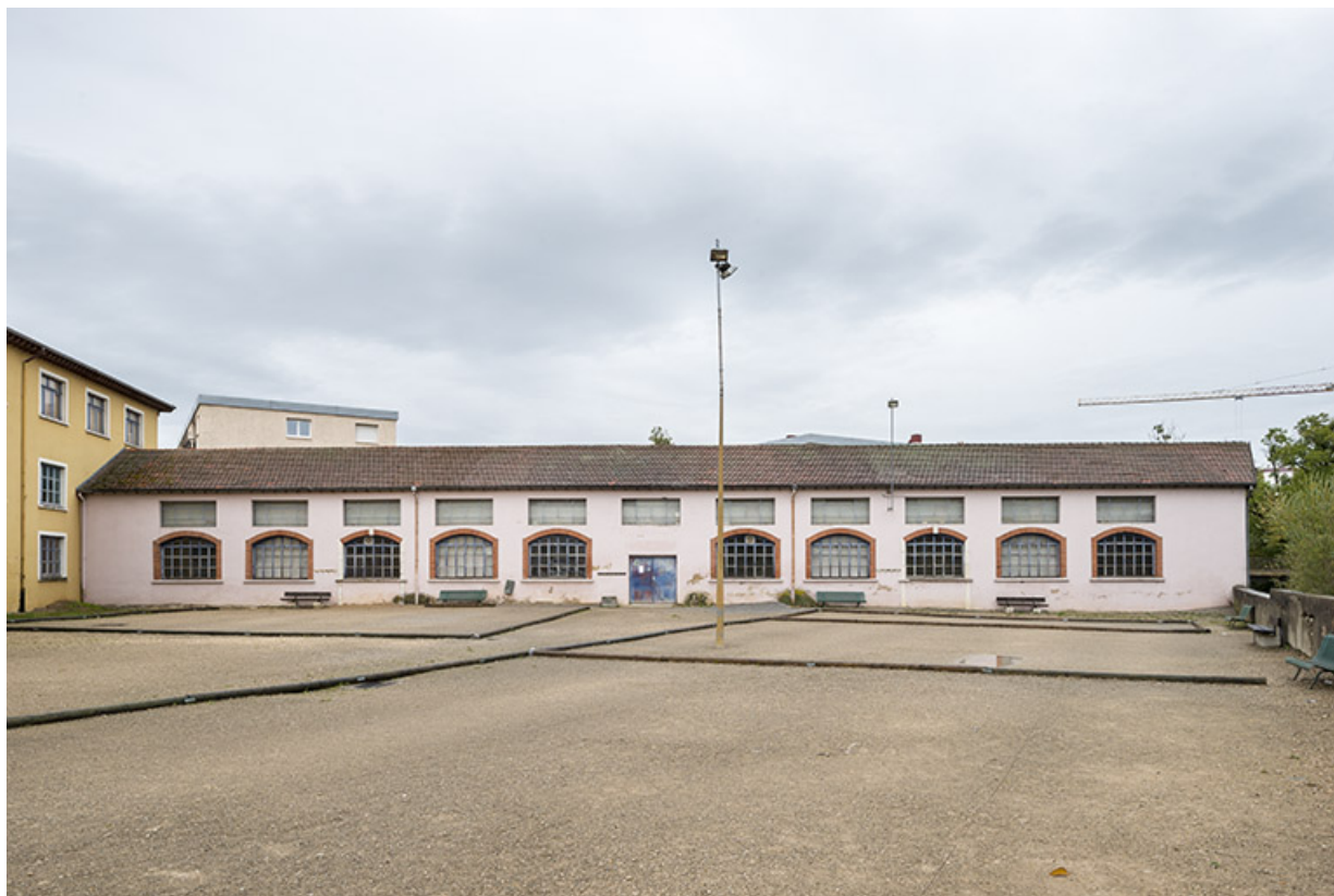
Bâtiment perpendiculaire à l'atelier principal. Façade sud. 25, Pontarlier rue de la Fontaine