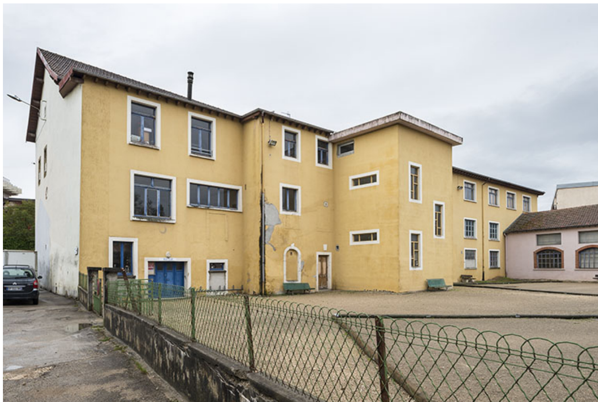
Atelier sur rue. Vue de trois quarts arrière. 25, Pontarlier rue de la Fontaine