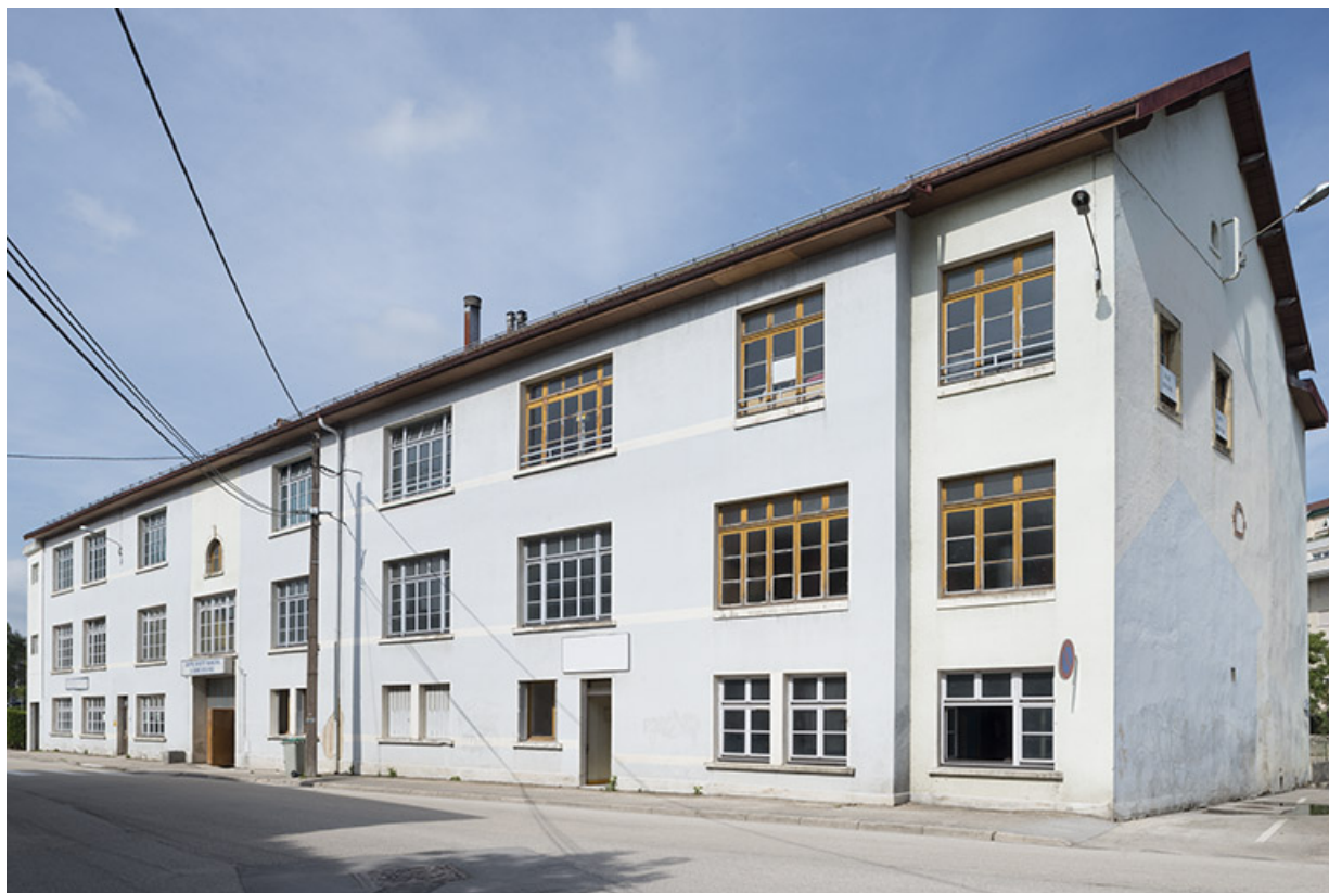
Atelier de fabrication sur rue. Vue de trois quarts droite. 25, Pontarlier rue de la Fontaine