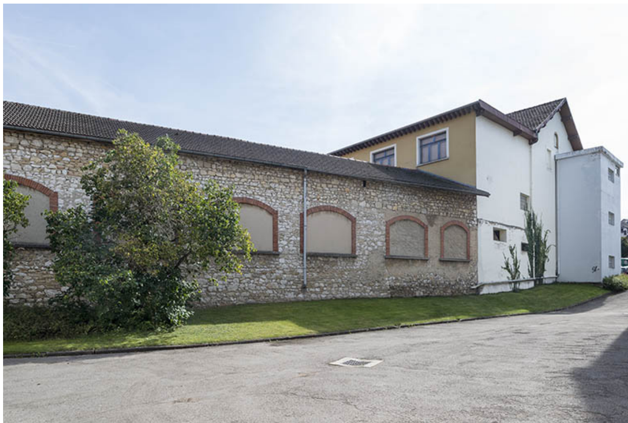
Atelier (?) en retour d'angle. Façade nord. 25, Pontarlier rue de la Fontaine