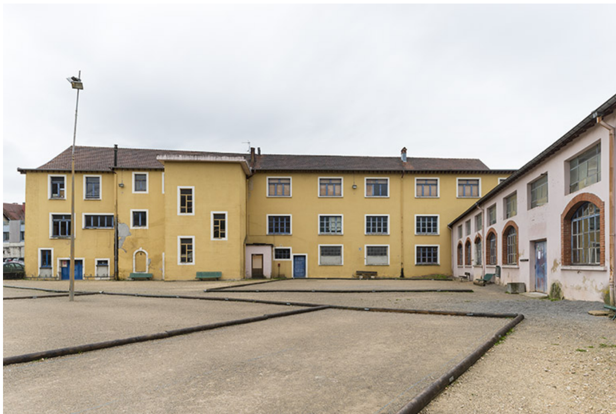
Façade postérieure de l'atelier principal.