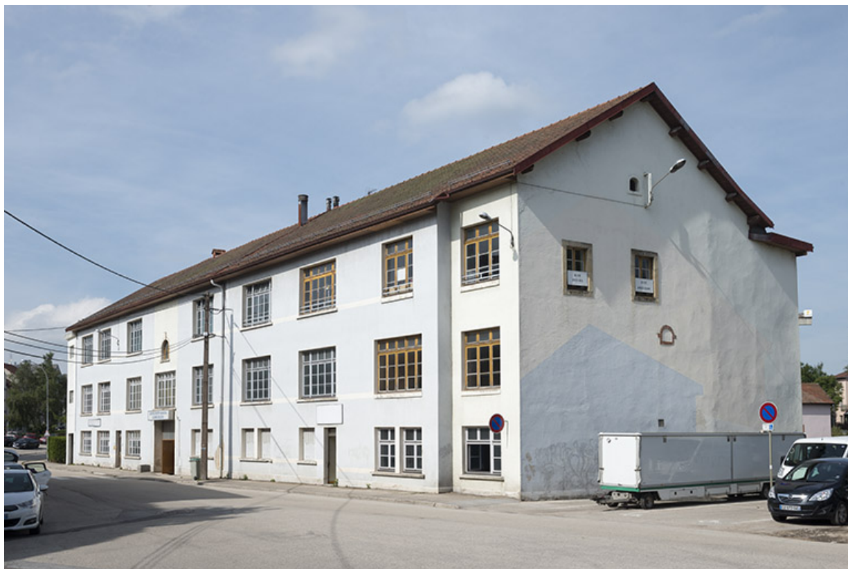
Vue d'ensemble depuis le sud. 25, Pontarlier rue de la Fontaine