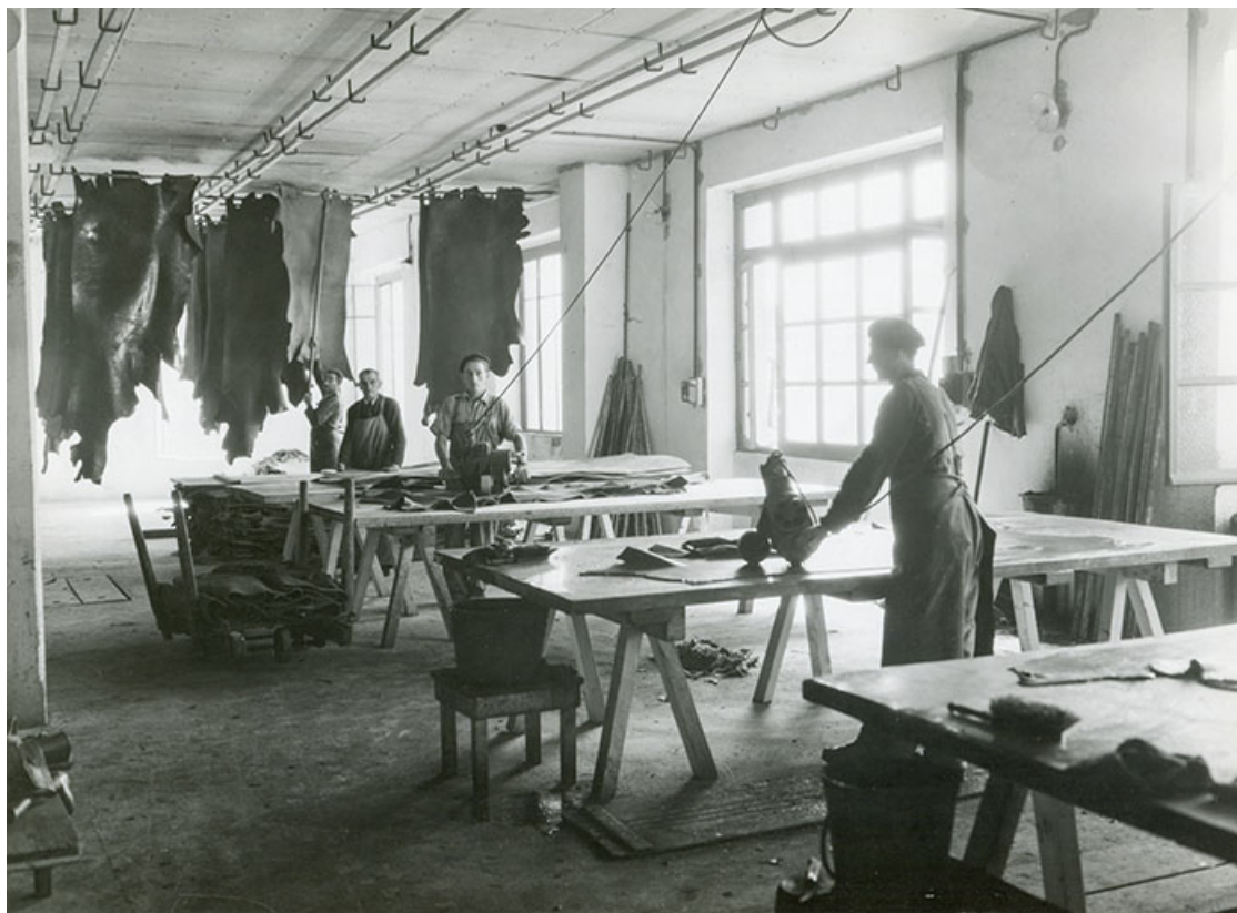
Atelier d'échantillonnage, fotogr., s.d. [vers 1950].