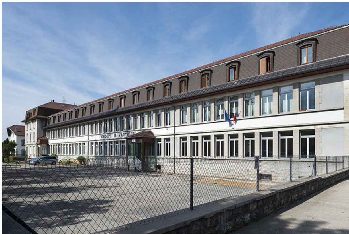
Façade sud vue de trois quarts droite.