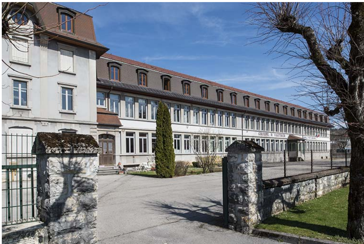
Façade sud vue de trois quarts gauche.