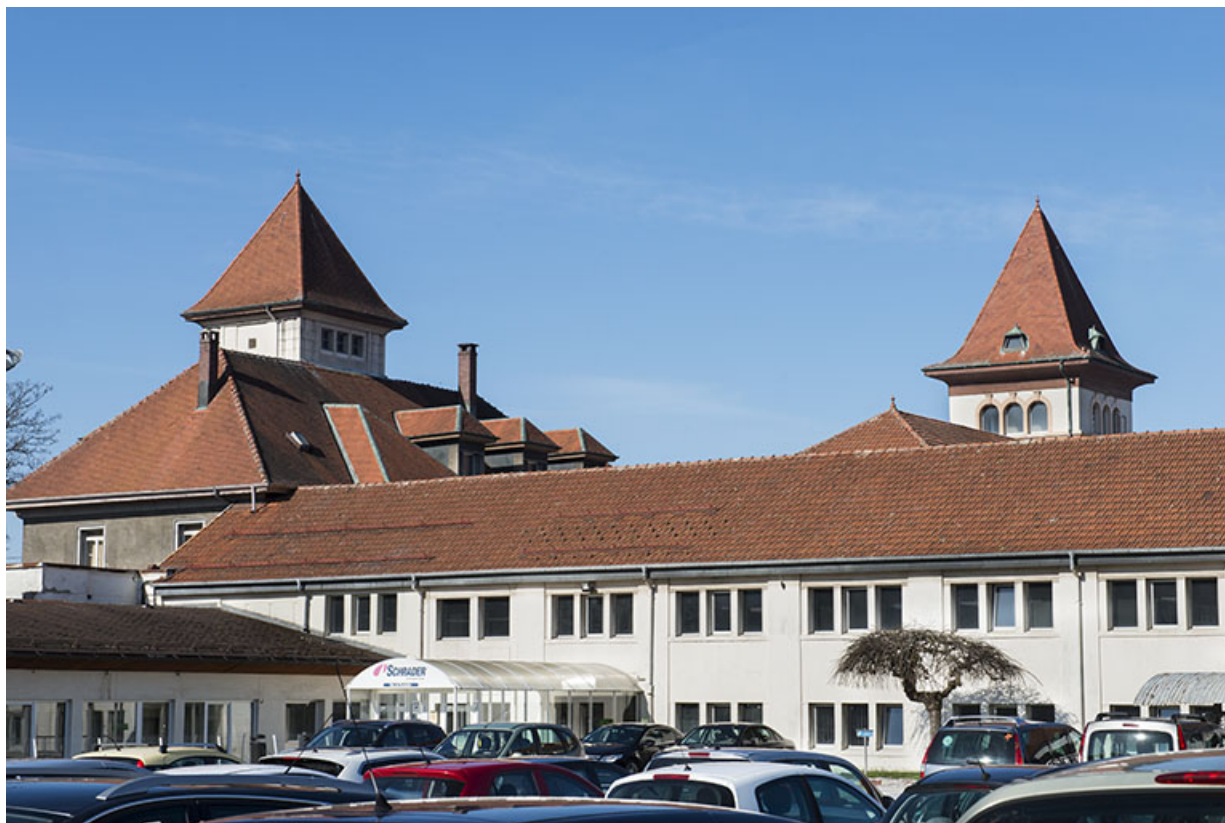
Bâtiments sud : conciergerie, bureaux, vestiaires.