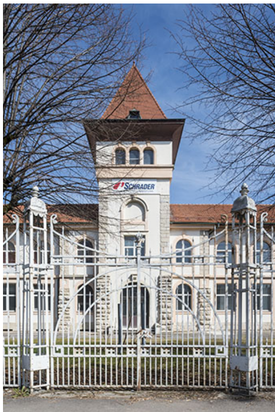
Avant-corps central du bâtiment administratif.