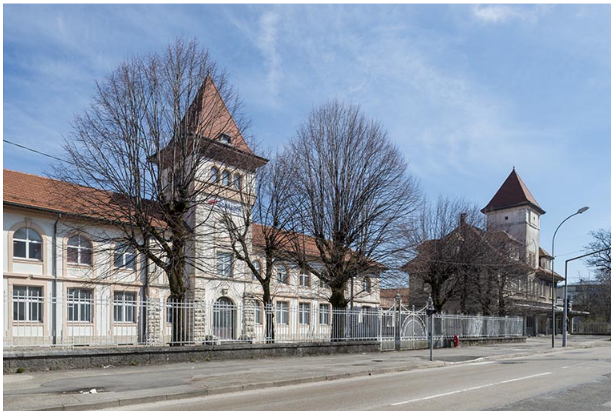
Bâtiments d'entrée depuis la rue de Salins : bureaux, logements et conciergerie.