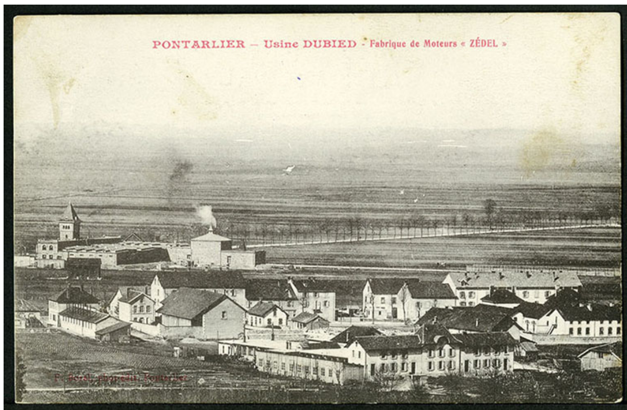
Pontarlier - Usine Dubied - Fabrique de moteurs "Zédel", carte postale, s.d. [début 20e siècle]. 25, Pontarlier, 48 rue de Salins