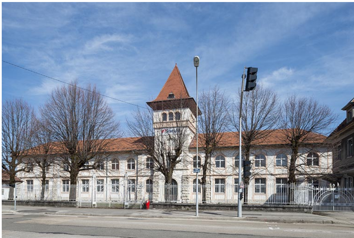
Façade sud du bâtiment administratif.