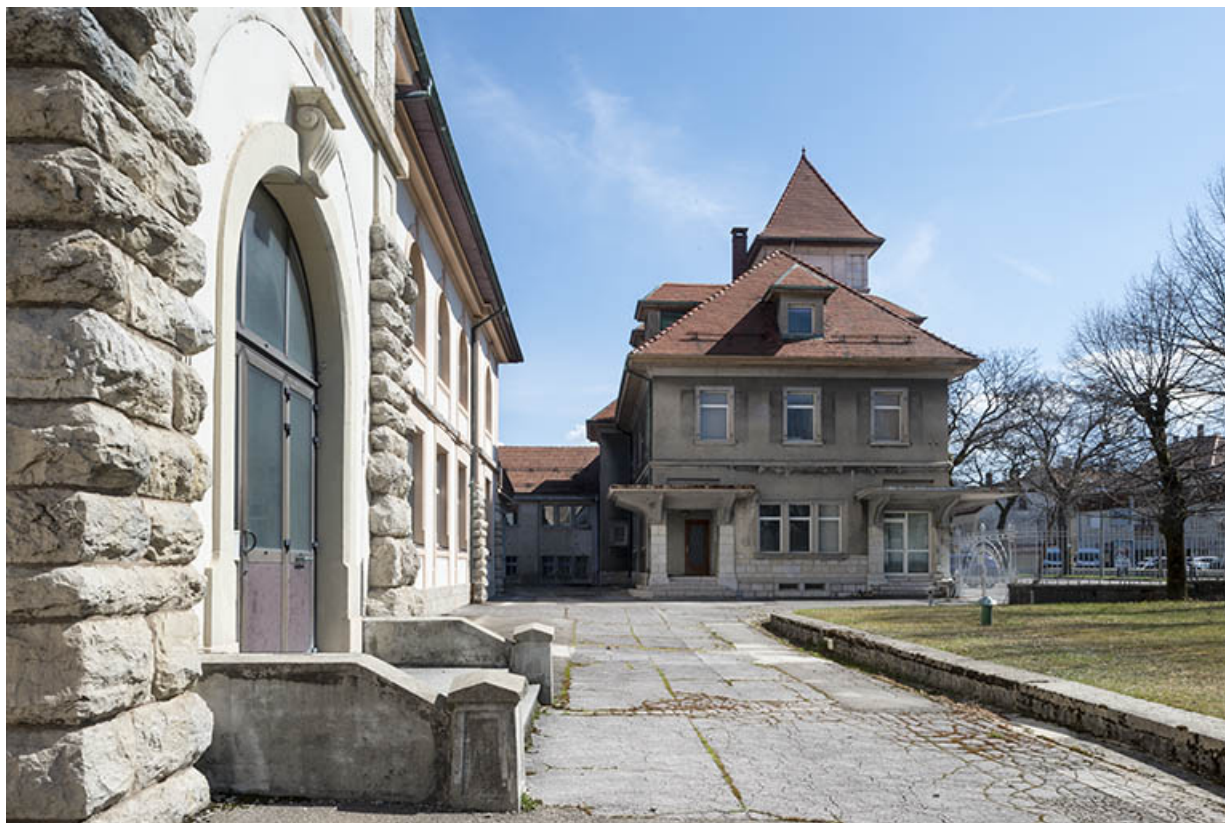
Vue depuis la cour sud. Façade ouest du bâtiment d'entrée (conciergerie, logements). 25, Pontarlier, 48 rue de Salins