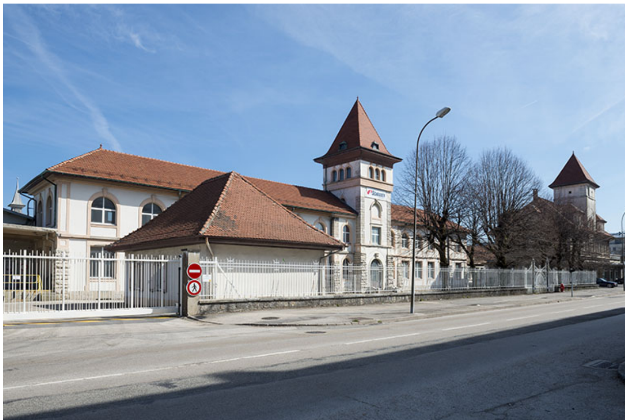
Bâtiments d'entrée, depuis l'ouest.