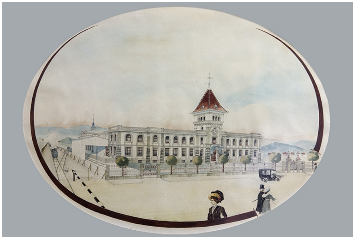
Vue de l'usine, aquarelle, s.d. [début 20e siècle]. 25, Pontarlier, 48 rue de Salins