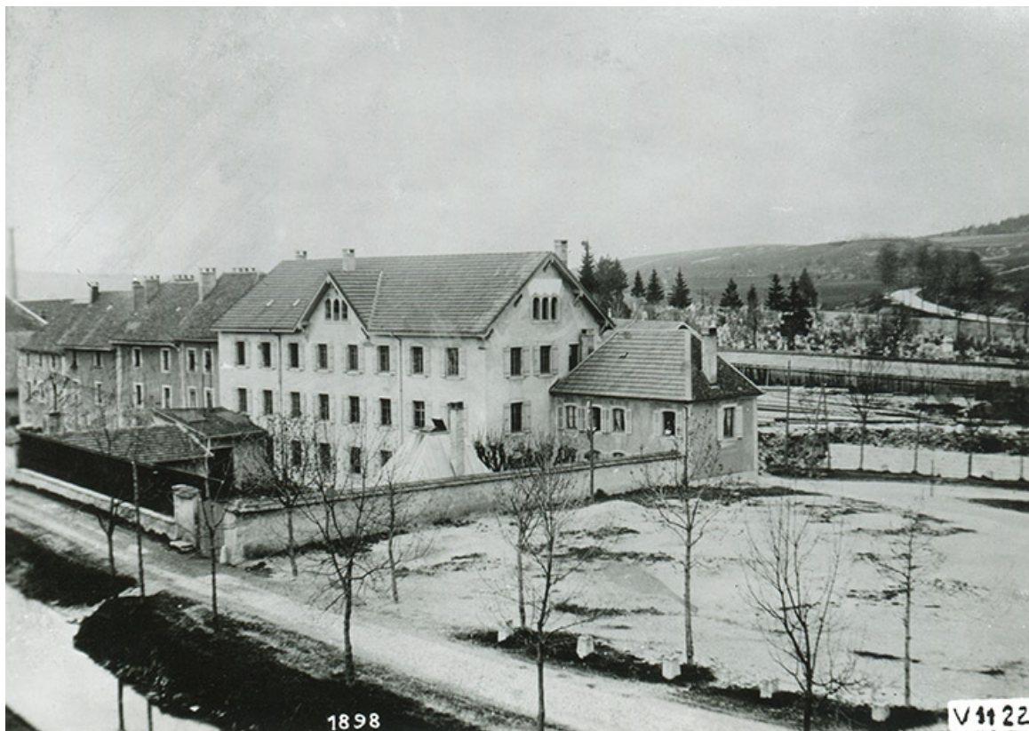
Première usine Dubied à Pontarlier (3 quai du Doubs), fotogr., s.d. [1898 ?]. 25, Pontarlier, 48 rue de Salins