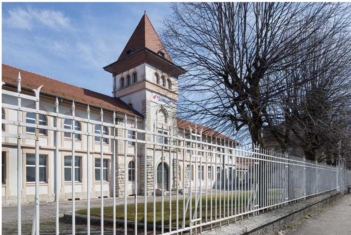
Façade sud du bâtiment administratif, vue de trois quarts gauche. 25, Pontarlier, 48 rue de Salins