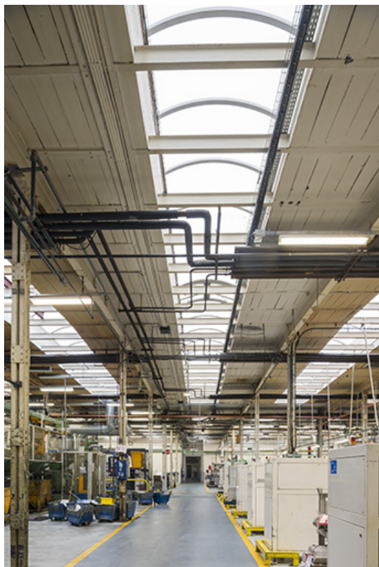
Atelier principal. Eclairage zénithal par travées.