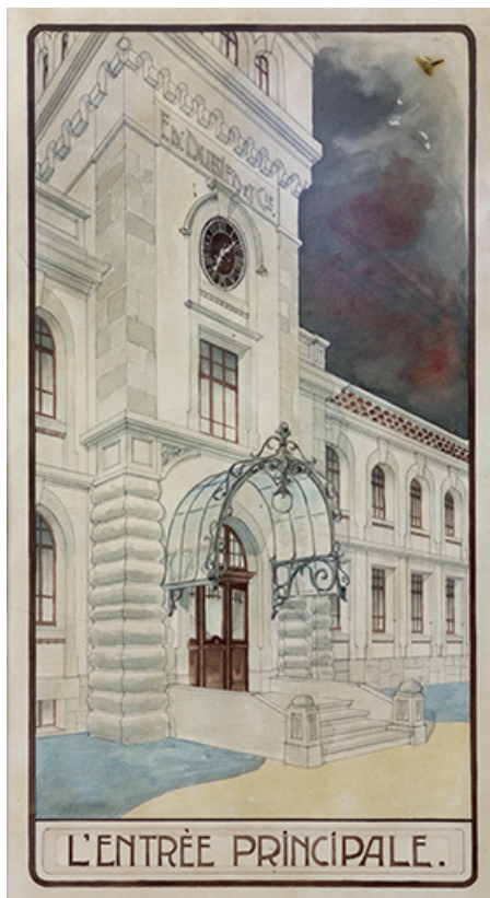
Entrée de l'usine Ed. Dubied et Cie, aquarelle, s.d. [début 20e siècle]. 25, Pontarlier, 48 rue de Salins