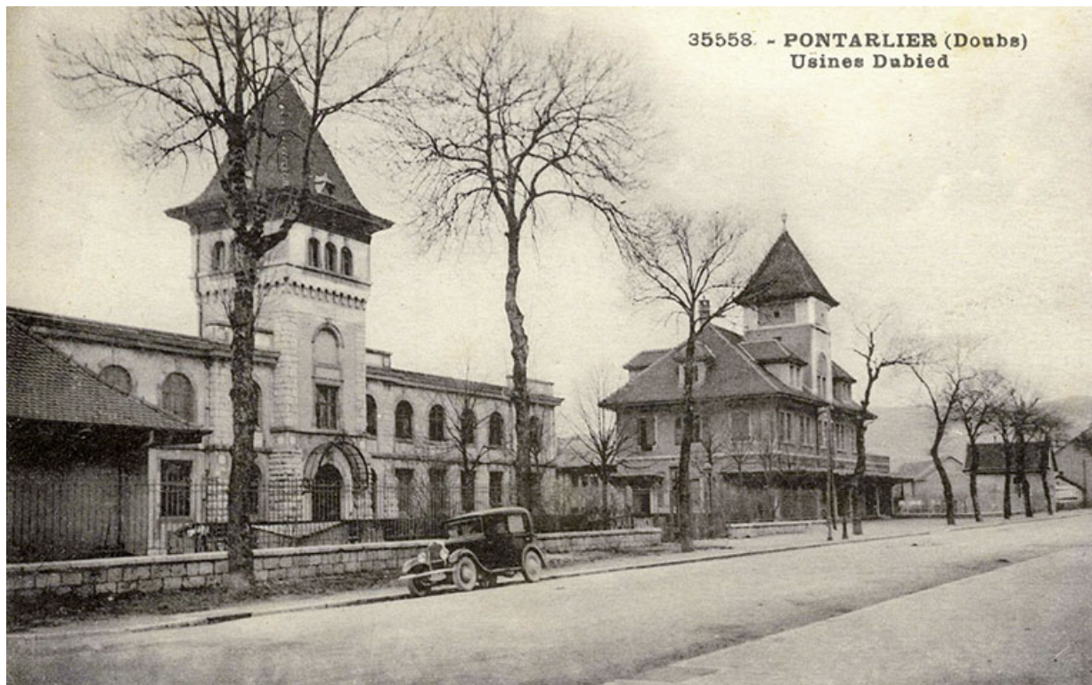
Pontarlier (Doubs). Usines Dubied, carte postale, s.d. [début 20e siècle].