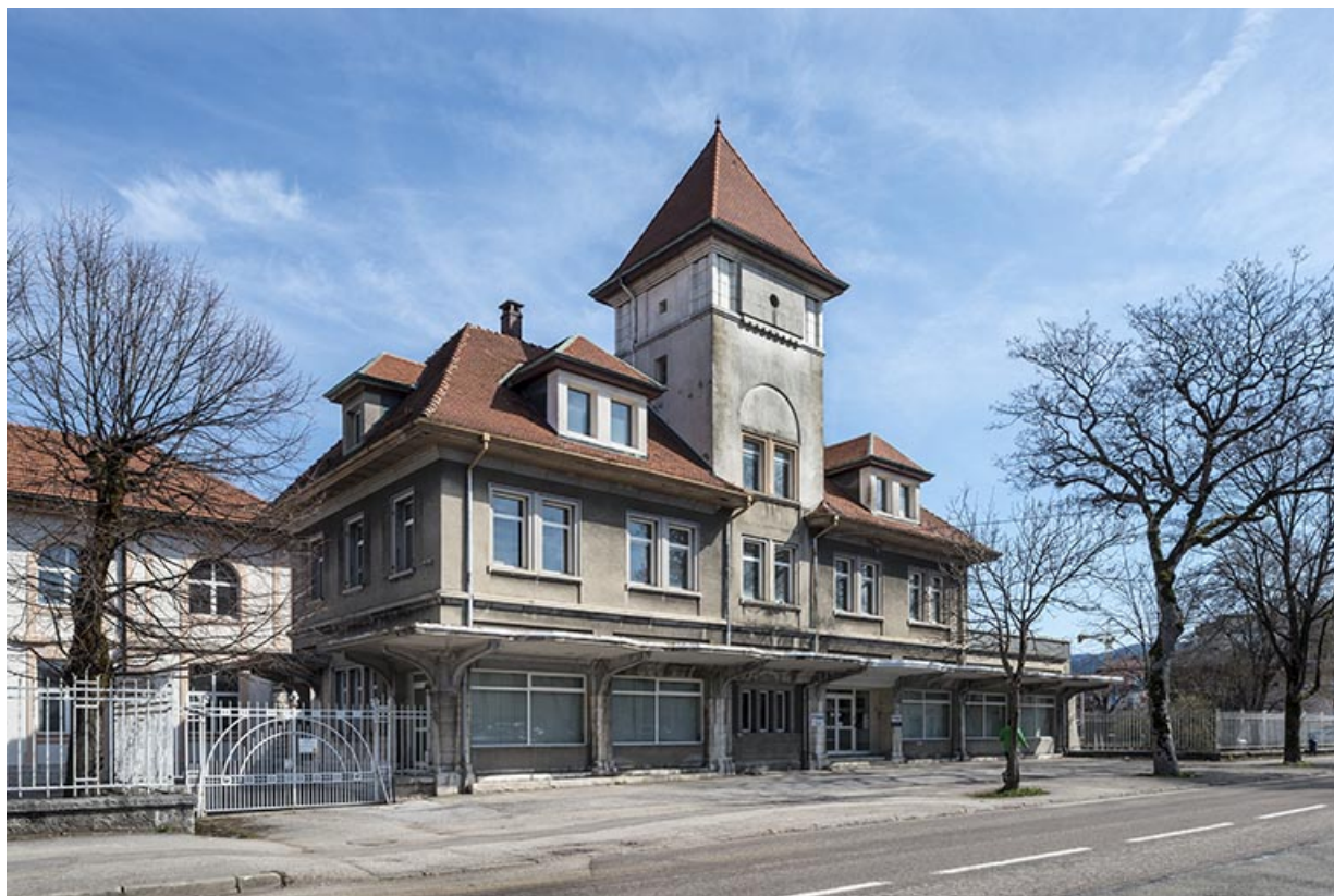
Conciergerie, bureaux et logements. Vue de trois quarts gauche. 25, Pontarlier, 48 rue de Salins