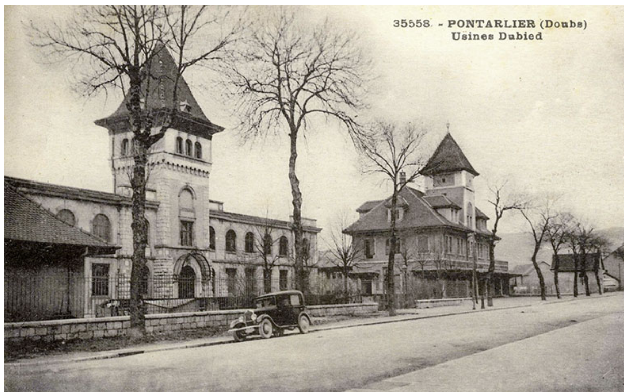
Pontarlier (Doubs). Usines Dubied, carte postale, s.d. [début 20e siècle].