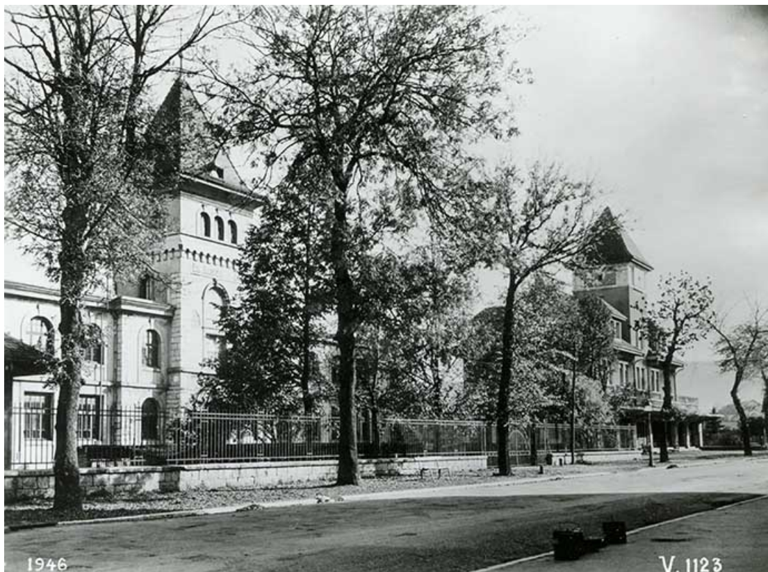
Façades ouest de l'usine, fotogr., s.d. [1946 ?]. 25, Pontarlier, 48 rue de Salins