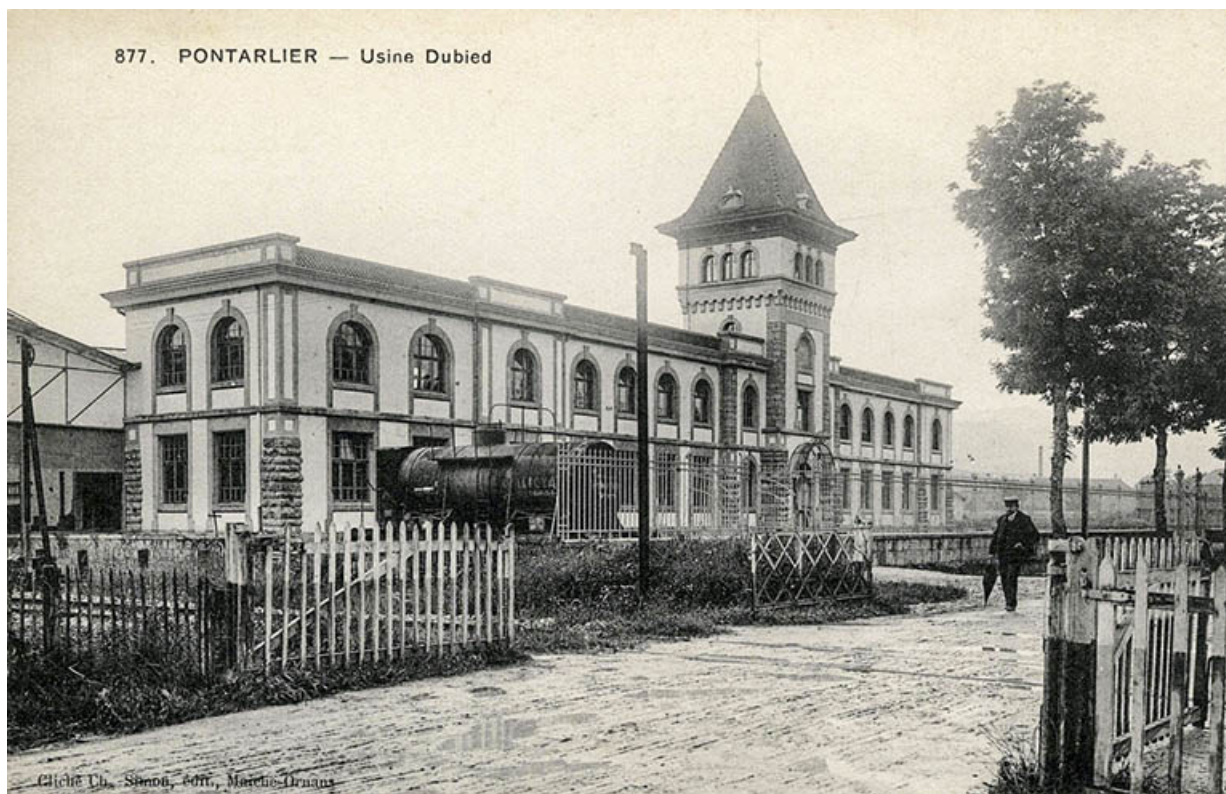
Pontarlier. Usine Dubied, carte postale, s.d. [début 20e siècle]. 25, Pontarlier, 48 rue de Salins