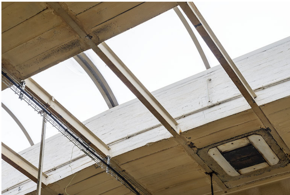
Détail du système d'éclairage zénithal (briques pleines sur ossature métallique). 25, Pontarlier, 48 rue de Salins