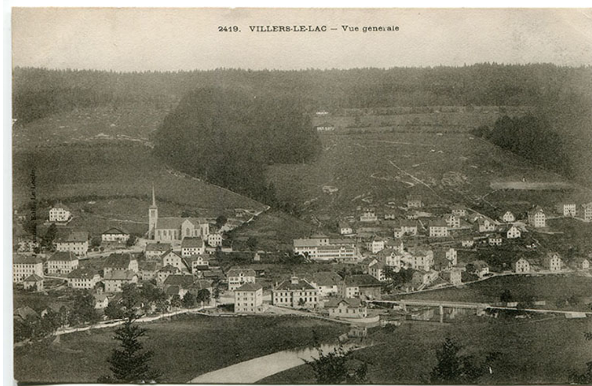
2419. Villers-le-Lac - Vue générale [vue d'ensemble du village depuis le sud-ouest], entre 1898 et 1903. Le bâtiment, à droite, est coiffé d'une terrasse.