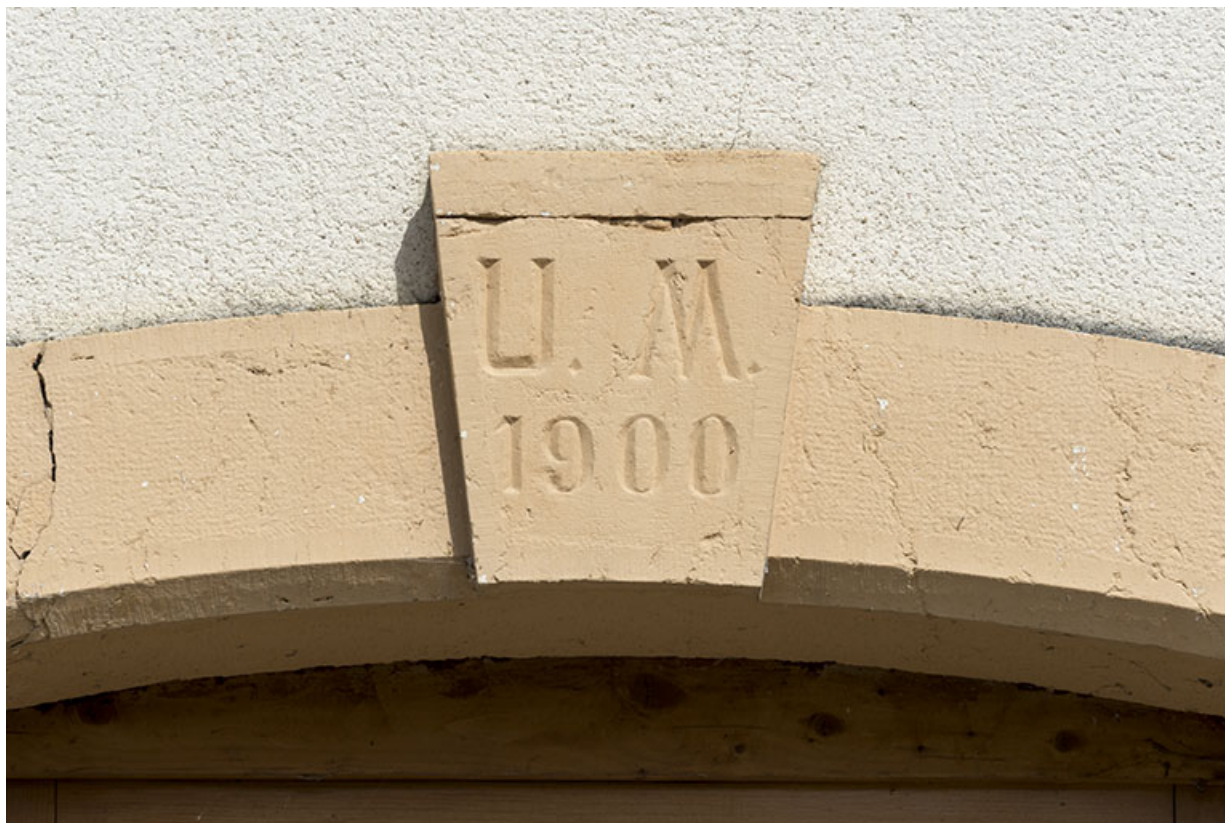
Façade antérieure : date et initiales sur le linteau de la porte.