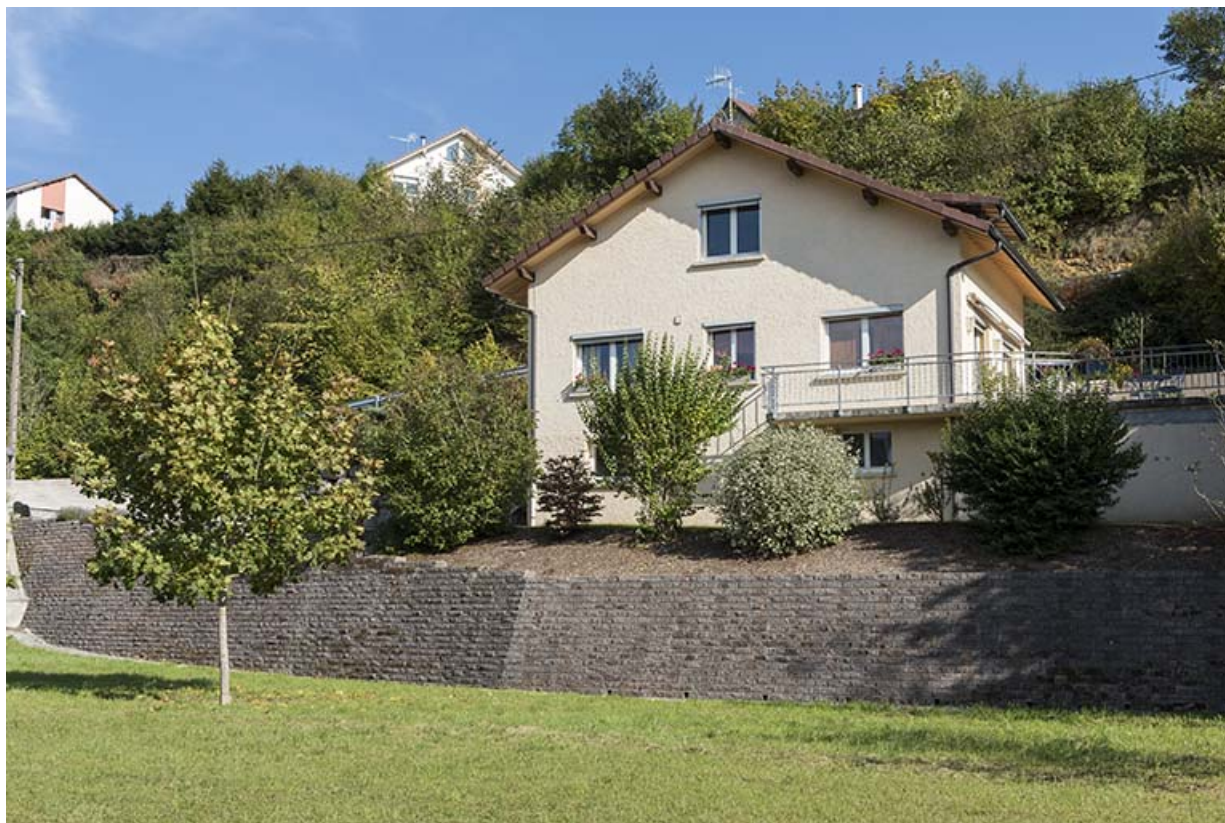
Vue d'ensemble, depuis l'ouest.