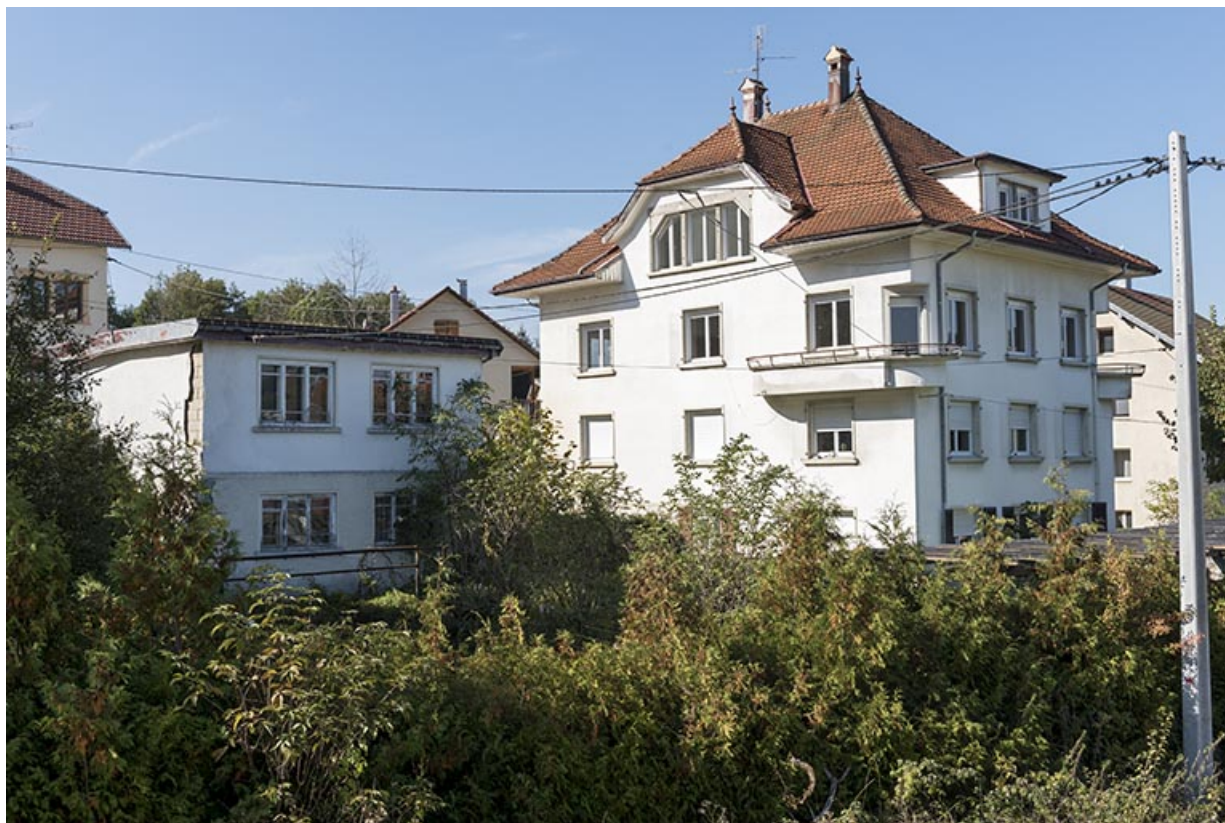
Vue d'ensemble depuis l'est (façades postérieure et latérale droite, et garage).

25, Villers-le-Lac, 17 rue du Col, lieudit : les Bassots