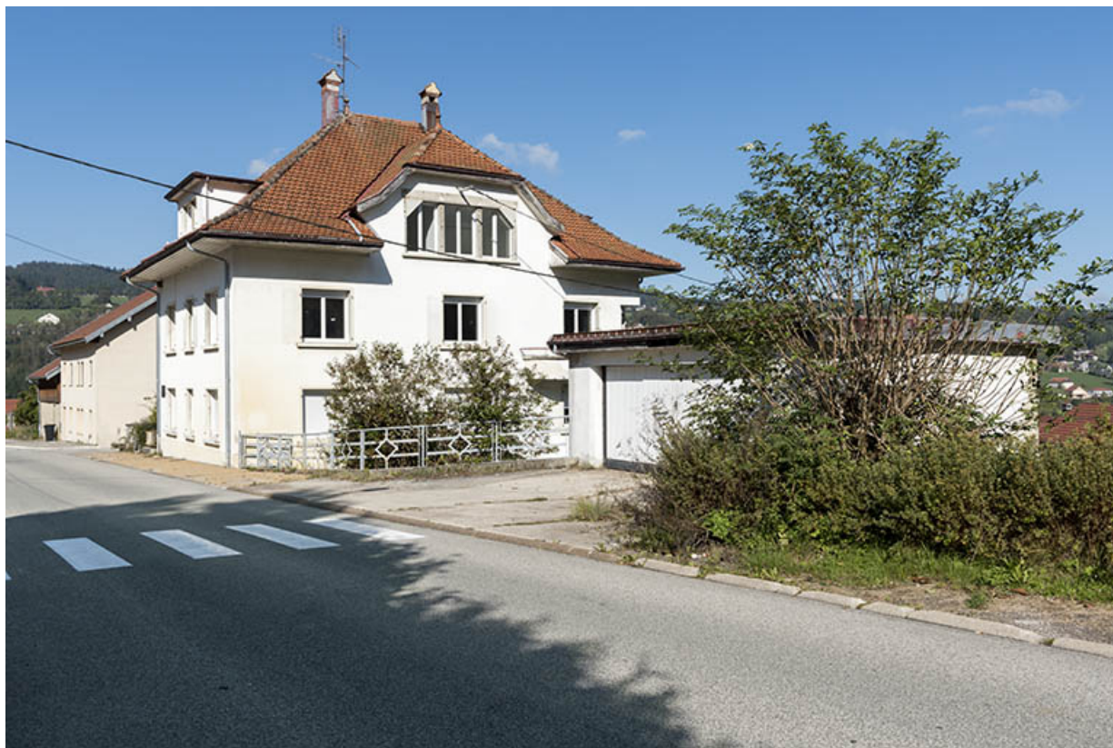
Vue d'ensemble, depuis le sud-est (façade latérale droite et garage).

25, Villers-le-Lac, 17 rue du Col, lieudit : les Bassots