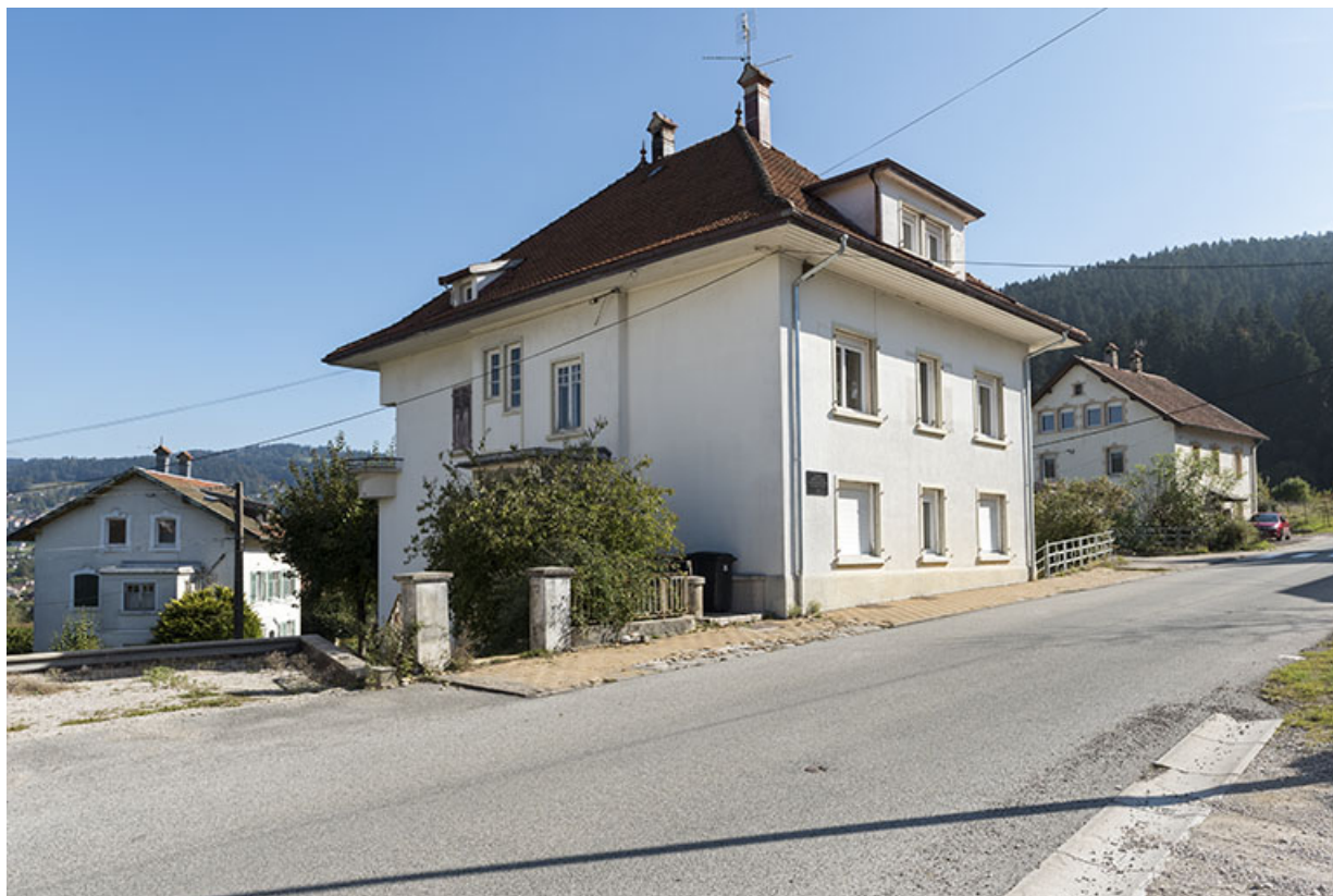
Vue d'ensemble, depuis le nord-ouest (façades antérieure et latérale gauche). 25, Villers-le-Lac, 17 rue du Col, lieudit : les Bassots