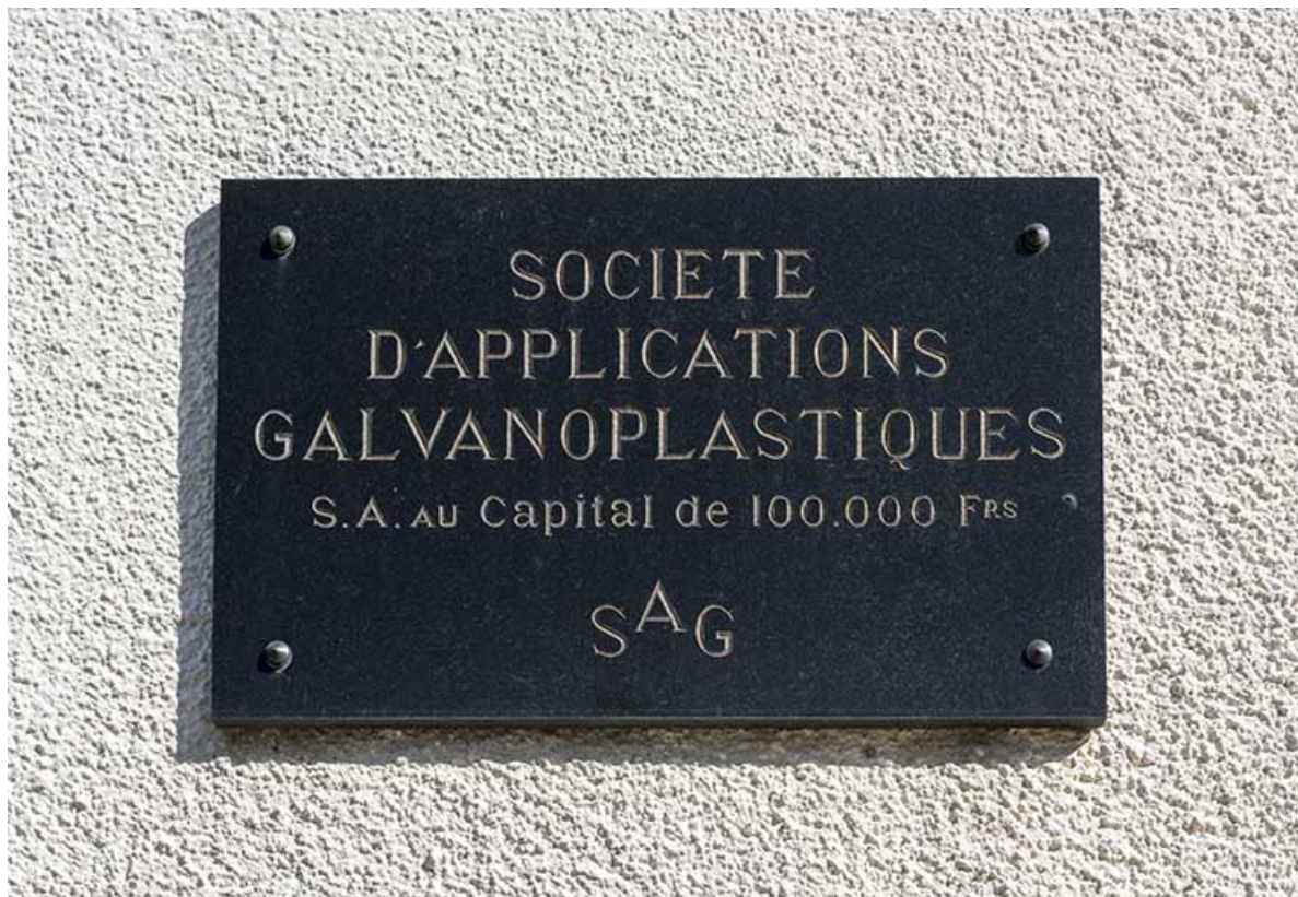
Plaque professionnelle de la Société d'Applications galvanoplastiques.

25, Villers-le-Lac, 17 rue du Col, lieudit : les Bassots