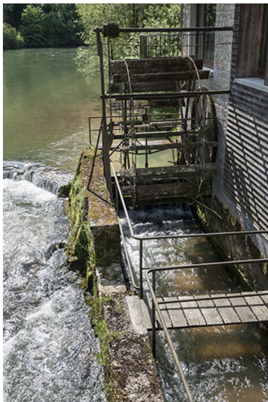
La roue hydraulique suspendue, depuis l'aval.

25, Chenecey-Buillon, 4 chemin du Moulin