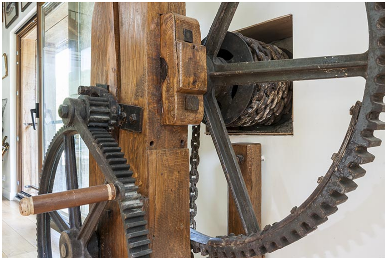
Détail du mécanisme. Manivelle, engrenages et chaîne. 25, Chenecey-Buillon, 4 chemin du Moulin