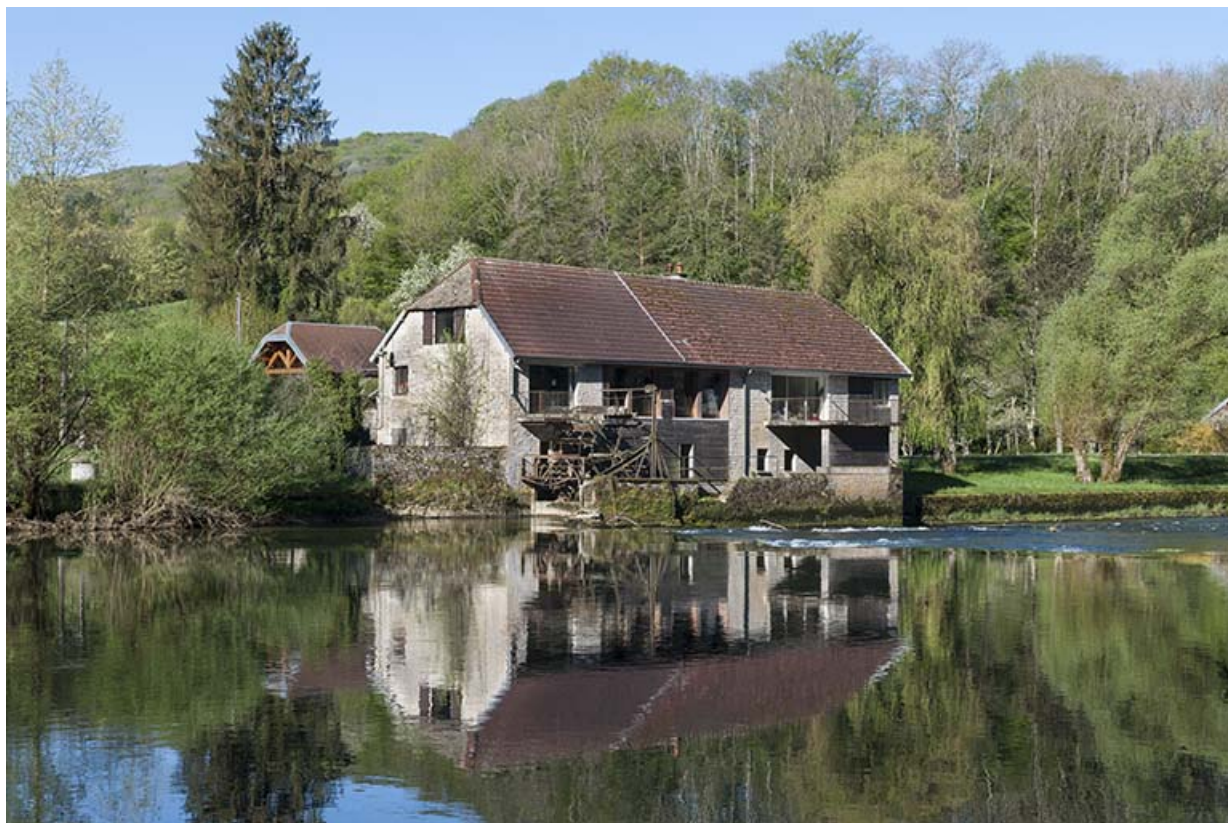
Vue de trois quarts depuis la rive droite.

25, Chenecey-Buillon, 4 chemin du Moulin