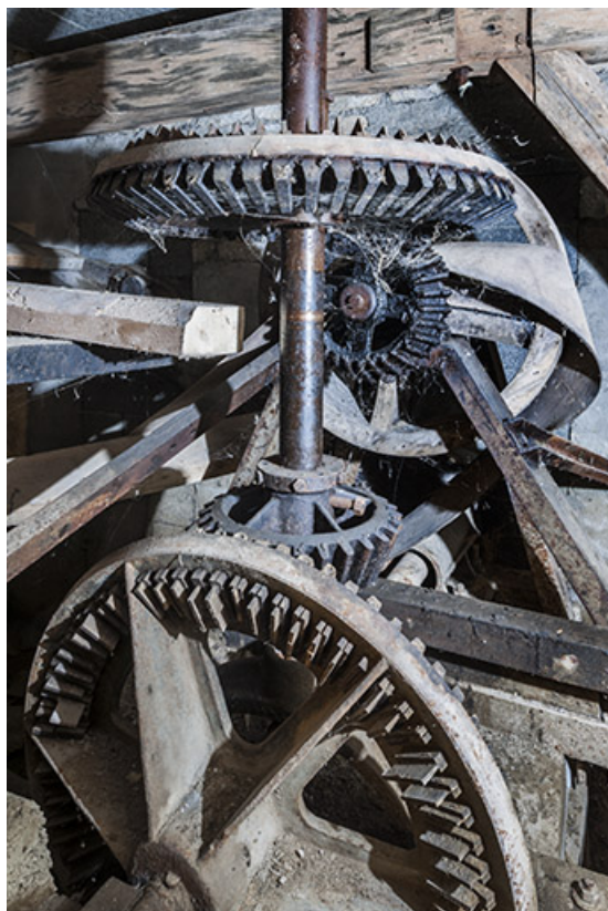
Rez-de-chaussée. Mécanisme de transmission par roues engrenées.

25, Chenecey-Buillon, 4 chemin du Moulin