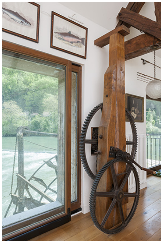
Etage du moulin. Mécanisme de levage de la roue hydraulique.

25, Chenecey-Buillon, 4 chemin du Moulin