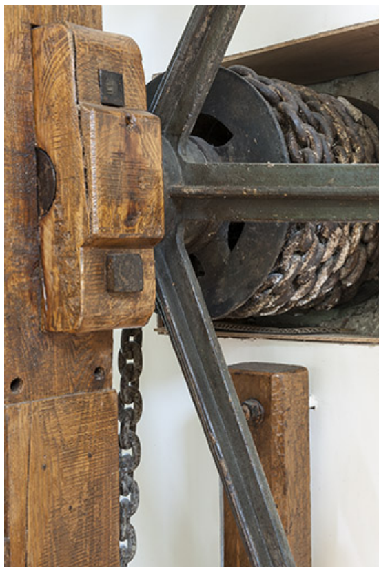
Mécanisme de levage. Détail du tambour d'enroulement de la chaîne.

25, Chenecey-Buillon, 4 chemin du Moulin