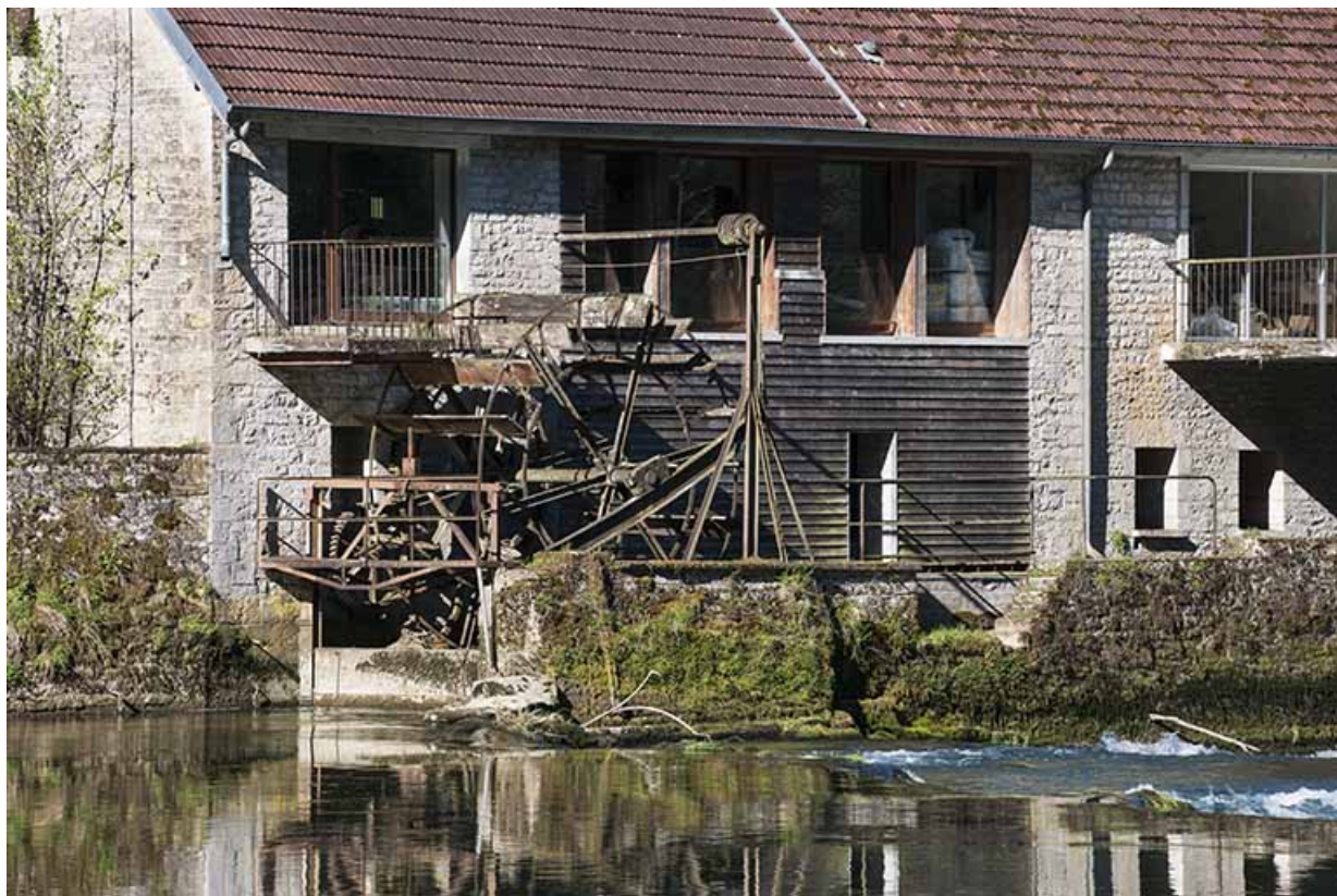
La roue suspendue vue de trois quarts. 25, Chenecey-Buillon, 4 chemin du Moulin