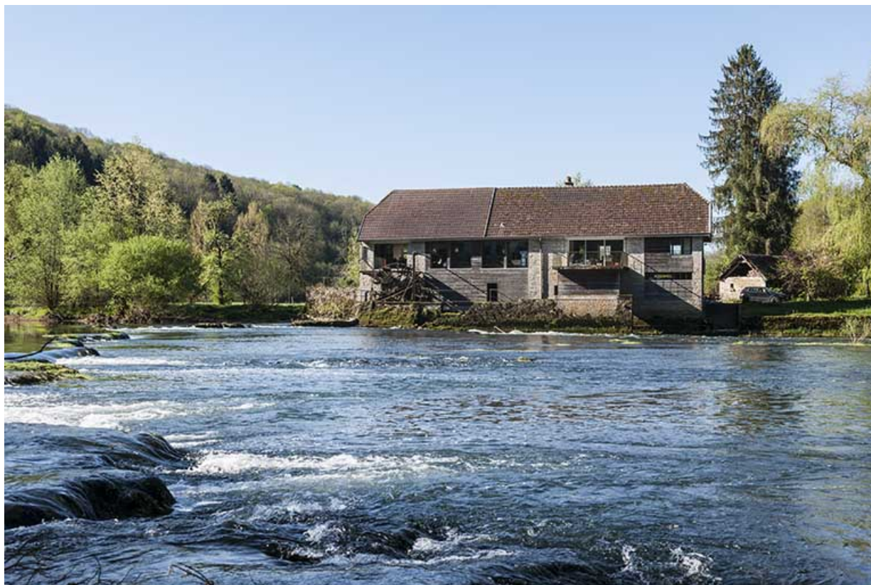
Façade nord du moulin, depuis la rive droite. 25, Chenecey-Buillon, 4 chemin du Moulin