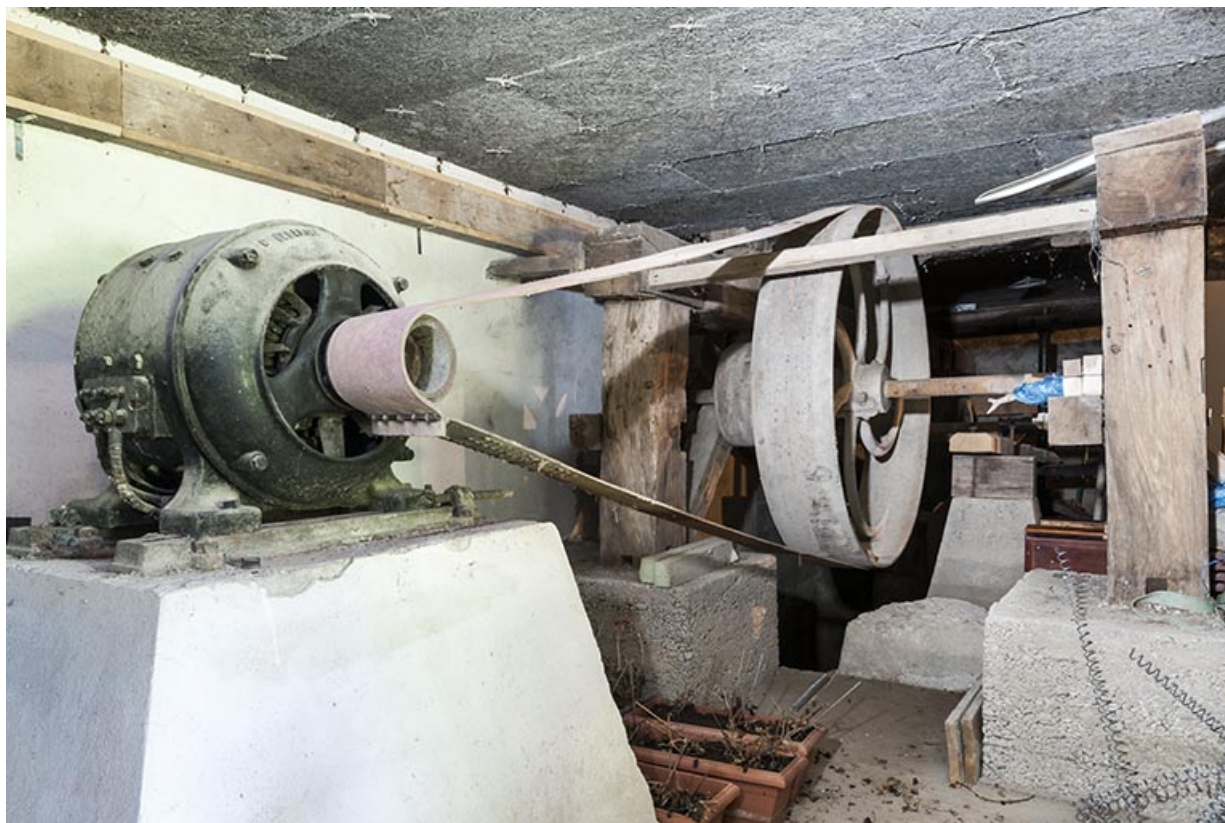
Rez-de-chaussée. Moteur auxiliaire électrique. 25, Chenecey-Buillon, 4 chemin du Moulin