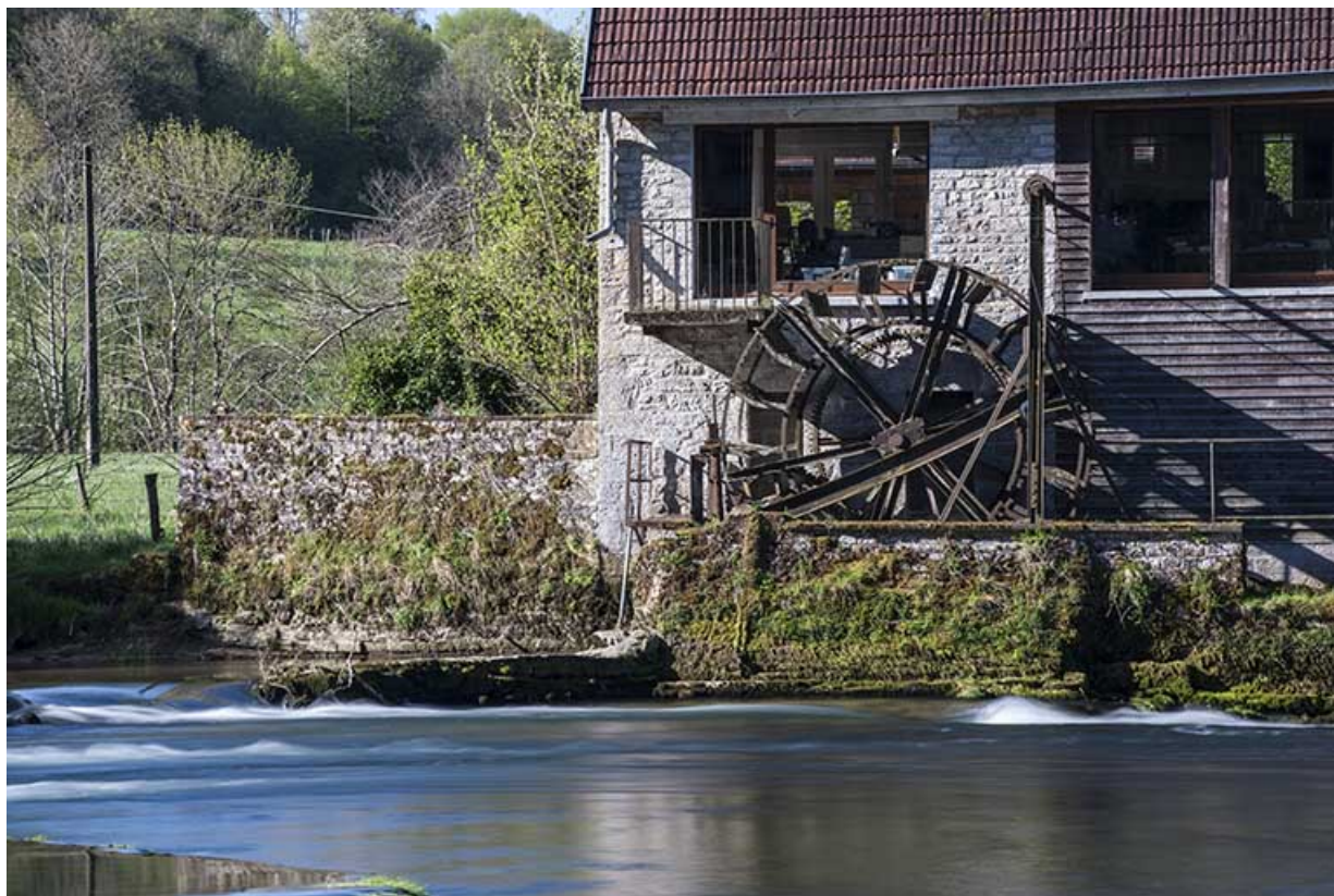
Roue suspendue amont, depuis la rive droite. 25, Chenecey-Buillon, 4 chemin du Moulin