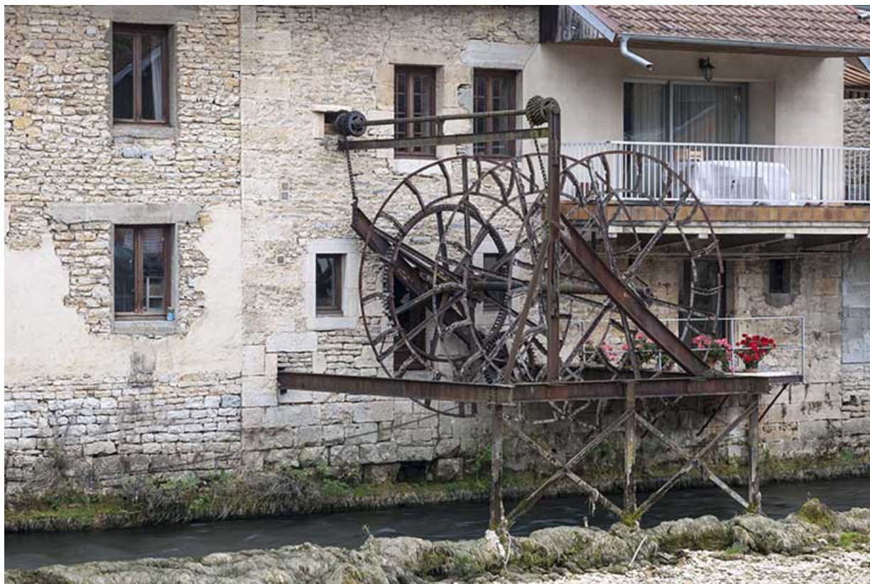
Façade sur la Loue. Roue pendante vue de trois quarts.