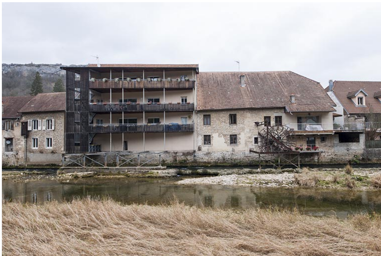
Façade sur la Loue depuis la rive gauche.