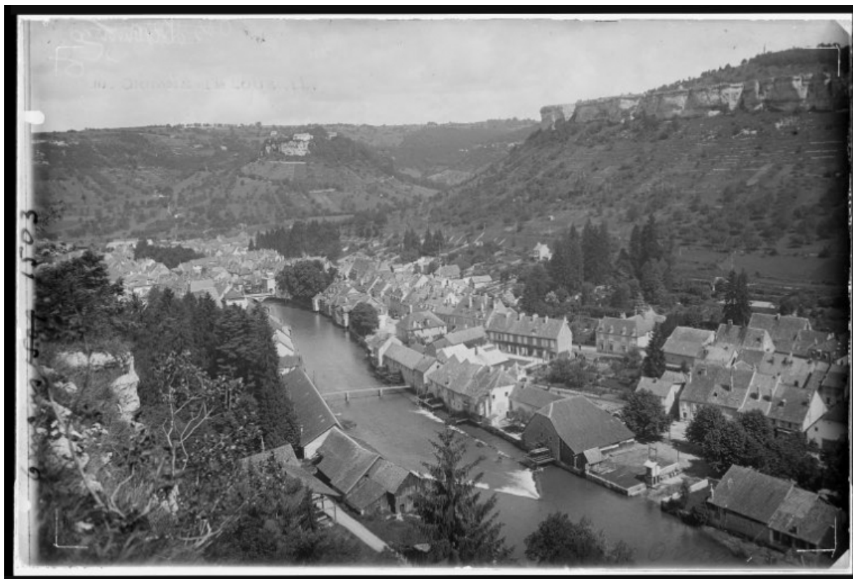
[Vue aérienne depuis le sud], s.d. [vers 1930]. 25, Ornans, 16 rue Jacques Gervais