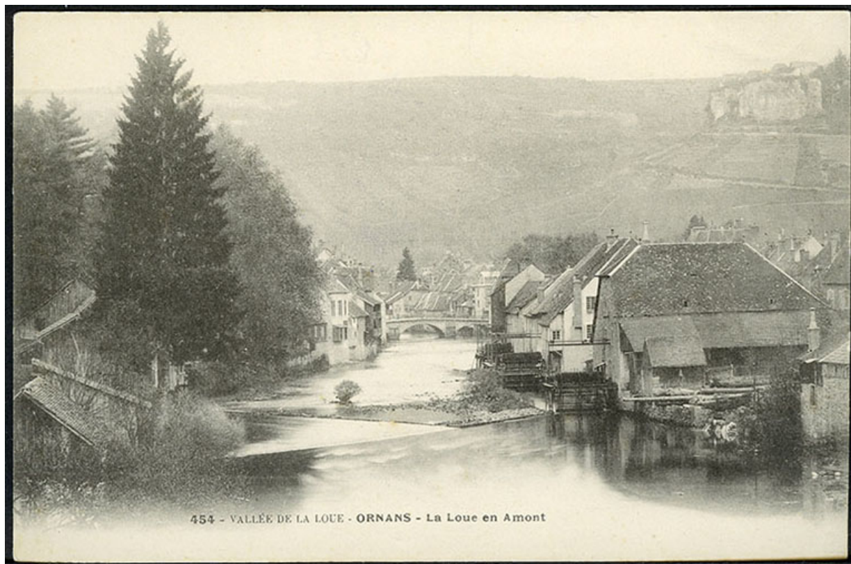
Vallée de la Loue - Ornans - La Loue en amont, carte postale, s.d. [fin 19e ou début 20e siècle].