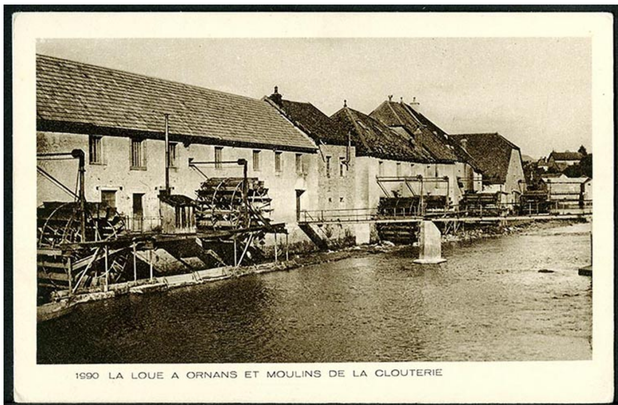
La Loue à Ornans et moulins de la clouterie, carte postale, s.d. [début 20e siècle].