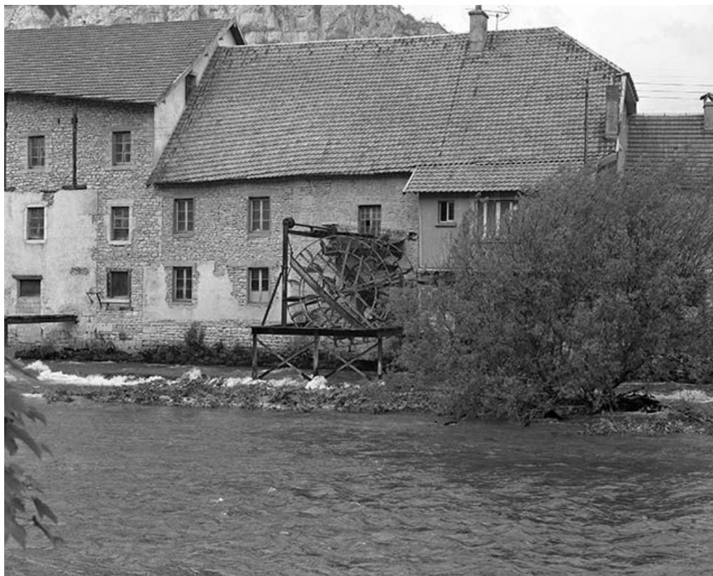
Moulin (AH 81, 82) 16 à 20 rue Jacques-Gervais : vue rapprochée. 25, Ornans