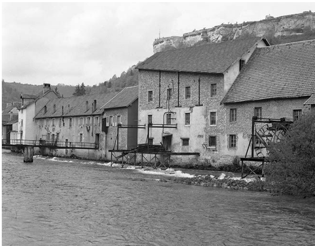
Moulin (AH 81, 82) 16 à 20 rue Jacques-Gervais : vue générale. 25, Ornans