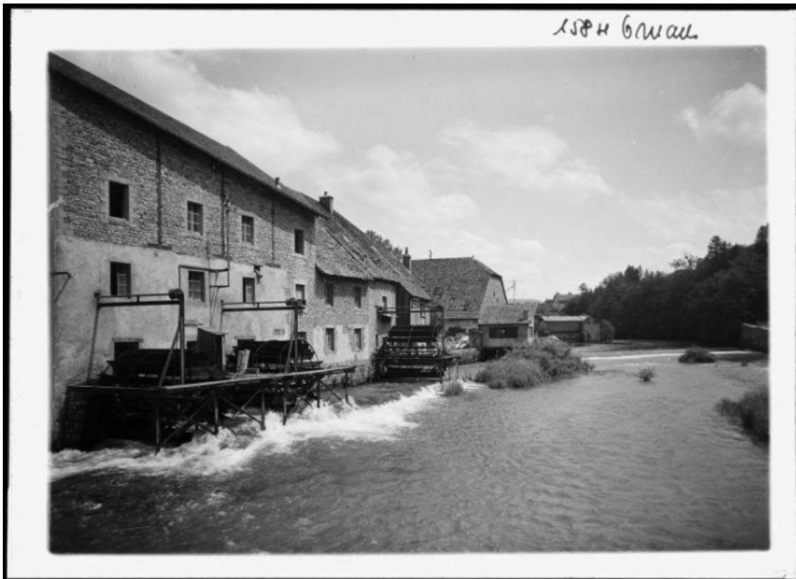
[Vue depuis l'aval], s.d. [vers 1930]. 25, Ornans, 16 rue Jacques Gervais