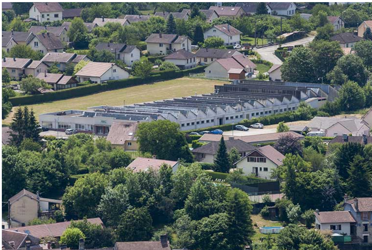
Vue plongeante depuis le nord-ouest.