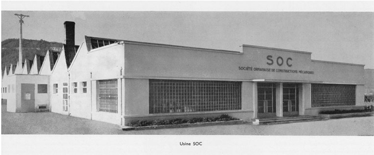
Usine SOC, fotogr., s.d. [vers 1954].