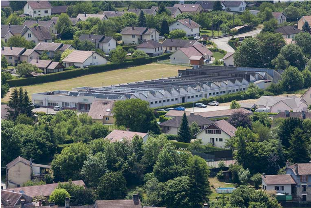
Vue plongeante depuis le nord-ouest.