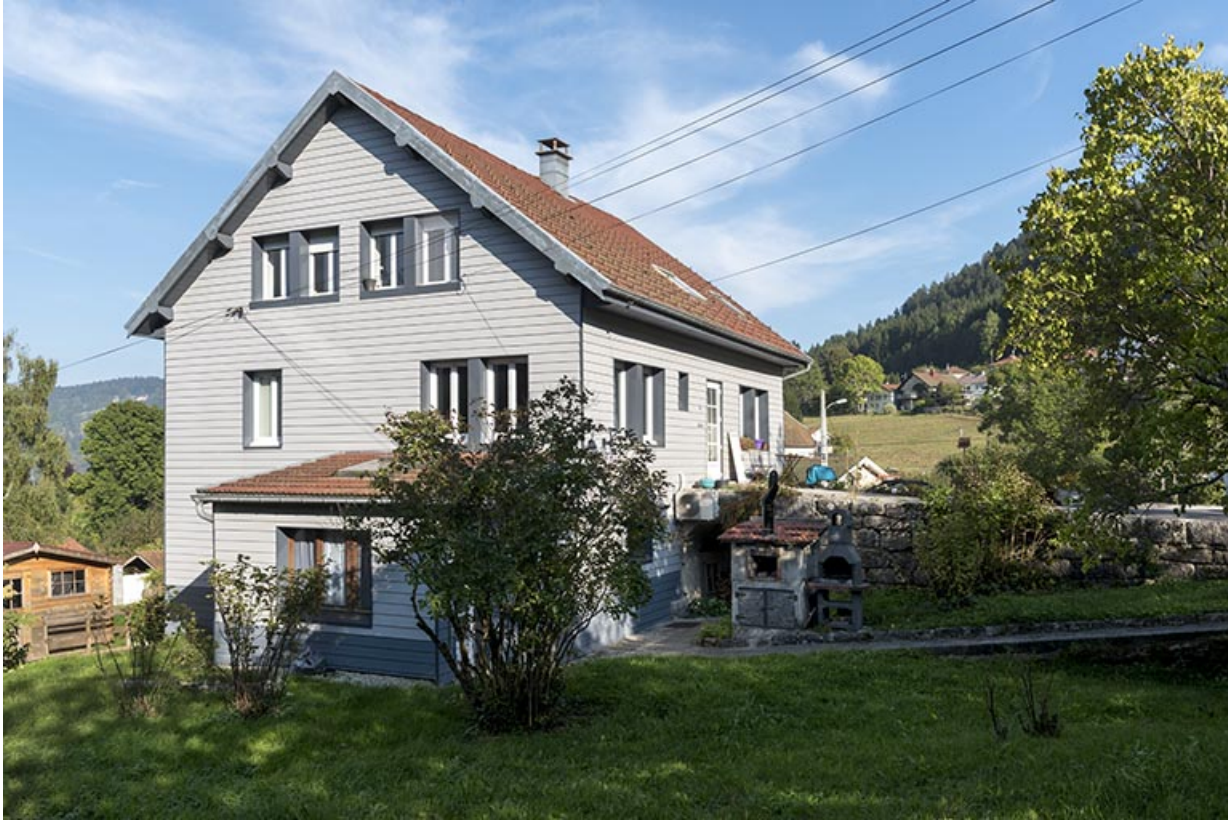
Façades antérieure et latérale gauche.

25, Villers-le-Lac, 13 rue du Temple, lieudit : les Bassots