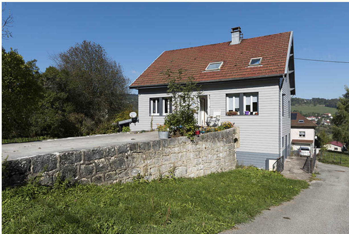
Façade antérieure, de trois quarts droite.

25, Villers-le-Lac, 13 rue du Temple, lieudit : les Bassots