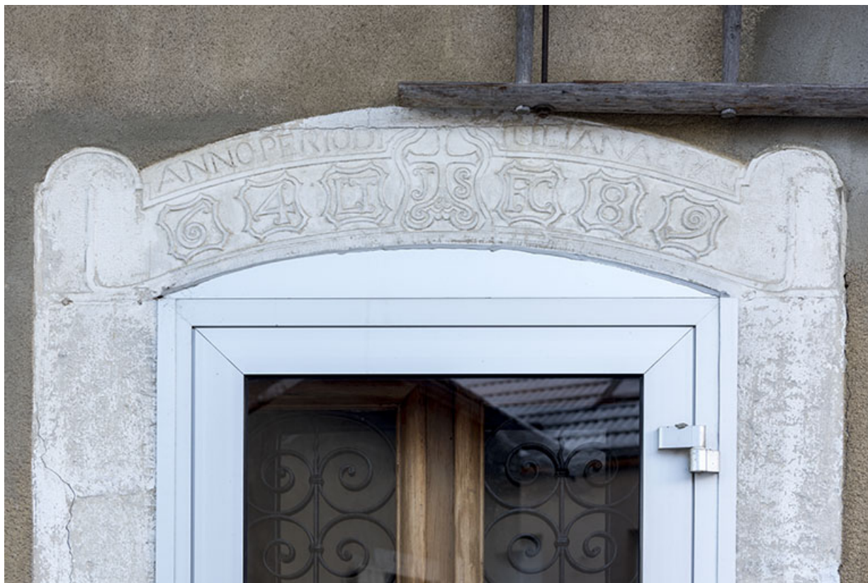
Façade antérieure : linteau avec inscription et datation.

25, Villers-le-Lac, 21 rue du Temple, lieudit : les Bassots