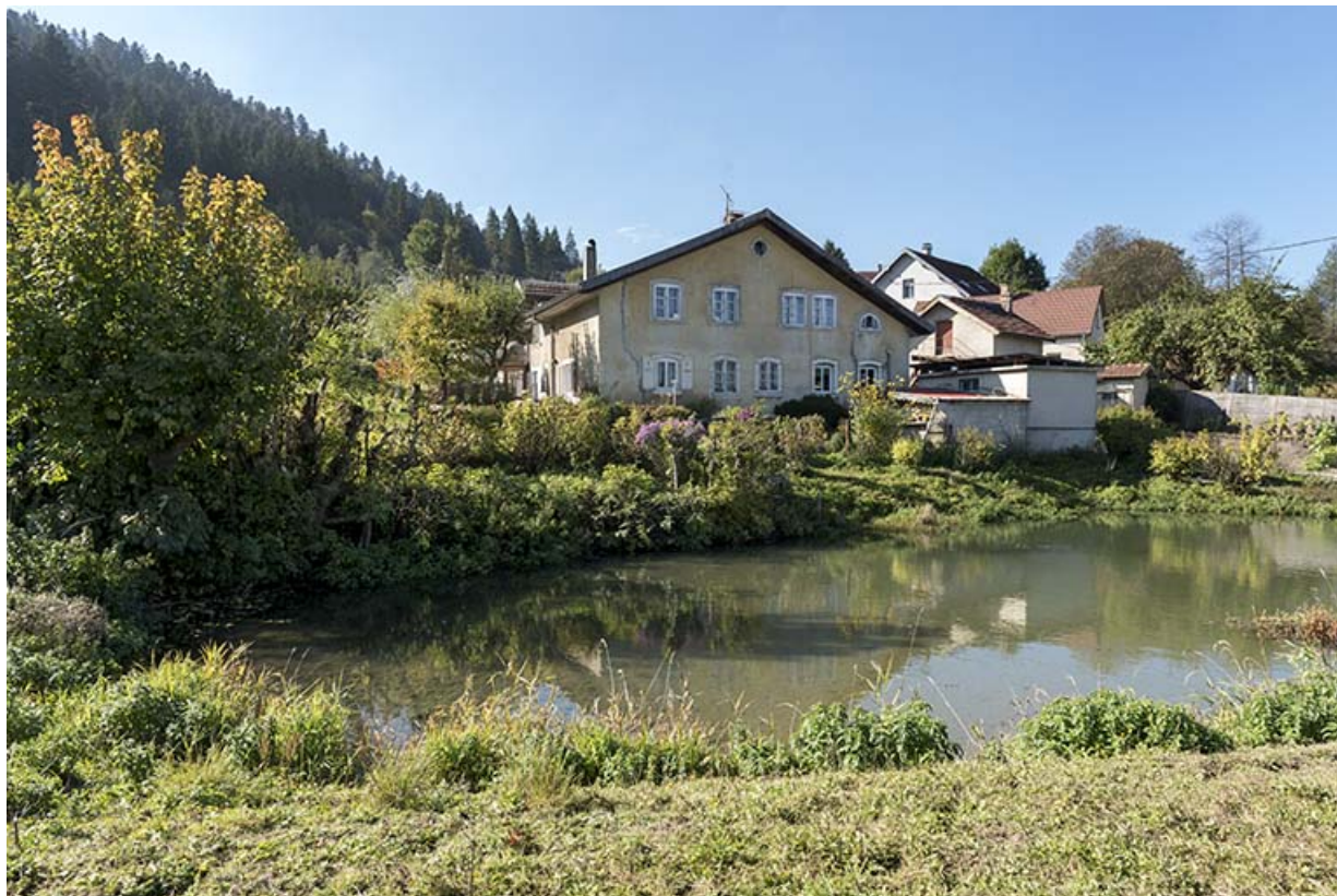
Vue d'ensemble, depuis le nord-est (façade latérale gauche).

25, Villers-le-Lac, 21 rue du Temple, lieudit : les Bassots