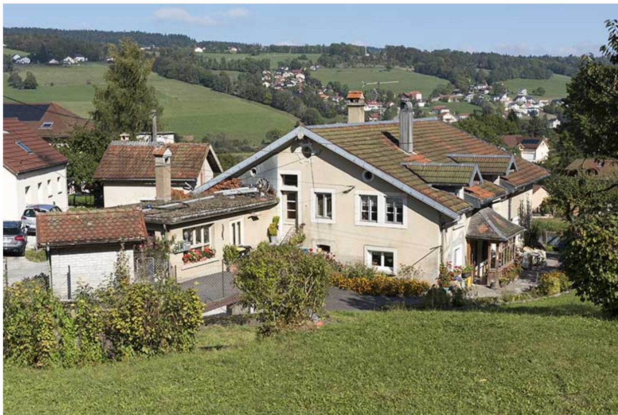
Vue d'ensemble, depuis le sud-est (façades antérieure et latérale droite).

25, Villers-le-Lac, 21 rue du Temple, lieudit : les Bassots