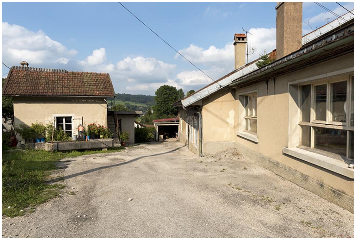
Façade antérieure vue en enfilade, avec la buanderie et la fontaine à gauche. 25, Villers-le-Lac, 21 rue du Temple, lieudit : les Bassots